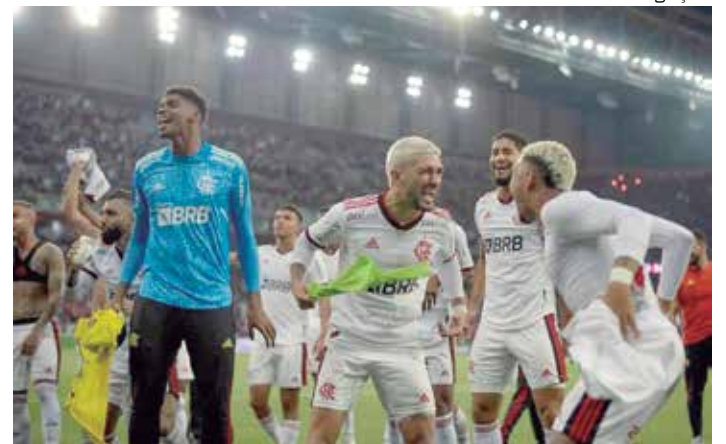
Fla cumpre segunda meta esportiva e supera valor milionário no ano

As metas têm impacto direto nas finanças do clube, que projetou receitas em 2022 na casa de R$ 847 milhões. Além da premiação distribuída pela CBF, com a classificação, o clube garante mais um jogo com arquibancada cheia no Maracanã.