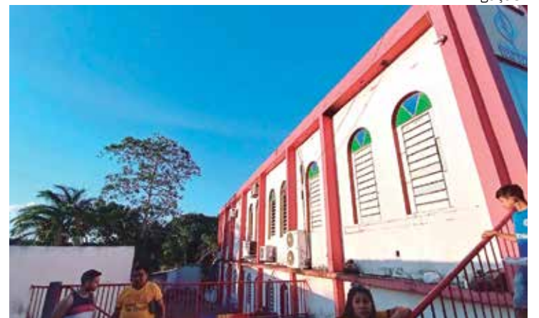
Membros de igreja iniciaram vaquinha para construção de cobertura de igreja

Quem quiser conhecer melhor o trabalho desenvolvido pela igreja, pode seguir o perfil @congregacao08_area71.