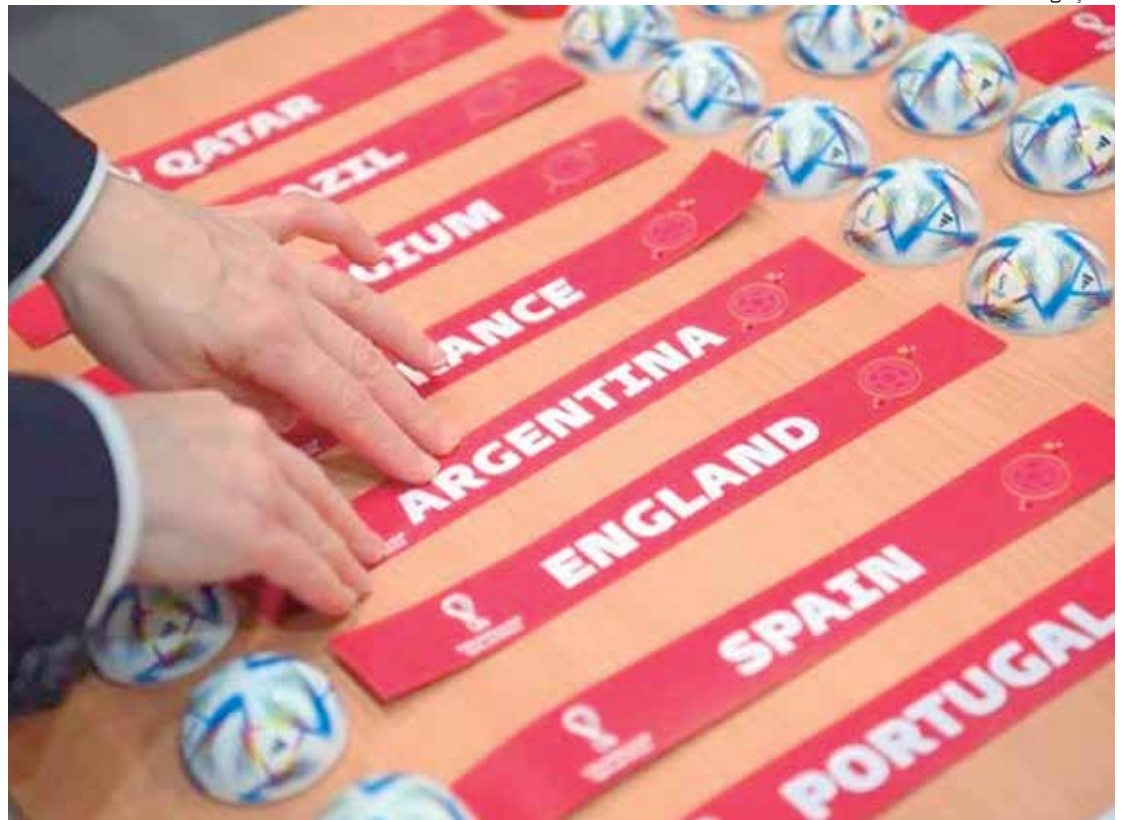
Federação Internacional de Futebol vende 2,45 milhões de ingressos para Copa do Mundo no Catar

Será a primeira Copa do Mundo sediada no Oriente Médio, tendo sido adiada para o final do ano, no lugar de sua ocorrência normal entre junho e julho, para evitar o forte calor do verão na região.