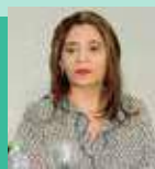
Nair Bair Agir

Até o fechamento desta edição, a assessoria não enviou a agenda do candidato.