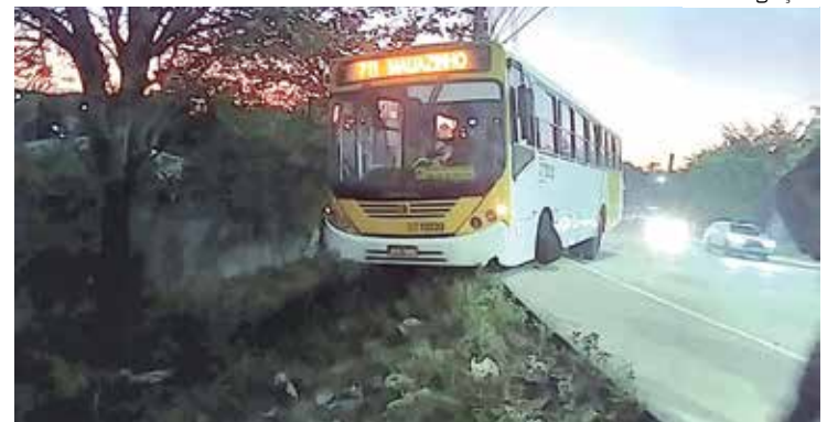
Barra de direção quebra e ônibus quase despence de barranco em Manaus

Agentes do Serviço Móvel de Atendimento de Urgência (Samu) foram acionados para prestar socorro à criança. O condutor do veículo permaneceu no local e prestou assistência ao garoto.