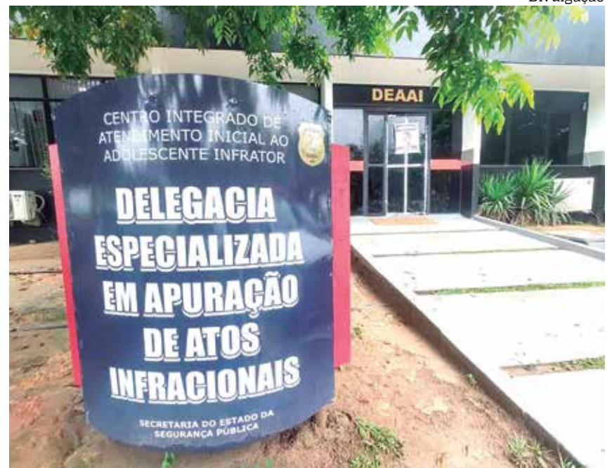
A adolescente foi encaminhado a Delegacia de Apuração de Atos Infracionais

Ainda conforme a Polícia Civil, o adolescente já teria passagem pela Deaai por um crime semelhante, que aconteceu em abril deste ano.