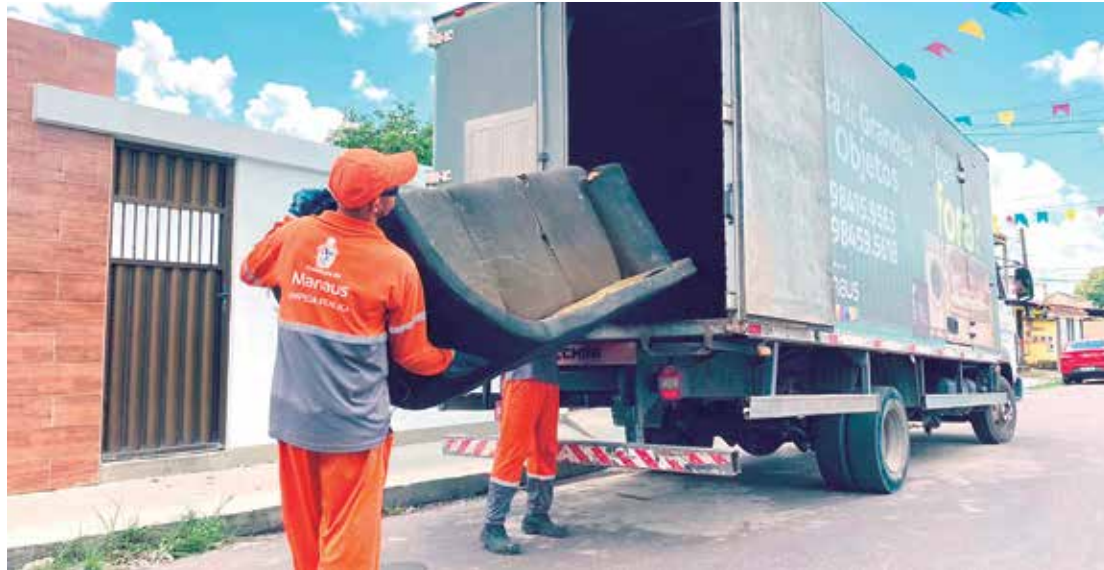
Prefeitura realiza a coleta de materiais de grande porte como sofá, camas, geladeiras por serviço de coleta agendada