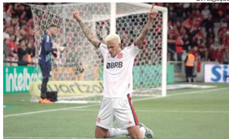
Pedro fez gol de bicicleta no jogo que classificou o Fla na Copa do Brasil

Agora, o Flamengo viaja para São Paulo, onde enfrentará o Palmeiras. A partida da 23ª rodada do Brasileirão será neste domingo, no Allianz Parque, às 16h.