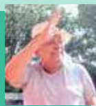
Amazonino Mendes Cidadania

10h - Reunião com o comando de campanha 15h - Gravação de programa eleitoral