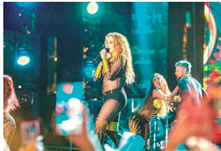
Primeiro lançamento deste álbum audiovisual está no ar no YouTube