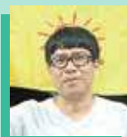
Dr. Israel Tuyuka Psol

09h - 09h - Visita a apoiadores e lideranças no município de Manacapuru