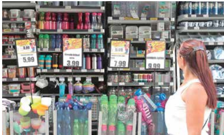
Consumo das famílias de menor renda passou a ser positiva neste mês

A pesquisa nacional de Intenção de Consumo das Famílias (ICF) de agosto, divulgada na quinta-feira (18) pela Confederação Nacional do Comércio de Bens, Serviços e Turismo (CNC), mostrou continuidade do processo de crescimento iniciado em janeiro, somando 82,1 pontos. É o maior nível desde abril de 2020 (95,6 pontos) e superou os resultados do mesmo mês nos 2 anos anteriores. O avanço de 1,1% do indicador no mês foi puxado pelo maior