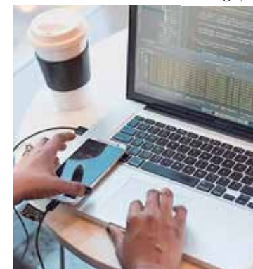
Inscrições estão abertas ao público em geral de Manaus