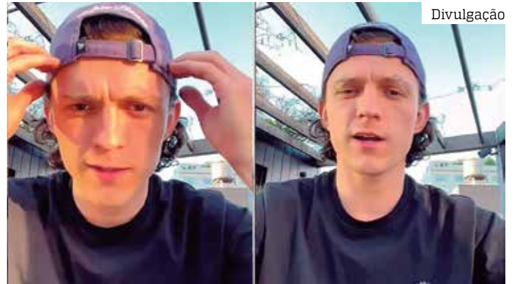
Motivos estão as cobranças exaustivas de seus fãs e as ameaças

A cantora, pouco antes da pandemia de coronavírus disse que estava passando pelo “pior estado mental de todos os tempos”. Depois