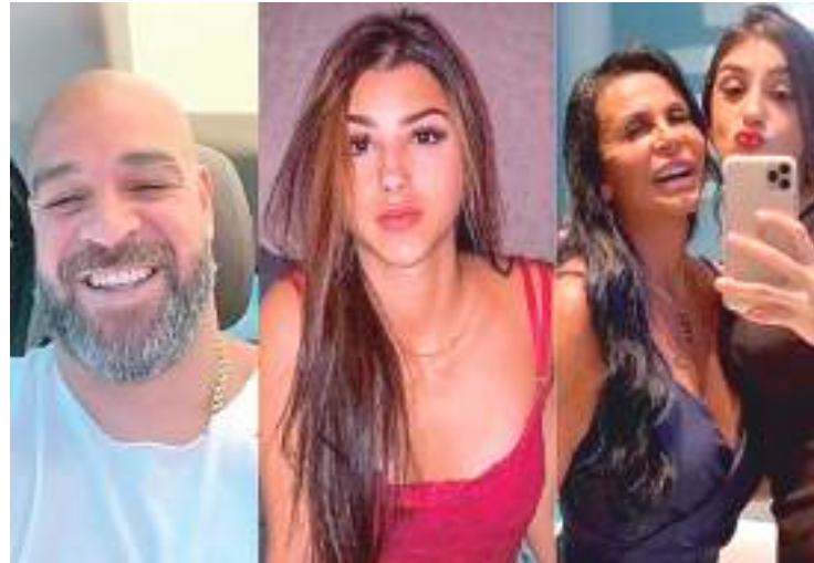
Filha e neta de Gretchen começaram a brigar por Adriano Imperador