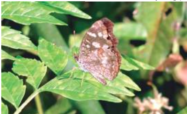
Perda foi analisada na Amazônia, Mata Atlântica, Cerrado e Pampa

Estudos em diversas partes no mundo apontam tendência de redução nas populações e insetos, mas até agora pouco se sabia sobre o Brasil, local que abriga grande variedade desses animais. Um grupo de cientistas finalmente conseguiu reunir em uma única análise 75 observações sobre populações desses bichos, e o resultado mostra que seu número está em queda.