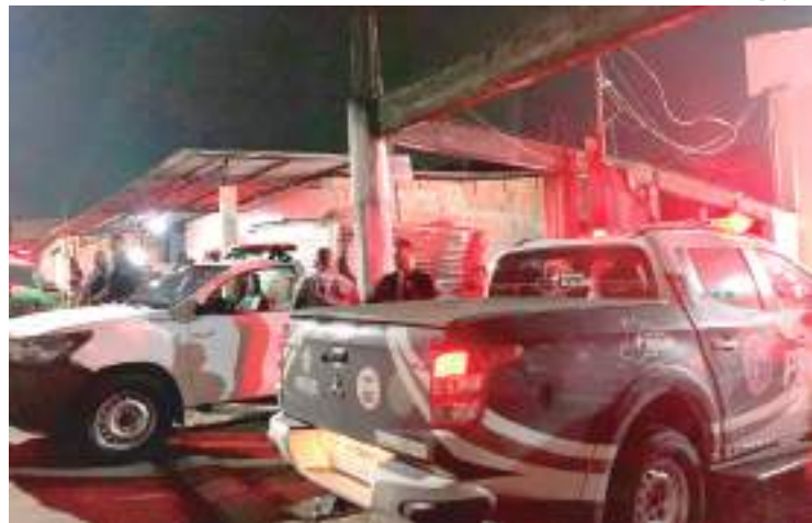
Mototaxista foi torturado e morto a tiros no fundo de igreja na Zona Norte

A motivação e autoria do crime serão investigadas pela Delegacia Especializada em Homicídios e Sequestros. Policiais civis da especializada estiveram no local do crime realizando diligências preliminares.