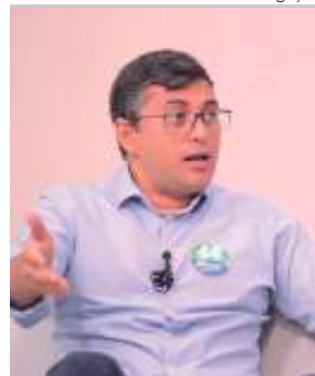
Modernização será feita em parceria com a Prefeitura