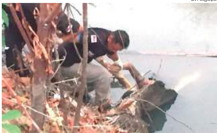
Homem foi degolado na praça do Mestre Chico, na Zona Sul

removido com a ajuda do Corpo de Bombeiros e encaminhado para o Instituto Médico Legal (IML), para passar por exames de necropsia e depois ser entregue aos familiares. A Delegacia Especializada em Homicídios e Se-