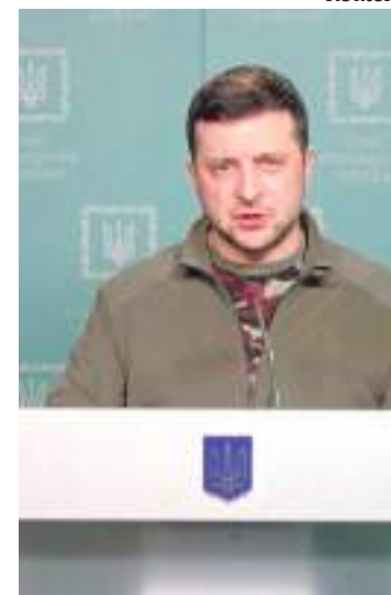
Zelenskiy destacou a postura de guerra da Ucrânia contra Rússia