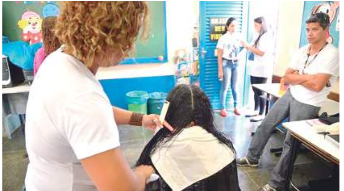
Setor no Amazonas ganhou 11.261 postos de trabalho e mais de 1,3 mil empresas em 10 anos

Em 2020, havia 6.682 empresas de serviços no Amazonas, número que vem aumentando a cada ano. De 2011 para 2020, o crescimento no número de