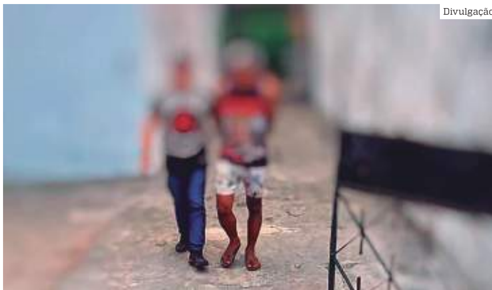
Suspeito de estuprar sobrinha de 8 anos foi preso na quarta-feira (23)

O homem recebeu voz de prisão e foi conduzido ao 30º DIP. Ao término dos procedimentos cabíveis, ele deve ser encaminhado à Central de Recebimento e Triagem (CRT) no quilômetro oito da rodovia federal BR-174.