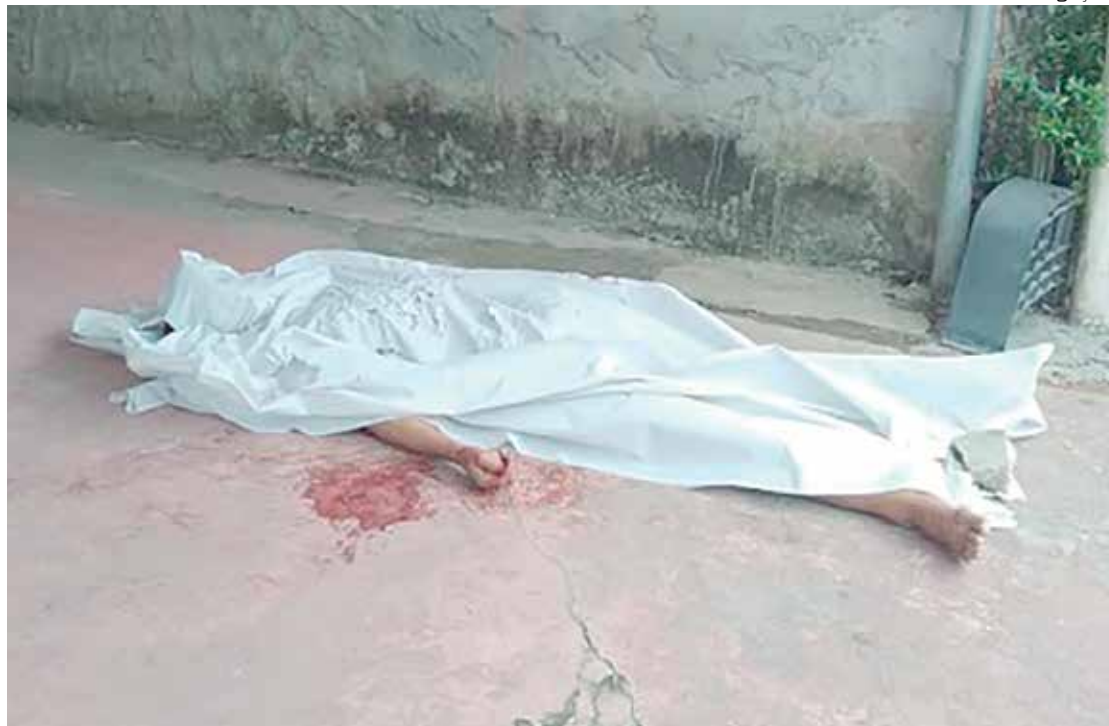
Homem foi perseguido e morto com vários tiros dentro de uma residência no Tarumã, Zona Oeste de Manaus

“Foi constatado pelos médicos do Serviço de Atendimento Móvel de Urgência (Samu) que o homem foi atingido com quatro tiros, sendo