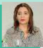
Nair Bair Agir

Até o fechamento desta edição, a assessoria não enviou a agenda do candidato.