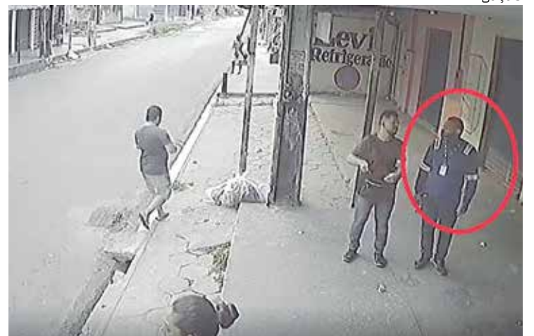
Homem (em destaque) rouba passageiros em parada de ônibus da ZL

Quem tiver informações sobre a identidade ou paradeiro do suspeito pode fazer denúncias pelo (92) 98826-5728, disque-denúncia do 4º DIP, ou pelo 181, da Secretaria de Estado de Segurança Pública (SSP-AM).