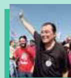
Eduardo Braga MDB

8h – Entrevistas à Rádio CBN Amazônia/Podcast Política na Rede 13h30 – Entrevista Amazonas Atual 17h30 – Entrevista TV Record