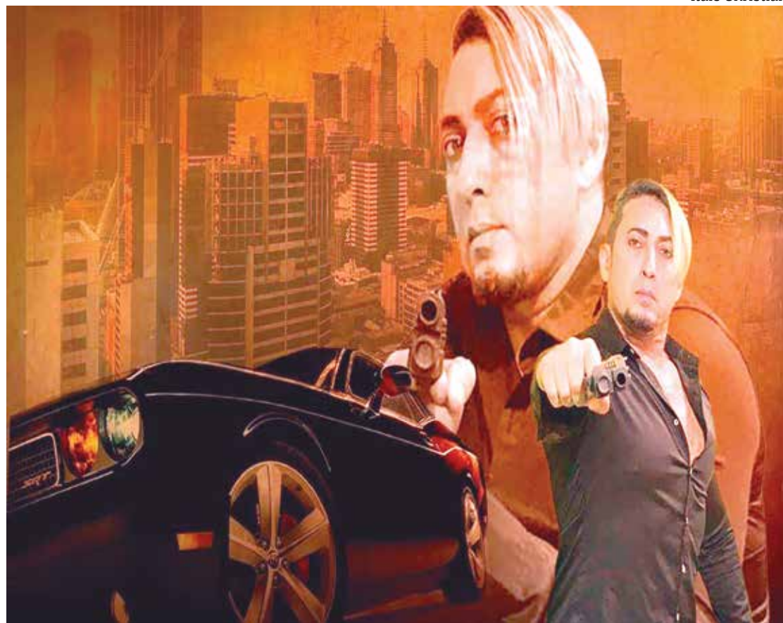
Longa-metragem traz um alerta sobre a proteção da Amazônia e será lançado em dezembro deste ano

"Fiz o vilão e vilã em 'Rapto do Jaraqui Dourado',