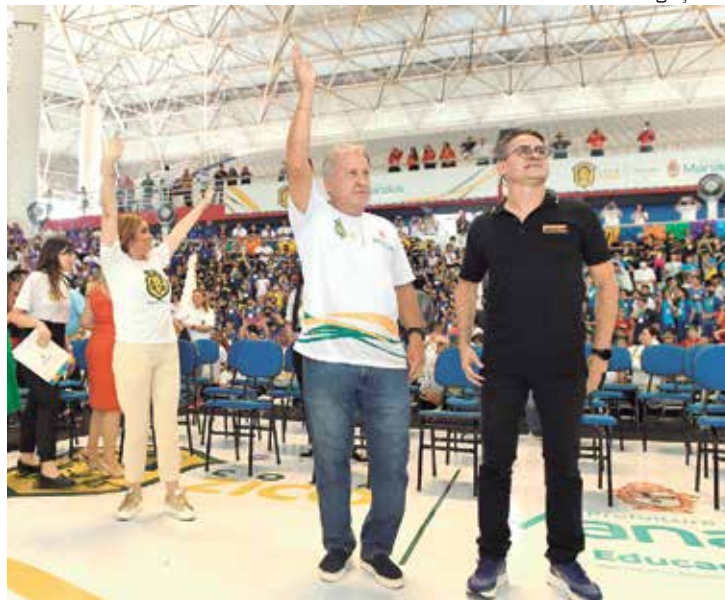
Ídolo flamenguista participou da abertura da copa que leva seu nome

Zico agradeceu bastante a recepção dos alunos e espera encontrar em Manaus um grande talento