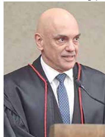
Ministro ressalta a proibição do uso de celulares na hora da votação

Os ministros também decidiram que o uso detectores portáteis, de forma excepcional, deve ser uma consulta ao juiz eleitoral. Atualmente não há previsão de detectores porque não há norma regulamentar.