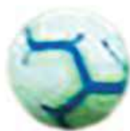
Flamengo e Corinthians duelam pelas quartas de final da Libertadores