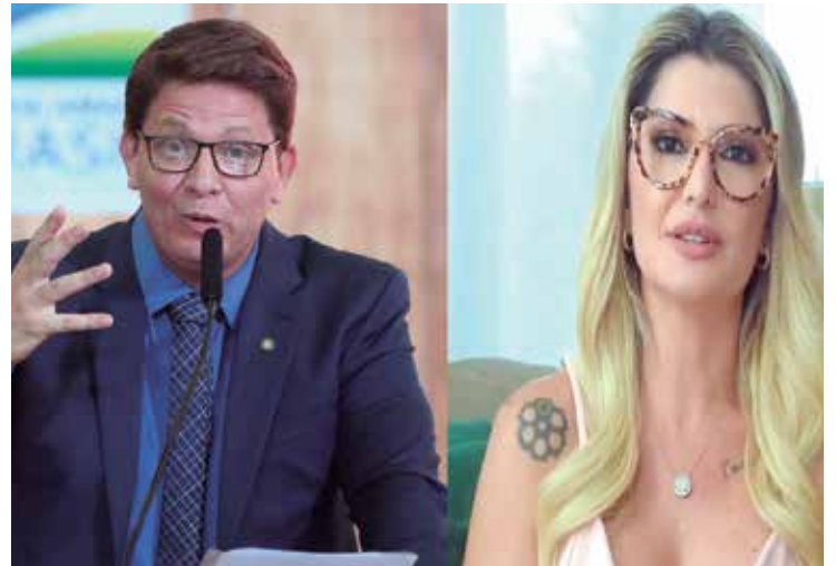
Artistas, jornalistas, esportistas são figuras carimbadas nas disputas