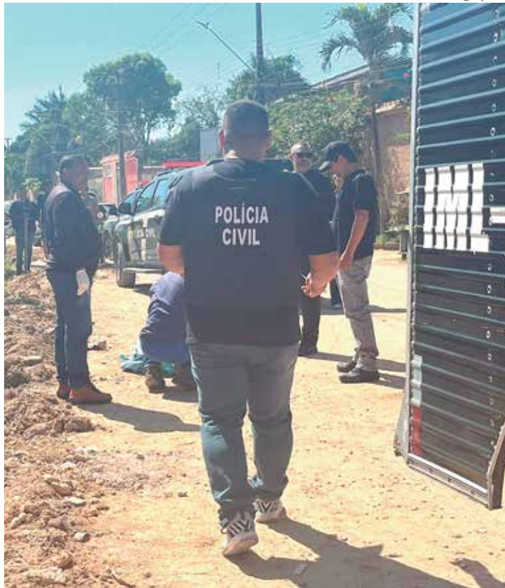
Polícia Civil realiza perícia no corpo de homem encontrado na ZN