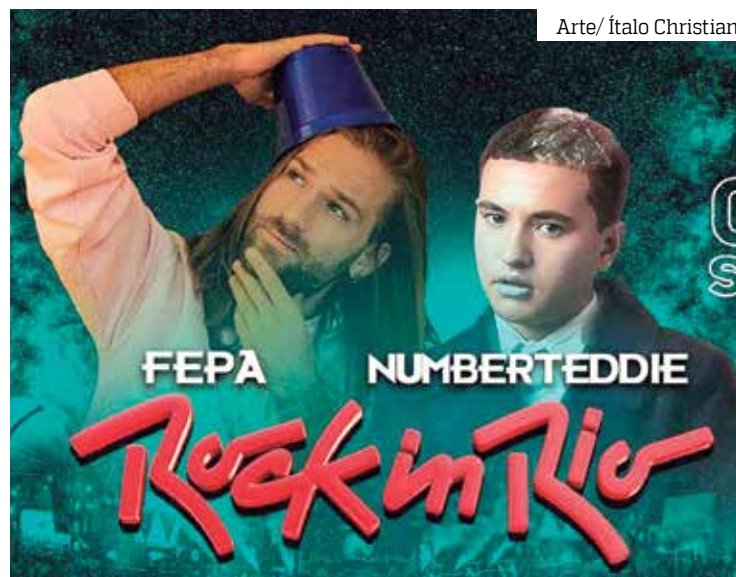
Number Teddie e Fepa sobem aos palcos do maior Festival de rock

“Começou com uma brincadeira da gente falando ‘ah não quando a gente tocar no Rock in Rio’ e aí finalmente chegou, sabe? Ainda estamos meio em êxtase com muitas coisas que estavam acontecendo e receber [a notícia] foi meio louco. Meu pai tinha falecido recentemente, então no dia que eu recebi a notícia eu ainda estava meio frio. A ficha já está caindo e está dando um calor no coração, uma ansiedade e vai ser incrível. Sou um artista do Norte, de Manaus, e isso significa muito para mim e para