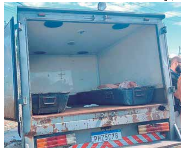
Mãe e filho podem ter sido mortos por engano, afirma vizinho