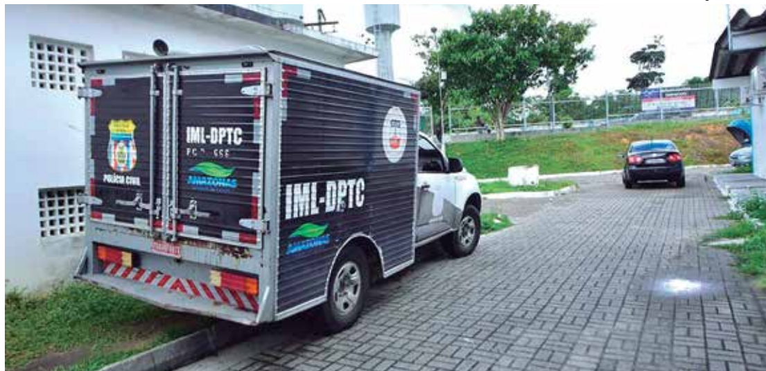
Corpo do suposto ladrão de drogas foi removido pelo Instituto Médico Legal

O crime será investigado pela Delegacia Especializada em Homicídio e Sequestros (DEHS).