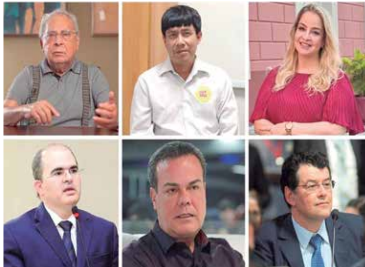
Seis candidatos apresentaram suas propostas no primeiro debate