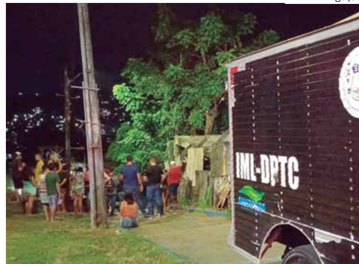
Mais um homem é assassinado no bairro Compensa, na Zona Oeste

Nos últimos dias vários crimes de homicídios por execução foram registrados no bairro da Compensa. De acordo com as investigações a maioria dos casos estão relacionados a acerto de contas, e execução pela guerra do tráfico de drogas na região.