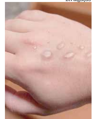
Não há, até o momento, casos confirmados de transmissão local

A FVS-RCP destaca que toda a rede de saúde, incluindo unidades privadas e públicas, da capital e interior, está orientada para realizar atendimento de casos suspeitos de Monkeypox.