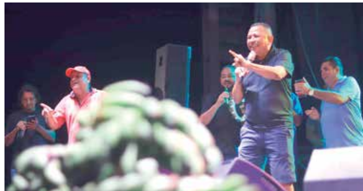
Durante os três dias, atrações regionais e nacionais, se apresentaram

No domingo, a festa encerrou com uma disputa de pênaltis, e a primeira rodada da Copa Inter Distrital.