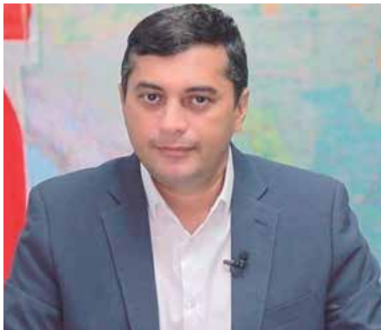
Instituto Iveritas entrevistou cerca de 5,6 mil eleitores

Na pesquisa espontânea, Amazonino tem 24,9 %, e o Wilson Lima aparece com 24,7%. Em terceiro lugar, o levantamento indica Eduardo Braga com 12,9%.