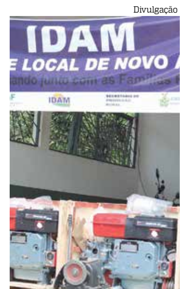
A ação faz parte do programa Afeam Mais Crédito Amazonas

“O que faltava era um prefeito de vergonha e um Governo do Estado que desse incentivo ao produtor. Não apenas sementes e insumos, mas linhas de financiamentos, recuperação de ramais, transporte, garantia de preço e, sobretudo, assistência técnica como ocorre hoje. O Governo do Estado já investiu mais de R$ 10 milhões no setor primário”, afirmou.