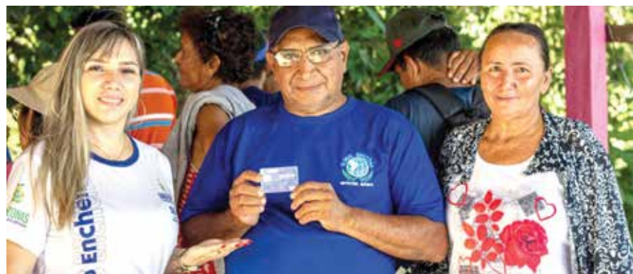
No total, foram beneficiadas 882 famílias, das comunidades afastadas