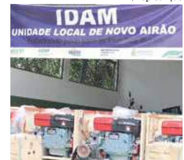
Associação dos Universitários de Irاندوبا cobra prefeito