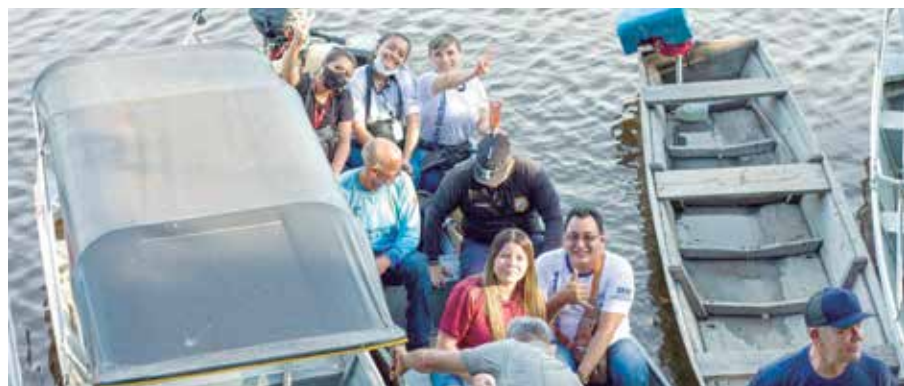
Cerca de 100 mil famílias sofreram os impactos da cheia deste ano

De acordo com a estimativa da Defesa Civil do Estado cerca de 100 mil famílias, que sofreram os impactos da cheia deste ano, foram beneficiadas com o Auxílio Enchente, no valor de R$ 300, pago em parcela única.