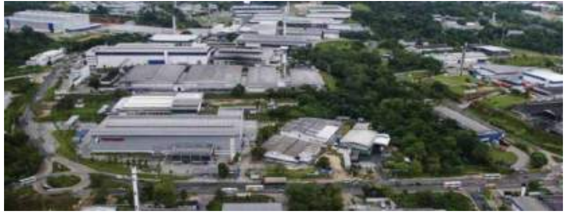
Novo decreto também prejudica município do interior do Amazonas

“Se você tiver redução de tributos, as empresas podem considerar que outros lugares próximos da grande área de consumo no Brasil ficam muito mais fácil. Então, já