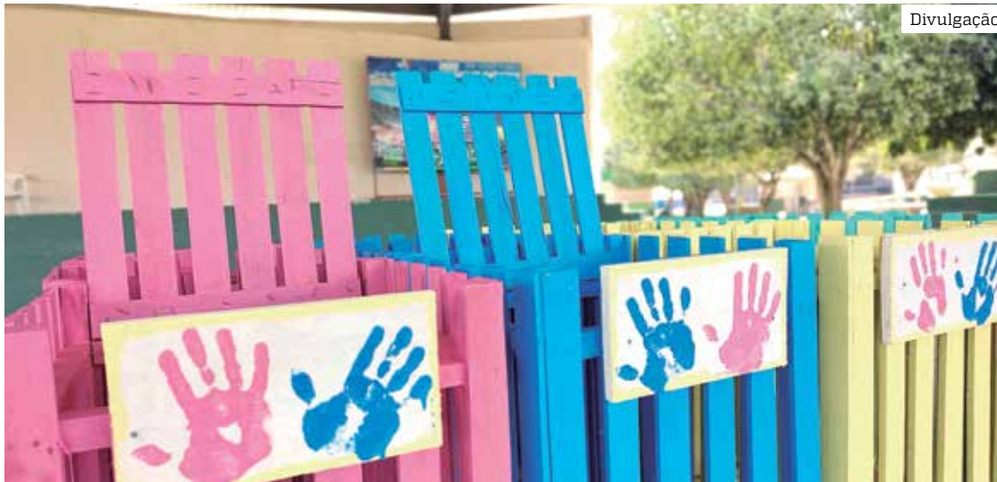
O projeto Missão Calebe foi apresentado à população na Praça Municipal Hugo Carlos Frederico