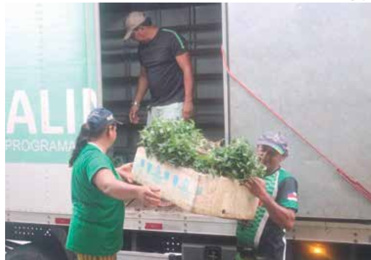
Governo apoia a produção de cerca de 40 agricultores do município

Os produtos entre verduras, legumes e frutas estão sendo comercializados nas feiras locais do município, nas feiras locais da Agência de Defesa Agropecuária do Amazonas (ADS) e, também, na capital; além da Feira do