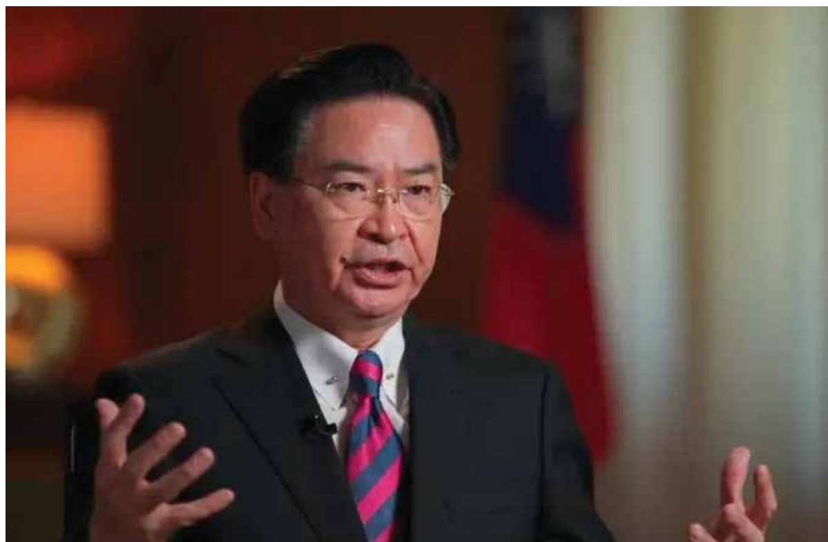
A viagem de Pelosi foi interpretada como uma provocação dos EUA

As atividades incluem disparos com munição real nas águas e no espaço aéreo. Entre os 11 mísseis lançados, cinco atingiram o mar no Japão, cinco atingiram a imprensa local.