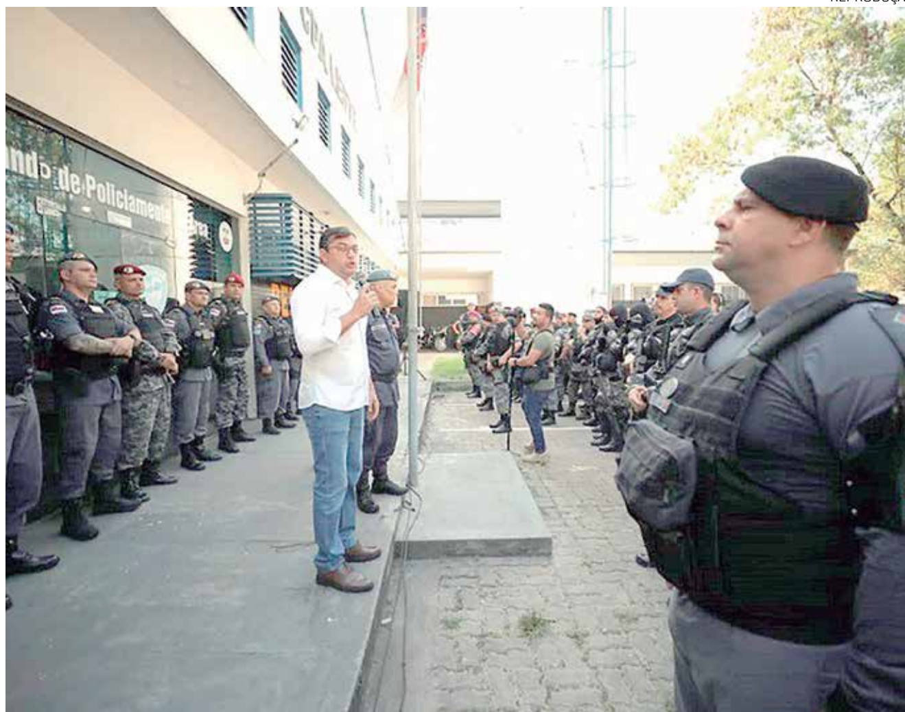
A SSP-AM destaca que R$ 120 milhões são para as obras em planejamento e em fase de licitação