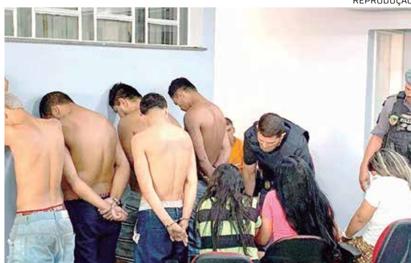
Os suspeitos foram apresentados no 14º Distrito Integrado de Polícia (DIP)

De acordo com o capitão Thiago Dantas, da 28ª Companhia Interativa Comunitária (Cicom), a ação conjunta iniciou após denúncias anônimas de que haviam armas, explosivos, drogas e materiais ilícitos em uma casa na rua 29 de julho. "Reunimos as equipes da 4ª Cicom, 28ª Cicom, 28ª DIP, Força Tática e Grupo Marte e conseguimos êxito em localizar todo esse material entorpecente. Granadas caseiras foram detonadas no local pelo Marte. Um dos alvos da opera-