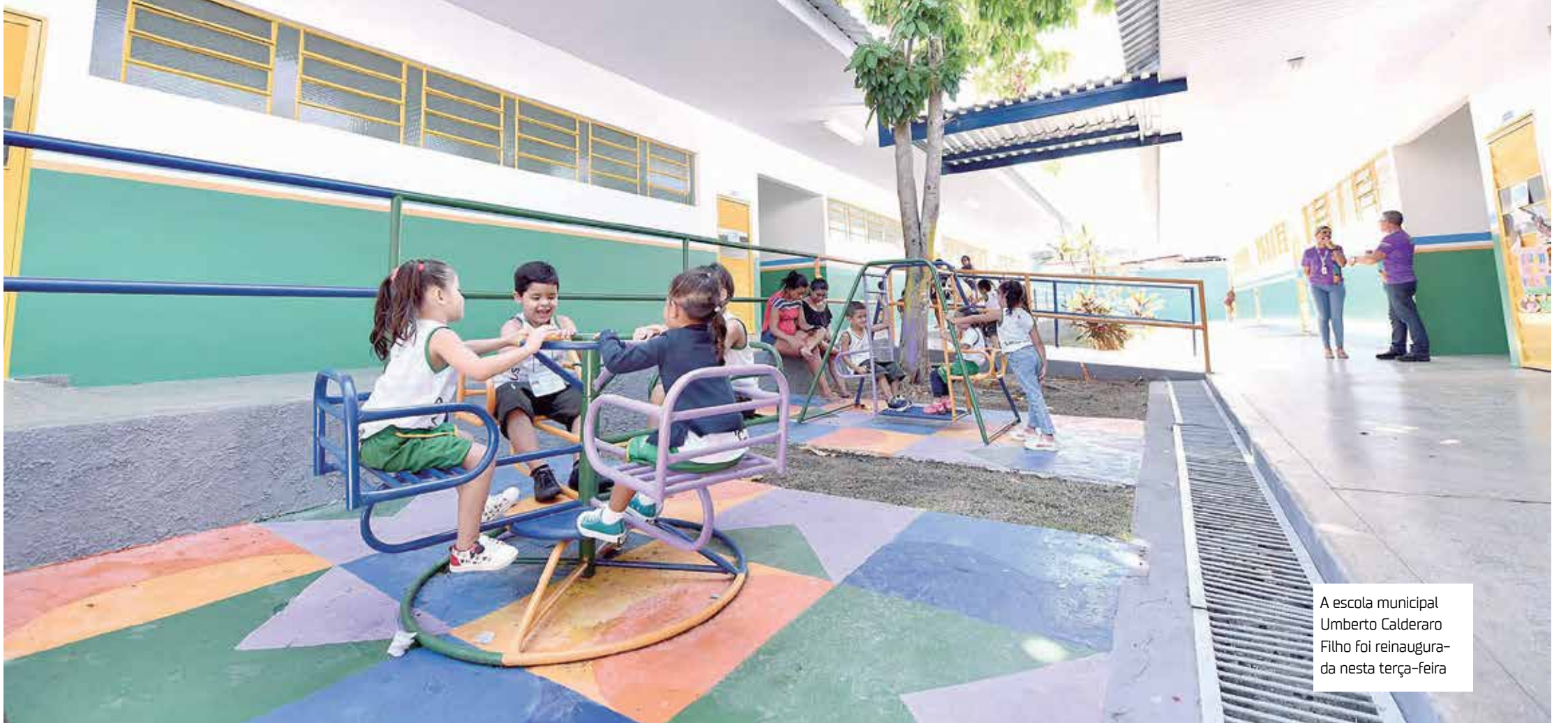
A escola municipal Umberto Calderaro Filho foi reinaugurada nesta terça-feira

A última unidade a ser reinaugurada foi o Centro Municipal de Educação Infantil (Cmei) Umberto Calderaro Filho. O prefeito de Manaus, David Almeida, esteve presente