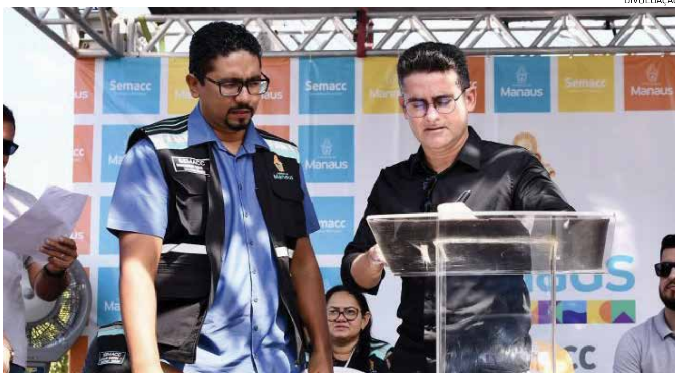
O prefeito David Almeida afirmou que pretende deixar Manaus com a melhor estrutura do país

Para o gestor municipal, é fundamental que a Prefeitura de Manaus tenha um olhar dife-