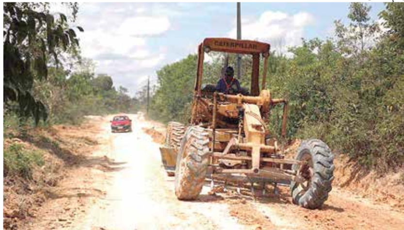
As melhorias promovidas pelo SOS Vicinais envolvem a terraplanagem

"A dificuldade era muito mais o ramal, e com essa vinda do SOS Vicinais talvez dê uma arumada na situação. O produto vai chegar com maior qualidade. Vamos colocar o nome