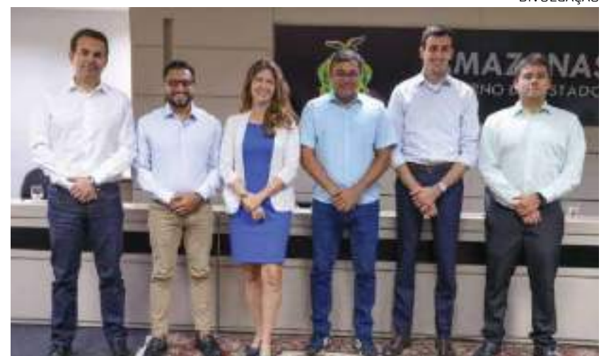
O voo terá aproximadamente cinco horas de duração

“A Azul sempre acredita muito nisso, é uma empresa que tem uma diversidade de frota que nenhuma empresa da América Latina tem. Começamos esses