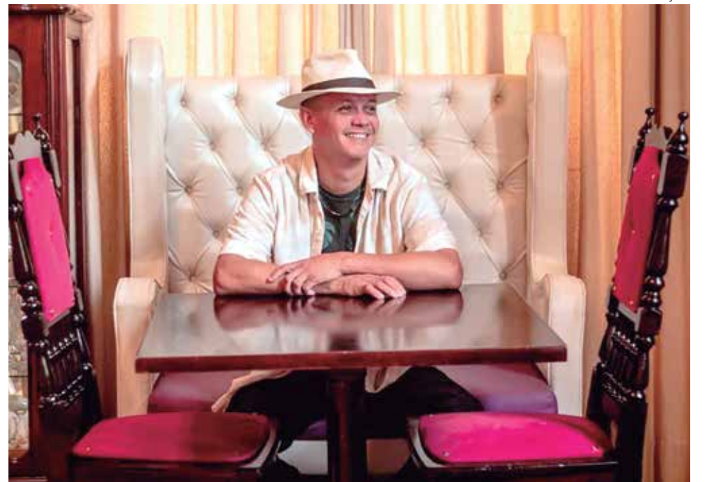
O show leva um repertório eclético que vai do samba ao pop, passando pelo bolero e MPB

Ele também atuou como técnico de sonorização. Passou por uma experiência de seis meses na Europa (Itália) como técnico de PA de uma banda de Boi Bumbá. Trabalhou como freelancer e operador de áudio em várias empresas de sonorização.