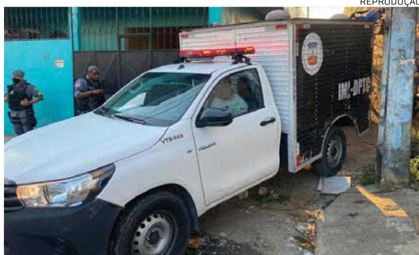
O corpo dela foi removido pela equipe do Instituto Médico Legal (IML)

Ao Em Tempo, o suspeito chegou a falar de dentro da viatura que não havia fei-