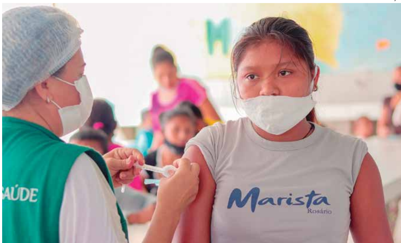
O material informativo será doado à Semsa na próxima terça-feira (16)

"A doação é fruto de parceria estabelecida entre a Semsa Manaus e o UNFPA para fortalecer a atenção