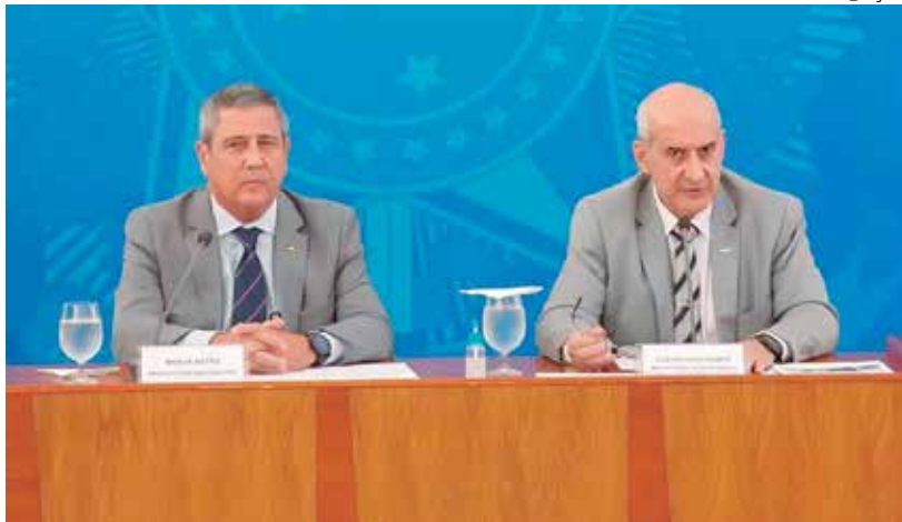
Forças armadas justificam salário por indenizações e adicionais durante carreira

cebeu uma quantia de R$ 731.879,43 na soma de pagamentos feitos em julho, agosto e setembro de 2020, sendo R$ 537.798,74 somente de verbas indenizatórias.