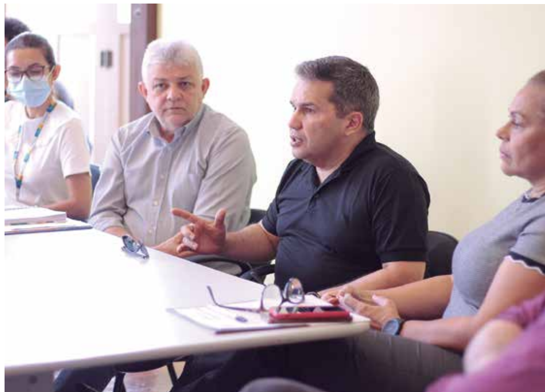
O destaque vai para a implantação e desenvolvimento de projetos

O objetivo é que o destino Manaus seja um produto competitivo no mercado nacional e internacional.