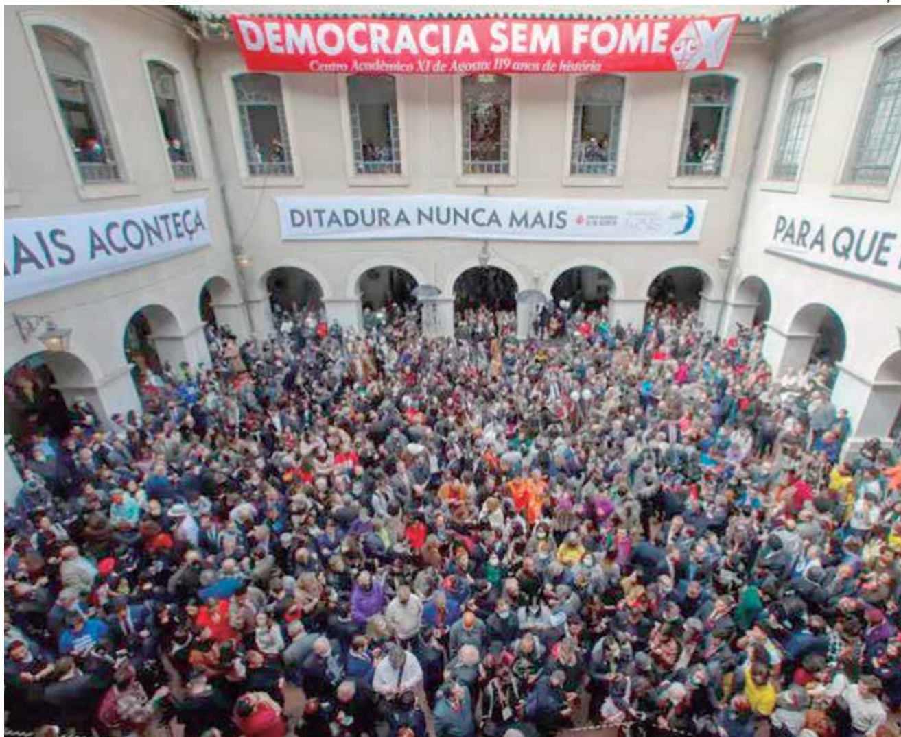
O movimento recebeu apoio da Federação das Indústrias do Estado de São Paulo (Fiesp)

"Precisamos preservar o que para nós é sagrado, que é a nossa democracia. Às vezes nos esquecemos que as sociedades mais prósperas, aquelas onde reina a