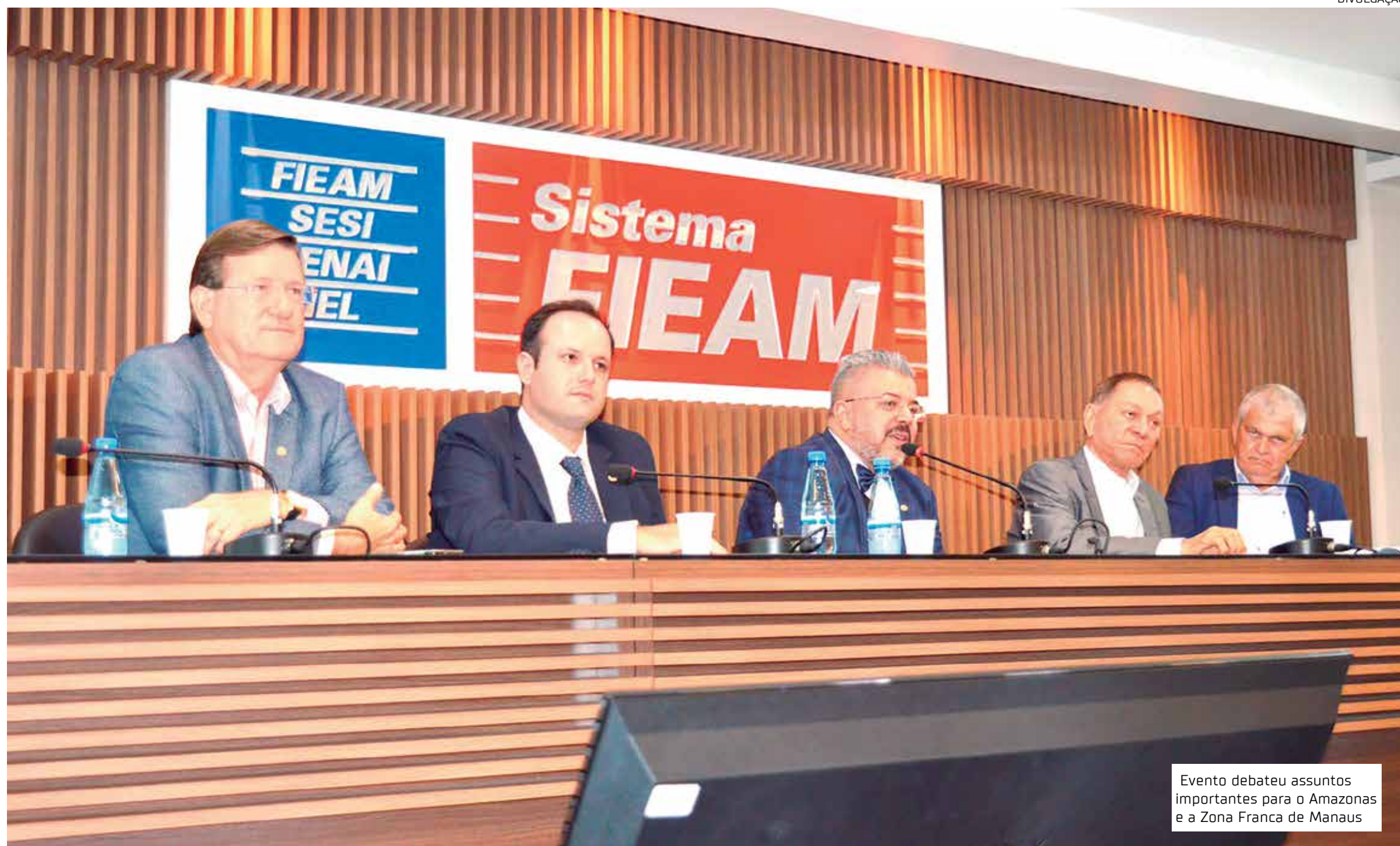
Evento debateu assuntos importantes para o Amazonas e a Zona Franca de Manaus

Debates inéditos sobre ZFM, maratonas e premiações marcam Semana do Economista no Amazonas