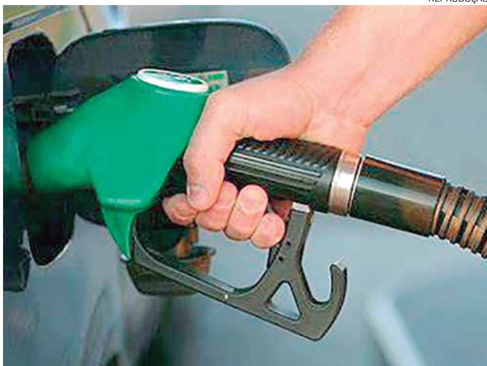
Menor preço da gasolina será observado nas bombas dos postos