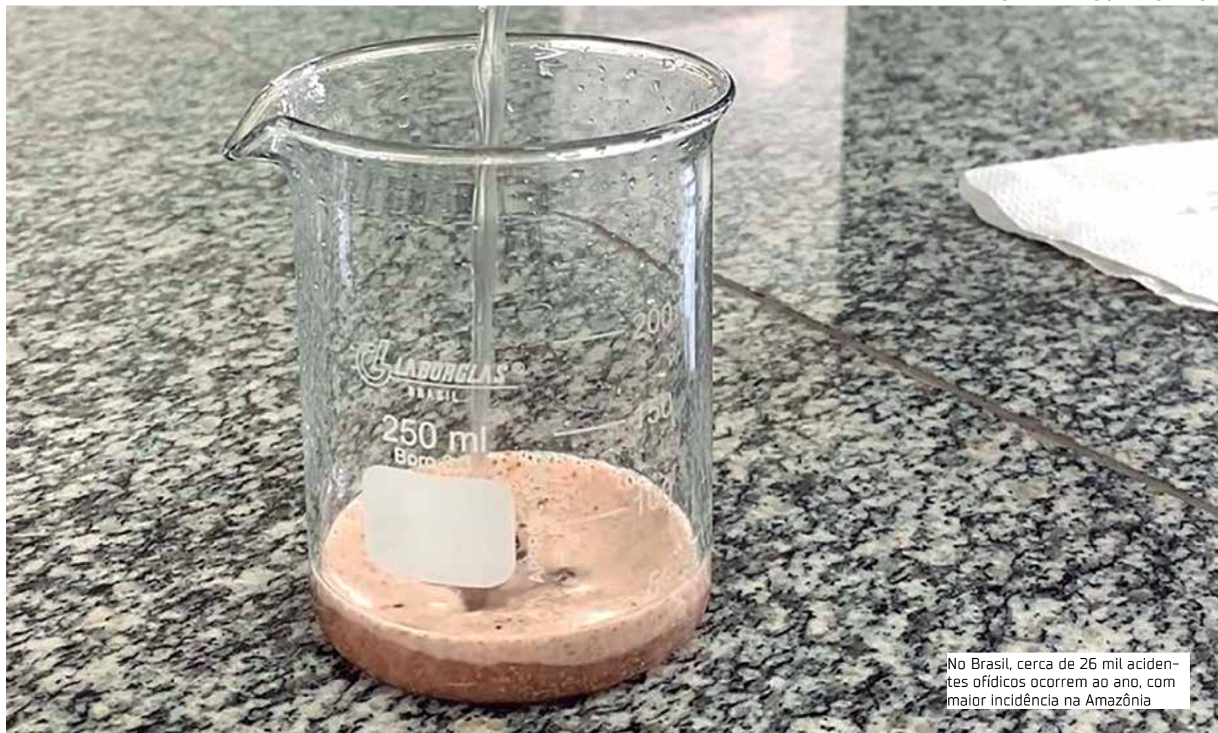
No Brasil, cerca de 26 mil acidentes ofídicos ocorrem ao ano, com maior incidência na Amazônia

Doutora em Imunologia, a pesquisadora destaca que o soro utilizado no Brasil para acidentes com jararacas neutraliza com bastante