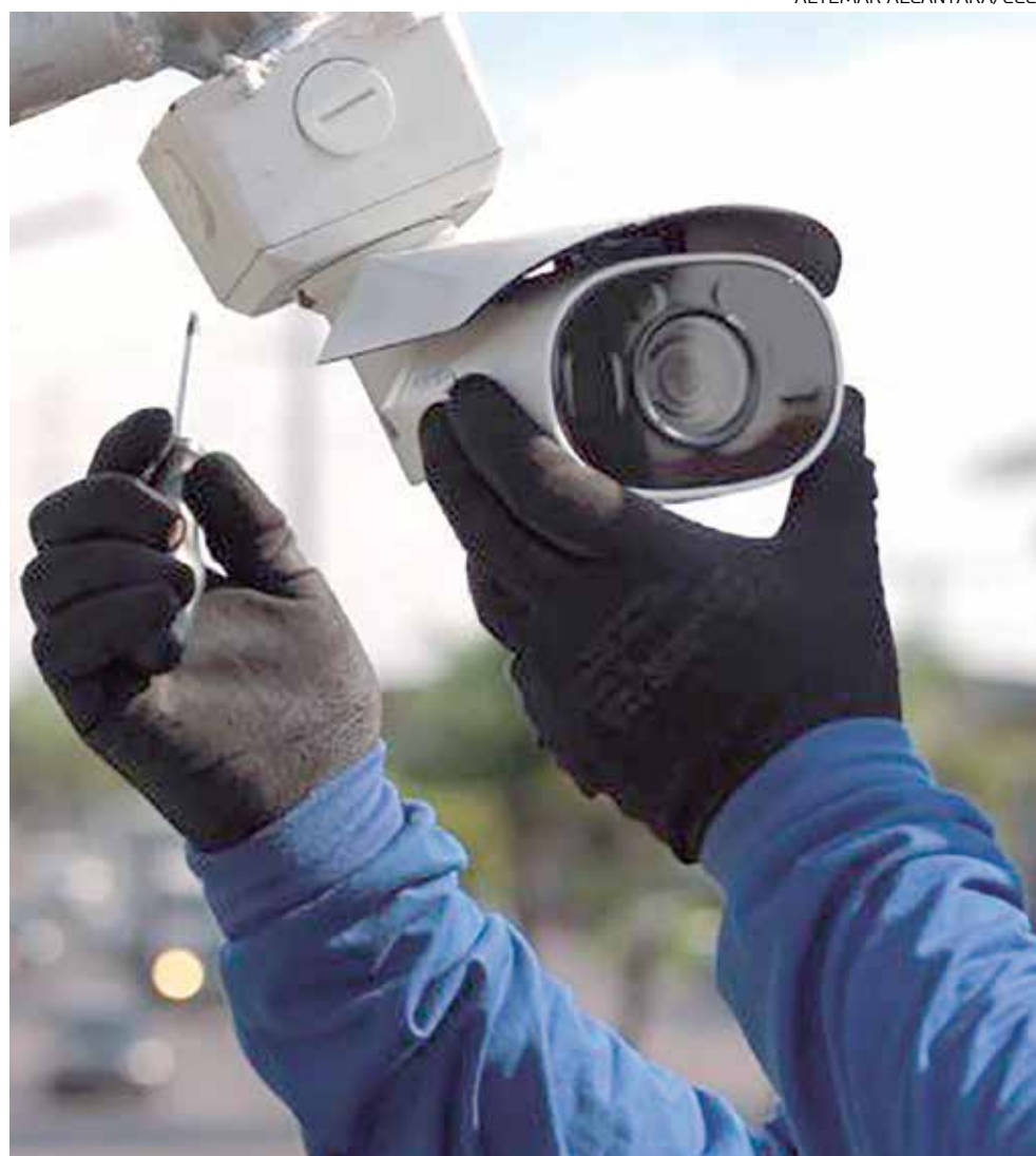
Trânsito, transporte, Guarda Municipal, Defesa Civil e telemonitoramento em Saúde atuam no CCC