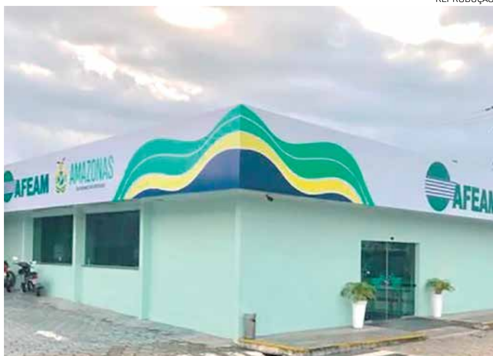
Jornada de trabalho na Afeam para concursado será de 30 horas semanais