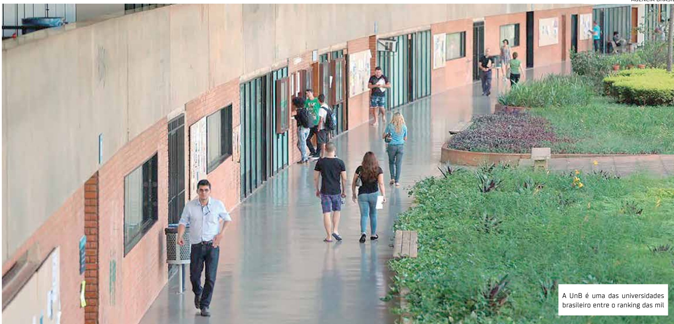
A UnB é uma das universidades brasileiro entre o ranking das mil

Ranking é divulgado anualmente desde 2013 e, em 2022, USP consta como a mais bem avaliada da América Latina