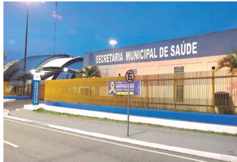
A relação pode ser conferida no site da SEMSAS

do o concurso a Polícia Civil do para os cargos de Investigador, Escrivão e Perito. Na decisão foi apontado que a necessidade do diploma de curso superior na fase atual do concurso e a exigência da Carteira Nacional de Habilitação (CNH) não têm fundamentação legal, Conforme apontado no despacho apenas após a conclusão do curso de formação é que deve ser exigida apresentação do diploma de conclusão do curso de bacharel na posse do candidato aprovado. Há ressalvas também quanto à exigência de CNH.