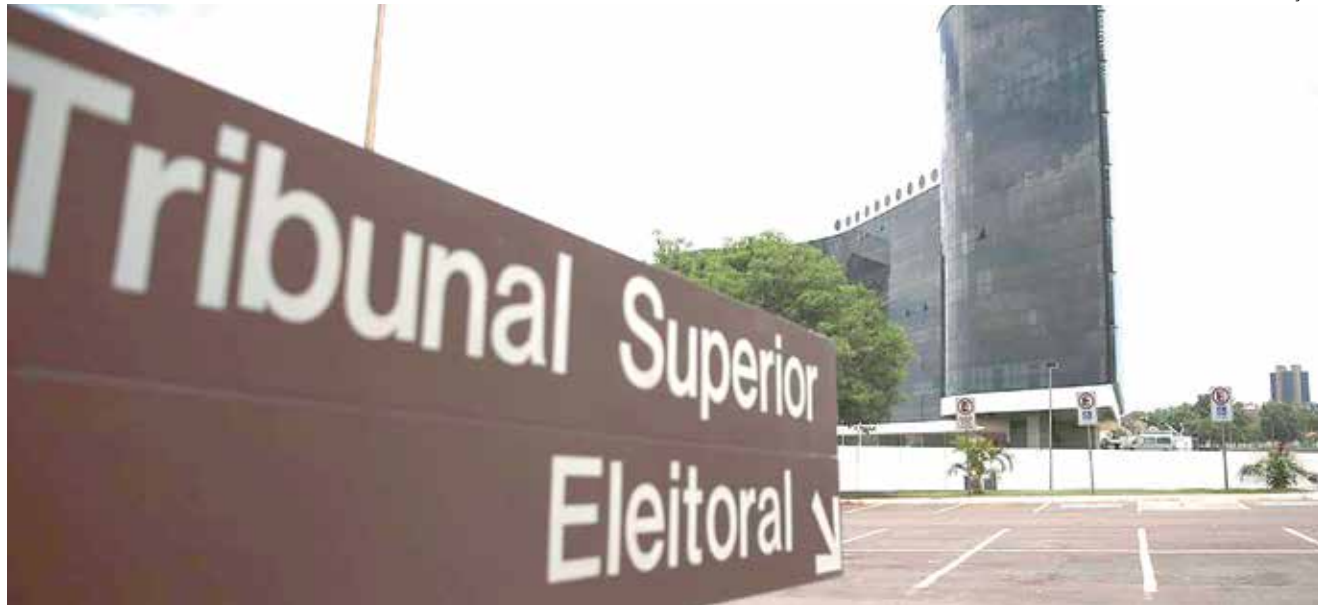
Se houver falha nos documentos, a sigla, federação ou o candidato será intimado para que a situação seja resolvida em três dias.

No caso das candidaturas apresentadas pela internet, o prazo terminou às 8h. E às 19h se encerrou o prazo para a entrega de mídias com a documentação necessária diretamente no Tribunal Superior Eleitoral (TSE) – no caso dos candidatos a presidente – ou nos Tribunais Regionais Eleitorais (TRES) – nas disputas por