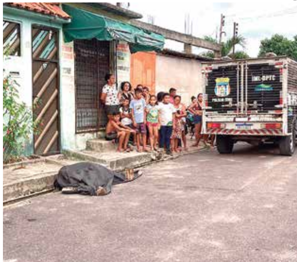
O homem agonizou no chão até a chegada do Samu

Equipes do Departamento de Polícia Técnica realizaram a perícia. A vítima foi