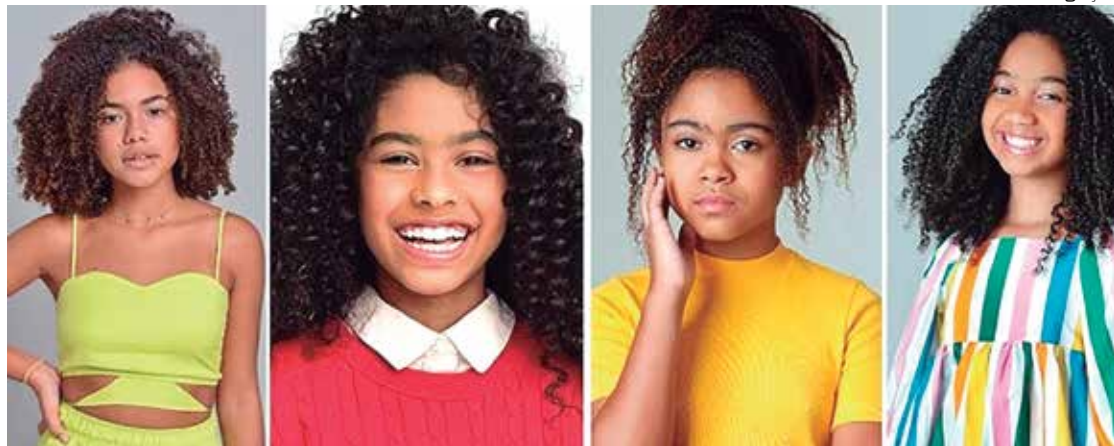
Halle Bailey foi escolhida para viver a famosa personagem Ariel