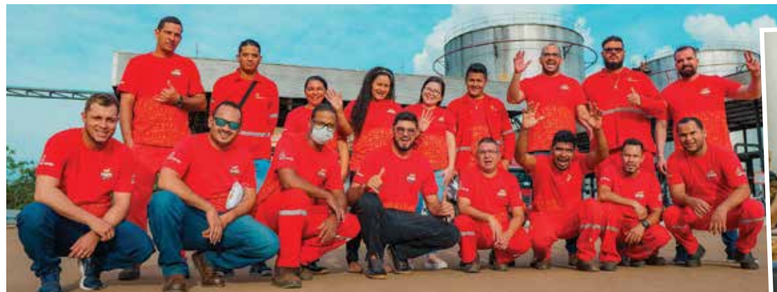
Turma da base de Porto Velho também já passou pelo treinamento do Previna

O Grupo Atem é composto por diversas empresas no ramo de combustíveis, logística rodoviária e fluvial e construção naval, entre outras, sendo a principal delas a Atem Distribuidora de Petróleo, fundada há 22 anos. O Grupo está presente em 14 estados do Brasil, possuindo, a Distribuidora, mais de 300 postos franqueados, 8 bases de distribuição ativa, uma base em construção e milhares de clientes ativos, movimentando um total de mais de 5 bilhões de litros de combustíveis por ano.