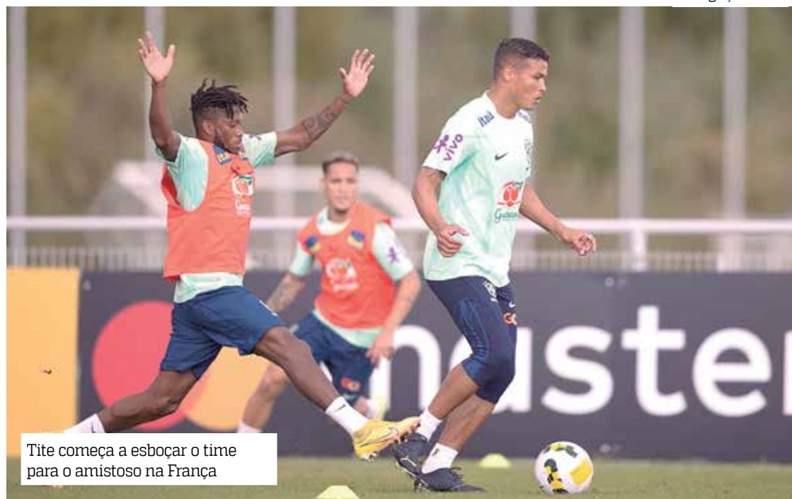
Tite começa a esboçar o time para o amistoso na França

As ausências na lista de Tite também surpreenderam. O treinador deixou de fora Philippe Coutinho, Gabriel Jesus, e Daniel Alves. Dos três laterais con-