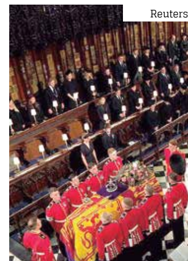
Milhares de simpatizantes acompanharam o carro fúnebre

No final da noite, em uma cerimônia privada à família, o caixão de Elizabeth e o do marido de mais de sete décadas, o príncipe Philip, que morreu no ano passado aos 99 anos, foram enterrados juntos na mesma capela onde os pais e irmã da rainha, a princesa Margaret, também estão.