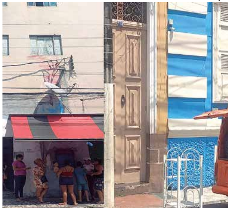
Moradores abandonaram prédio no Centro, após seguidos assassinatos

As mortes ocorridas no hotel abalaram os moradores que, na manhã da segunda-feira (19), começa-