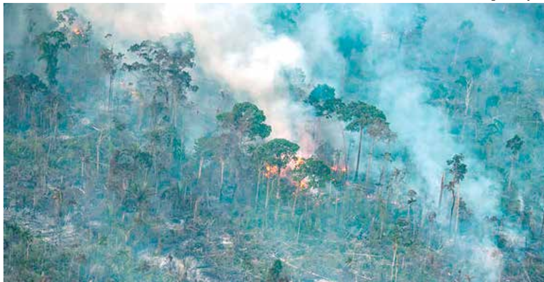
Desmatamento médio anual na Amazônia brasileira aumentou 75% em comparação à década anterior

O desmatamento e os incêndios florestais dispararam durante o governo do presidente Jair Bolsonaro