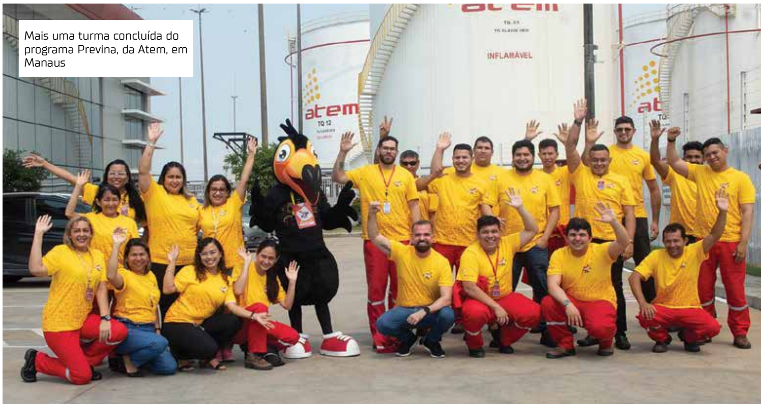
Mais uma turma concluída do programa Previna, da Atem, em Manaus