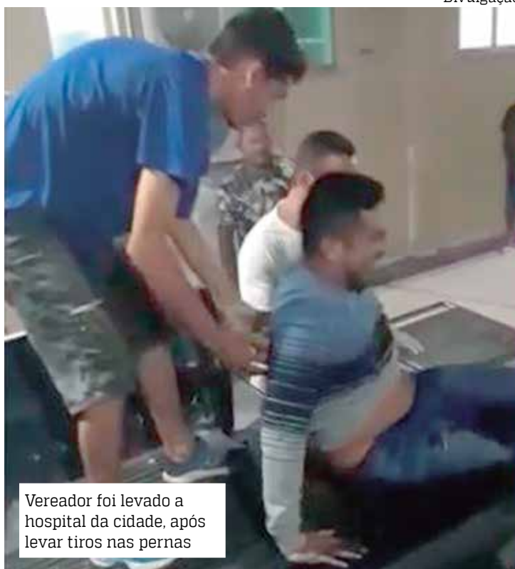
Vereador foi levado a hospital da cidade, após levar tiros nas pernas

“Ainda no domingo, investigadores foram até o Hospital José Mendes, onde a vítima se encontra internada após ser baleada na perna, para colher as primeiras informações. Em depoimento, o vereador informou