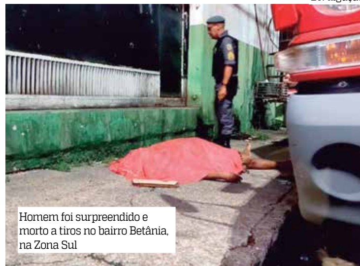
Homem foi surpreendido e morto a tiros no bairro Betânia, na Zona Sul

A irmã da vítima chegou ao local para fazer a identificação do corpo e os investigadores da polícia civil para esclarecer a motivação do crime que foi encaminhado para a Delegacia Especializada em Homicídios e Sequestros (DEHS).