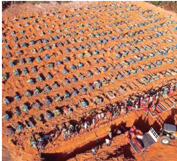
Estudo aponta a imprevisibilidade do número de dados da pandemia no AM

Para o número de casos, ambos os métodos apre-