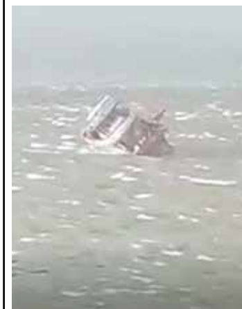
Barco afundou no meio do rio durante ventania em Jutai