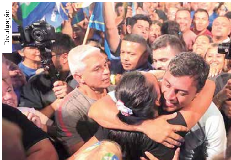
Governador listou os avanços do seu governo em benefício da população