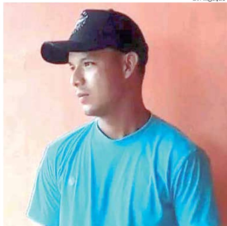
Jovem é morto a facadas por amigo após briga por pendrive