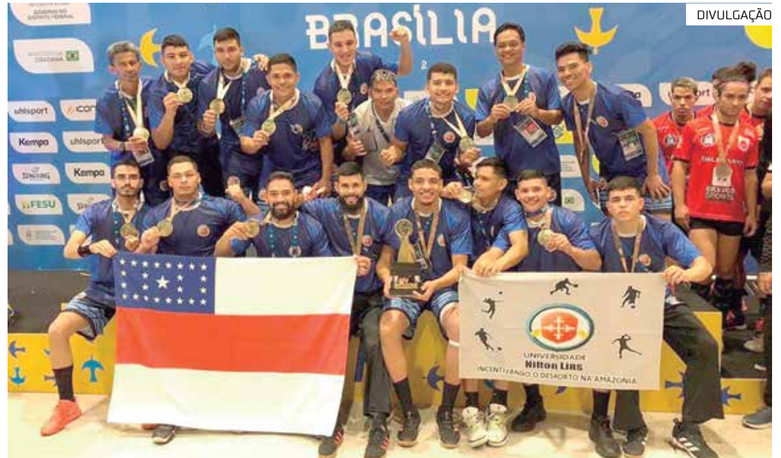
Amazonas conquista mais seis medalhas nos Jogos Universitários Brasileiros

Criado em 2002, o projeto oferece bolsas de estudo para formação acadêmica e suporte pro-