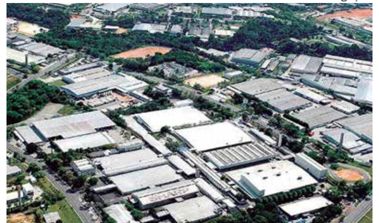
Polo Industrial faturou R$ 82 bilhões no primeiro semestre este ano

Outros segmentos que se destacaram neste intervalo incluem Duas Rodas (faturamento de R$ 12,05 bilhões e crescimento de 31,23%), Termoplástico (faturamento de R$ 7,46 bilhões e crescimen-