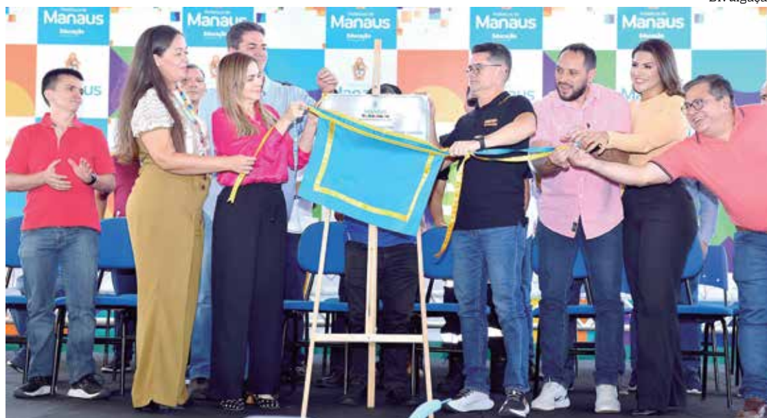
Prefeito David Almeida anuncia programa 'Alfabetiza Manaus' e reforma de mais 50 escolas

"Quando nós entramos na prefeitura, nós tínhamos 199 escolas fechadas para reforma, e a gente fez um mutirão ano passado, e entregaremos ao final do ano 214 escolas reformadas. No mês de dezembro, nós vamos ini-