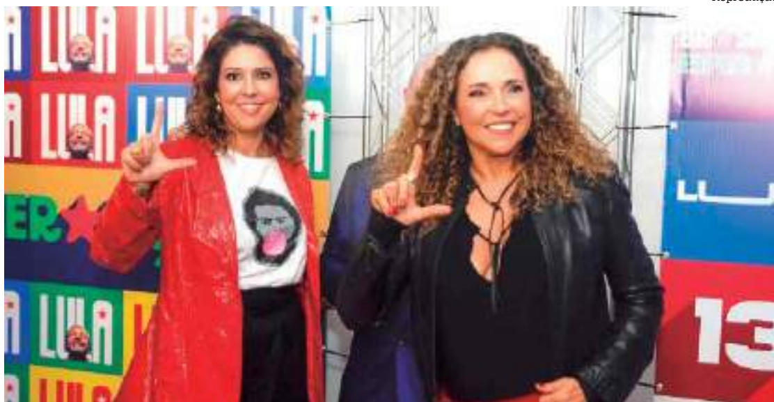
Ao contrário de 2018, celebridades se tornaram uma ferramenta importantíssima no jogo político

Entusiastas do atual governo como Silvia Abravanel, Regina Duarte e Zezé Di Camargo também deixaram suas posições claras, numa óbvia batalha pela influência. Se antes o artista que se manifestasse recebia reprimendas públicas, hoje ele se tornou uma ferramenta importantíssima no jogo político, com manifestações explícitas em seus shows ou entrevistas. Se antes a moda era ser “isento” para evitar ataques, agora, a eleição do próximo domingo (2)