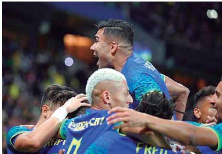
Jogadores comemoram gol, que deu início à goleada contra a Tunísia

Tite havia prometido mexer no time que venceu Gana na última sexta. Daquela formação com apenas um volante e quatro jogadores no ataque, o atacante Vini Jr. deu lugar ao volante Fred no meio-campo.