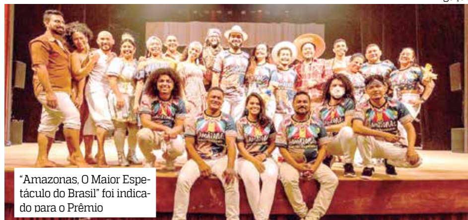
“Amazonas, O Maior Espetáculo do Brasil” foi indicado para o Prêmio

“Viver de Arte na nossa região é um desafio. Produzir Teatro Musical exige de nós um movimento gigantesco para que espetáculos dessa magnitude alcancem o reconhecimento nacional necessário e merecido, principalmente porque sofremos com a falta de políticas públicas, longe dos eixos que mais têm incentivos nessa área”, explica a equipe.