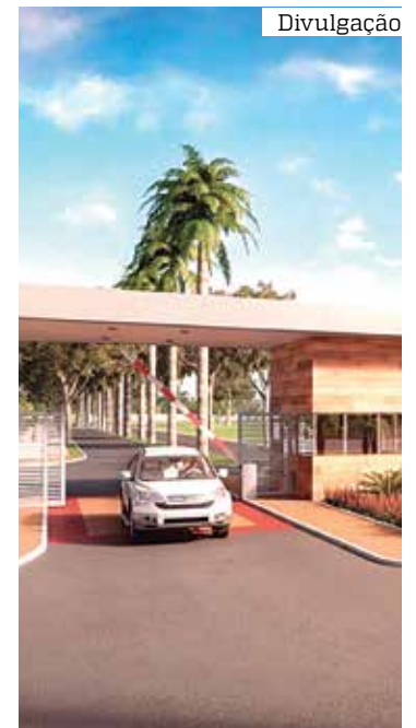
Manaus e região metropolitana possui cerca de 3 mil condomínios

As inscrições podem ser feitas diretamente com a organização do evento pelo número (92) 98566-0283 ou pelo link ( https://bit.ly/InscricoesTreinamento ).