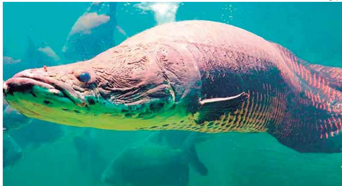
Aquicultura do Amazonas obteve o valor de produção de R$ 105,6 milhões em 2021

No valor de produção da aquicultura, os 10 maiores municípios do Amazonas, em 2021, foram Rio Preto da Eva, Manaus, Iranduba, Presidente Figueiredo, Itacoatiara, Manacapuru, Coari, Careiro, Benjamin Constant e Envira. Rio Preto da Eva lidera com R$ 23,2 milhões, seguido de Manaus (R$ 15,5 milhões) e