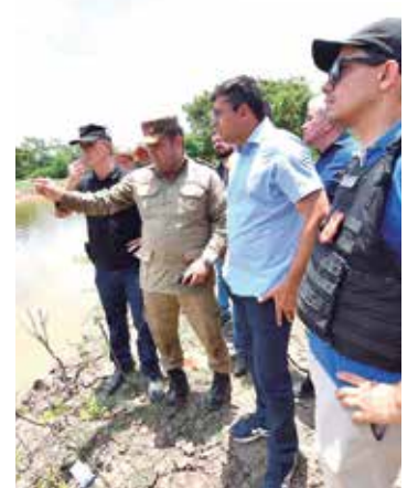
Governador acompanha assistência a vítimas na BR-319