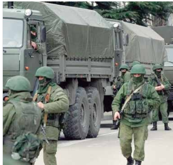
Há acusações de vigilância apertada e coerção por parte de soldados

Em comunicado divulgado na quarta-feira (28), o Ministério ucraniano dos Negócios Estrangeiros (MNE) denuncia os referendos como “mais um crime” cometido pelos russos, que terá credibilidade e reconhecimento nulos.