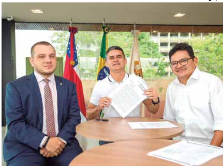
Quatro meses após aprovar lei, Prefeitura espera ativação do 5G

O sinal será ativado pela agência nacional e a libera-