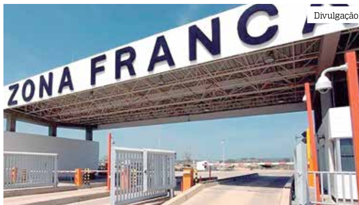
Decreto garante a redução de 35% e preserva a competitividade da ZFM

“Excelentíssimo Senhor Ministro Relator, o procedimento afrontoso se repete na emissão deste último decreto. Ao invés de cumprir a decisão exarada, o Governo Federal elege ao seu alvedrio o quais produtos devem ser ob-