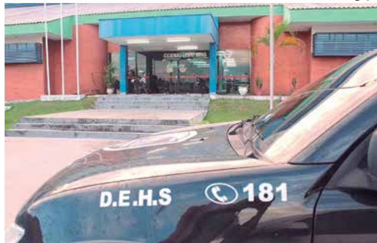
Delegacia Especializada em Homicídios e Sequestros investiga o crime

De acordo com informações preliminares, ha-