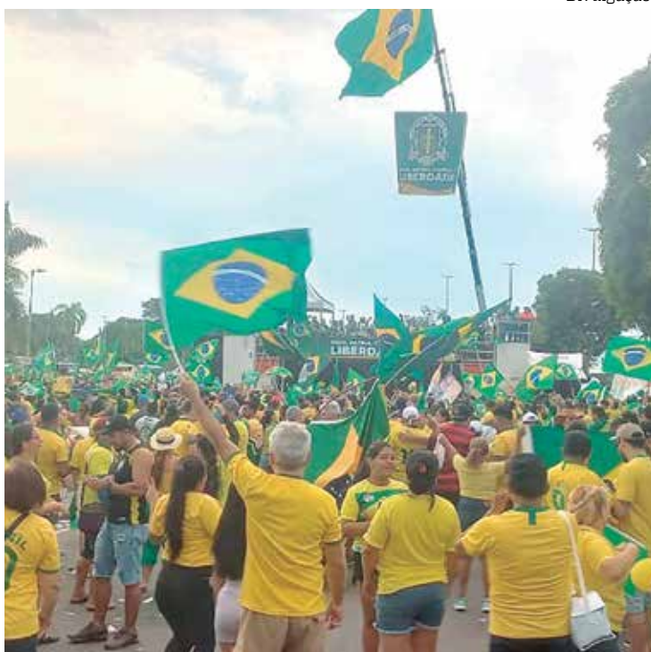
Mais de 25 mil pessoas foram a Ponta Negra apoiar Bolsonaro

“Honesto como ele ainda estou por ver. Eu nem vim