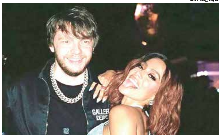
Produtor Murda Beatz se tornou alvo de ataques nas redes sociais

O relacionamento entre Anitta e Murda Beatz foi revelado publicamente pela própria funkeira no dia 12 de junho de 2022. Em abril deste ano, no entanto, os