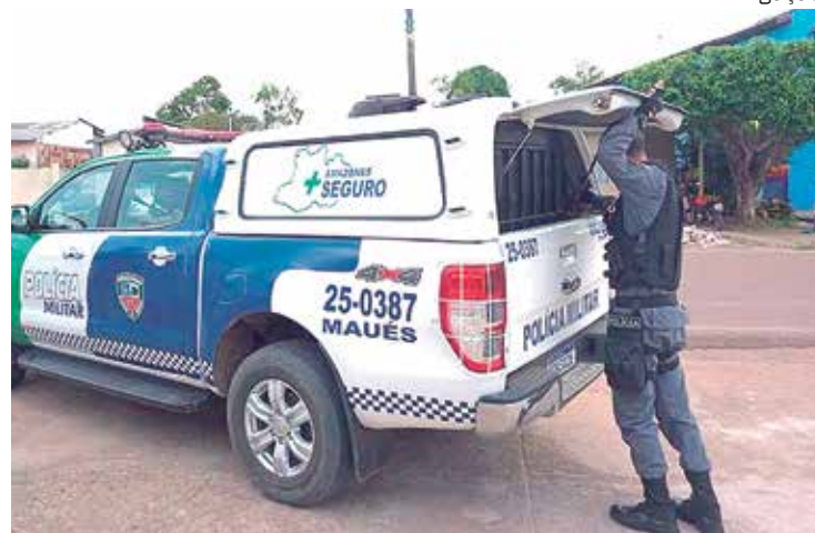
Suspeito de agredir os próprios pais foi preso pela Polícia Militar em Maués