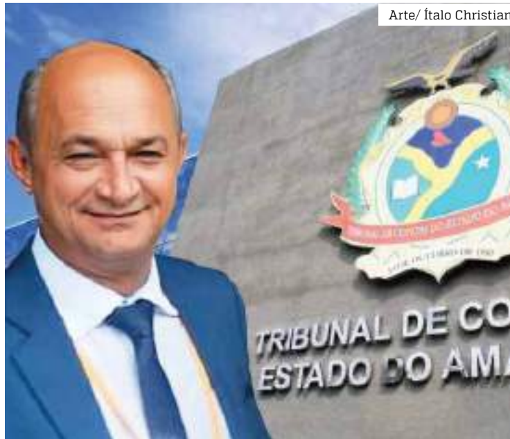
TCE pediu explicações do prefeito sobre gasto de R$ 700 mil

No último dia 17 de agosto, a representação foi publicada no Diário Oficial do