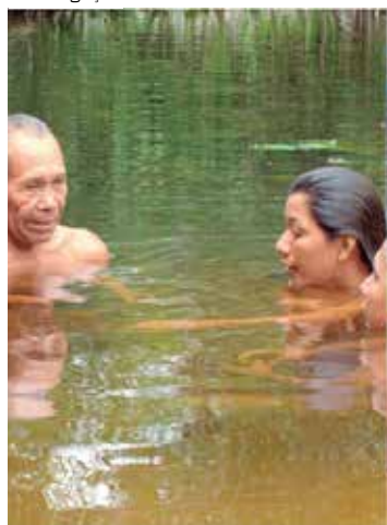
Gravado em Irاندوبا e Manaus, filme ganhou prêmio em festival

O filme "A Terra Negra dos Kawa" (2018) foi destaque na Mostra Independente de Cinema do Nordeste (Micine) e conquistou o prêmio de melhor maquiagem, que foi assinada pelo Franck Padilha. Com direção do cineasta amazonense Sérgio Andrade, o filme tem duração de 90 minutos e foi gravado na Zona Rural de Manaus e em Irاندوبا.