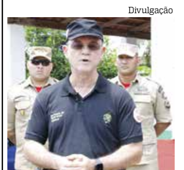
O saldo da ação foi a prisão de cinco e apreensão de drogas

O secretário reforçou que além da operação integrada das polícias, visita teve como objetivo verificar as necessidades de cada uma dessas instalações e as condições de trabalho para melhoria dos serviços prestados à sociedade.