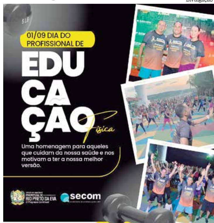
Cesta Básica de jul

co, o profissional de educação física tem o papel não só de conduzir a execução correta dos exercícios, mas guiar o aluno na busca por uma atividade que seja prazerosa e contribua para a recuperação da sua qualidade de vida e felicidade. A pandemia de Covid-19 mostrou o quanto somos essenciais para a manutenção de uma sociedade saudável. Então, mais do que nunca, estamos prontos para exercer nossa função. Temos ainda um caminho longo pela frente para mostrar que os benefícios da prática regular da atividade física vão muito além da estética, mas abrangem uma vida longa e saudável”, acrescenta o presidente do CREF8.