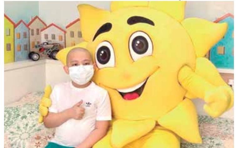
GACC-AM é referência na acolhida das famílias que vêm do interior

O GACC também é contemplado com as parcerias do Governo do Estado do Ama-