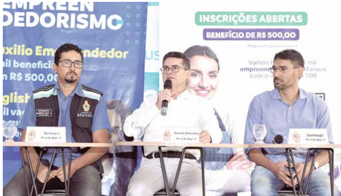
O auxílio é destinado a empreendedores, permissionários e informais maiores de 18 anos em Manaus

"Os empreendedores foram uma das categorias mais prejudicadas com a pandemia. No ano passado, a gente fez o Auxílio Empreendedor. Neste ano, renovamos de R$ 300 para R$ 500, como fizemos também com o Auxílio Aluguel. Estamos também melhorando as estruturas das nossas galerias para que os empreendedores possam ser treinados. Nós