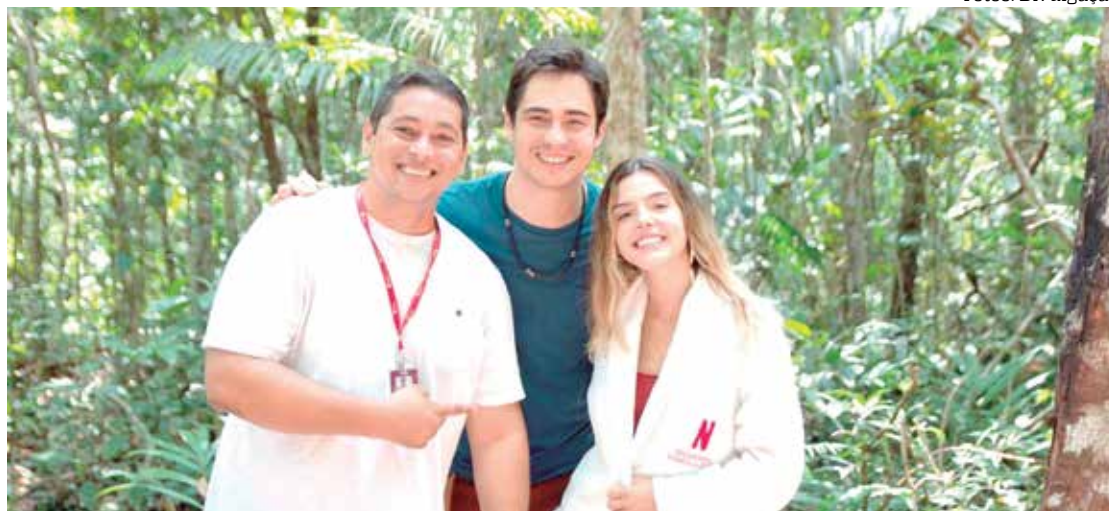
“Ricos de Amor 2” teve ao menos quatro regiões como locação, um deles foi as cachoeiras de Figueiredo

“Fiquei com essas locações todas guardadas na cabeça, então, na hora de desenvolver a história, foi natural escrever essas cenas, essas situações, nesses lugares que eu já conhecia e que já tinham me encantado. Eu queria trazer para história