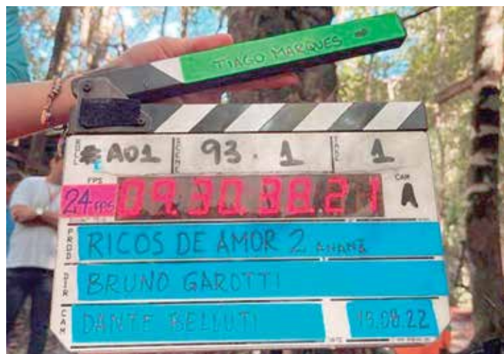
“Ricos de amor 2” será exibido para mais de 170 países, em 24 idiomas

“Costumo falar que agora já não podem mais fazer essas grandes produções audiovisuais sem a gente, nunca mais falar da gente, sem a gente. E “Ricos de Amor” está sendo essa oportunidade de mostrar um conteúdo daqui, trabalhar com gente daqui e esse momento tem sido muito importante na minha carreira, que começou em 2016, esse movimento de retomada indígena, retomada identitária, espiritual”, pontuou.