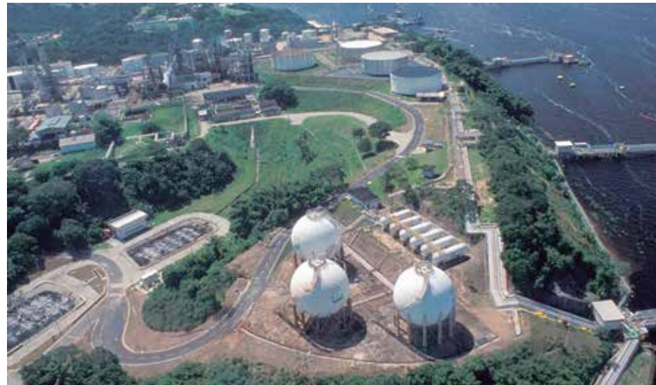
O Grupo está presente em 14 estados do Brasil

O ACC, proposto pela Ream Participações, visa atender às preocupações concorrenciais manifestadas pelo Cade e reforça o compromisso do Grupo Atem de atendimento às obrigações regulatórias e de respeito aos deveres impostos pela legislação concorrencial.