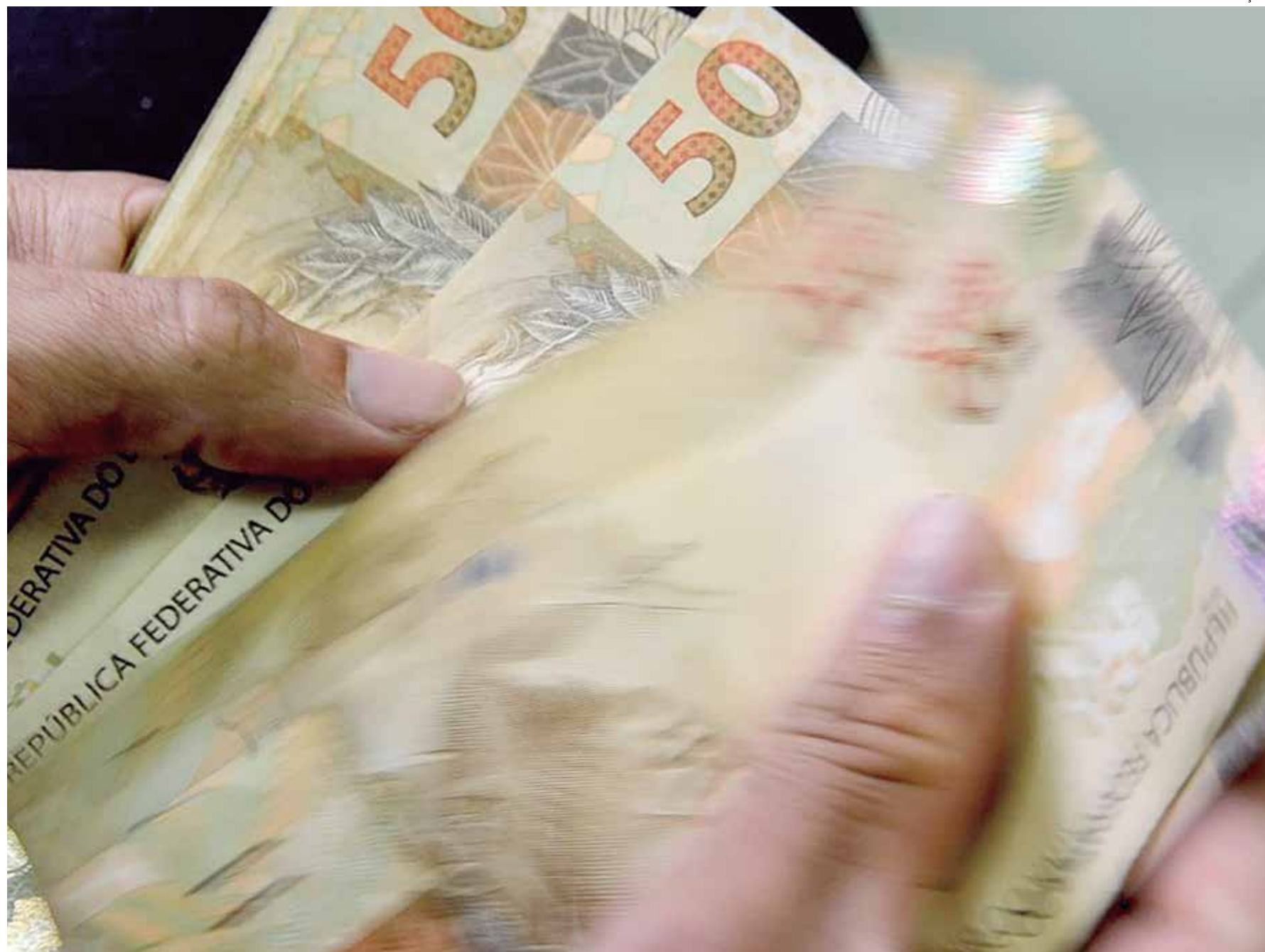
O Ministério da Economia enviou proposta do Orçamento 2023 ao Congresso nesta quarta (31)

Outros parâmetros foram revisados. A proposta do Orçamento prevê que a Taxa Selic (juros básicos da economia) encerrará 2023 em 12,49% ao ano, contra projeção de 9,99% ao ano que constava na LDO. A previsão para o dólar médio caiu de R$ 5,35