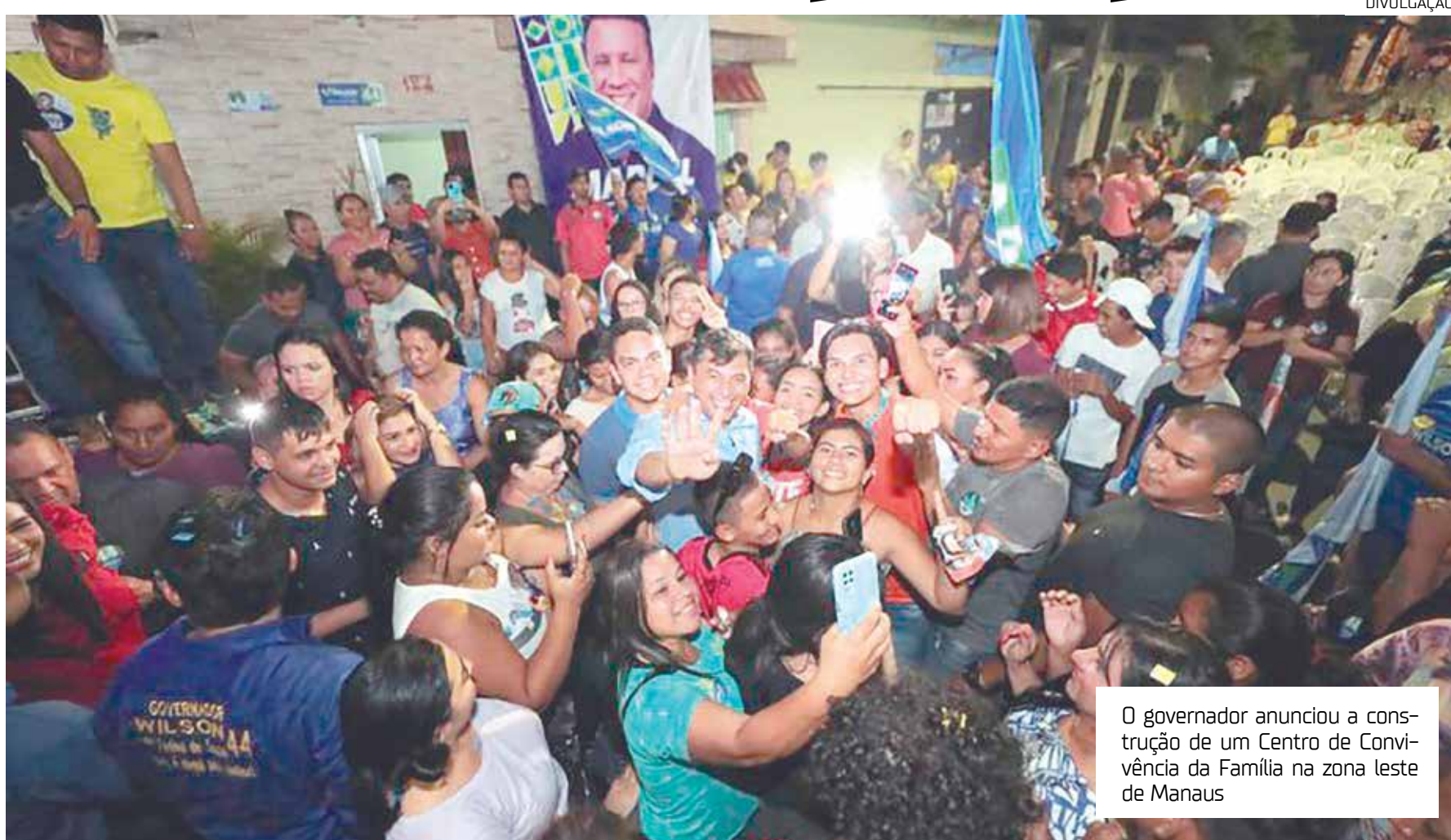
O governador anunciou a construção de um Centro de Convivência da Família na zona leste de Manaus

tre os dias 21 e 23 de agosto em 20 cidades amazonenses. A margem de erro é de três pontos percentuais para mais ou para menos, considerando um nível de confiança de 95%.