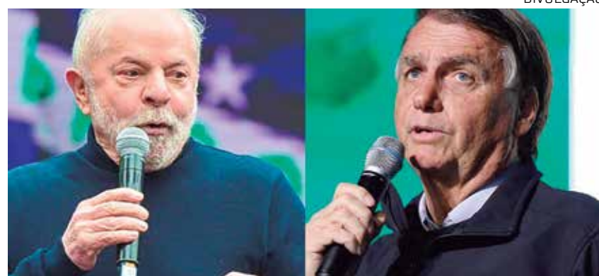
Duas mil pessoas foram entrevistadas face a face

No Sul, é Bolsonaro quem fica numericamente à frente. O atual presidente tem 39%, contra 36% do petista. Mais uma vez empatados dentro da margem de erro. O levantamento feito nas regi-