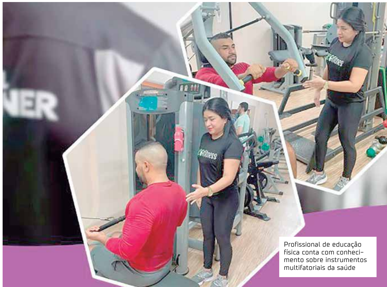
Profissional de educação física conta com conhecimento sobre instrumentos multifatoriais da saúde

A atuação do profissional de educação física sempre foi essencial, mas alcançou ainda mais relevância