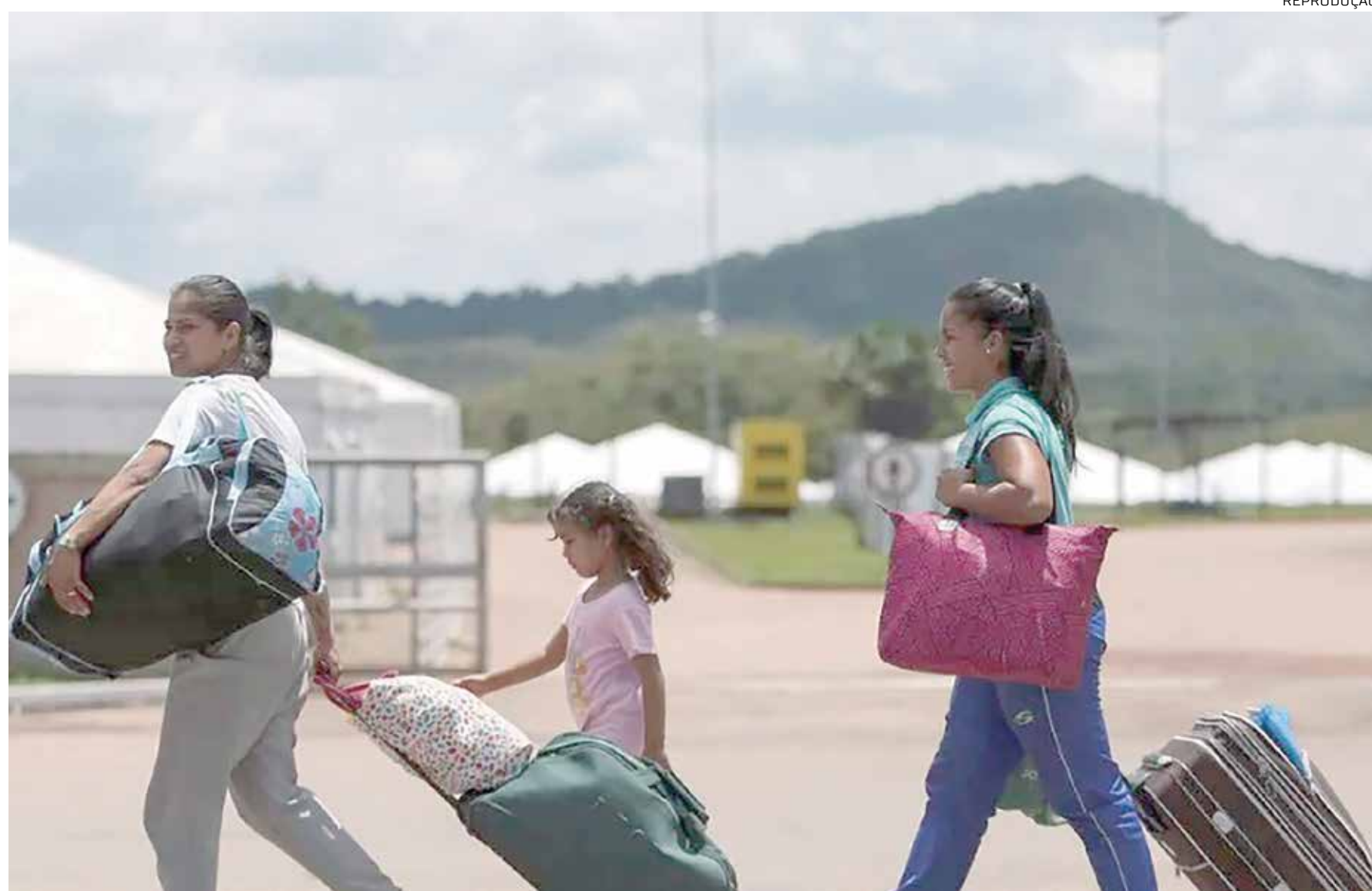
Mais de 6 milhões de venezuelanos fugiram de seu país

“Este ano, os doadores financiaram apenas 13% do plano de resposta humanitária para os ve-