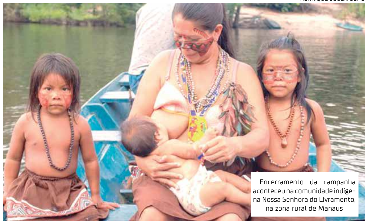
Encerramento da campanha aconteceu na comunidade indígena Nossa Senhora do Livramento, na zona rural de Manaus