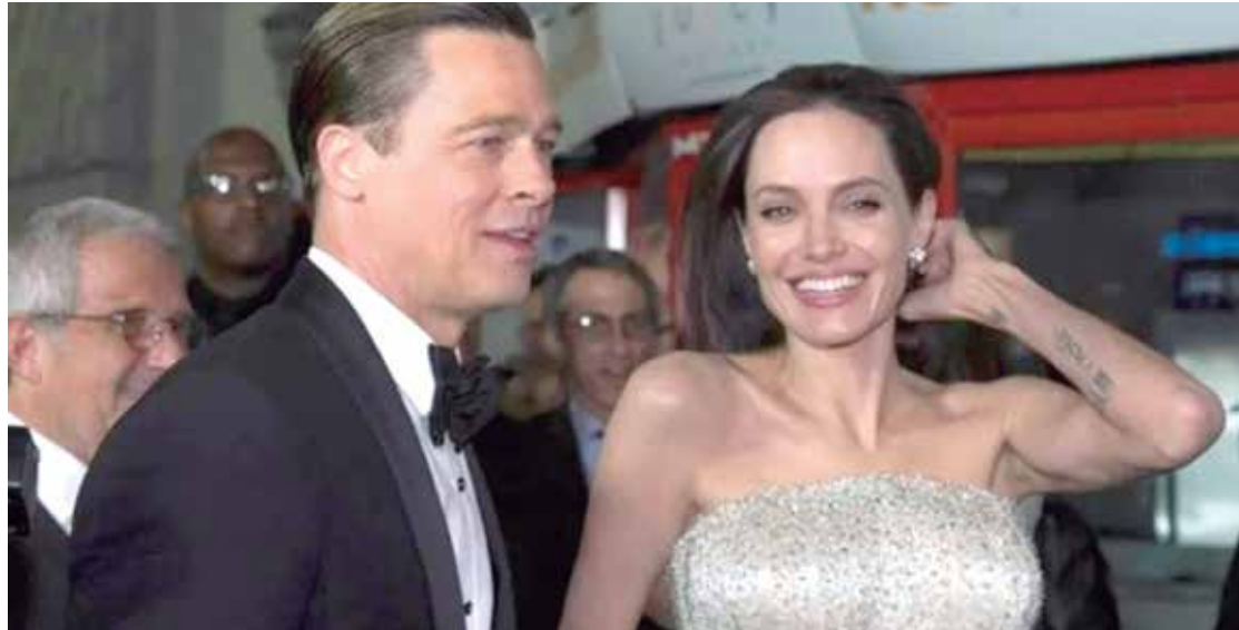
Batalha judicial em torno da venda da vinícola trouxe à tona um e-mail emocionado escrito pela atriz

Ela continua citando o fato de o Miraval ser o local que marca “o início do fim de nossa família – e um negócio que é centrado em álcool”,