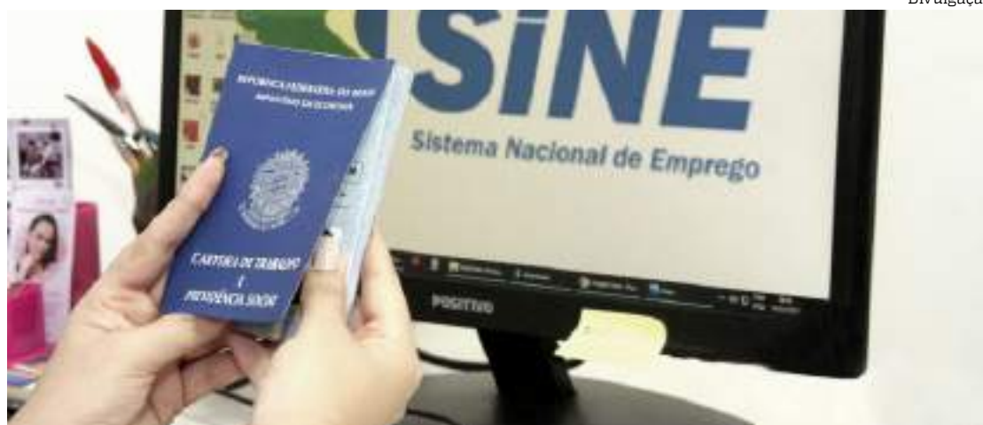
Atendimento no posto do Sine no shopping Phelippe Daou estará suspenso

Não é necessário fazer agendamento prévio para acessar os serviços. A população pode se dirigir aos postos presencialmente, portando os documentos originais e o cartão de vacinação, com o esquema vacinal completo contra a Covid-19, de segunda a sexta-feira, das 8h às 17h.