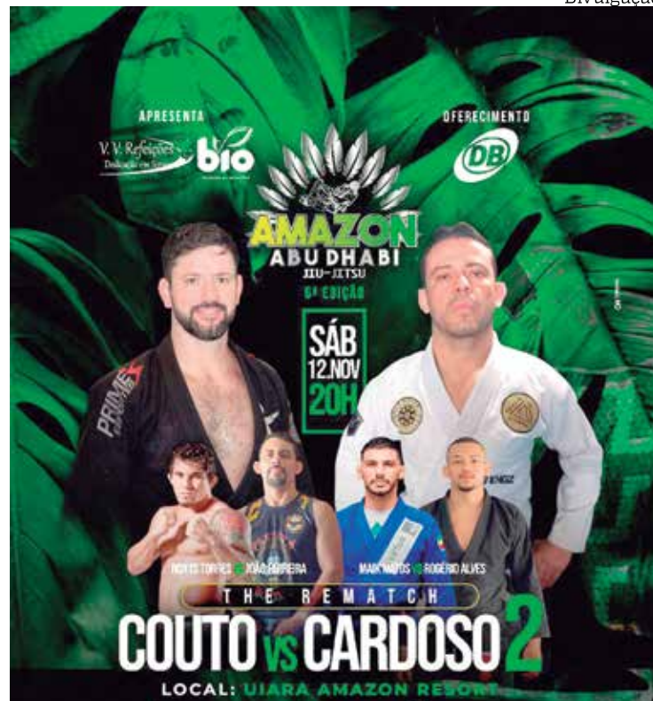
Rivalidade vai tomar conta do tatame no Amazon Abu Dhabi