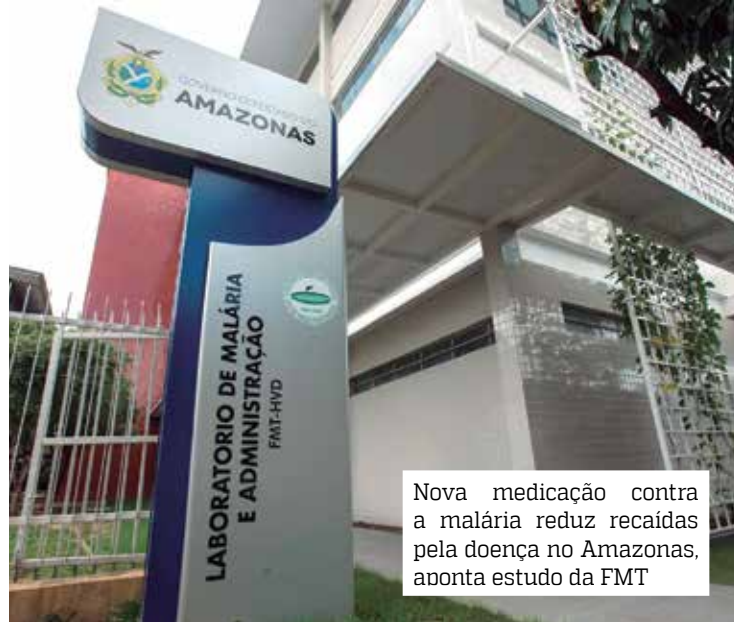
Nova medicação contra a malária reduz recaídas pela doença no Amazonas, aponta estudo da FMT