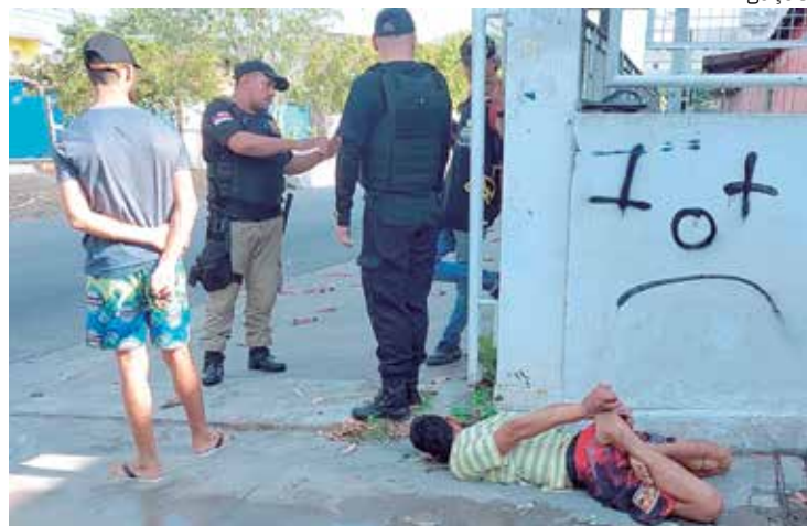
Ladrão fo detido por populares e amarrado no Ouro verde, na ZL

Um assaltante foi detido por populares, na manhã da quinta-feira (13), na Zona Leste da capital amazonense. Ele abordou uma mulher na rua tucano, conjunto Ouro Verde, e obrigou a vítima a entregar a bolsa.