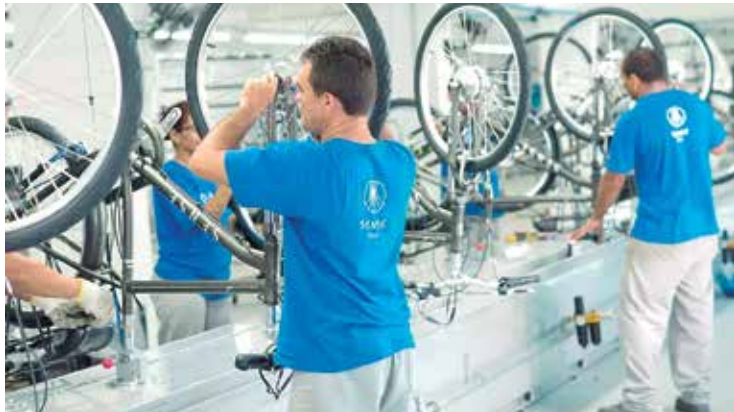
Nova perspectiva é de que as fabricantes produzam 1,42 milhão de motos

Pela segunda vez, a Associação Brasileira dos Fabricantes de Motocicletas, Ciclomotores, Motonetas, Bicicletas e Similares - Abraciclo revisou para cima as projeções para este ano. A nova perspectiva é de que as fabricantes do PIM (Polo Industrial de Manaus) produzam 1.420.000 motocicletas, volume 18,8% superior às 1.195.149 unidades fabricadas no ano passado.