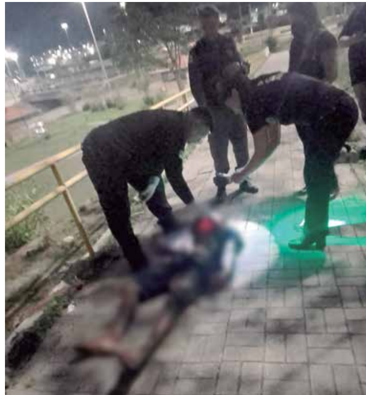
Corpo foi encontrado na avenida 7 de Setembro, no Centro de Manaus

No momento do ocorrido, o homem estava com o filho no colo e só deu tempo de colocá-lo no chão.