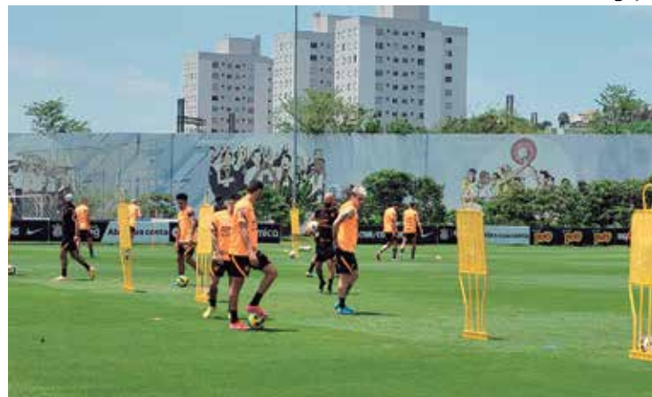
Timão realizou treino tático e físico e em seguida, cobranças de pênaltis