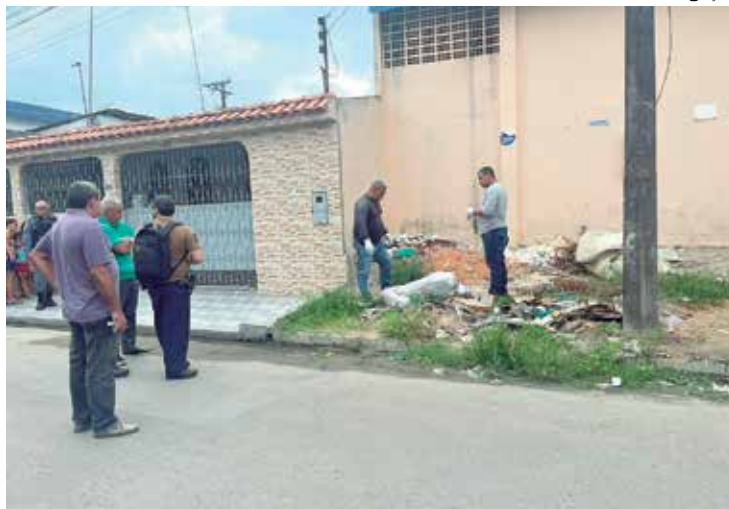
Corpo encontrado no Novo Aleixo estava enrolado em saco plástico

De acordo com a perícia, não havia marca de perfura-