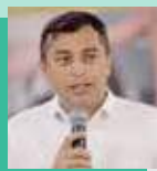
Wilson Lima união Brasil

12h - Almoço com trabalhadores do Distrito Industrial 18h - Entrevista para emissora de TV 19h - Reunião com trabalhadores da saúde