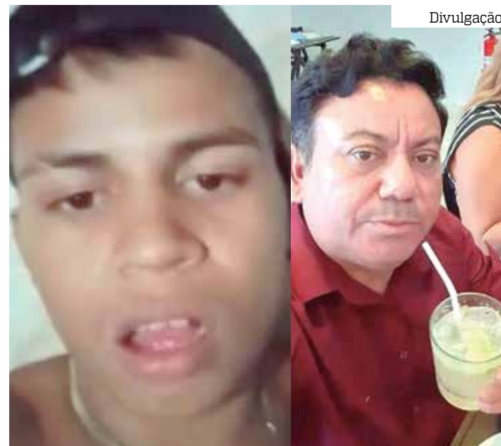
“Menor” morreu ao trocar tiros com policiais militares

“Menor” ressaltou ainda que não sente medo ou receio de ser morto e muito menos de ser preso, pois está se sentindo vingado pela morte.