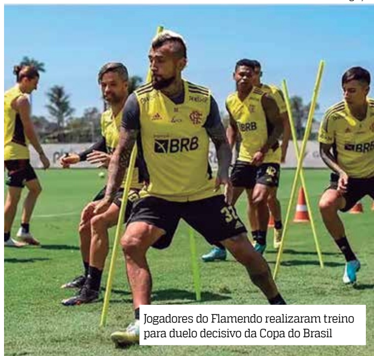
Jogadores do Flamengo realizaram treino para duelo decisivo da Copa do Brasil

Em reta final de preparação para a final da Copa do Brasil, o elenco do Flamengo treinou