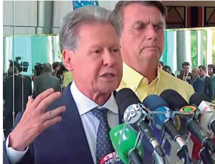
Até pouco tempo, Arthur Neto foi uma figura de oposição a Bolsonaro

No pronunciamento de apoio a Bolsonaro, Arthur Neto afirmou que já teve “rusgas” com o presidente e “guerras nucleares” com