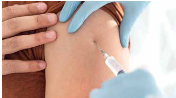
Vacina para a cura do câncer ficará pronta até 2023, garantem especialistas

Em média, uma criança com menos de 5 anos morre de Covid-19 a cada 2 dias no Brasil. Atualmente, os pequenos brasileiros desta faixa etária representam