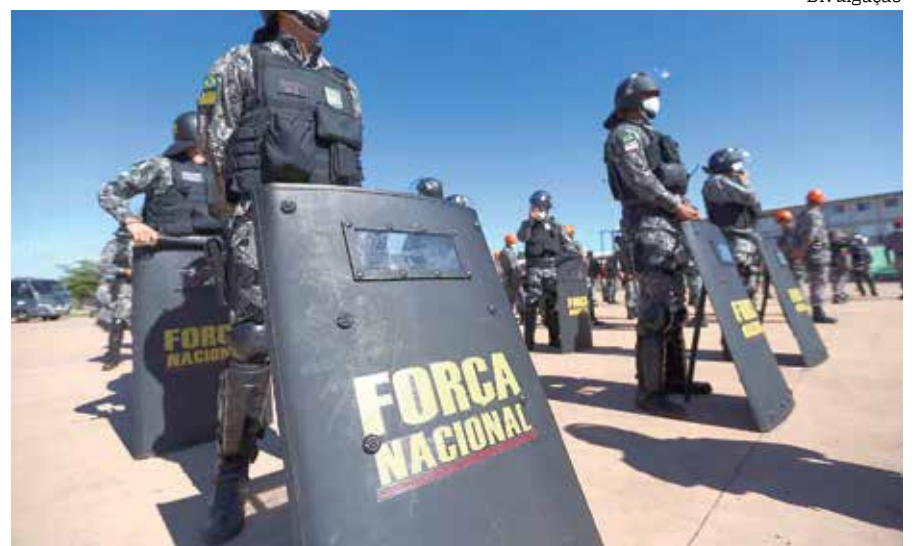
Ministério da Justiça determinou permanência da Força Nacional no AM

A Terra Indígena Camicua foi homologada pelo Decreto nº 381, de 24 de dezembro de 1991. A demarcação administrativa foi realizada pela Funai. A terra é habitada pelo grupo indígena Apurinã, e está localizada no município amazonense de Boca do Acre.