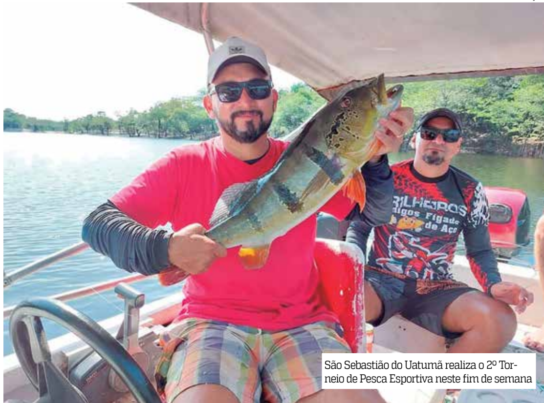
São Sebastião do Uatumã realiza o 2º Torneio de Pesca Esportiva neste fim de semana

No mesmo ambiente ocorrerão torneios de vôlei, futevôlei, Beach Soccer e natação. Todas as competições esportivas terão premiação ao final. Terá também exposição e venda da gastronomia