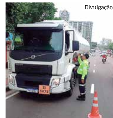
Ação é uma orientação da Prefeitura para o trânsito mais seguro

A circulação de caminhões, fora do horário, só será autorizada após a Autorização Especial de Tráfego.