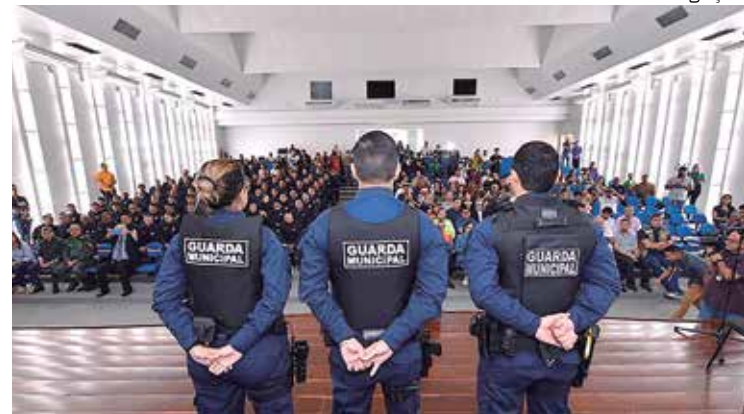
Guardas municipais aprovados em curso reforçam a segurança da capital

“Muitas pessoas e muitas instituições nos ajudaram nesse processo de transformar a história da Guarda Municipal de Manaus. Agradecemos esse apoio. Todos os agentes que receberam o armamento nessa cerimônia já vão atuar com o armamento. Vale ressaltar que ainda vamos continuar utilizando o armamento não letal. A arma de fogo é a última opção, mas vimos, no ano passado, durante os ataques realizados à nossa cidade, que, infelizmente, é necessário, para se impor