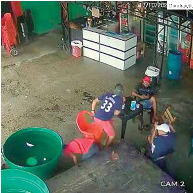
Funcionários de bar foram surpreendidos e mortos por dois pistoleiros

O crime foi registrado por câmeras de segurança do estabelecimento que mostram toda a ação dos criminosos. As três vítimas trabalhavam no