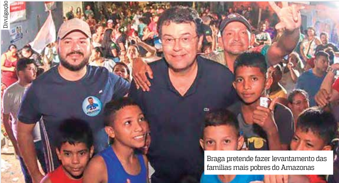
Braga pretende fazer levantamento das famílias mais pobres do Amazonas

O candidato ao Governo do Amazonas pela coligação “Em defesa da vida”, senador Eduardo Braga (MDB) anunciou, na última semana, em reunião com moradores da comunidade Monte Sião, no bairro Jor-