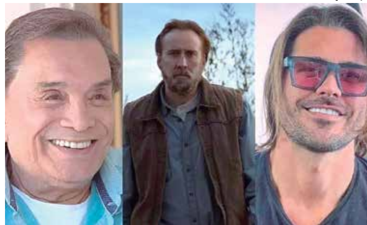
Trajatória de alguns famosos que passam por problemas financeiros

Intérprete do Beicola na série “A Grande Família”, o ator Marcos Oliveira já disse que passa por dificuldades financeiras há alguns anos, algo agravado pela pandemia da covid-19. Ele, que conta com o apoio de um amigo, já chegou a pedir ajuda na web para pagar aluguel, comprar comida e para realizar uma cirurgia. Quem o ajudou nessa última questão, ao conseguir um plano de saúde, foi a humorista Tatá Werneck.