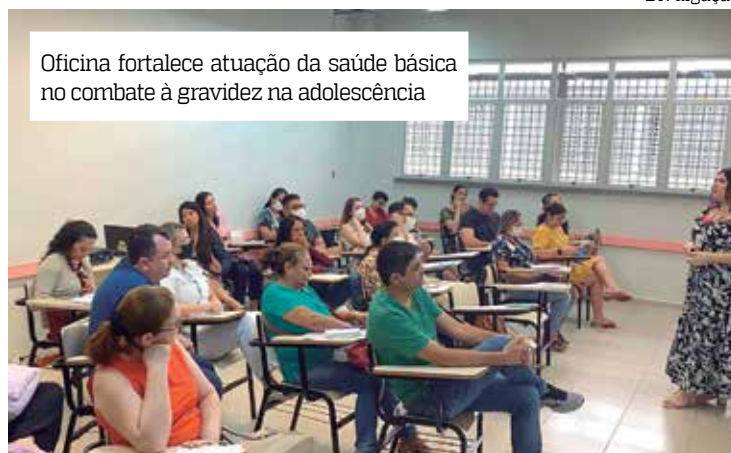
Oficina fortalece atuação da saúde básica no combate à gravidez na adolescência