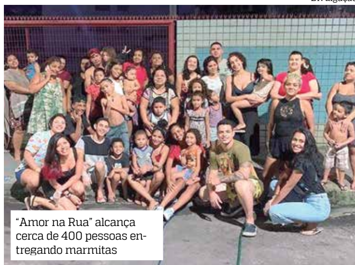
"Amor na Rua" alcança cerca de 400 pessoas entregando marmitas

"Teve um dia em que eu não tinha almoçado, estava terminando umas vendas, fui até o Centro para comprar materiais para o brigadeiro e fiquei na parada de ônibus do Plaza. Assim eu encontrei