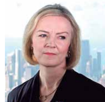
Liz Truss pediu desculpa por “erros” em seu programa

“Estou ficando por aqui porque fui eleita para trabalhar por este país. E é isso que estou determinada a fazer.”