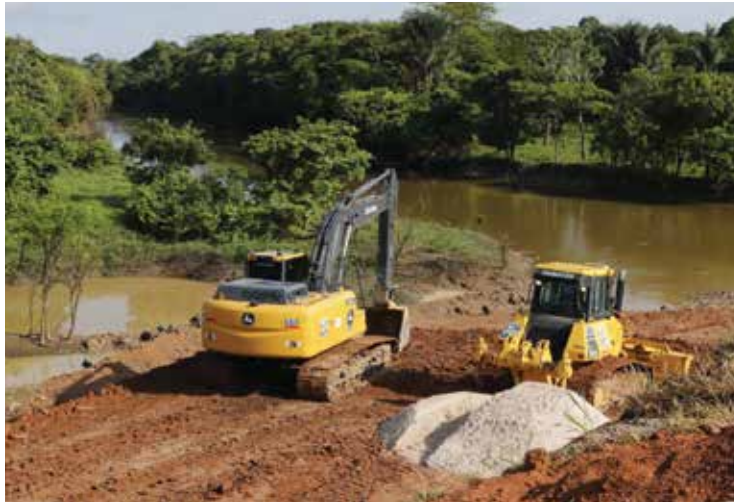
Mergulhadores vasculham a área em busca de vítima do acidente

O CBMAM solicitou ao Dnit, responsável pela construção, manutenção e fiscalização da área, um guindaste para que a carreta seja retirada do rio. Po-