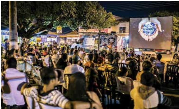
Cinema movido a energia solar é a proposta do CineSolarzinho

A magia do cinema movido a energia solar é a proposta do CineSolarzinho, que chega pela primeira vez ao Amazonas, com atividades culturais para a população de Manaus.