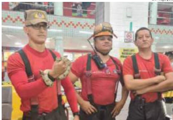
Cobra estava escondida em brinquedo dentro de sorveteria de Manaus

A jiboia é uma serpente do grupo das constrito-