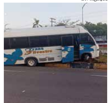
Motorista perdeu o controle do veículo e colidiu contra "semáforo"