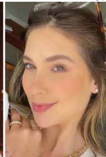
Após se posicionarem, celebridades relataram que foram alvo de críticas, ataques e perderam seguidores

res votassem seguindo a própria realidade, se referia ao fato de a pessoa seguir a própria opinião e não se deixar levar pelo que o outro diz.