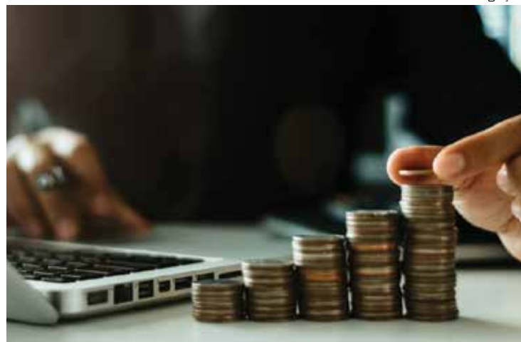
Próximo governador precisará enfrentar os desafios econômicos

“É preciso equacionar os problemas administrativos do estado organizando a estrutura, resolver a relação trabalhista com as diversas categorias, em especial na saúde e equacionar a questão do déficit previdenciário. A meu ver é inevitável a reforma previdenciária. O