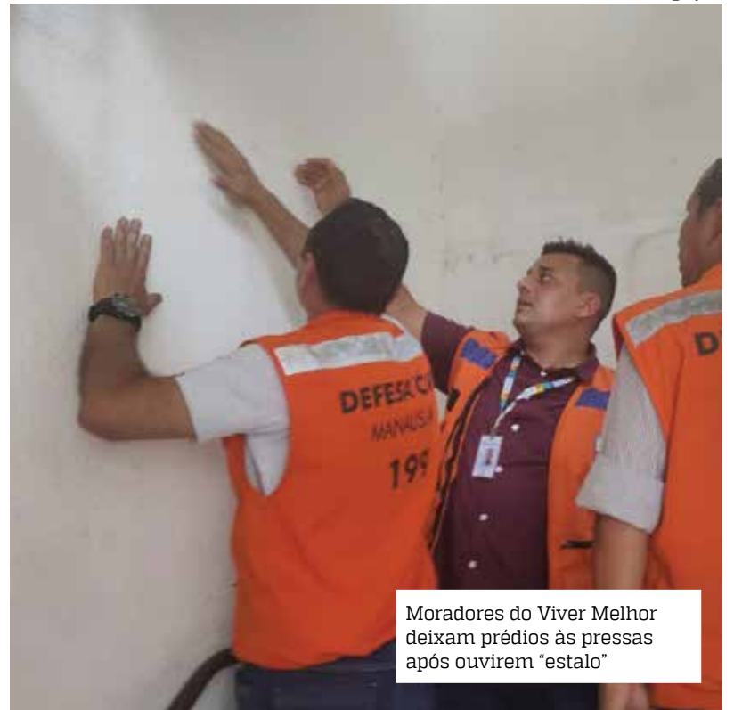
Moradores do Viver Melhor deixam prédios às pressas após ouvirem "estalo"