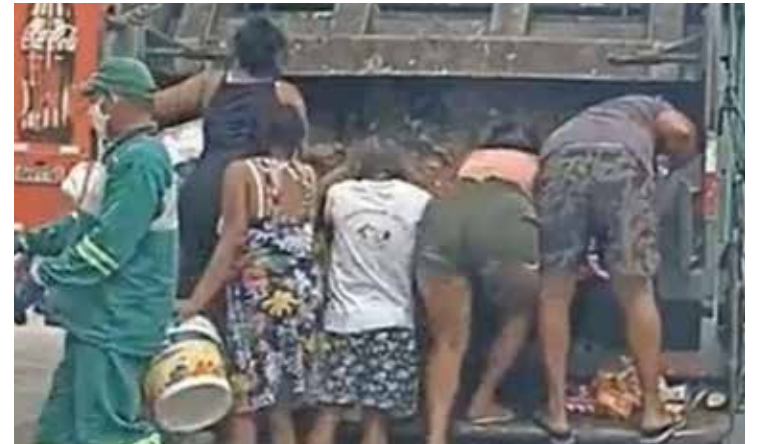
Dados mostram que reajuste no Auxílio Brasil não mudou o quadro da fome

Segurança alimentar: a família tem acesso regular