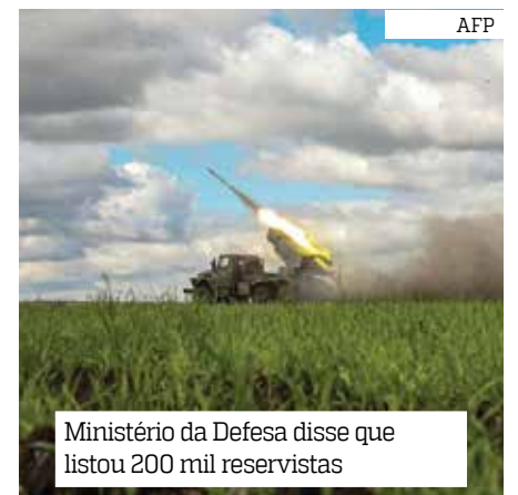
Ministério da Defesa disse que listou 200 mil reservistas

rece fazer muito sentido, mas esta é uma carta que o Kremlin tem usado com frequência desde o começo do conflito. Ao decretar a anexação de quatro áreas ucranianas em que não tem controle total, Putin elevou a aposta, dizendo que elas seriam defendidas com “todos os meios possíveis” —e isso inclui o maior arsenal atômico do mundo.