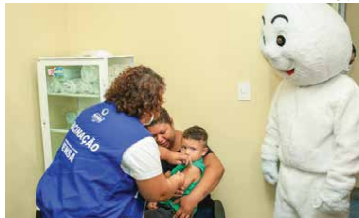
Estratégias da prefeitura buscam ampliar vacinação contra o sarampo

A Semsa também realiza a “Semana Negativa”, quan-