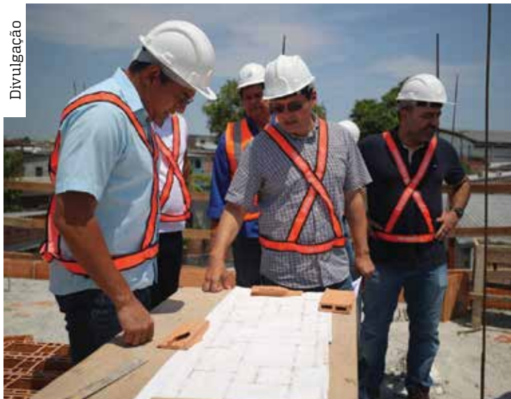
Entrega do espaço habitacional está prevista para dezembro deste ano

O governador Wilson Lima vistoriou, na terça-feira (4), o andamento das obras do conjunto habitacional do Programa Social e Ambiental dos Igarapés de Manaus e Interior (Prosamin+) no bairro Japiim, Zona Sul de Manaus. Previsto para ser entregue em dezembro deste ano, o residencial localizado na avenida Rodrigo Otávio está com obras avançadas alcançando 50% de execução dos trabalhos até o momento.