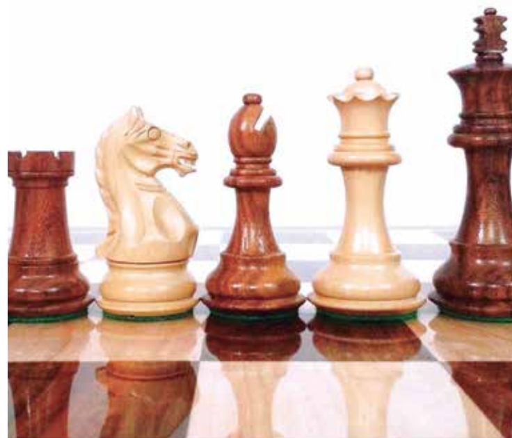
Manaus Chess Open acontece no dia 10 deste mês no Novotel