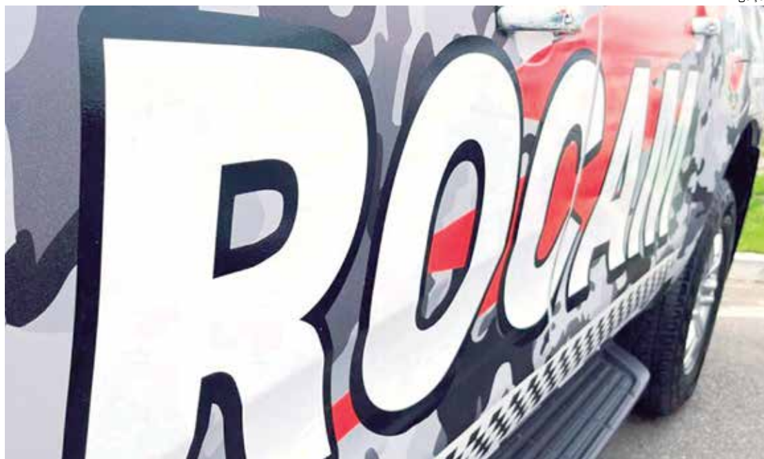
Homem baleado pela Rocam foi levado ao 28 de Agosto

Ao chegar ao bairro Educandos, a equipe foi recebida a tiros pelos criminosos. Os policiais reagiram e, durante o tiro-