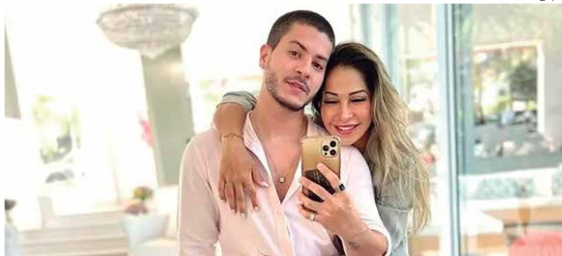
Relacionamento de Máira Cardi e Arthur Aguiar é pontuado por uma série de idas e vindas

Em 2020, Máira Cardi revelou, por meio de um vídeo publicado em redes sociais, que Arthur Aguiar, com quem mantinha um relacionamento à época, havia cometido várias traições enquanto ela ainda amamentava a filha Sofia, de 3 anos. Na ocasião, ela chamou o marido de "pistoleiro, no-