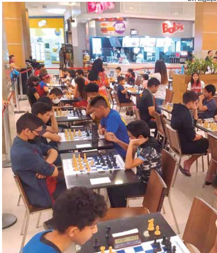
Pela 1ª vez, Manaus recebe campeonato internacional de xadrez

Na segunda-feira (10), serão realizados os torneios oficiais do Manaus Chess Open, desta vez no Novotel, onde terão jogadores da Argentina, Para-