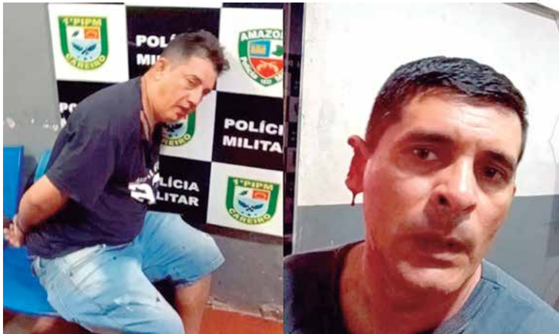
Capitão da Polícia Militar teve pedaço da orelha arrancado por detento na cidade de Careiro Castanho

O policial conseguiu deter o suspeito, no entanto, o outro indivíduo que estava no local no momento da ocorrência conseguiu fugir. O autor da mordida está custodiado no Batalhão da Polícia Militar no município.