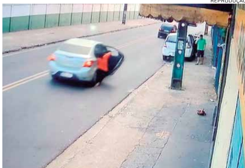
Caso foi flagrado por câmeras de segurança da rua, na Zona Oeste da cidade

A idosa informou, ao registrar a ocorrência, que após o filho dela guardar o refrigerante, a motorista afirmou que não iria continuar a corrida e requisitou que ela saísse do veículo.