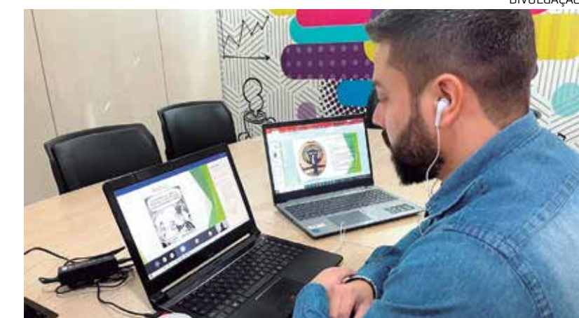
O evento ocorre na próxima segunda-feira

"A palestrante da semana vai abordar o tema "redes sociais", trazendo as melhores técnicas para atrair e fidelizar o público-alvo na internet, principalmente na rede Instagram. A palestra é direcionada aos empreendedo-