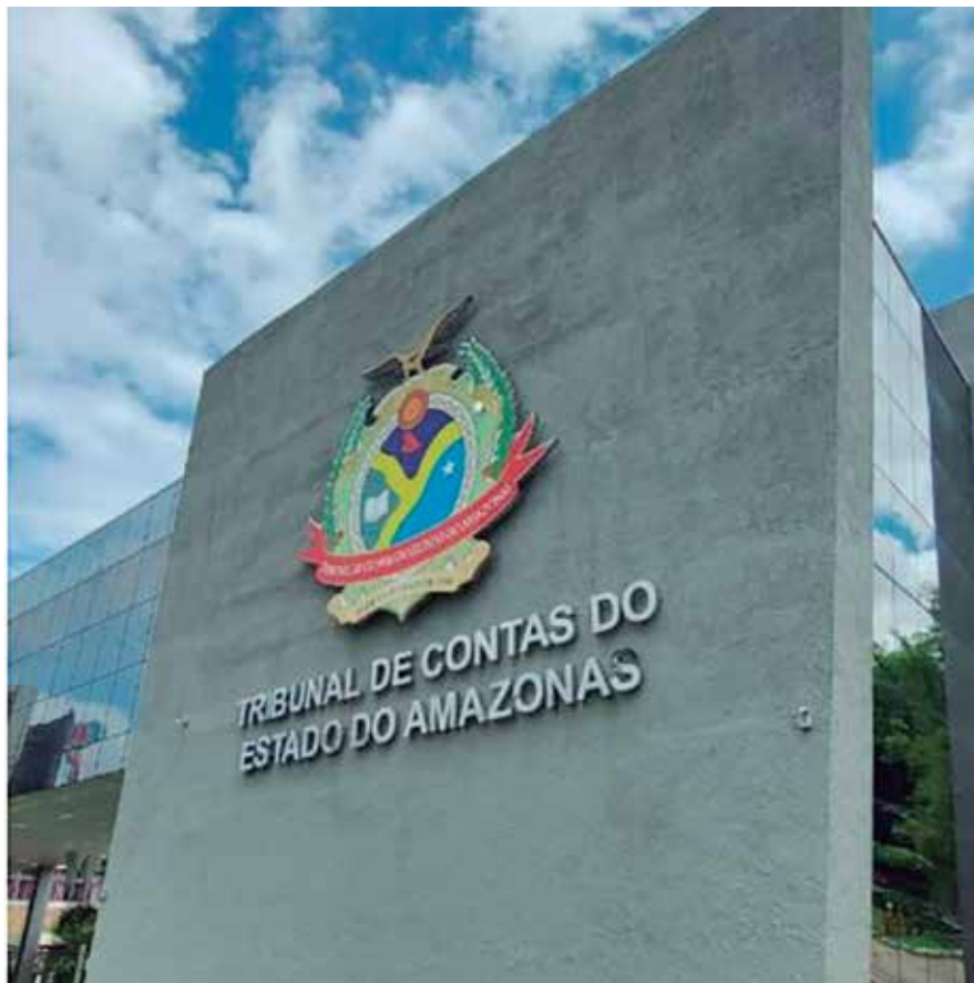
TCE-AM reavaliou caso envolvendo o cantor e o festival do município de Novo Airão

Ao Em Tempo, o procurador geral do município de Novo Airão, Otavio de Cruz Farias, informou que diversos setores econômicos da região irão se