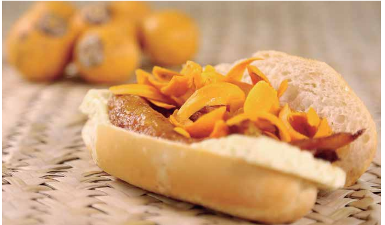
X-caboquinho é um dos pratos preferidos do amazonense e conta com o tucumã na "receita"