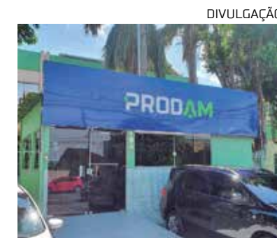
Os portões fecharão às 15h45

Para realizar a prova, os candidatos deverão apresentar documento de identidade original, comprovante de inscrição e caneta esferográfica de tinta azul ou preta.