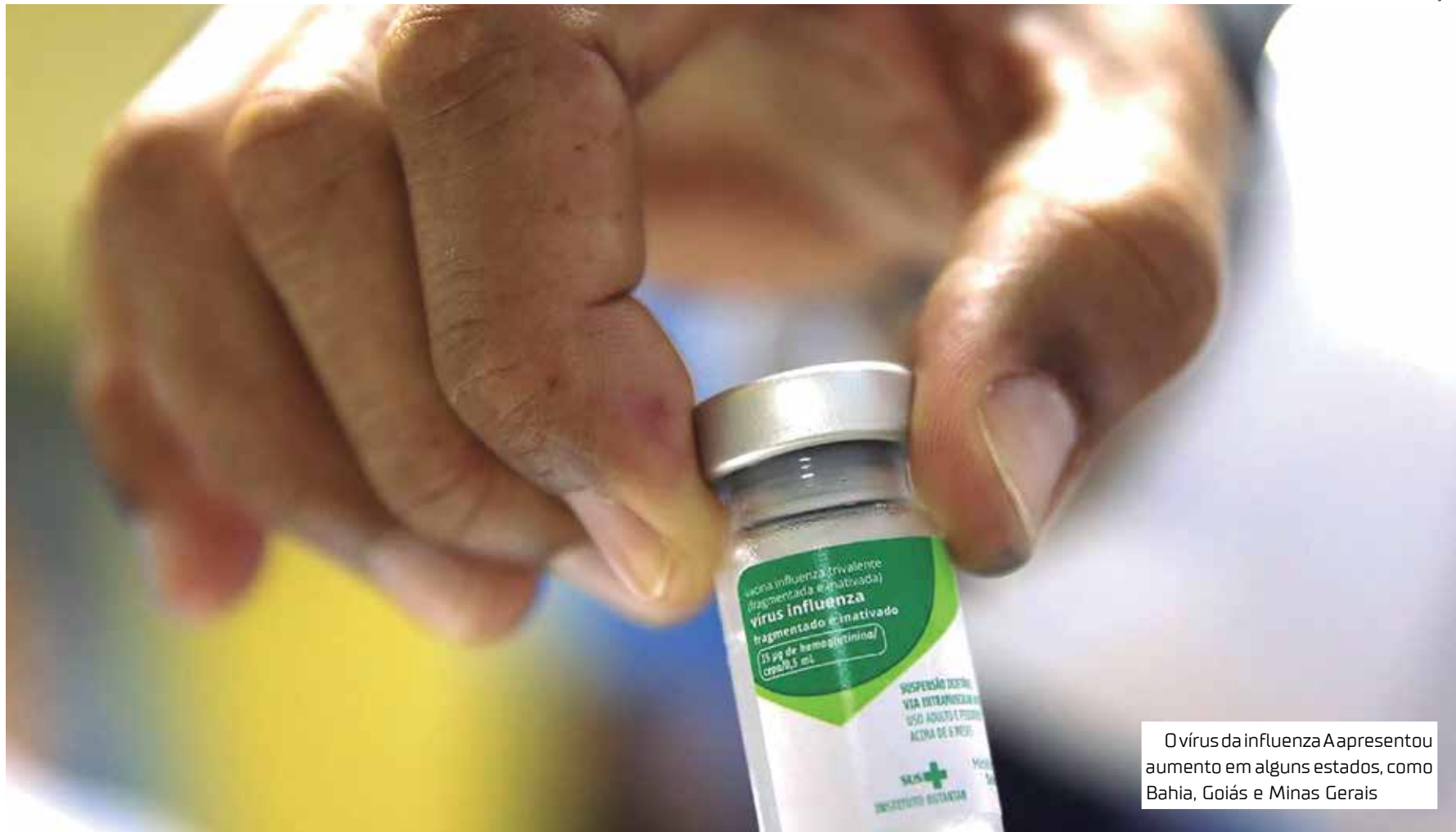
O vírus da influenza A apresentou aumento em alguns estados, como Bahia, Goiás e Minas Gerais

ção, os dados inseridos no Sistema de Informação de Vigilância Epidemiológica (Sivep-Gripe) até 10 de outubro. A análise corresponde ao período de 2 a 8 de outubro.