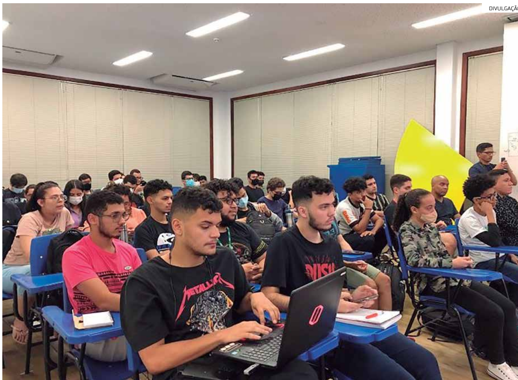
O evento ocorre entre os dias 19 e 22

Além disso, o Asac 22 cria um espaço promissor para a divulgação dos resultados dos projetos Científicos, Tecnológicos, de Inovação e Sustentabilidade desenvolvidos por alunos e professores dos cursos de Engenharia do projeto Academia Stem, fruto da parceria entre UEA com a Samsung e que possui como missão capacitar e formar profissionais, oferecendo uma estrutura de ações, atividades, iniciativas e programas voltados aos cursos de