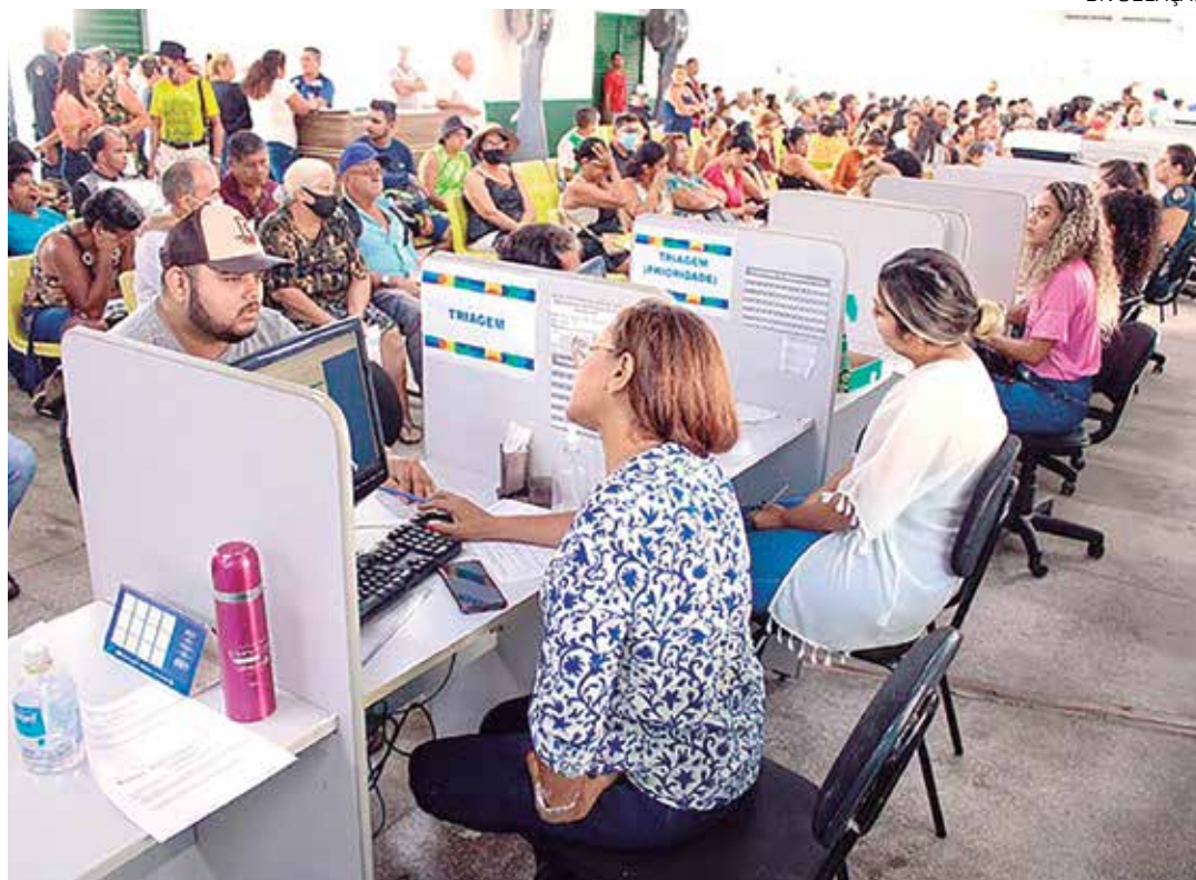
O sistema inclui famílias de baixa renda em programas federais

Ainda não foi definida a data de bloqueio para os cadastros das famílias que realizaram a última atualização nos anos 2018, 2019 ou 2020. O Cadastro Único (CadÚnico) é a forma principal do governo de incluir famílias de baixa renda em programas federais como Tarifa Social de Energia Elétrica (TSEE) e Benefício de Prestação Continuada (BPC).