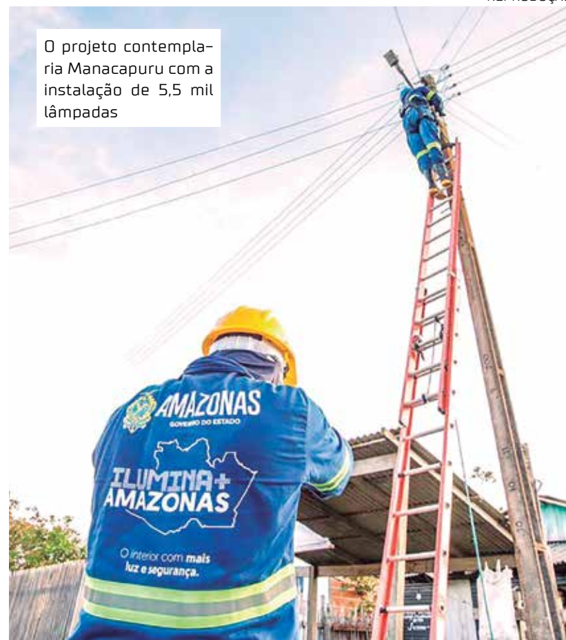
O projeto contemplaria Manacapuru com a instalação de 5,5 mil lâmpadas

"Nós, como manacapurenses, jamais abriríamos mão de qualquer ajuda que viesse para o nosso município. Essas luminárias, nós informamos à equipe, que não eram possíveis de serem instaladas, porque Manacapuru já tem um contrato de concessão de colocação de luminárias. Portanto, haveria conflito no contrato. Desta forma inviabiliza a implantação das luminárias LED", explicou o prefeito de Manacapuru. O prefeito também destacou que suas divergências políticas não têm influência nas decisões para o município. "Aqui está um prefeito que sempre procurou ajuda, e que sabe que o município de Manacapuru precisa. Nós, independente de divergências políticas, ou se é que existe por eu ter escolhido um candidato, mas a minha posição sempre foi em benefício da nossa cidade", afirmou.