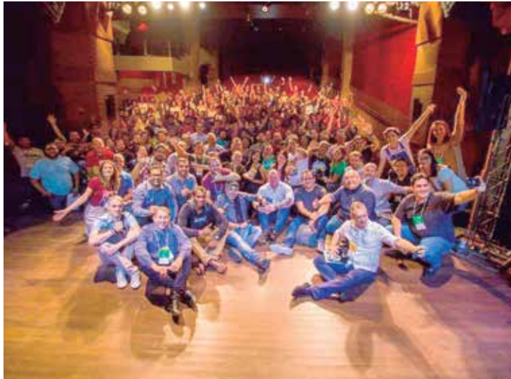
O evento deste ano conta com os melhores fotógrafos do país

O maior evento de fotografia do Norte e um dos maiores do Brasil, já está em contagem regressiva para acontecer em Manaus, com o tema “O Recomeço”. O evento era previsto para março desse ano mas teve que ser remarcado para os próximos dias 15 e 16 de novembro em virtude da pandemia.