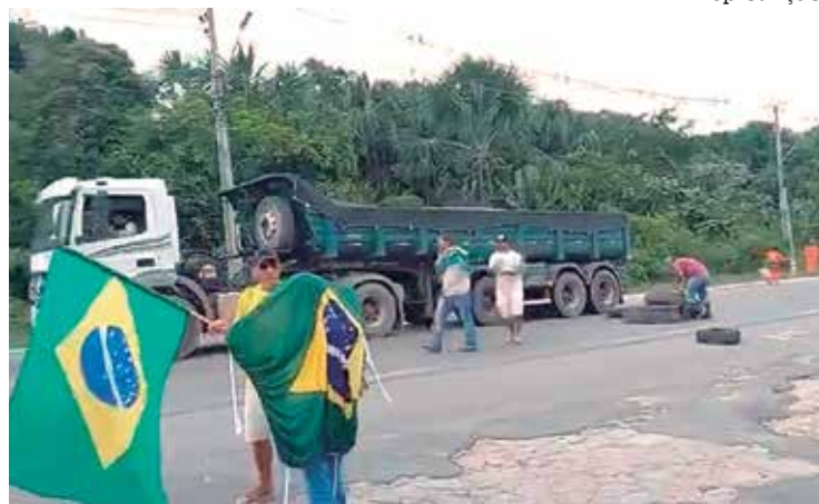
No Amazonas, caminhoneiros bolsonaristas protestam na BR 174

Após o fim da apuração dos votos do segundo turno das eleições para a presidência do Brasil que resultou na vitória do candidato Luiz Inácio Lula da Silva (PT), caminhoneiros e eleitores apoiadores de Jair Bolsonaro (PL), candidato derrotado nas eleições foram para as rodovias para mostrar a sua indignação com o resultado. Rodovias de 14 estados e o Distrito Federal foram ocupadas pelos manifestantes.