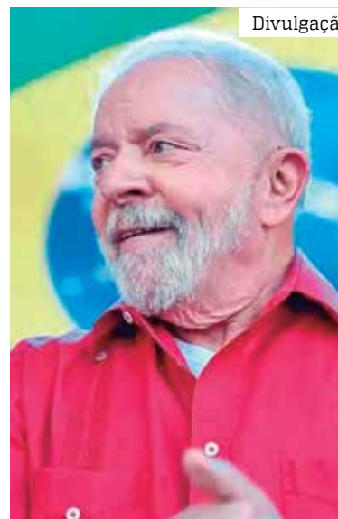
Bolsonaro não se manifestou sobre a derrota nas urnas

O processo de transição é regulado por uma Lei de 2002 e por um decreto de 2010, e serve para deixar a equipe do presidente eleito a par da situação deixada pela gestão anterior e preparar os primeiros atos a serem editados pelo novo governo.