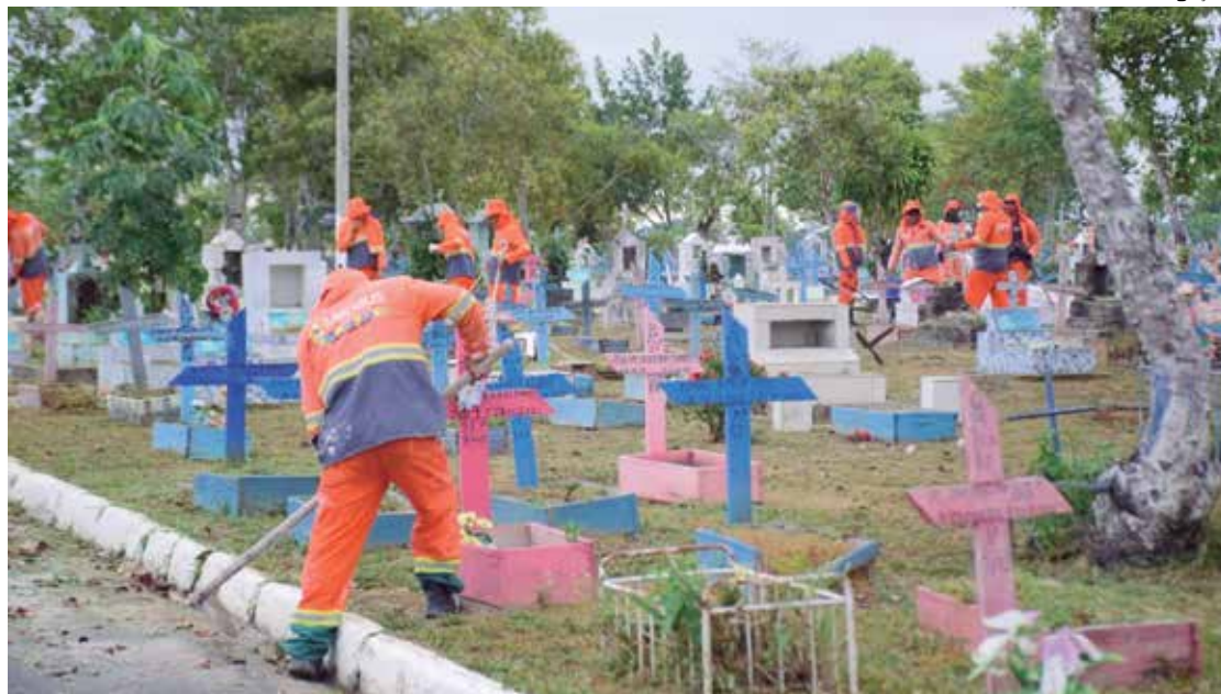
Prefeitura de Manaus montou uma logística para atender os visitantes nos 10 cemitérios da capital

A Fundação Municipal de Cultura, Turismo e Eventos (Mauscult) providenciou o palco e mais de 500 cadeiras para atender todos que participarem da missa campal na praça Chile. A Secretaria Municipal de Agricultura, Abastecimento, Centro e Comércio