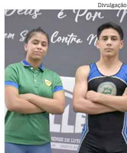
Atletas amazonenses buscam trazer para casa o título inédito