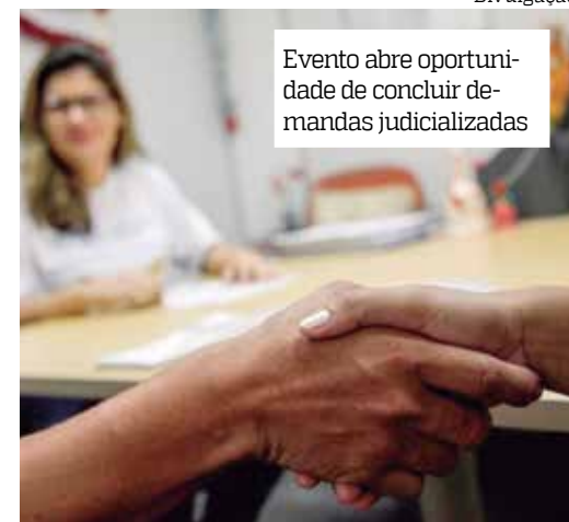
Evento abre oportunidade de concluir demandas judicializadas

No período do mutirão - de 7 a 11 de novembro - conforme informado na Portaria nº 211/2022 pelo corregedor-geral de Justiça do Amazonas, desembargador Anselmo Chixaro, as unidades judiciárias que participarão do mutirão, atuarão em horário estendido: das 8h às 16h30, de modo a atender às demandas programadas.