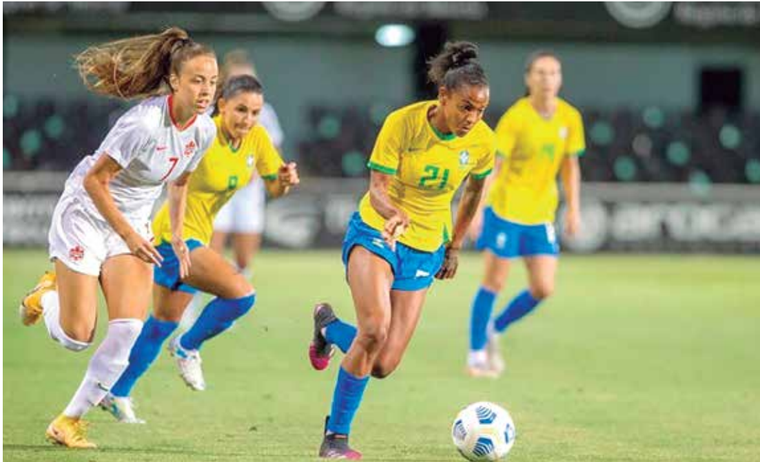
Com dez vitórias consecutivas, Seleção se prepara para a Copa do Mundo

Com dez vitórias consecutivas, 33 gols marcados e apenas um sofrido, a equipe comanda por Pia Sundhage terá mais um grande teste na preparação para o Mundial, cujos adversários foram conhecidos no dia 22 de outubro. Na primeira fase, o Brasil está no Grupo F e irá enfrentar a seleção que se classificou na repescagem (China Taipei, Panamá, Para-