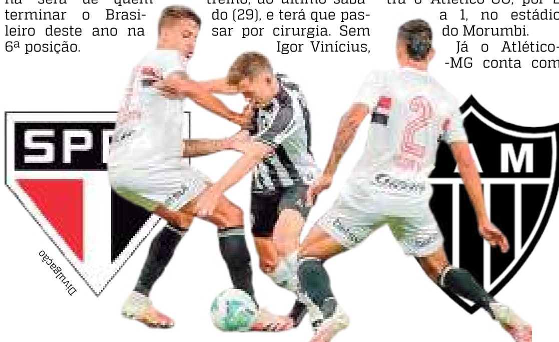
Times competem na busca por uma vaga na Copa Libertadores

O encontro de São Paulo e Atlético-MG no primeiro turno do Campeonato Brasileiro terminou em um empate sem gols.