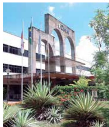
Projeção do orçamento para 2023 é de R$ 8,5 bilhões

Estimativa orçamentária A projeção do orçamento da Administração Direta para 2023 é de R$ 8,5 bilhões, 19% maior do que o de 2022, quando o orçamento foi de R$ 7,1 bilhões.