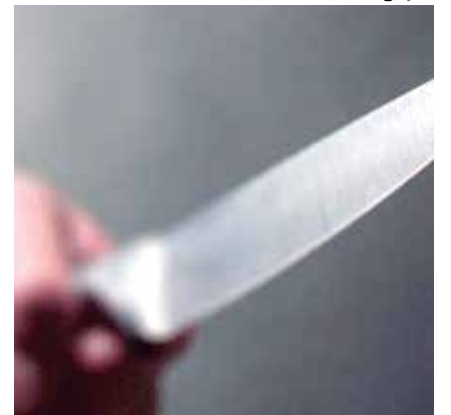
Procurado por quase 20 anos, homem foi finalmente preso