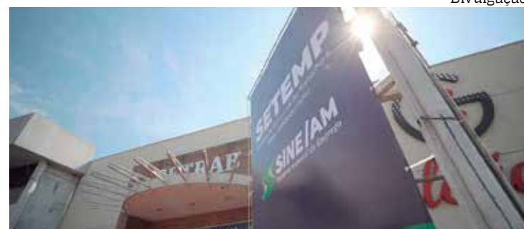
Sine Amazonas atenderá mais bairros de Manaus e municípios do interior

“Os lojistas estão preparados para gerar 5,5 mil empregos, vamos ultrapassar em 37% o ano passado. Temos um aumento no 13º salário pelo número de pessoas que estão sendo empregadas do ano passado