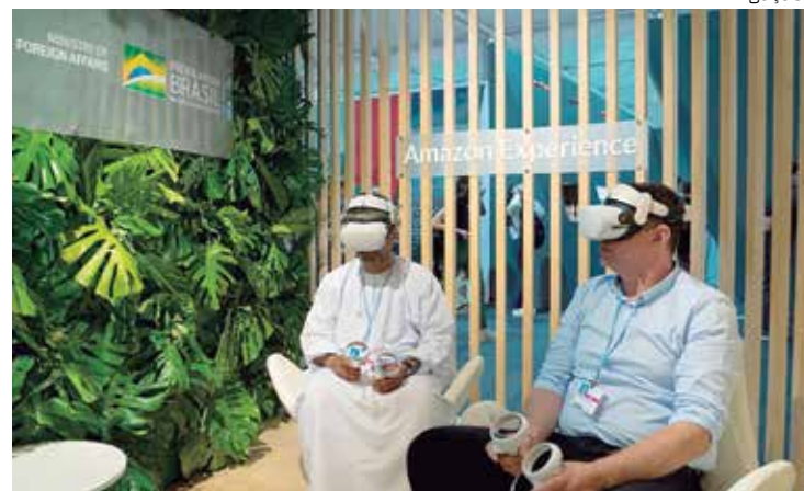
Visitantes podem assistir apresentação em realidade virtual

O presidente eleito Luiz Inácio Lula da Silva (PT) vai