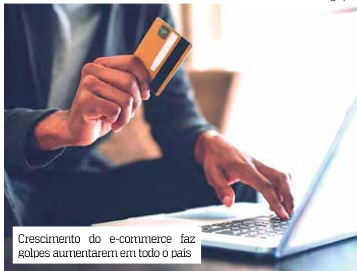
Crescimento do e-commerce faz golpes aumentarem em todo o país

Com a proximidade das tradicionais vendas promocionais da Black Friday, a empresa de Processamento de Dados Amazonas S.A (Prodam), alerta a população dos principais cuidados para combater golpes virtuais no e-comércio neste mês de novembro.