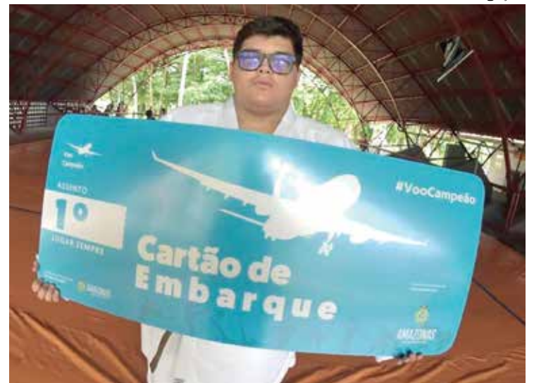
Judoca participa da competição, que visa às Olimpíadas de Paris, em 2024