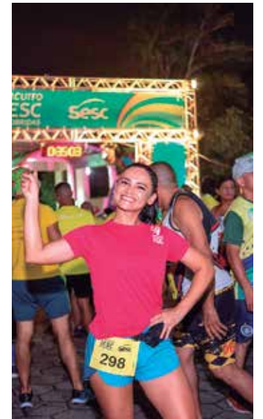
Meia Maratona será disputada em circuito fechado

Caminhada Trabalhador do Comércio - R$ 65,00 + taxa do site; Individual Público em Geral - R$ 90,00 + taxa do site; Individual Trabalhador do Comércio - R$ 70,00 + taxa do site; Dupla Público em Geral - R$ 180,00 + taxa do site; Dupla Trabalhador do Comércio - R$ 140,00 + taxa do site; Quarteto Público em Geral - R$ 360,00 + taxa do site; Quarteto Trabalhador do Comércio - R$ 280,00 + taxa do site; Infantil Dependente de Público em Geral - R$ 70,00 + taxa do site; Infantil Dependente de Trabalhador do Comércio - R$ 50,00 + taxa do site; e Pessoa com Deficiência (PcD) - Gratuito.