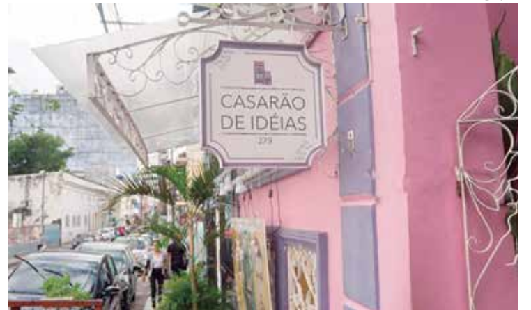
Casarão de Ideias é localizado na Rua Barroso, 279, bairro Centro

O público poderá acompanhar, ainda, as produções que estão na programação do Festival de Cinema Italiano. Na quarta-feira (9), às 19h30, será exibido ‘Hill Of Vision - A Incrível História de Mario Capecchi’, de Roberto Faenza. Na quinta-feira, às 15h30, ocorre a exibição de ‘A Moça Com a Valise’, de Valerio Zurlini. E por fim, no sábado, às 15h30, será ‘Pão, Amor e Fantasia’, de Luigi Comencini.