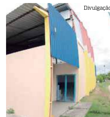
Investimentos incluem construções e revitalizações

“O Governo do Estado foi muito sábio em beneficiar a população do interior com centros de convivência para idosos, para trazer diversas atividades para público da terceira idade e também para a juventude.”