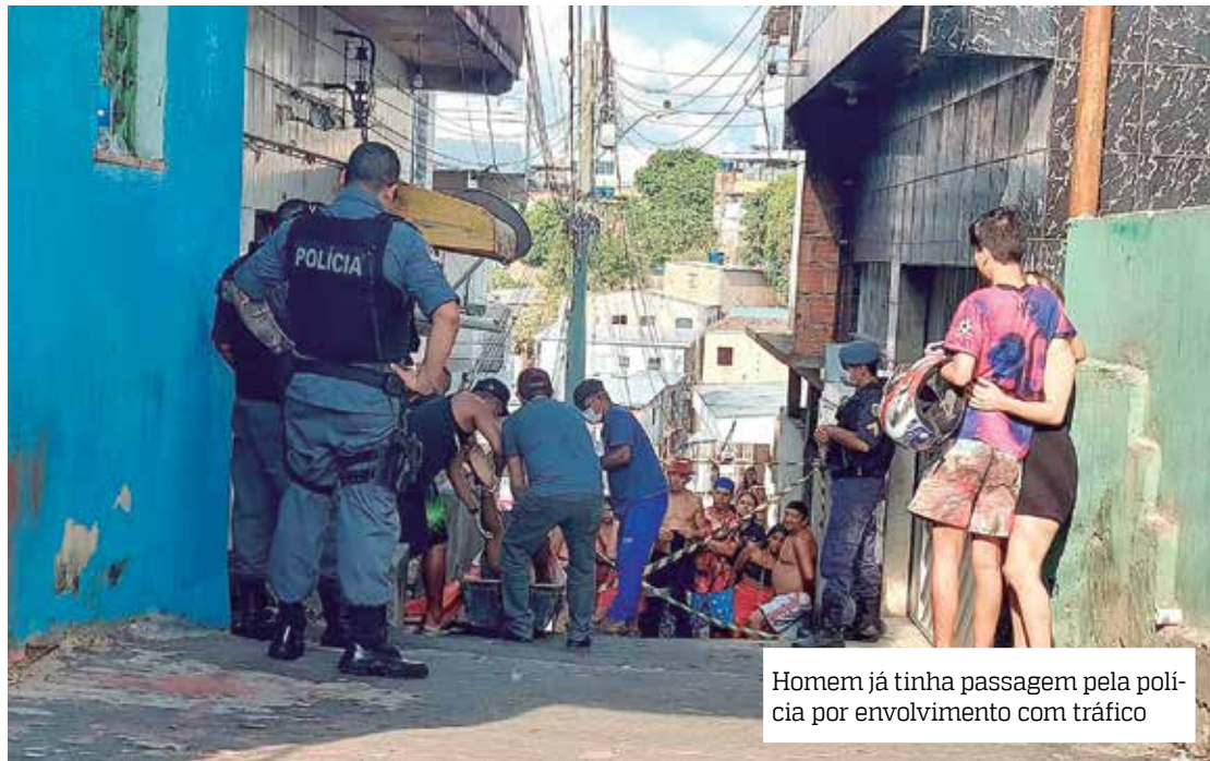
Homem já tinha passagem pela polícia por envolvimento com tráfico