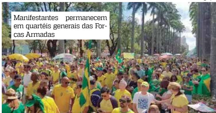
Manifestantes permanecem em quartéis gerais das Forças Armadas