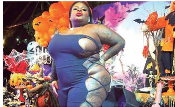
Jojo Todynho informou sobre a cirurgia pelo seu perfil no Instagram

Para não forçar o estômago durante sua recuperação, as dietas pós-cirúrgicas da bariátrica levam em conta o volume, o tipo e a consistência dos alimentos. Evoluindo da fase