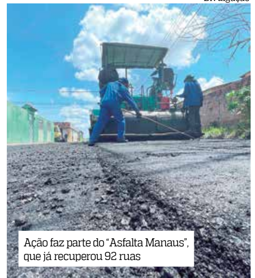
Ação faz parte do “Asfalta Manaus”, que já recuperou 92 ruas