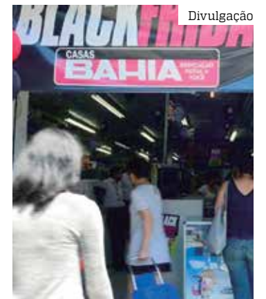
Comércios ficam mais agitados neste mês de novembro

para 14,6%, a intenção de comprar alimentos e bebidas. Já os planos para comprar televisores caíram de 4,3% para 3,8%. Mesmo assim, as estimativas da CNC indicam que o segmento de móveis e eletrodomésticos deverá responder pela maior parte do faturamento do comércio em razão do evento, com 34% do total das vendas. Em Alagoas, Sergipe e Amazonas, há mais da metade dos consumidores inclinada a comprar algo por conta da copa.