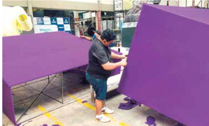
Diversos profissionais estão trabalhando na montagem do cenário