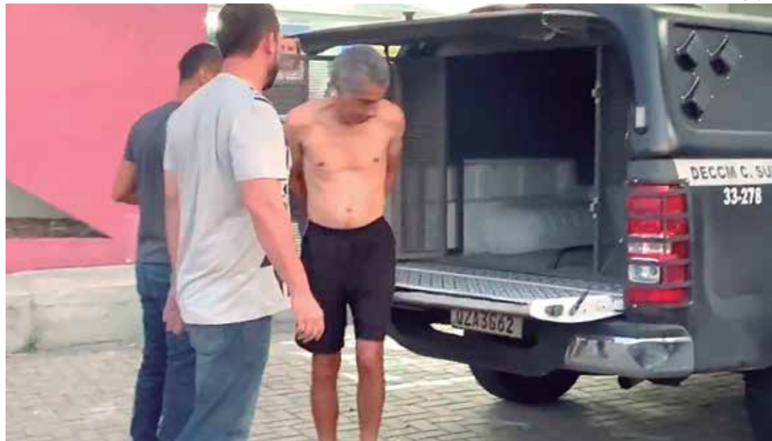
Homem é preso por estupro contra crianças entre 8 e 10 anos

O policial afirmou que, no momento em que o criminoso viu a polícia, se assustou, pulou da cama, não resistiu e só pediu para vestir