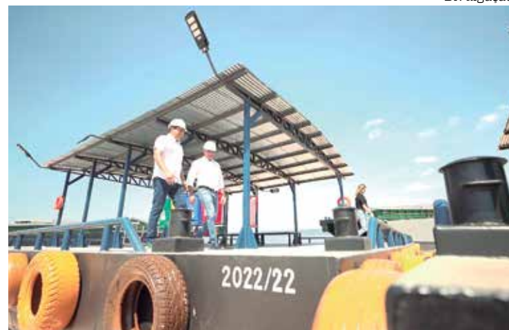
Investimentos do Governo do Amazonas foi de R$ 40 milhões

tregues aos municípios: Autazes: Comunidade Vila Novo Céu; Careiro: Comunidade Purupuru; Tapauá: Comunidade Foz do Tapauá; Boa Vista dos Ramos: Comunidade Menino Deus do Curuçá; Maués: Comunidade Bom Jesus do Canela; Anamá: Distrito do Arixi; Barcelos: Porto de Moura; Nova Olinda do Norte: Porto da Estrada do Curupira; Barreirinha: Distrito do Cametá dos Ramos; Nhamundá: antigo porto da cidade; Parintins: Distrito de Mocambo; Humaitá: Porto de Auxiliadora; Alvarães: Distrito de Nogueira; São Paulo de Oli-