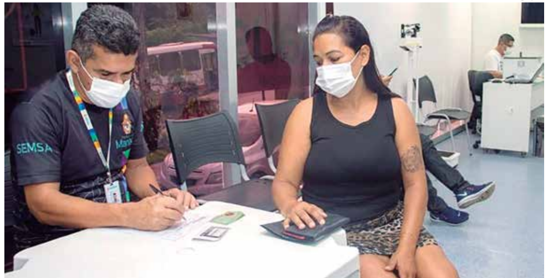
População pode buscar o atendimento no horário das 8h às 16h

A UBS móvel 02 está na rua 04, s/nº, conjunto Jardim Mauá, bairro Mauzinho, zona Leste. A estrutura está nas proximidades da UBS L-44, que está passando por obras de revitalização. A UBS móvel 03 segue atendendo nas dependências da UBS Lindalva Damasceno, na rua 7, bairro Tarumã, Zona Oeste.