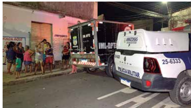
Homem foi surpreendido por três criminosos que chegaram ao local

O corpo do jovem, de 26 anos, foi levado para o Instituto Médico Legal (IML).