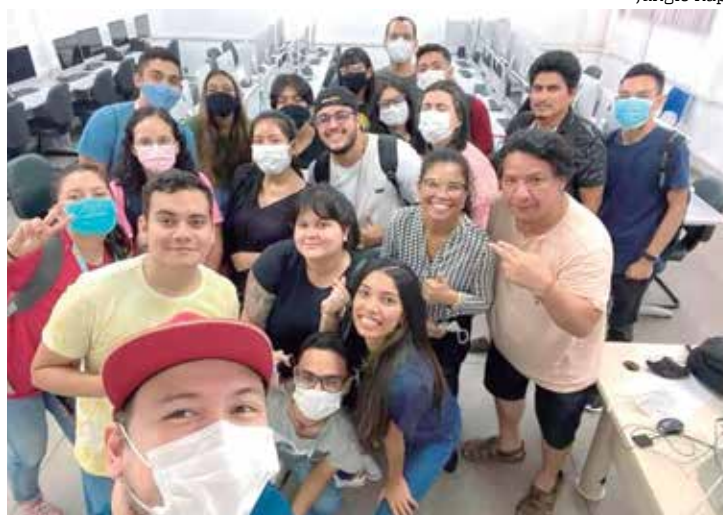
Campanha “Adote um Pé” surgiu com o intuito de ajudar crianças

“Pensando nisso, decidimos trabalhar com grupos