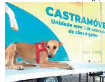
Equipes da Sema realizam castrações sem custo aos tutores

“O castramóvel representa muito para a causa animal do Estado do Amazonas e isso é algo que fica evidente.”