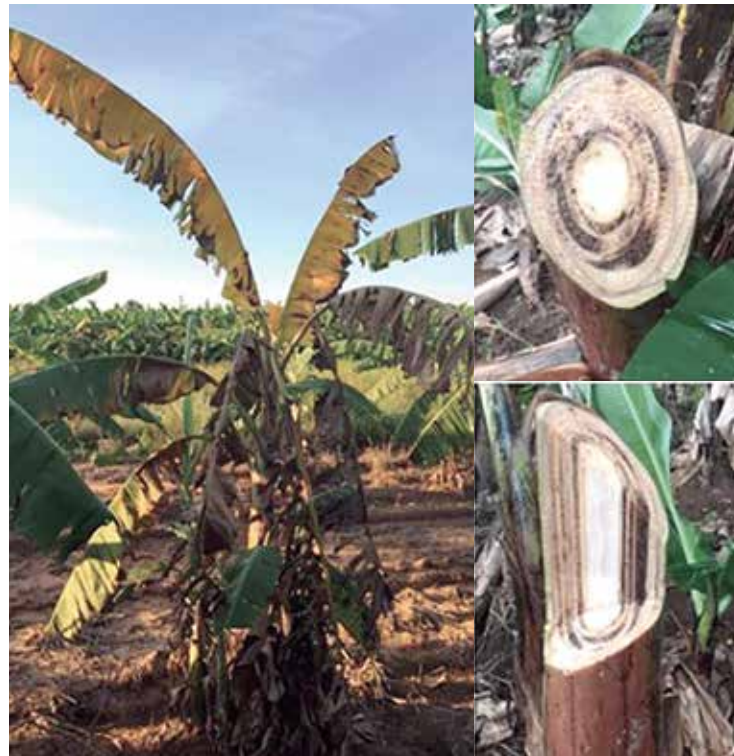
Efeitos da fusariose de bananeira, também conhecida como mal do Panamá

"Nossa programação envolve uma apresentação do Plano Nacional de Prevenção e Vigilância da Fusariose da Bananeira - Raça 4 Tropical. Essa doença chegou no Peru e na Colômbia, em 2021, e existem suspeitas na Bolívia e Vene-