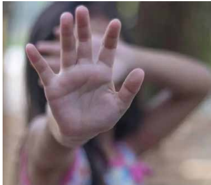
Crime foi cometido por um vizinho em agosto no bairro Tarumã

A autoridade policial explicou que as buscas para localizar o indivíduo iniciaram após tomarem conhecimento do fato. “Foi uma busca incessante, pois assim que tomamos conhecimento do fato, tentamos efetuar a prisão em flagrante. Conseguimos lograr êxito na prisão dele na segunda-feira”, explicou a autoridade.