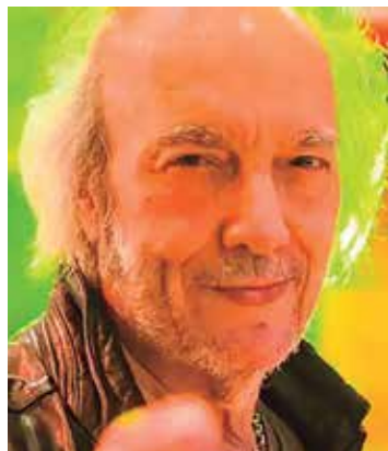
Erasmu Carlos em 'Sol Nascente'

Um de seus últimos trabalhos na teledramaturgia foi na novela Pega Pega (2016), Erasmu onde fez um feat com Pedro Luís na música Tempo de Menino.