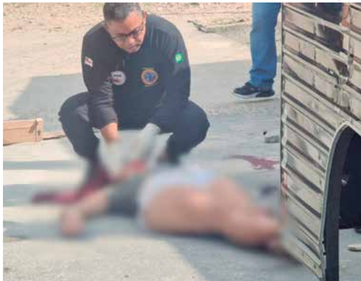
Uma delas não resistiu e morreu no local, a outra morreu no hospital

mações de testemunhas repassadas à Polícia Militar do Amazonas (PMAM), foram ouvidos vários disparos de arma de fogo na localidade e quando os moradores saíram das casas para verem o que havia acontecido, se depararam com as duas mulheres ensanguentadas no chão.