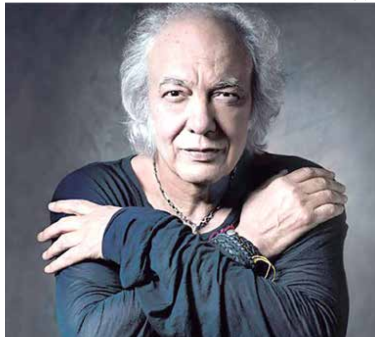
Erasmu Carlos: relembre as trilhas de novelas com o Tremendão

Um feat com Adriana Calcanhoto na faixa Do Fundo do Meu Coração marcou a trilha sonora de O Profeta (2006). Outro feat de sucesso foi a música Olha, trilha de Paraíso Tropical (2007) com Chico Buarque. Já com Marisa Monte ele fez dois