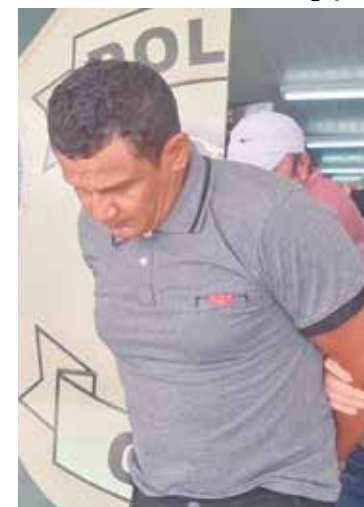
Homem e a vítima discutiram durante bebedeira no ano de 2010