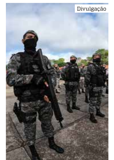
Prisões foram efetuadas em Manaus e no interior do AM

Em Tapauá (a 449 quilômetros de Manaus), três homens, com idades entre 18 e 26 anos, foram presos em posse de entorpecentes no bairro Açai. Em posse deles, a guarnição encontrou 45 porções de maconha, uma porção de oxi e 27 porções de cocaína. Eles foram direcionados à 64ª Delegacia Interativa de Polícia (DIP) do município, onde foram autuados em flagrante por tráfico de drogas.