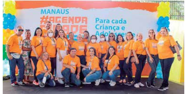
AgendaCidadeUnicef - Manaus visa o fortalecimento de políticas públicas

O embaixador do Unicef no Brasil Bruno Gagliasso visitou escolas, OSC e percorreu ruas do bairro. Ele reafirmou o compromisso