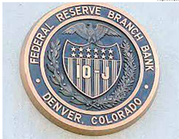
FED, o Banco Central dos EUA ditou o ritmo do mercado brasileiro