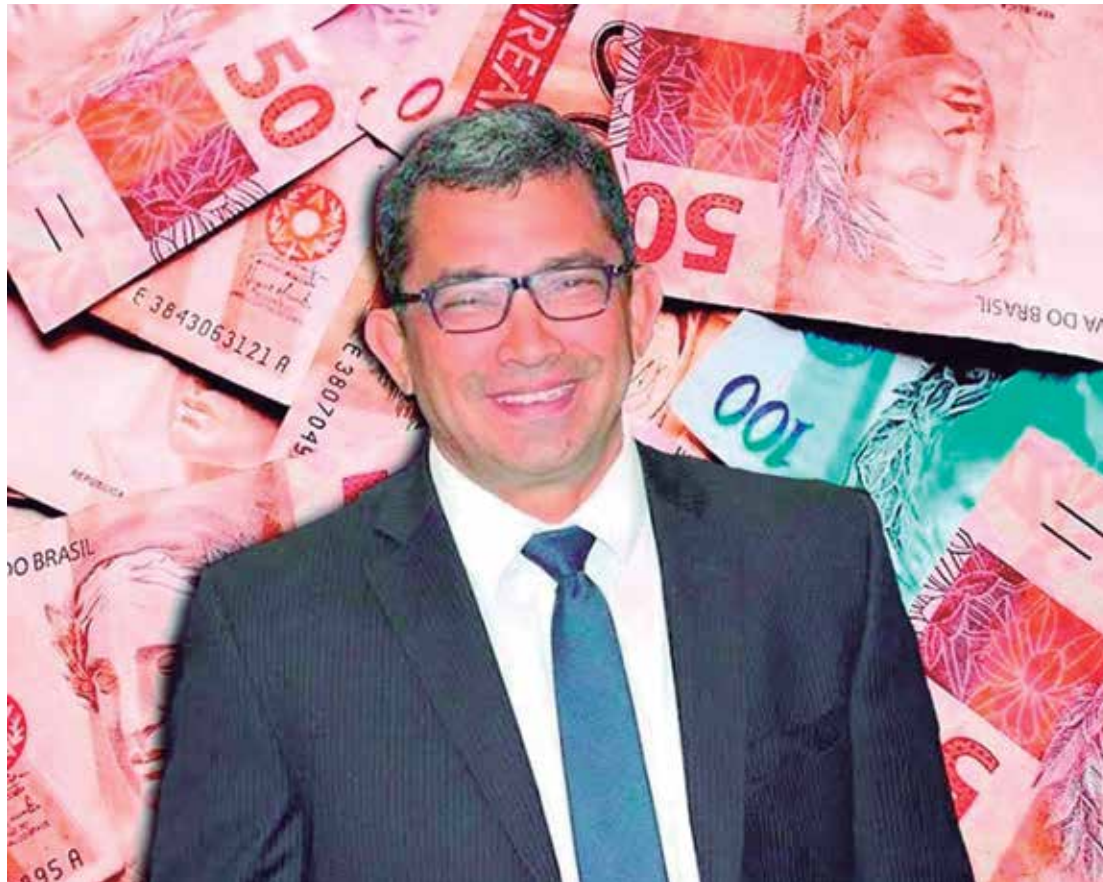
Na publicação, não há informações sobre o prazo para realizar obras