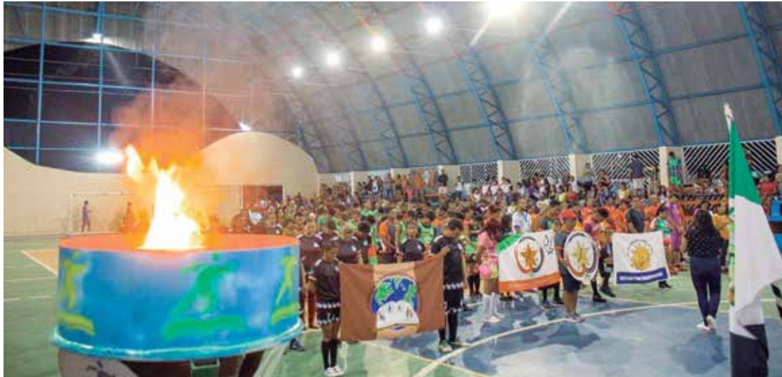
Abertura da 1ª edição do JEEJA reuniu mais de 100 anos de 4 escolas

A noite de terça-feira (22) foi muito especial para 110 alunos de 4 escolas municipais de Rio Preto da Eva que amam o esporte. É que a Prefeitura do município por meio da Secretaria Municipal de Educação, Cultura e Desporto (SEMECD), realizou a abertura dos Jogos Escolares da Educação de Jovens e Adultos (JEEJA). É a 1ª edição do evento que agora deve ser inserido no calendário esportivo da