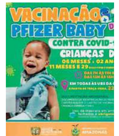
Vacinação contra Covid para crianças na faixa de 6 meses a 2 anos

As crianças que fazem acompanhamento nas UBS poderão utilizar o cadastro já existente na sua unidade de referência, como comprovante que faz acompanhamento.