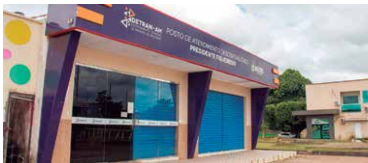
Município conta com prova de legislação de trânsito no formato digital

salmente 480 vagas para o exame teórico. Antes, no sistema em papel, o Departamento Estadual de Trânsito do Amazonas