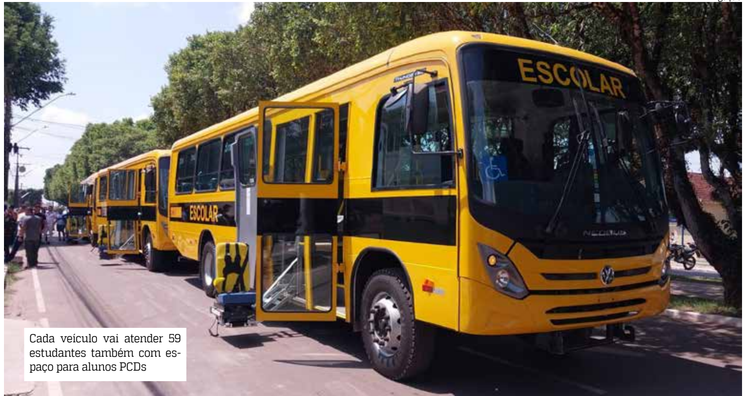
Cada veículo vai atender 59 estudantes também com espaço para alunos PCDs