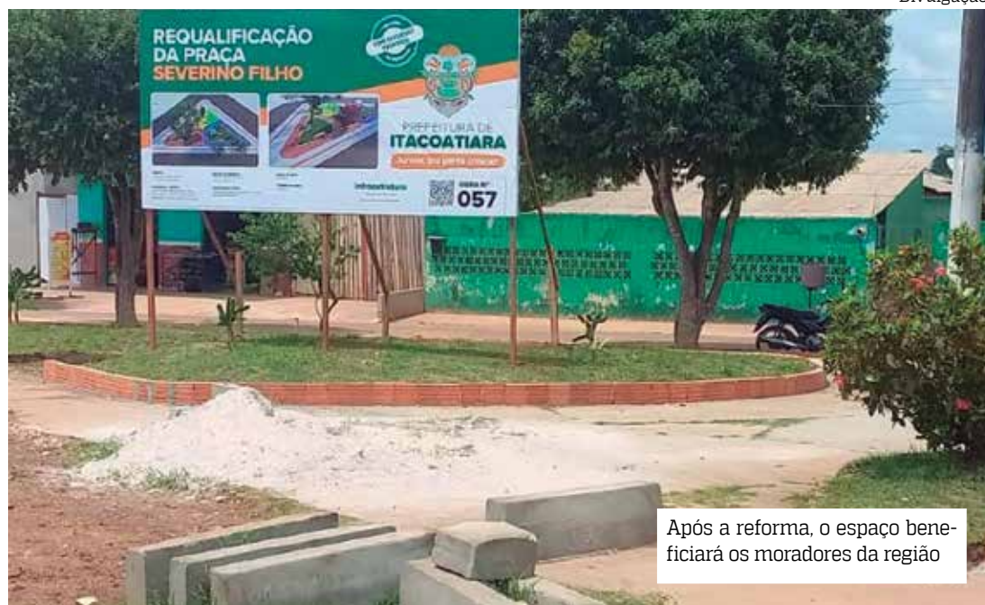
Após a reforma, o espaço beneficiará os moradores da região

A Prefeitura, por meio da Secretaria Municipal de Produção, Abastecimento e Políticas Fundiárias (SEMPAB), esteve reunida, na segunda-feira (21), com a Superintendência do Patrimônio da União no Amazonas - SPU/AM, juntamente com produtores rurais e organizações da sociedade civil.