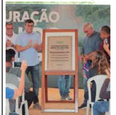
Obras beneficiam cerca de 90 famílias do entorno