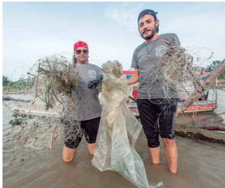
Expedição durou 19 dias e percorreu a bacia do Rio Amazonas

Além disso, foram encontrados 185 pontos com atividade de pesca, o que sinaliza um aumento de 39%. A ameaça que a pesca representa a essas espécies se revelou logo nas primeiras 24 horas da expedição. A equipe da Sea Shepherd encontrou dois tucuxis mortos em diferentes pontos da 'zona vermelha' para os golfinhos de rio na Amazônia, na região de Manacapuru. Essa é uma zona conhecida pela pesca de arrastão