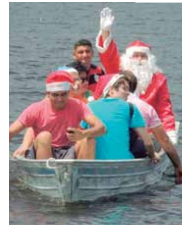
Grupo já fez a alegria de mais de 150 mil crianças