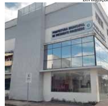
Município terá FanFest, no Parque do Urubuí, com telão para os jogos

O decreto municipal nº 3274 foi publicado na edição de quinta-feira (24), no Diário Oficial do Município.