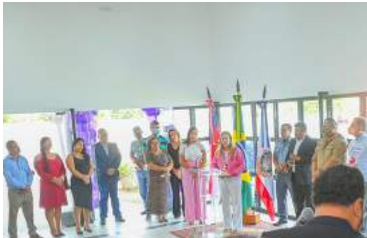
Programa tem como intuito ampliar a proteção contra as mulheres