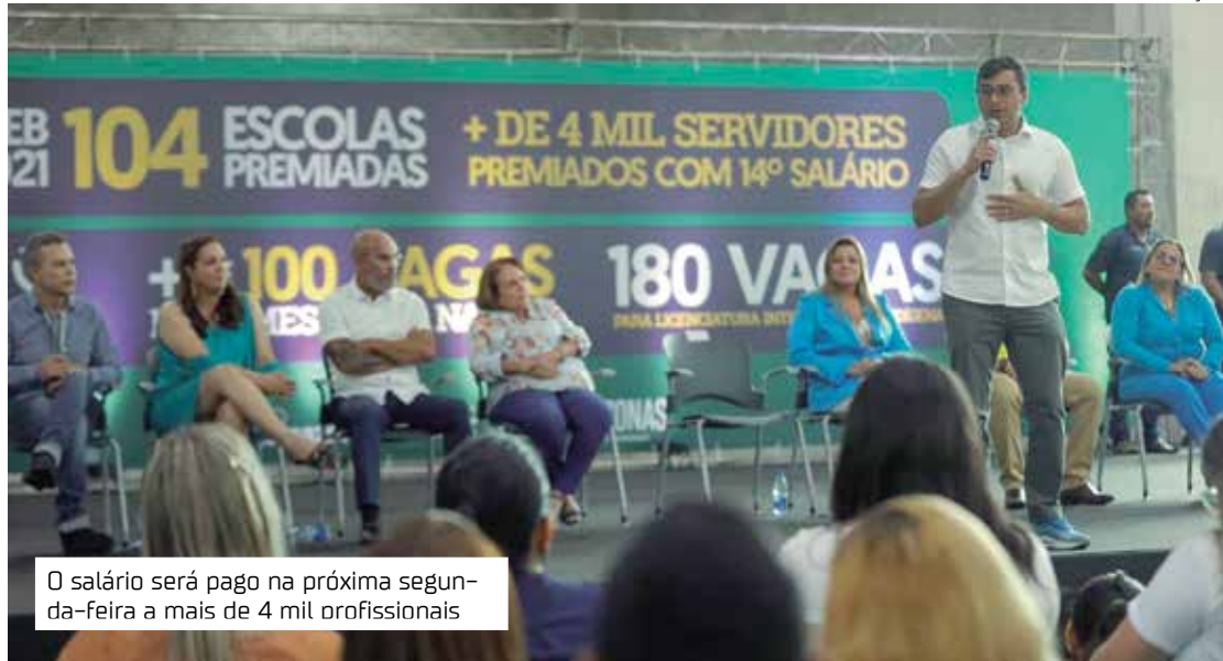
O salário será pago na próxima segunda-feira a mais de 4 mil profissionais

Ao todo, 104 escolas foram premiadas, das quais 30 por estarem no ranking das dez melhores nas modalidades de Ensino Fundamental Anos Iniciais, Anos Finais, e Ensino Médio; e outras 74 por terem alcançado a meta pactuada individual