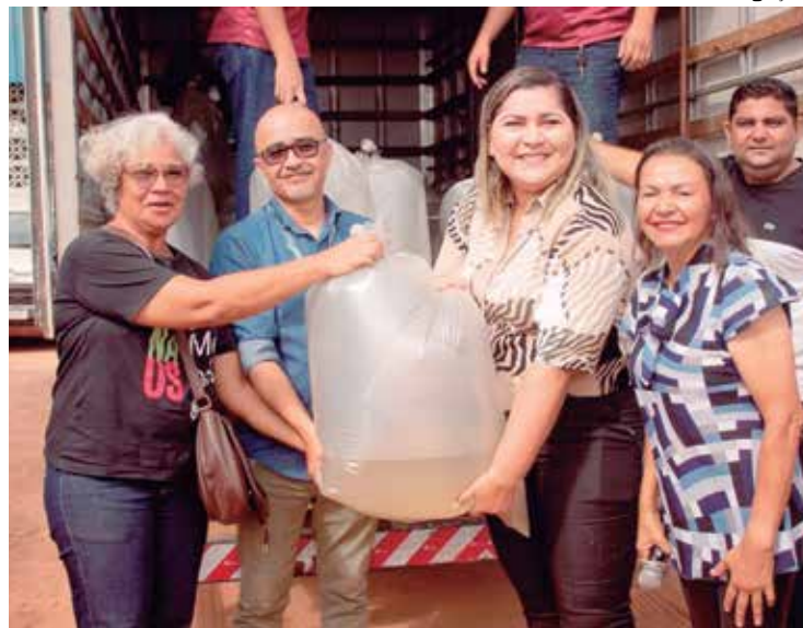
Prefeitura anunciou a distribuição de 200 mil alevinos de matrinxã

“Estamos trabalhando com várias frentes de serviços, recuperando ramais e, pela primeira vez, vamos levar asfalto a zona rural: ramal e a vila Rumo Certo serão asfaltados e também a comunidade Maroaga). Já está garantido em contrato para começar a execução do trabalho. E estamos realizando levantamentos para que outros ramais também recebam, no futuro, esse asfalto, mas, enquanto isso não acontece, as nossas máquinas da prefeitura cuidam, diariamente, da manutenção dos ramais. Temos ainda o projeto em parceria com o Incra, no Canoas-Rio Pardo, que vai garantir a sua recupera-