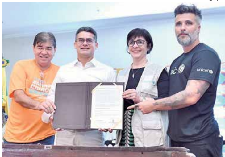
Iniciativa vai atender o bairro Colônia Antônio Aleixo, na Zona Leste

“Essa parceria vem somar esforços com a prefeitura, naquilo que nós estamos