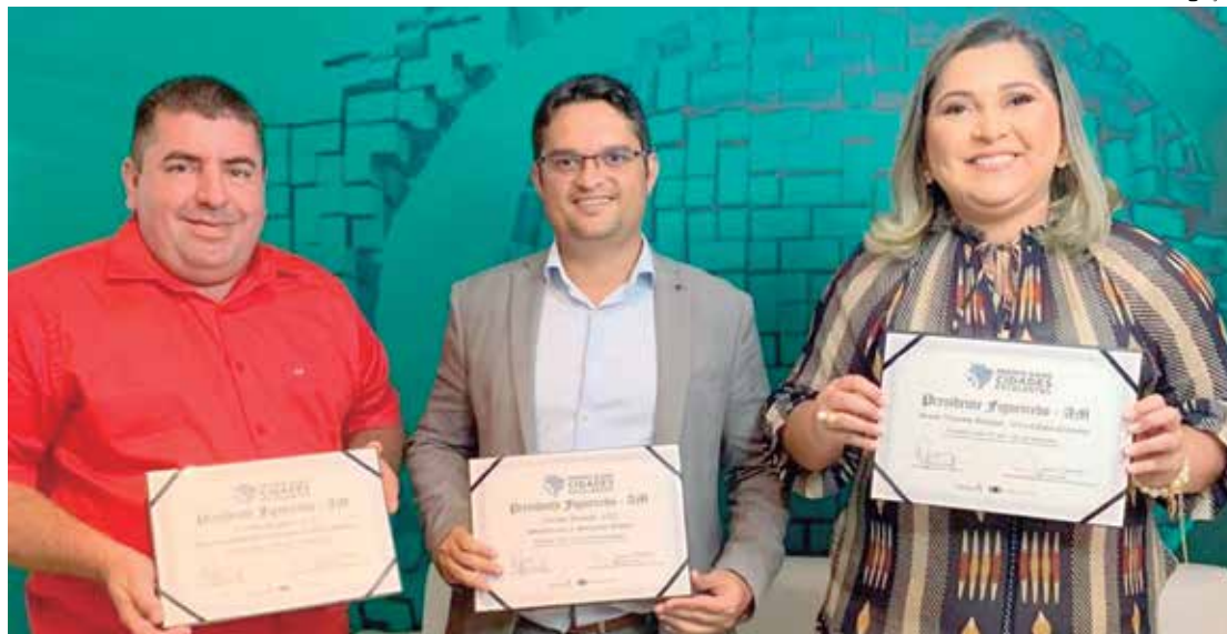
Município ficou em primeiro lugar em infraestrutura e mobilidade urbana

“Receber essa premiação, pela segunda vez, nos motiva a continuar aprimorando a nossa gestão, em prol da