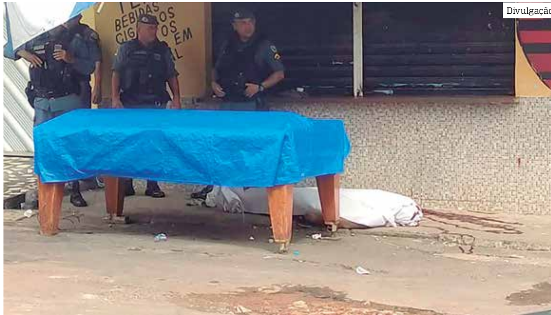
Polícia informou que a vítima era usuário de drogas

Segundo informações levantadas pela PM, a vítima era usuário de drogas, mas até o momento não há informações sobre o que de fato motivou a exe-