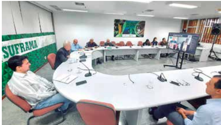
Reunião realizada por videoconferência, nesta terça-feira (20), em Manaus

Mais quatro projetos industriais e de serviços foram aprovados durante a 20ª Reunião Extraordinária do Conselho de Administração da Suframa (CAS), realizada por vídeo conferência, nesta terça-feira (20), em Manaus. São investimentos que ultrapassam o volume de R$59,7 milhões e