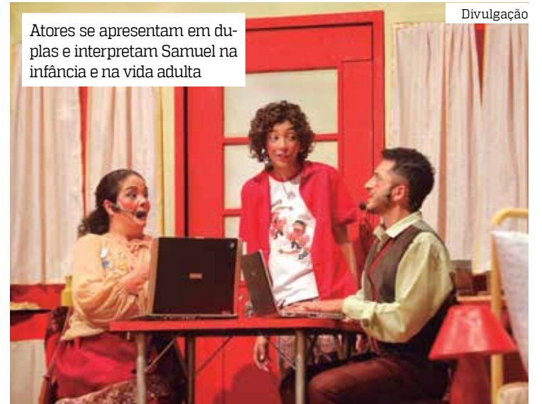
Atores se apresentam em duplas e interpretam Samuel na infância e na vida adulta

"Transmitir uma grande mensagem no palco é um grande presente, não somente no Natal, mas na minha vida. Esse é o meu cerne",