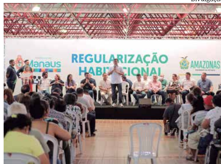
Governo e Prefeitura se unem para sanar pendências de imóveis

Nas antigas gestões, as unidades habitacionais não eram entregues regulari-