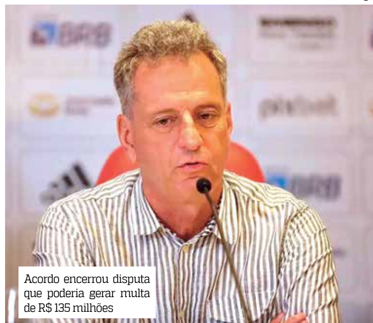
Acordo encerrou disputa que poderia gerar multa de R$ 135 milhões