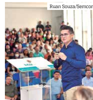
Gestão teve o orçamento de R$ 5,5 bilhões em 2021