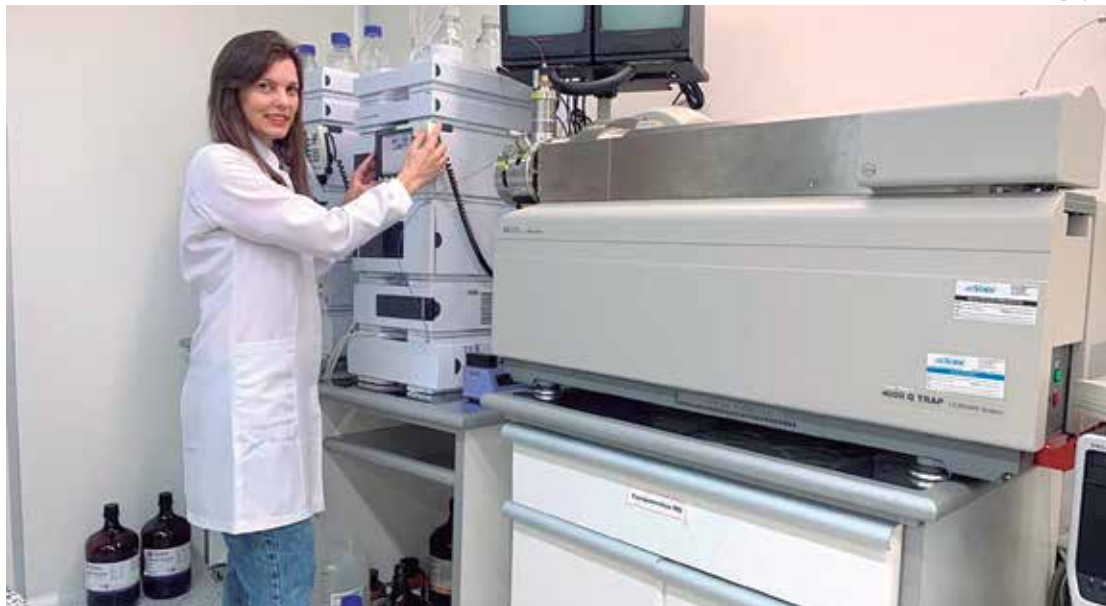
Estudo recebe apoio do Governo do Estado, por meio do Programa Prodoc/Fapeam

A investigação da variedade de moléculas presentes nos diferentes rios amazônicos e como elas são afetadas por diferentes fatores, incluindo a temperatura e a concentração de dióxido de carbono no