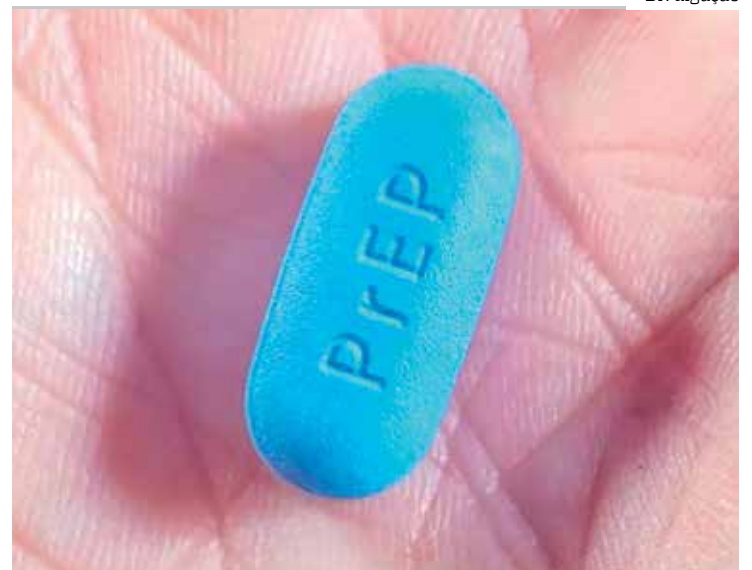
Antes, apenas Manaus e Tabatinga ofertavam acesso ao medicamento

Historicamente, Parintins apresenta uma das mais altas taxas de detecção de HIV/Aids. Em 2021, o município registrou taxa de detecção de 32,6 novos casos a cada 100 mil habitantes.