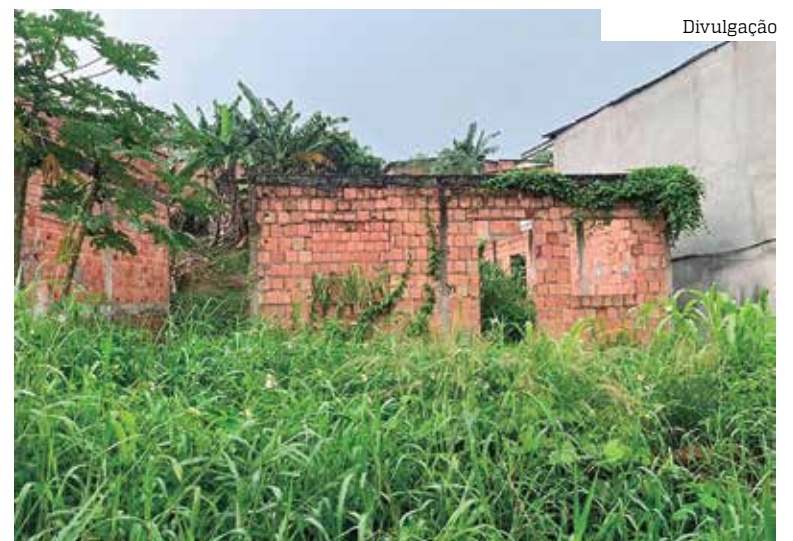
Homem não era morador do local, mas pedia alimentos e dinheiro na área

O corpo foi removido e encaminhado para o Instituto Médico Legal (IML). O caso será investigado pela Delegacia Especializada em Homicídios e Sequestros (DEHS).