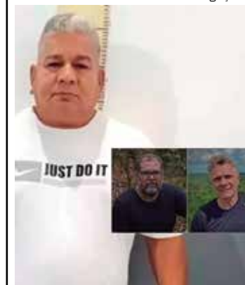
Suspeito de mandar matar Bruno e Dom voltou a ser preso