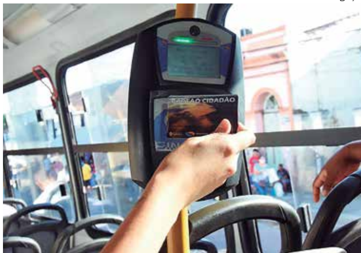
App 'Cadê Meu Ônibus Recarga' é lançado em Manaus

Além deste lançamento, o aplicativo “Cadê Meu Ônibus” continua ofertando serviços. Através dele é possível fazer busca de linha, pontos de parada ou localidade, fazer planejamento de viagens e enviar notificação que avisa que horas o ônibus vai passar, mesmo com o aplicativo fechado, tudo isso usando tecnologia de GPS e comunicação em tempo real do usuário com os ônibus que estão circulando pela cidade. Além de agendamento e alertas de mudanças de itinerários e outros assuntos relacionados ao trânsito que são enviados para população através do aplicativo.