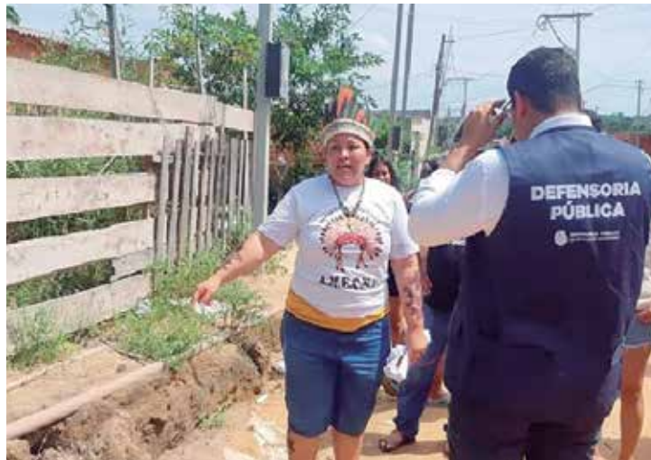
Comunidades lutam por terras indígenas