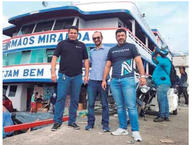
Navegam desenvolve solução voltada para a logística local