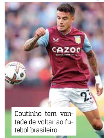
Coutinho tem vontade de voltar ao futebol brasileiro