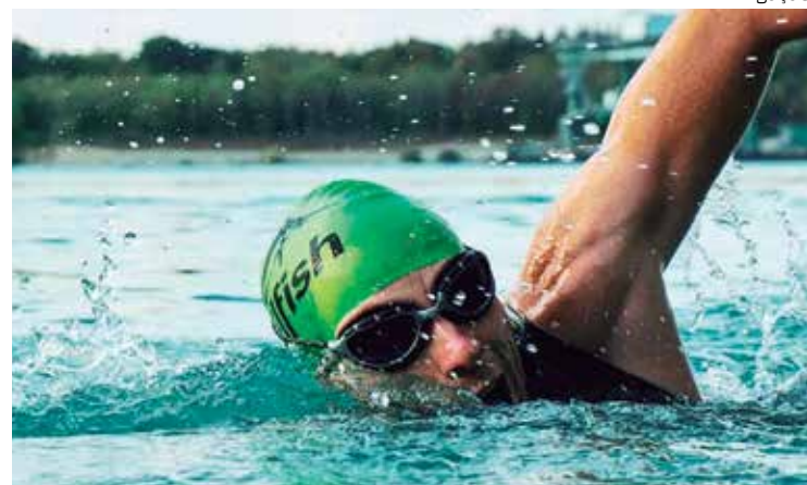
Competição será realizada no dia 26 de fevereiro de 2023 em Novo Airão

"Além do incentivo à prática do esporte, estamos trabalhando a consolidação do município com mais uma atividade do turismo esportivo. Portanto, é uma estratégia para o fomento do mercado turístico local", destaca.