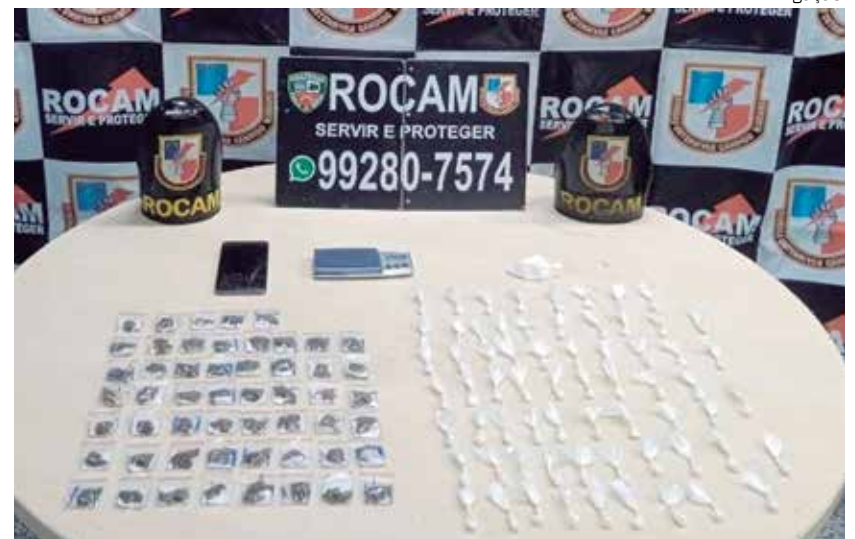
Homem foi preso por traficar drogas no bairro Compensa

A Polícia Militar orienta à população que informe imediatamente ao tomar conhecimento de qualquer ação criminosa, por meio do disque-denúncia 181 ou pelo 190.