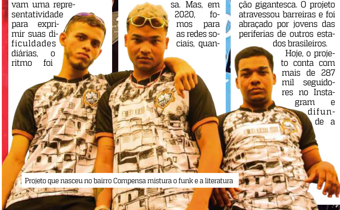
Projeto que nasceu no bairro Compensa mistura o funk e a literatura

“Vamos expandir como marca e projeto social, na Bienal, vamos palestrar nos maiores eventos do Rio de Janeiro com literatura, para criarmos mais projetos levando cultura, aliando a fotografia também às comunidades”, finaliza.