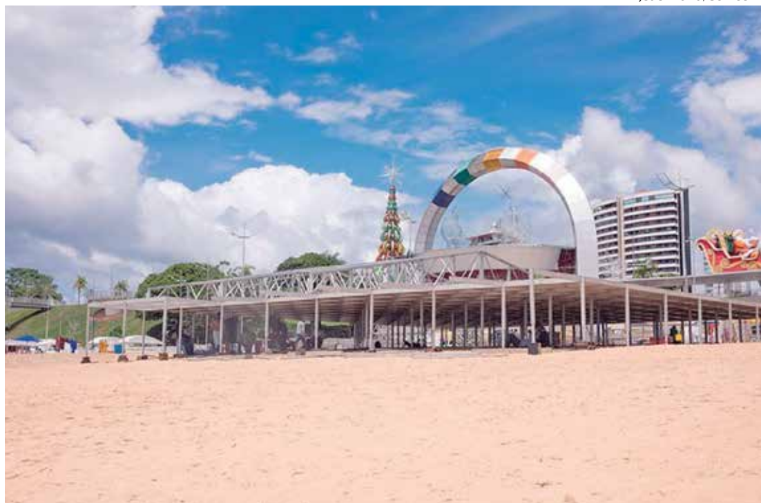
Estrutura montada conta com um palco de 44m de largura, 24m de profundidade e 13m de altura

A estrutura montada na praia da Ponta Negra conta com um palco de