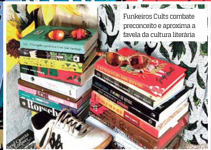
Funkeiros Cults combate preconceito e aproxima a favela da cultura literária