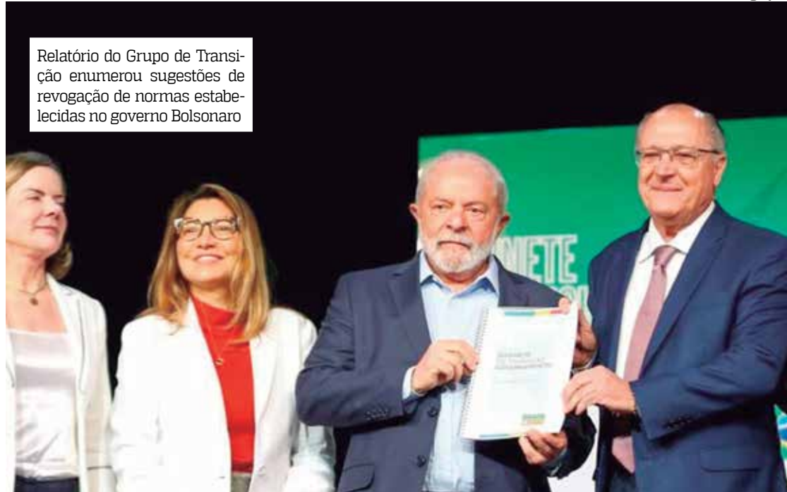
Relatório do Grupo de Transição enumerou sugestões de revogação de normas estabelecidas no governo Bolsonaro

“Essas sugestões serão avaliadas com todo o rigor jurídico e técnico pelos novos ministros e ministras