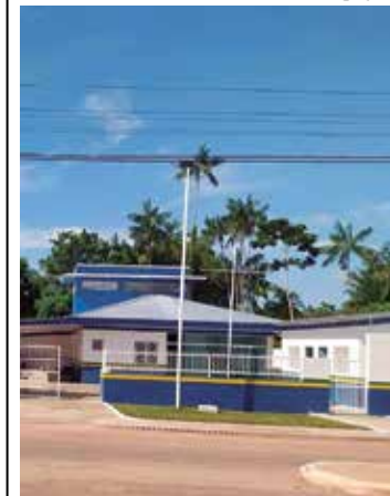
Obras de ampliação do prédio do 47 a DIP foram concluídas