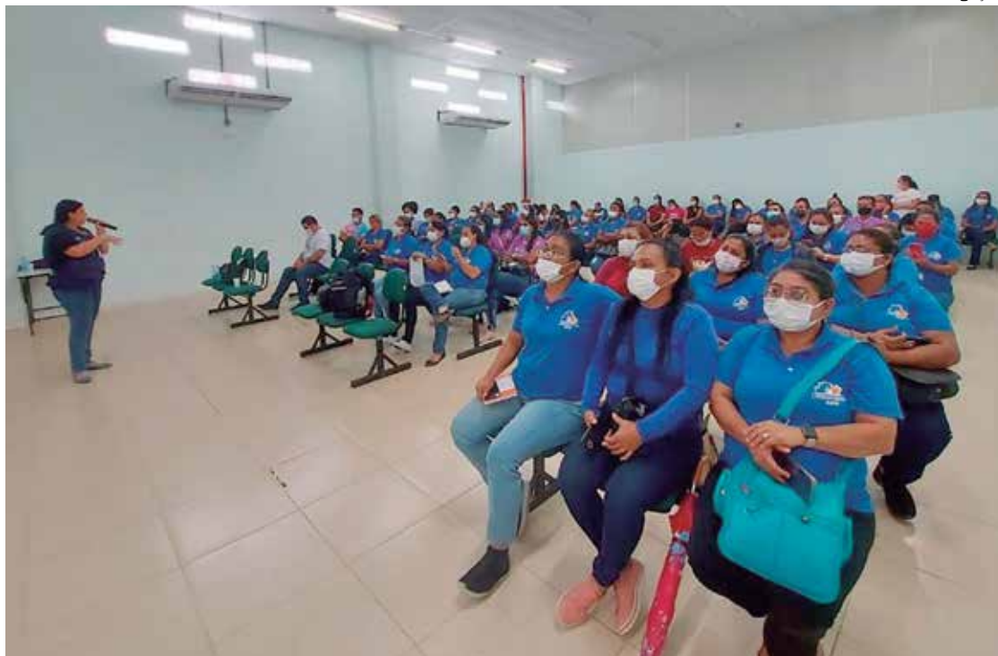
Parte do avanço se deve ao projeto Capacita+ APS Interior, da SES-AM

O Governo do Amazonas, por meio da Secretaria de Estado de Saúde (SES-AM), destaca o crescimento dos indicadores de desempenho da Atenção Primária em Saúde (APS) nos municípios do interior do estado. Parte do avanço se deve ao projeto Capacita+ APS Interior, da SES-AM, que busca dar qualificação e suporte aos profissionais e gestores municipais para o fortalecimento e o alcance das metas do programa Previne Brasil, do Ministério da Saúde (MS), modelo de financiamento da atenção básica.