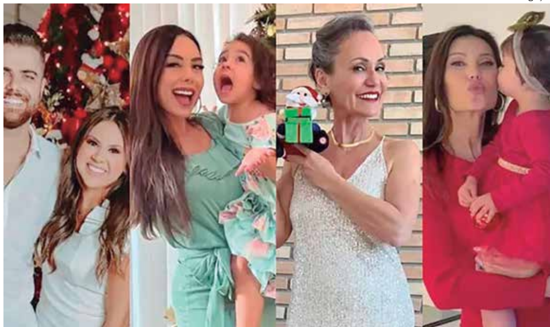
Famosos têm superstições especiais para celebrar a chegada do novo ano com o pé direito

À medida que dezembro avança, o espírito natalino vai tomando conta de todos. E não é só você que se arruma para ficar na sala de casa: os famosos também participam da tradição. A montagem das árvores também ganha mais espaço no dia a dia.