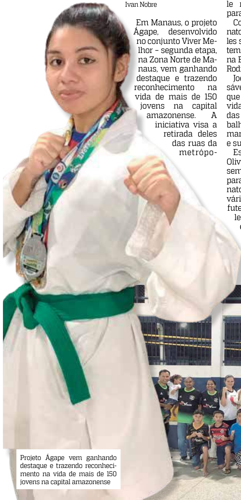
Projeto Ágape vem ganhando destaque e trazendo reconhecimento na vida de mais de 150 jovens na capital amazonense