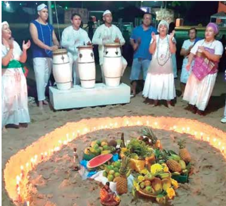
Festival terá apresentação de 22 artistas e deve reunir 50 mil pessoas

O 12º Festival Afro-Amazônico de Iemanjá e Virada do Vale 2023, ocorre do dia 29 a 31 de dezembro, na praia da Ponta Negra, Zona Oeste de Manaus. O evento deve reunir cerca de 50 mil pessoas e contará de forma inédita, com shows de