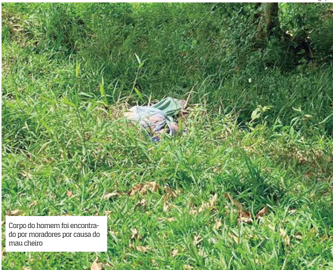
Corpo do homem foi encontrado por moradores por causa do mau cheiro