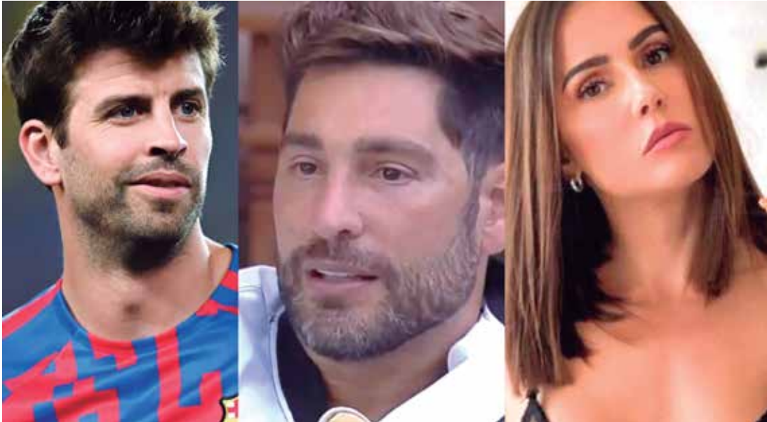
Gerald Piqué, Victor Pecoraro e Deborah Secco já assumiram traições

2022 foi um ano intenso em todos os sentidos. Casamentos não faltaram, namoros novos surgiram, e ao lado disso, alguns famosos falaram abertamente sobre traições.