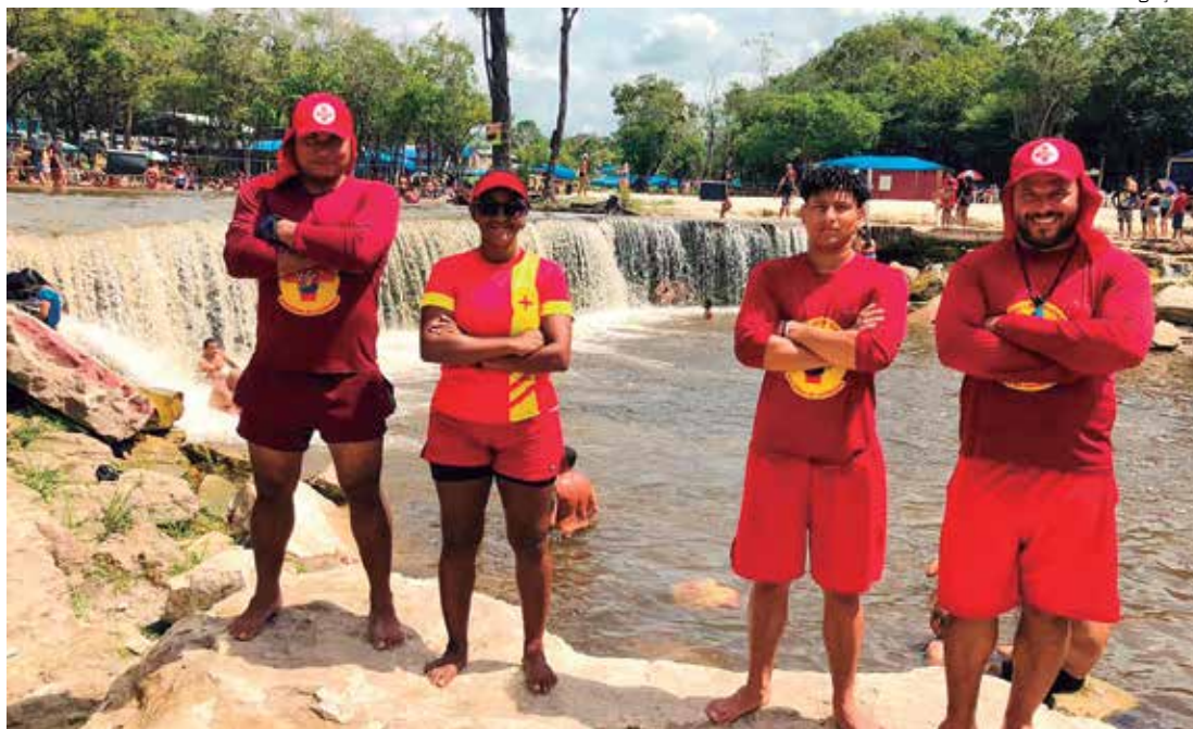
Agentes salvam criança que estava se afogando no Cachoeira do Castanho