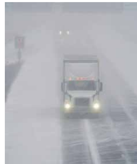
Onda de frio mais rigorosa em décadas nos EUA já deixou ao menos 47 mortos

O clima extremo provocou temperaturas abaixo de zero em 48 dos 50 estados americanos no fim de semana, o que afetou viajantes devido aos milhares de voos cancelados e isolou moradores em casas cobertas de gelo e neve.