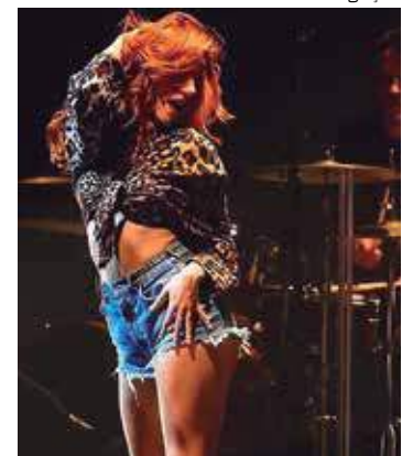
Cella Bártholo ganhou o prêmio como Atriz Revelação, em 2021