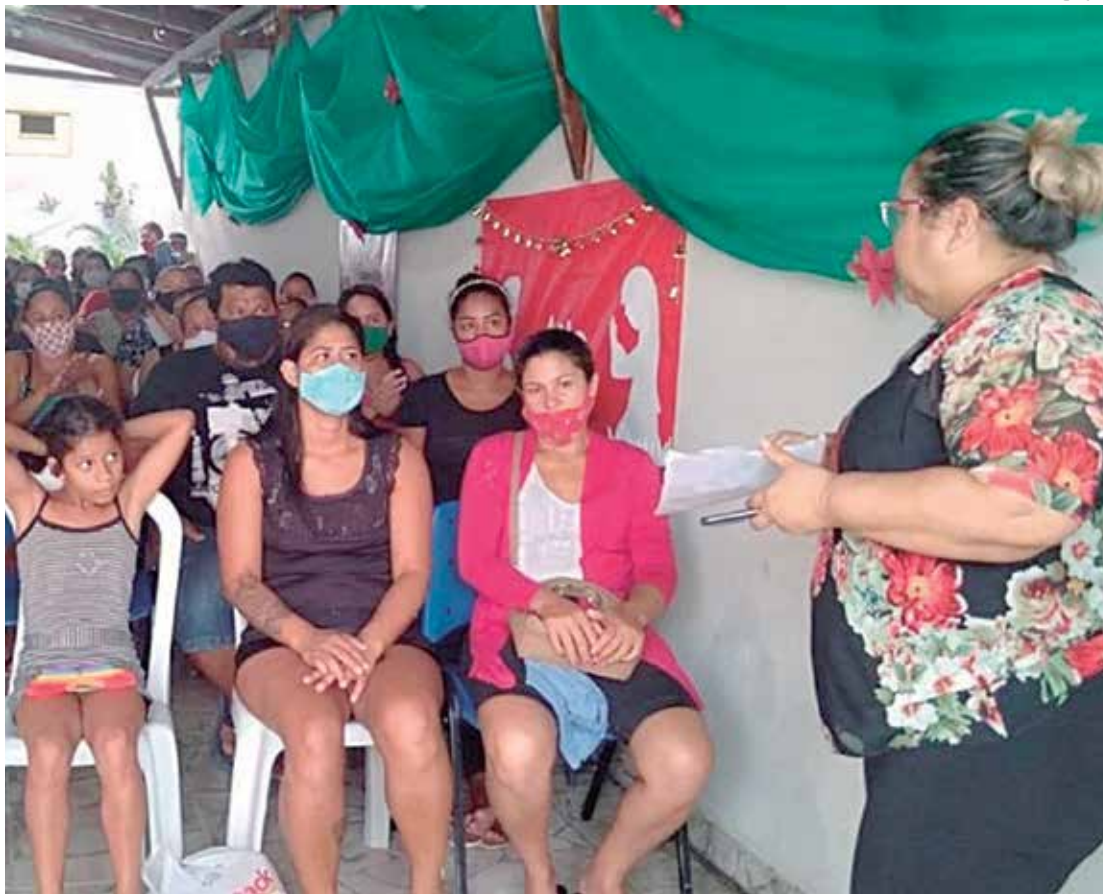
Instituto Restaurar almeja ampliar a superação da desigualdade social

Em 2020, o Instituto Restaurar abriu a sede administrativa e de atendimento dos serviços de assistência social, localizada na Rua Surucuá, nº07, bairro Tarumã, na Zona Oeste de Manaus, onde atendeu crianças, adolescentes, jovens e suas, respectivas, famílias em vulnerabilidade social e econômica, oferecendo atividades socioeducativas, atendimento psicossocial, palestras, oficinas e cursos profissionalizantes, promovendo fortalecimento de vínculos familiares e comunitários, por Projetos (Laços de Amor, Mulheres Inspiradoras e Trilhando Sonhos), programas e parcerias,