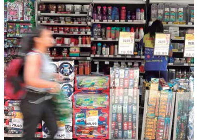
Pequenos negócios foram responsáveis por oito a cada dez novas vagas

No acumulado de 2022, as micro e pequenas empresas do setor de