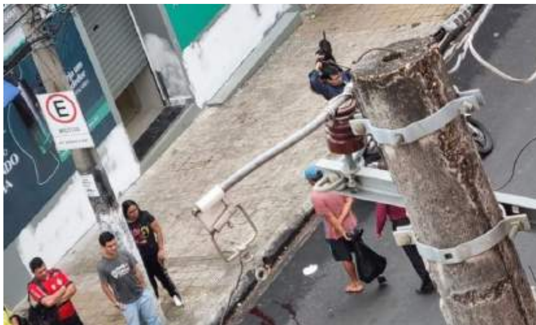
Agressores diziam que o ato se tratava de uma "correção" ao homem\

O homem ficou agonizando em via pública até