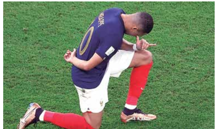
Camisa 10 da França tem o mesmo número de gols de Messi

A França de Mbappé, assim como a Argentina de Messi, está classificada para as quartas de final da Copa do Mundo e aguarda o vencedor do confronto entre Inglaterra e Senegal.