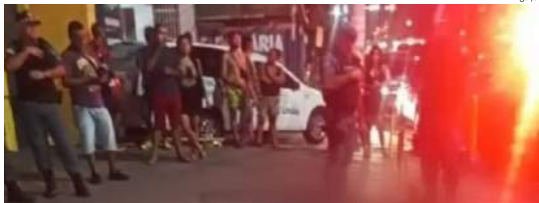
Jovem estava fazendo entregas quando foi parado por criminosos