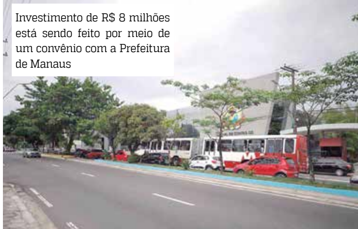
Investimento de R$ 8 milhões está sendo feito por meio de um convênio com a Prefeitura de Manaus