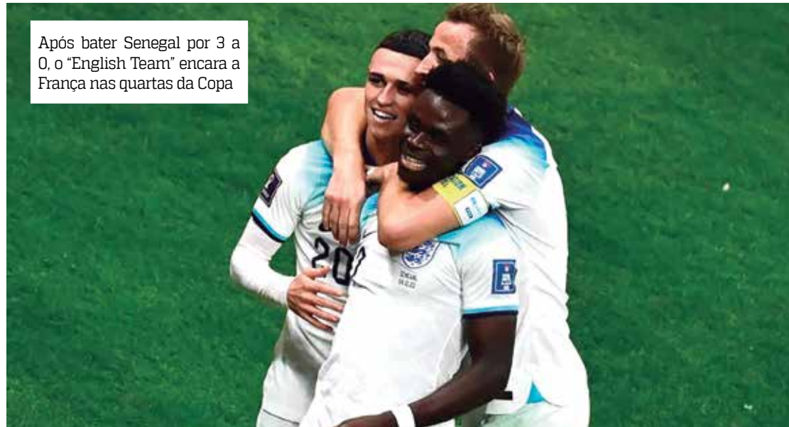
Após bater Senegal por 3 a 0, o "English Team" encara a França nas quartas da Copa

Na última Euro, em 2021, a Inglaterra chegou até a fi-