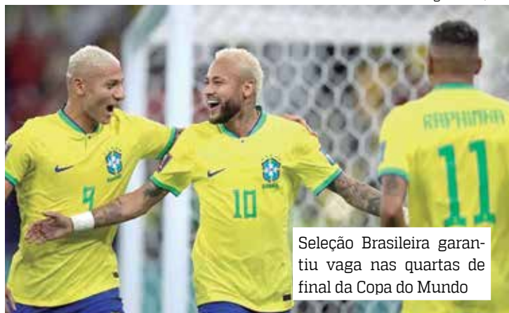
Seleção Brasileira garantiu vaga nas quartas de final da Copa do Mundo

A Seleção Brasileira atropelou a Coreia do Sul por 4 a 1 e garantiu vaga nas quartas de final da Copa do Mundo do Qatar. Com gols de Vini Jr., Neymar, Richarlison e Paquetá, o Brasil fez uma grande atuação na segunda-feira (5), no Estádio 974, e agora vai enfrentar a Croácia na próxima fase. O gol de honra sul-coreano foi marcado por Seung-ho Paik.