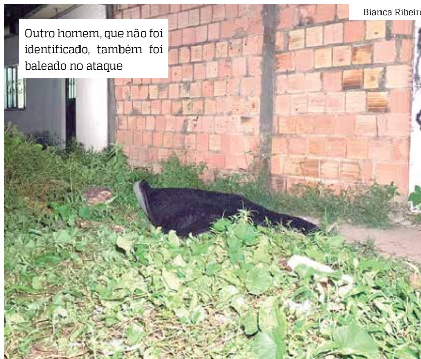
Outro homem, que não foi identificado, também foi baleado no ataque