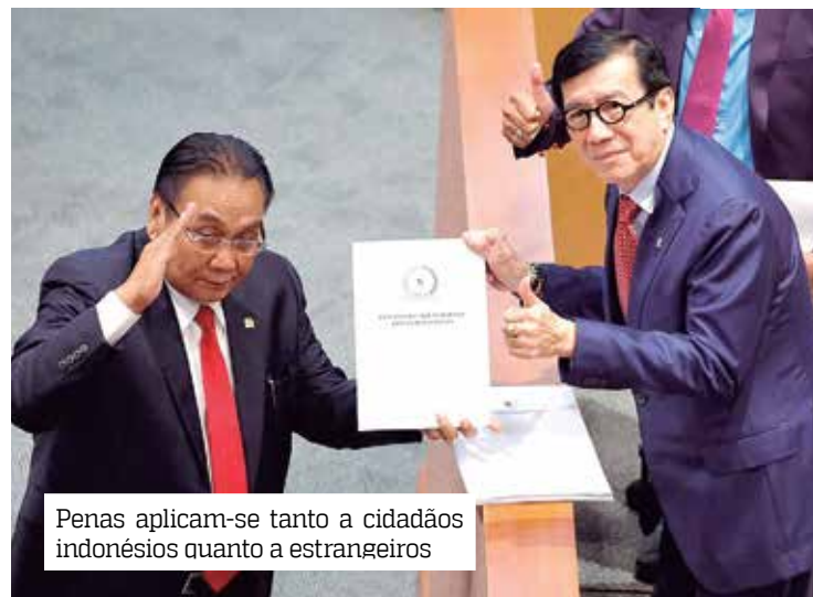
Penas aplicam-se tanto a cidadãos indonésios quanto a estrangeiros

A Lei torna também ilegal promover o controle da natalidade e a blasfêmia religiosa, além de retomar a proibição de insultar um presidente e vice-presidente em exercício, instituições estatais e a ideologia nacional.