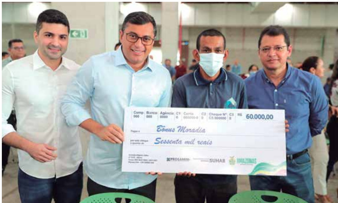
Beneficiários há anos esperavam por uma solução para o problema de moradia

Estiveram presentes o diretor-presidente da Su-