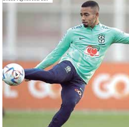
Atacante vai começar seu programa de reabilitação

Após a lesão sofrida no jogo entre Brasil e Camarões, na Copa do Mundo do Catar, o atacante Gabriel Jesus passou por uma cirurgia no joelho direito e, segundo comunicado do Arsenal, foi bem-sucedida. O jogador teve uma lesão ligamentar medial e os exames realizados no clube inglês comprovaram que ele precisava de uma operação.