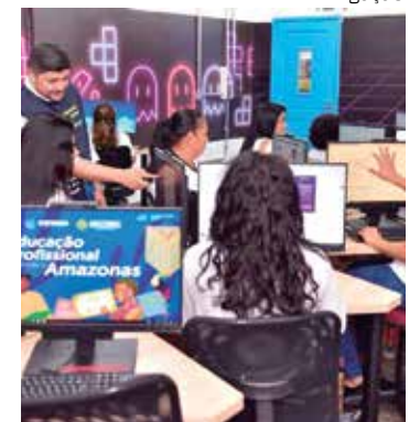
Ao todo são 1.800 vagas para cursos na zona leste de Manaus

As pessoas interessadas nas vagas, que ainda não tenham cadastro no Portal do Candidato, devem acessar o site cursos.cetam.am.gov.br e criar o perfil de acesso ao Portal das Inscrições. A criação facilita a inscrição no dia.