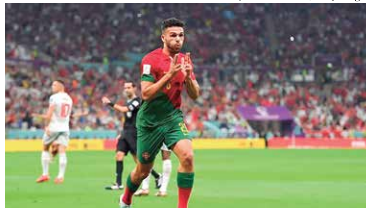
Com a vitória empolgante, Portugal irá encarar Marrocos nas quartas

Com a vitória empolgante, Portugal irá encarar Marrocos nas quartas de final da Copa. Mais cedo, os africanos venceram a Espanha nos pênaltis e avançaram. A partida ocorre no sábado (10), às 12h, no Al Thumama.