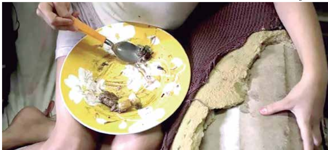
Alta da inflação e da pobreza extrema são fatores que aumentam a insegurança alimentar

Segundo o estudo, a maioria dos países da região