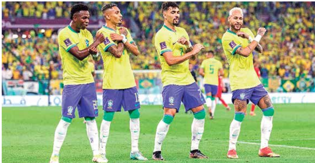
Na história, Brasil e Croácia se enfrentaram apenas quatro vezes

Depois disso, as duas seleções voltaram a se enfrentar de novo justamente numa Copa do Mundo, na abertu-