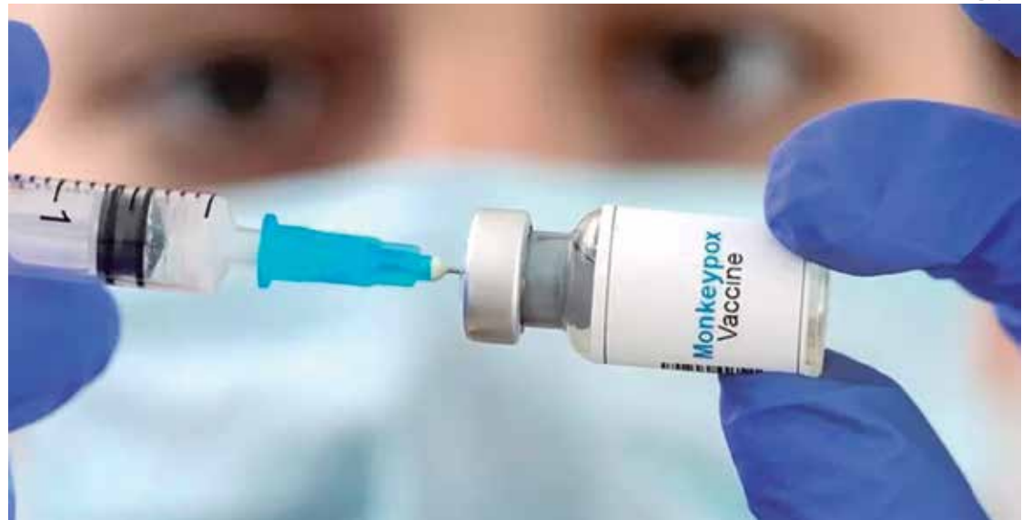
Vacina para monkeypox já chegou no Brasil mas precisa ser copiada

Segundo o boletim, 34,26 milhões de pessoas se recuperaram da covid-19, o