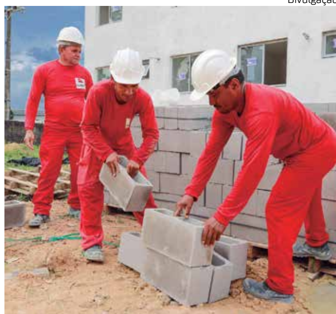
O setor da construção elevou de 3,5% para 6% a projeção do setor.

A Câmara Brasileira da Indústria da Construção (Cbic) elevou de 3,5% para 6% a projeção do setor em 2022. "Os indicadores mensais de Manaus seguem na média e alguns até superam os da Câmara Brasileira. Os números do Implurb são bastante