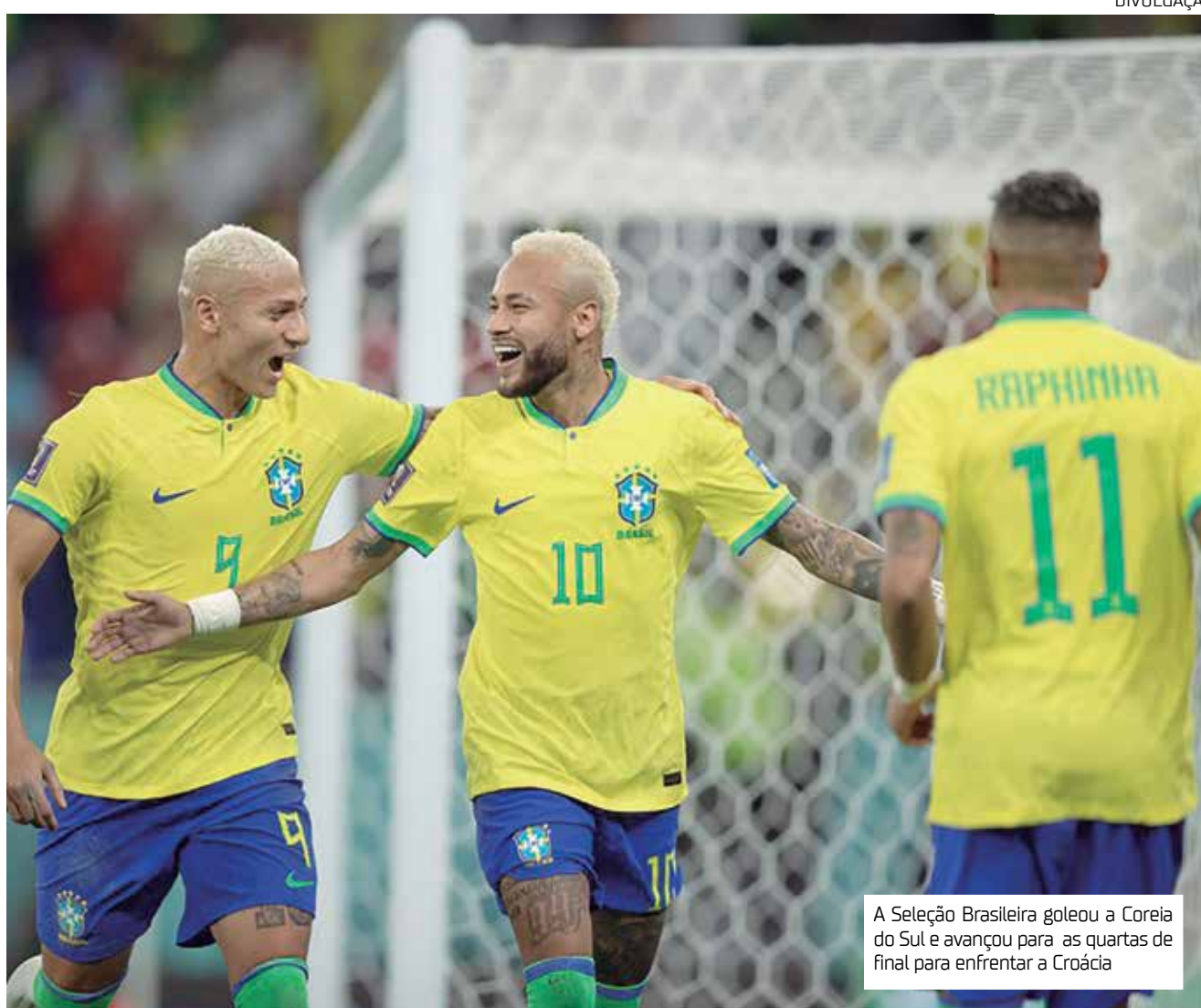
A Seleção Brasileira goleou a Coreia do Sul e avançou para as quartas de final para enfrentar a Croácia

Se eles depositavam esperança em Son, o Brasil tinha Richarlison. O camisa 9 brigou pela bola, tabelou com Marquinhos e recebeu na frente de Thiago Silva. Foi só escolher o canto para marcar seu terceiro gol na Copa: 3 a 0 antes