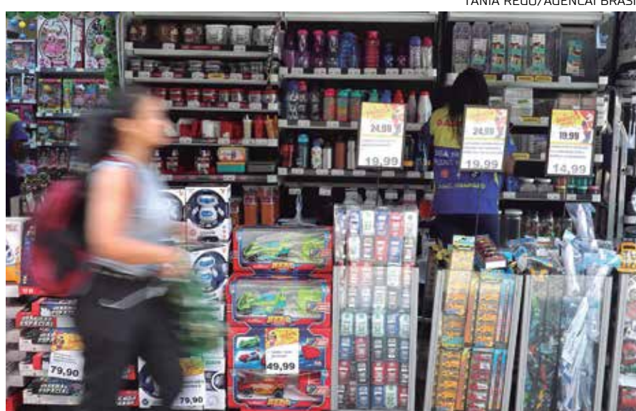
No acumulado de 2022, o país contabiliza 2,3 milhões de novos postos

No acumulado de 2022, o país contabiliza 2,3 milhões de novos postos de trabalho - desses, 1,661 milhão (71,6%) por meio de micro e pequenas empresas. A participação de médias e grandes na geração de empregos é de 22%, com 513 mil contratações.