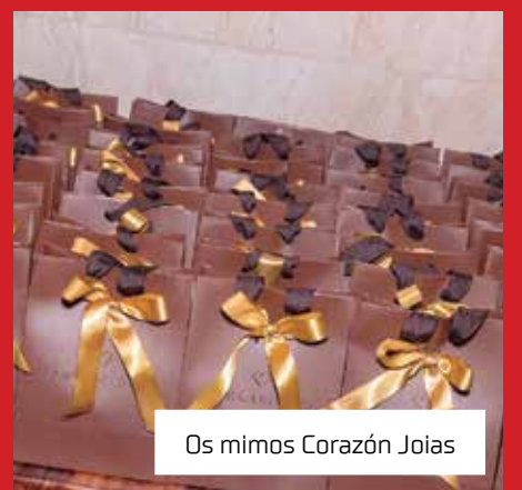
Os mimos Corazón Jóias