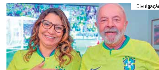
O presidente gravou vídeo após vitória do Brasil