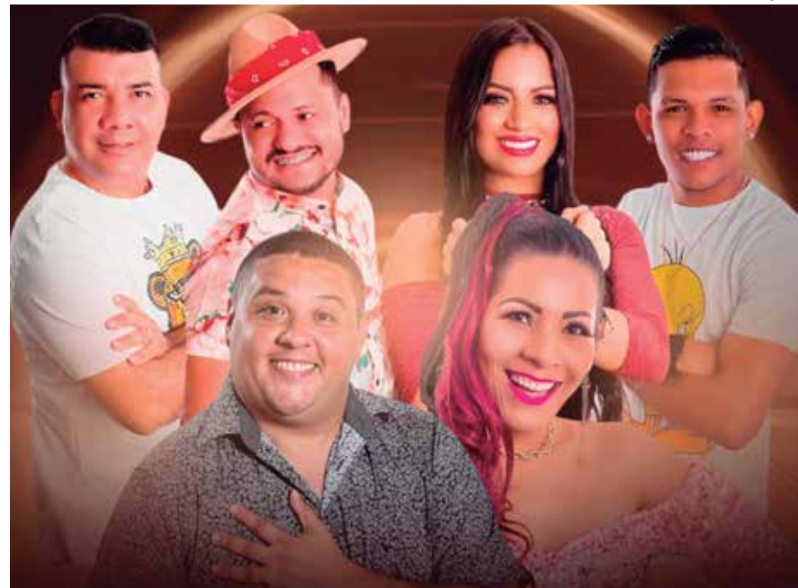
As bandas se apresentarão no Rancho Sertanejo e prometem balançar o público com grandes sucessos

Os ingressos estão à venda online e podem ser adquiridos pelo site www.bilheteriadigital.com , no valor de R$30 (1 lote). A festa começa a partir das 20h e promete ir até às 5h da manhã. Para mais informações, os interessados podem entrar em contato pelo telefone disponibilizado: (92) 98150-0430 ou seguir as bandas pelas redes sociais.