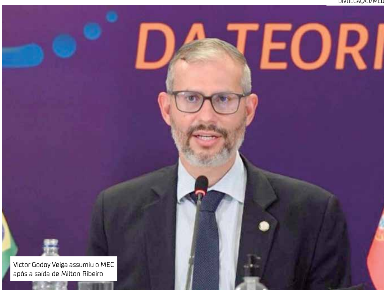
Victor Godoy Veiga assumiu o MEC após a saída de Milton Ribeiro

"Registramos, naturalmente, a questão da dificuldade orçamentária, que hoje é o que mais nos preocupa. Deixei claro que o Ministério da Educação já fez o levantamento dos impactos, já encaminhou para o Ministério da Economia, já falei com o ministro (Paulo) Guedes, com o ministro (Ciro) Nogueira, da Casa Civil, e estamos nesse trabalho para tentar