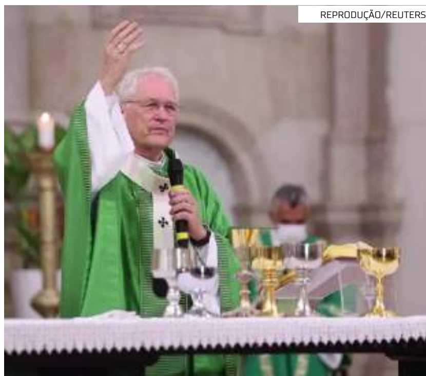
Dom Leonardo Steiner, arcebispo de Manaus

O mercado municipal Dr. Jorge de Moraes tem 59 anos de fundação (1963) e atende a 18 permissionários. Gera 36 empregos diretos e cerca de 150 indiretos. A última reforma no local havia sido há 17 anos. As atividades desenvolvidas no espaço, na maioria, são: vendas de estivas, lanches, verduras, frutas e peixes, além de uma ótica em funcionamento, nas dependências do mercado.