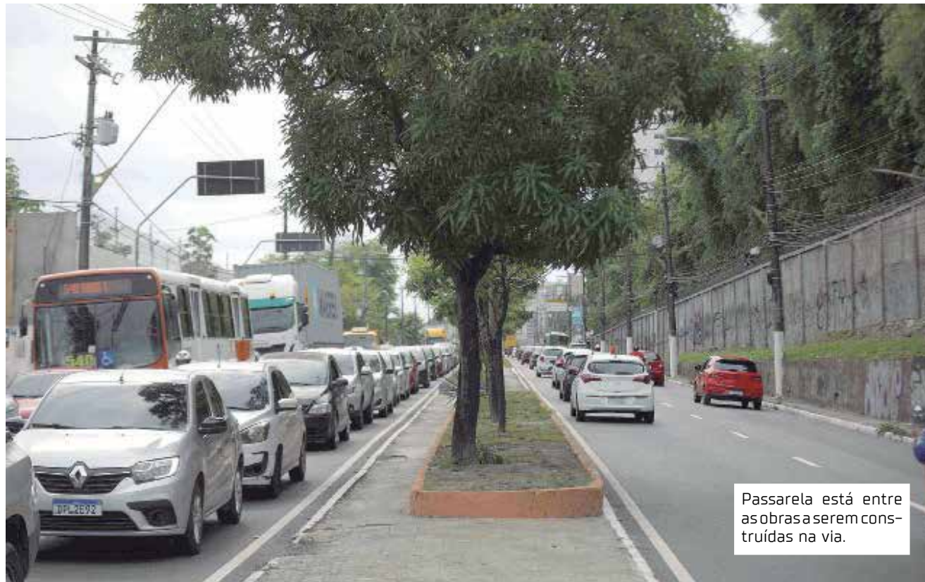
Passarela está entre as obras a serem construídas na via.

"Os investimentos do Governo do Estado na capital já garantem, por exemplo, o passe-livre para os estudantes, vai permitir a construção de viadutos, a melhoria do transporte coletivo com a aquisição de ônibus elétrico, e a construção de termi-