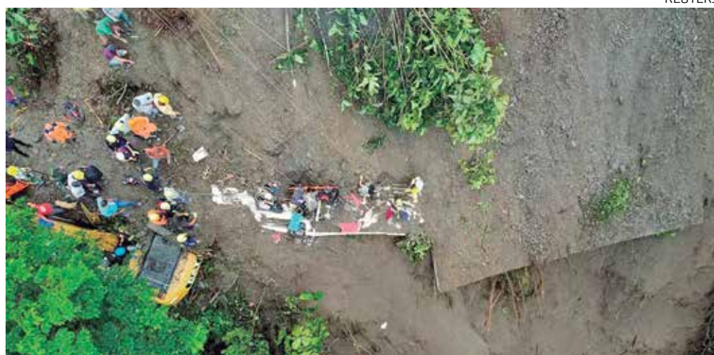
O deslizamento de terra foi causado por fortes chuvas no País

bia, Gustavo Petro, descreveu o incidente como uma tragédia em uma mensagem no Twitter.