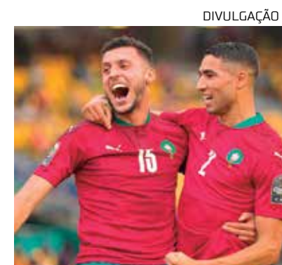
Marrocos vem apresentando surpresas durante a Copa do Mundo Fifa 2022

Quem deseja acompanhar pela internet, a partida será transmitida pela Globoplay e FIFA+.