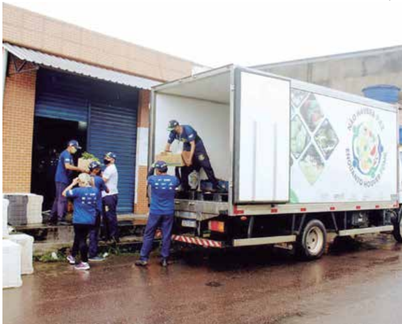
Segundo o governo, iniciativa beneficia 291 mil famílias.