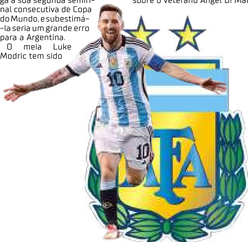
Quem avançar do confronto entre argentinos e croatas enfrenta o vencedor de França e Marrocos na decisão da Copa do Mundo

"Sim, tem sido cansativo chegar à prorrogação em duas partidas, estamos esgotados, mas estamos fortes com força, energia e entusiasmo, assim que estamos. Vamos dar tudo como temos feito em todas partidas anteriores. Temos conseguido nos recuperar depois das partidas e contra a Argentina será o mesmo. Não temos problemas de lesões no time titular, todos estão em forma, descansando, e não tem cansaço", afirmou Dalic em entrevista coletiva nesta segunda (12)..