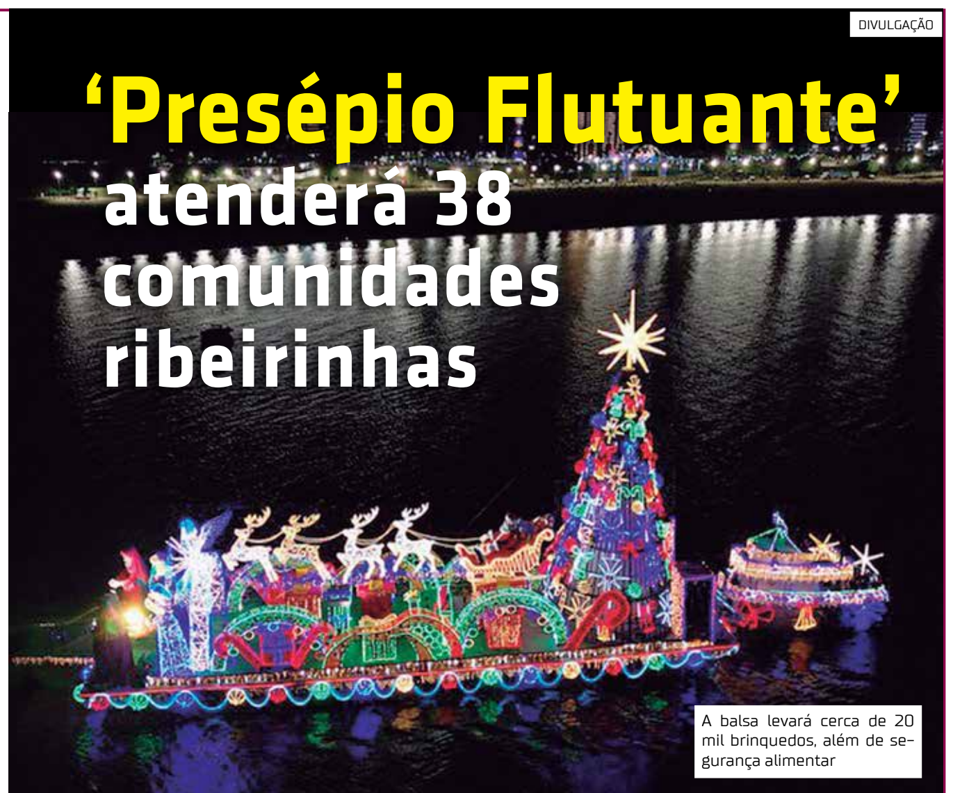
A balsa levará cerca de 20 mil brinquedos, além de segurança alimentar