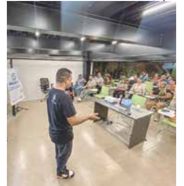
A turma conta com 50 alunos

Iniciou nesta segunda-feira (12), a segunda turma do curso ‘Produção de Eventos de Rua’, no Casarão da Inovação Cassina, localizado no Centro Histórico de Manaus. O curso é uma iniciativa da Prefeitura de Manaus por meio da Fundação Municipal de Cultura, Turismo e Eventos (Manauscult).