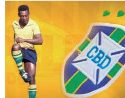
Os corações serão uma homenagem ao rei do futebol