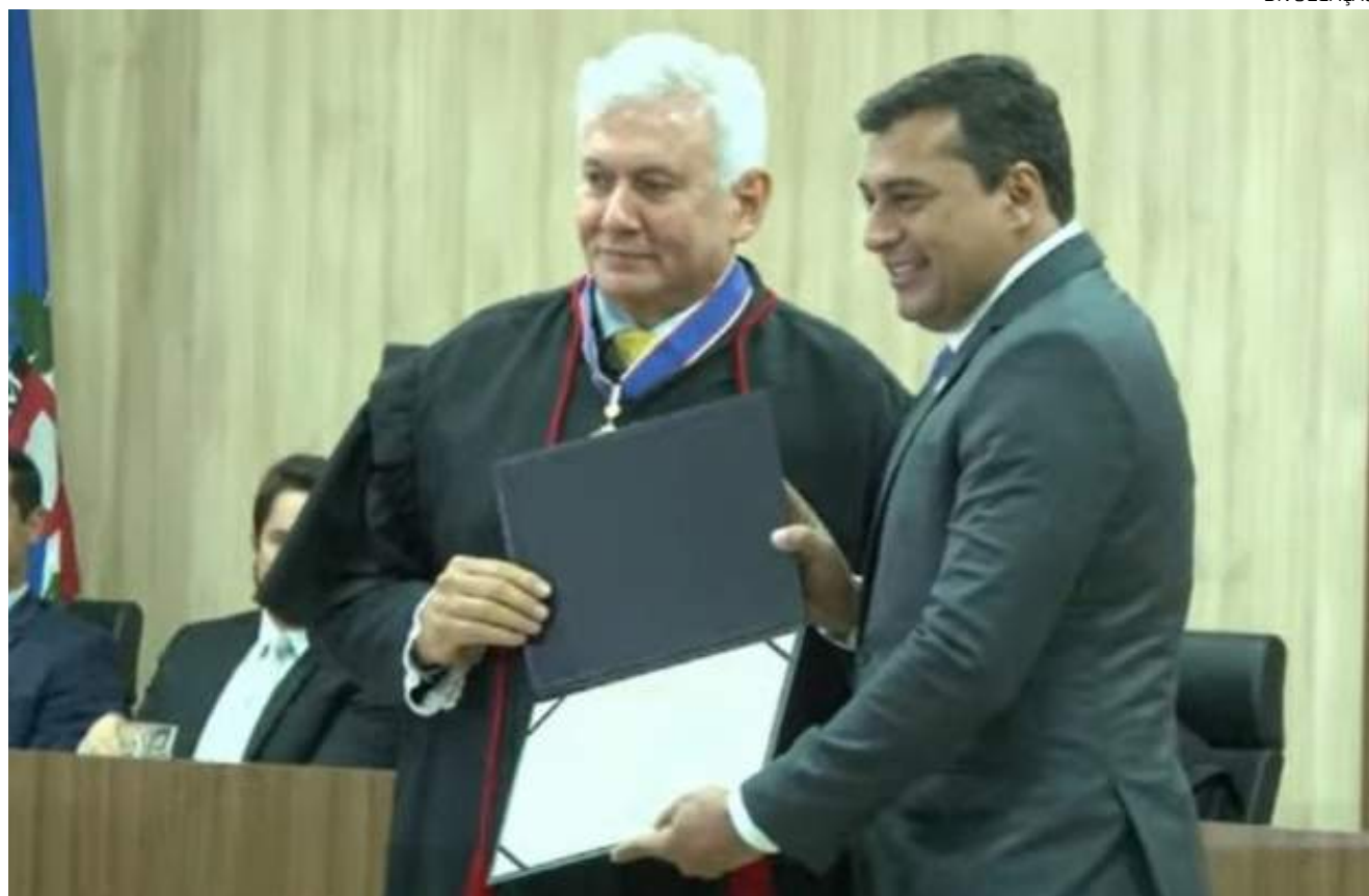
Wilson voltou a afirmar que sua vitória representa o fim dos caciques antigos da política do Amazonas

nos últimos quatro anos passou a conhecer como funciona a máquina pública que permite o funcionamento do serviço público.