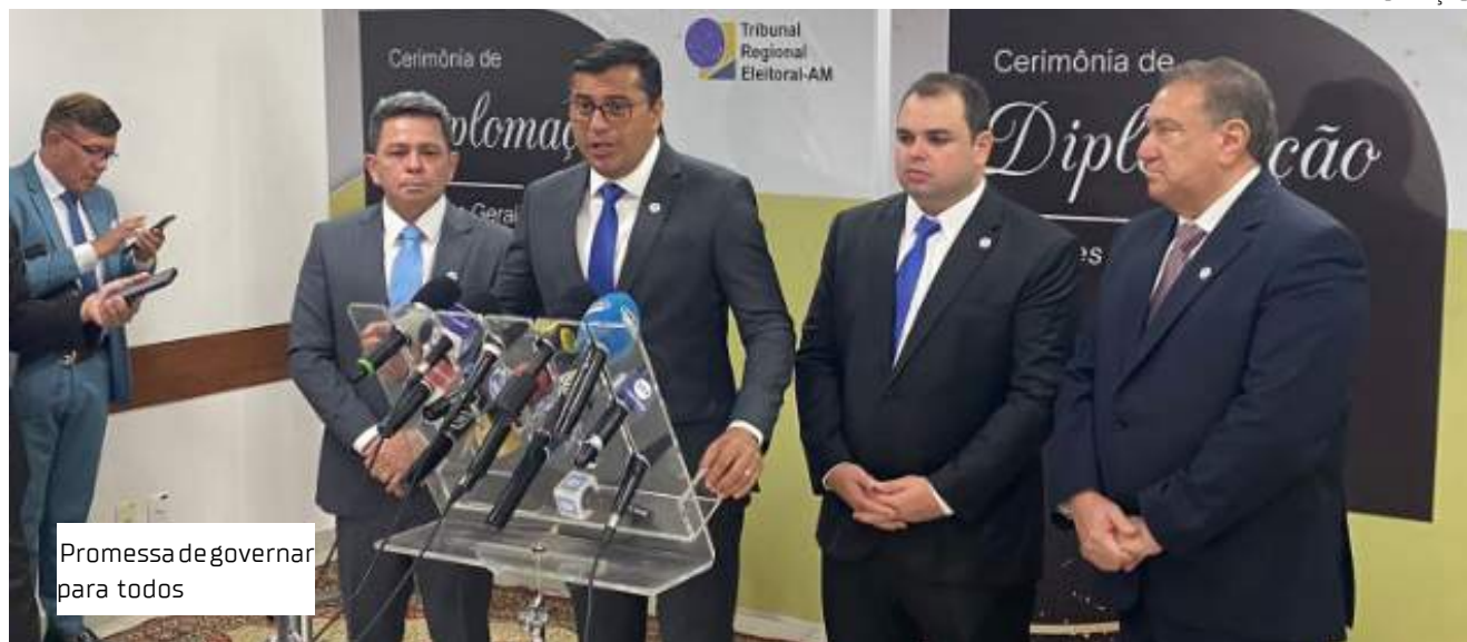
Promessa de governar para todos

"Ha um novo capítulo na história do Amazonas sendo escrito agora", disse Wilson, reafirmando que "os velhos caciques" ficaram para trás.