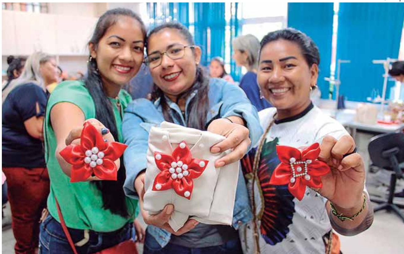
Curso foi promovido pela CRDM.

"Finalizando o curso, onde essas mulheres puderam aprender diversas técnicas úteis para geração de recursos e até para uso próprio, sentimos um imenso prazer em concluir mais um de uma série de cursos que o nosso equipamento vem promovendo, com o objetivo de capacitá-las para que sejam prevenidas ou encerrados possíveis ciclos de violência", explicou a coordena-