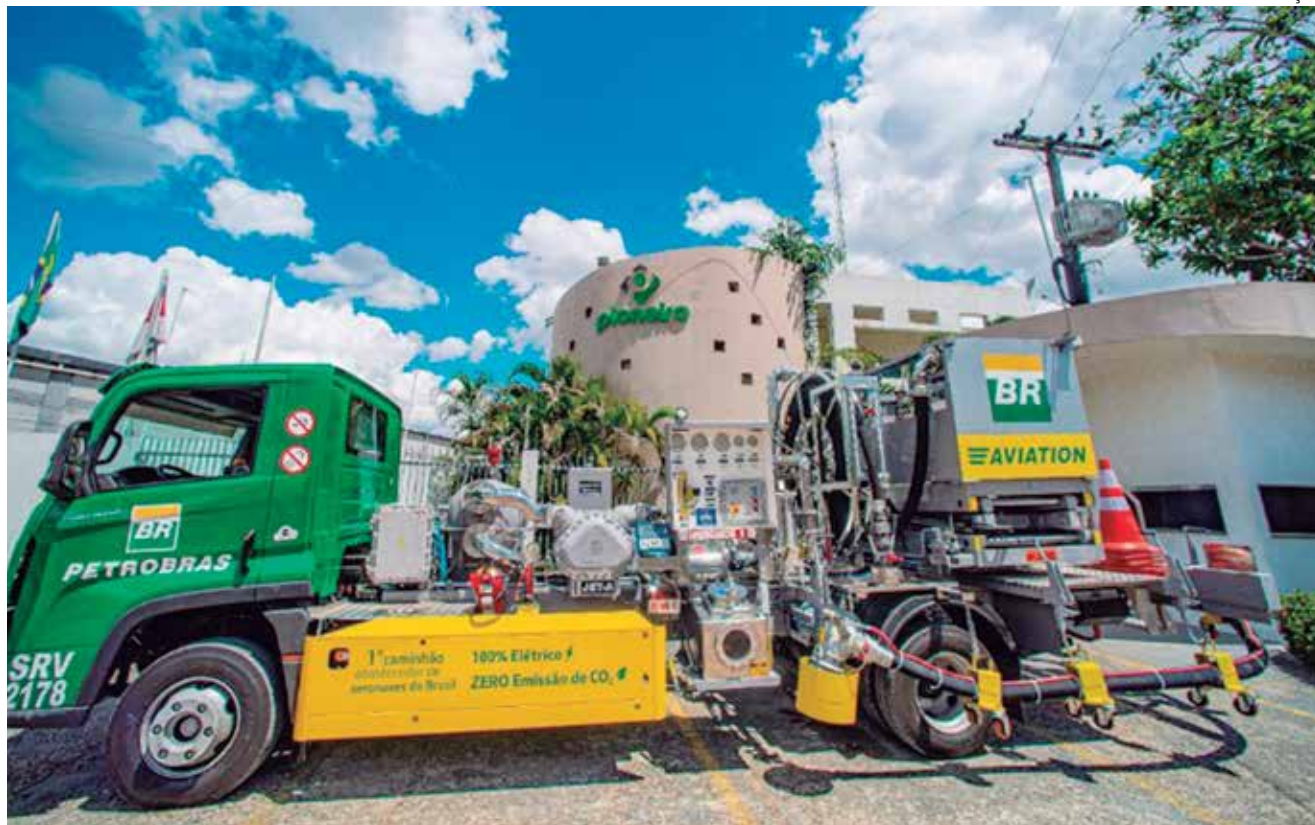
Parceria entre a Pioneiro Combustíveis, a BR Aviation e a Volkswagen Caminhões e Ônibus

A iniciativa abre uma possibilidade imediata, de rápida adoção, para reduzir o impacto do setor de aviação no aquecimento global. “Sabemos que a transformação