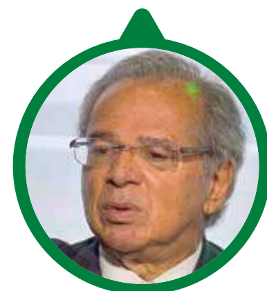
Paulo Guedes Ministro da Economia

Para os trabalhadores que recebem por dia ou por hora, o valor mínimo a ser pago na jornada diária será de R$43,40 (quarenta e três reais e quarenta centavos), e o valor pago por hora será de R$5,92 (cinco reais e noventa e dois centavos).