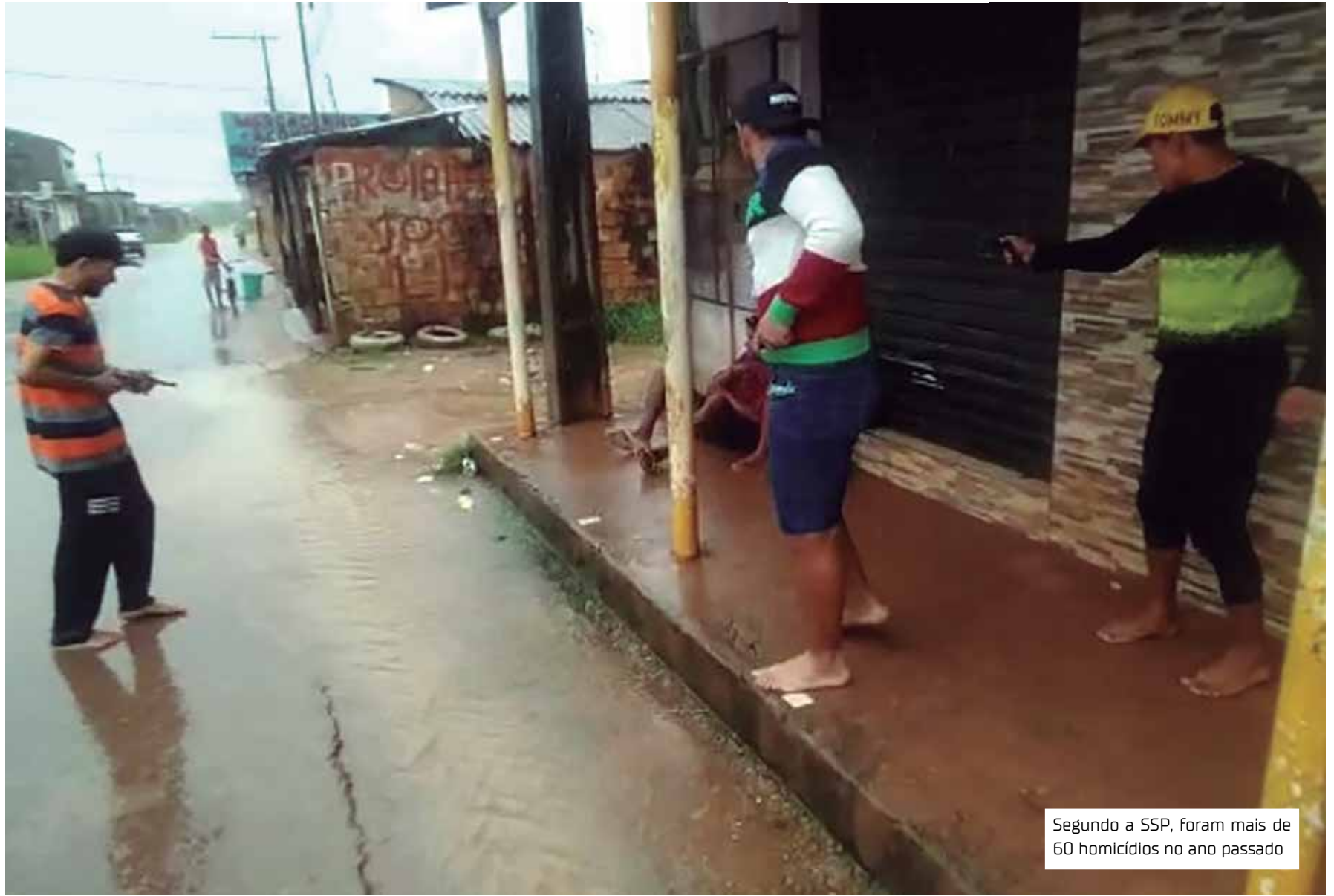
Segundo a SSP, foram mais de 60 homicídios no ano passado

Na última quinta-feira (7), uma ação da Polícia Civil prendeu dois