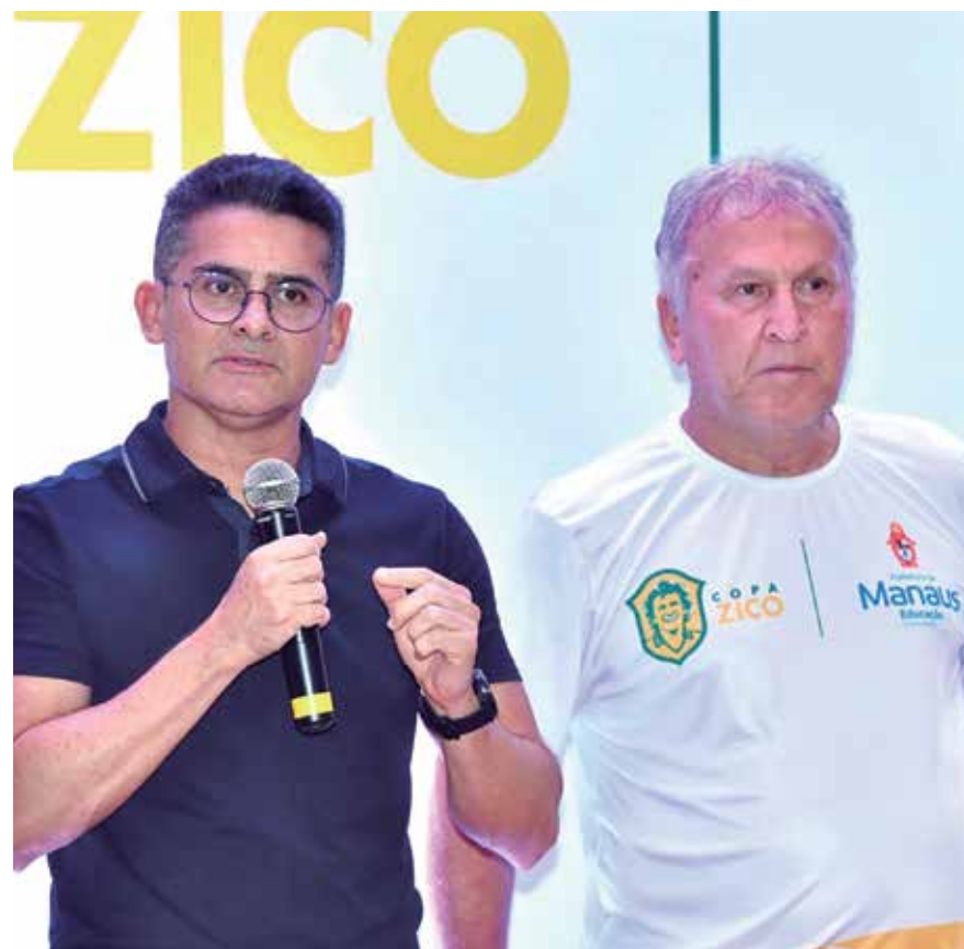
Prefeito concedeu entrevista na Arena da Amazônia, palco das partidas decisivas do torneio

"Trabalhamos a transversalidade entre o esporte e a educação para buscar melhorar os índices do ensino básico do município. Temos a terceira maior rede de