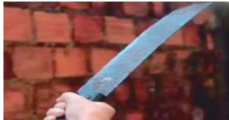
Homem morreu após golpes no abdômen, que perfuraram alguns órgãos

Conforme a autoridade policial, apesar do desentendi-