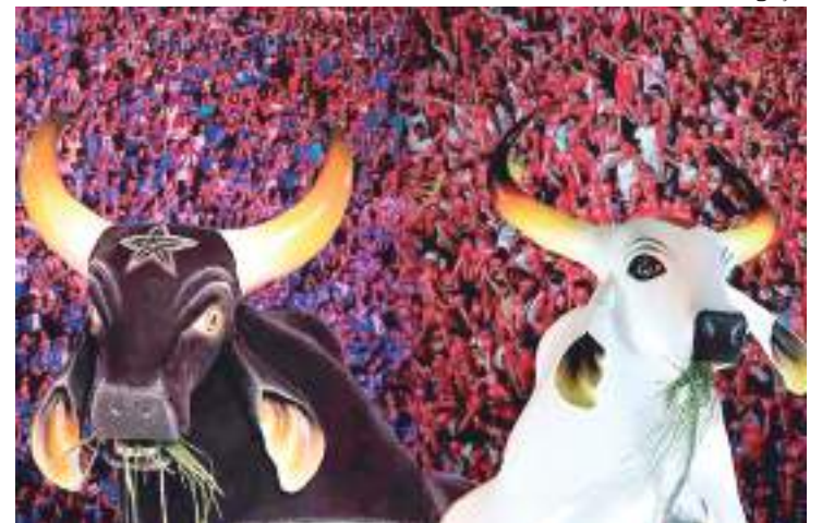
Bois Garantido e Caprichoso se unem em uma campanha

"Os Bois de Parintins clamam seus torcedores e admiradores da arte e da cultura indígena a apoiarem a essa causa. E se comprometem a prestar contas publicamente de todo o valor arrecadado e da destinação dos produtos que serão entregues aos Distritos Sanitários", destacaram os bumbás.