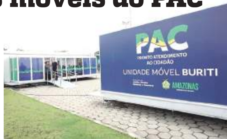
Unidade de Pronto Atendimento ao Cidadão na cidade de Manaus

Com as novas estruturas, a Secretaria de Estado de Justiça e Direitos Humanos (Sejusc) amplia o acesso aos serviços de cidadania também para a Região Metropolitana, nas cidades que não possuem PACs. Para essa região, o cronograma de municípios está em fase de definição.