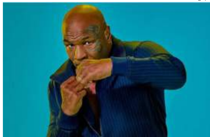
Mike Tyson é acusado por uma mulher de estuprá-la em uma limusine

Segundo depoimento datado de 23 de dezembro de 2022 e incluído no processo, a demandante afirma ter conhecido o boxeador “no início dos anos 1990”, em uma boate, e o seguiu até sua limusine, onde foi agredida e estuprada. Tyson ainda não se manifestou sobre o caso.