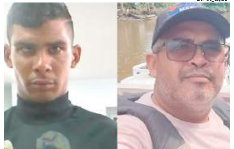
Homens estão sendo procurados pelos feminicídios de ex-companheiras

"A identidade do informante será preservada", afirmou a autoridade policial.