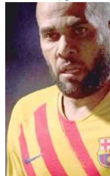
Daniel Alves está preso preventivamente desde sexta-feira