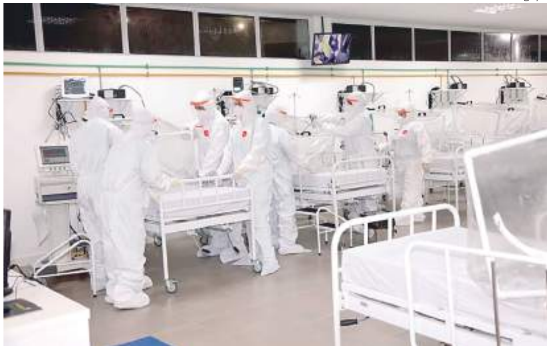
Profissionais de enfermagem trabalham em Manaus durante a pandemia de Covid-19

“É lá [Região Norte] que se vê com clareza onde o genocídio dos profissionais se deu forma mais aguda. É onde têm piores condições de trabalho e maior aglomeração da população desesperada por atendimento. O Amazonas foi um