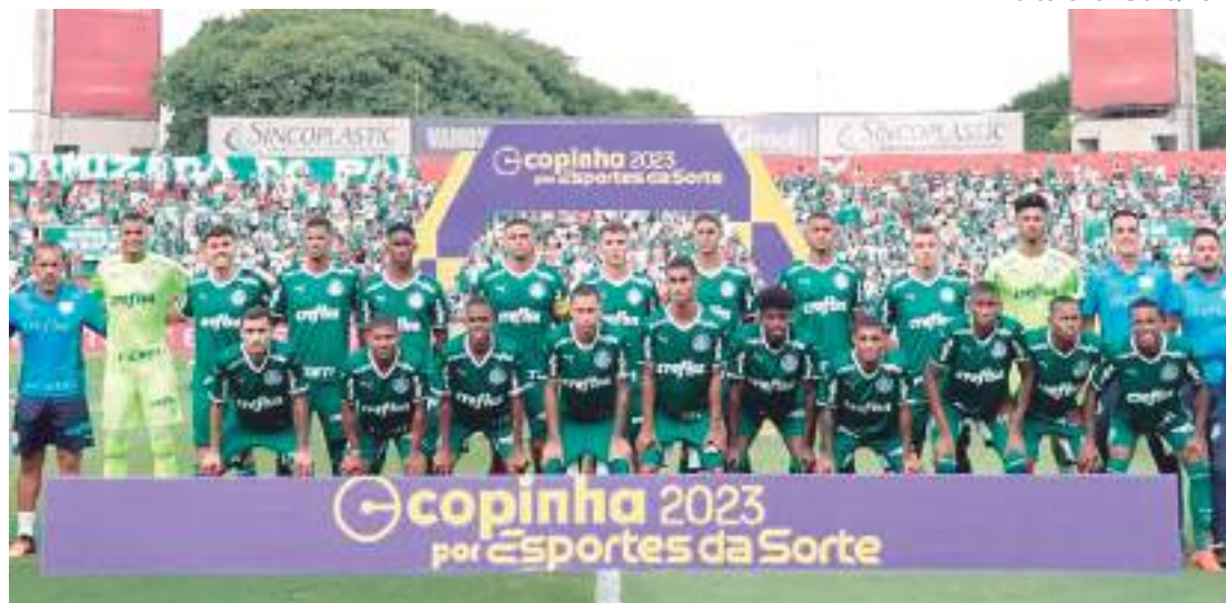
Palmeiras venceu o América-MG e se tornou bicampeão da Copinha 2023

O Palmeiras venceu o América-MG por 2 a 1, na tarde de ontem (25), e se tornou bicampeão da Copinha 2023.