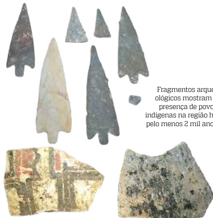
Fragmentos arqueológicos mostram a presença de povos indígenas na região há pelo menos 2 mil anos

za e remontagem do material que está sendo realizado no Musa, a equipe do Parinã irá levar, ainda no mês de fevereiro, parte dos objetos encontrados a São Gabriel da Cachoeira, com o objetivo de montar uma exposição com os resultados do trabalho para a comunidade local.