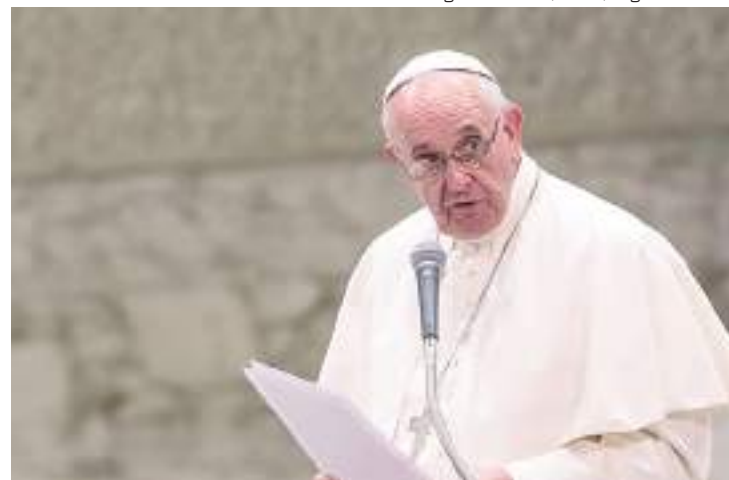
Papa Francisco durante discurso para fiéis no vaticano

Dados da Human Dignity Trust indicam que 67 países têm leis que criminalizam relações sexuais entre pessoas do mesmo sexo.