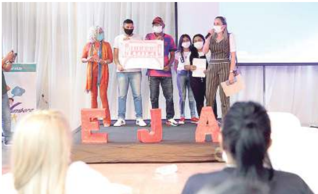
Educação de Jovens e Adultos recebe destaque em série documental do Globoplay

"No início do ano de 2022, fomos procurados pela Tv