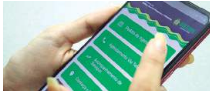
Aplicativo está disponível para os sistemas Android e IOS

Depois, o usuário vai inserir o código SJ-PAC e aceitar o termo de uso. Clicando na aba “agendamento”, poderá ser escolhido entre o auto-agendamento, onde se pode escolher o local, o dia e horário para atendimento.