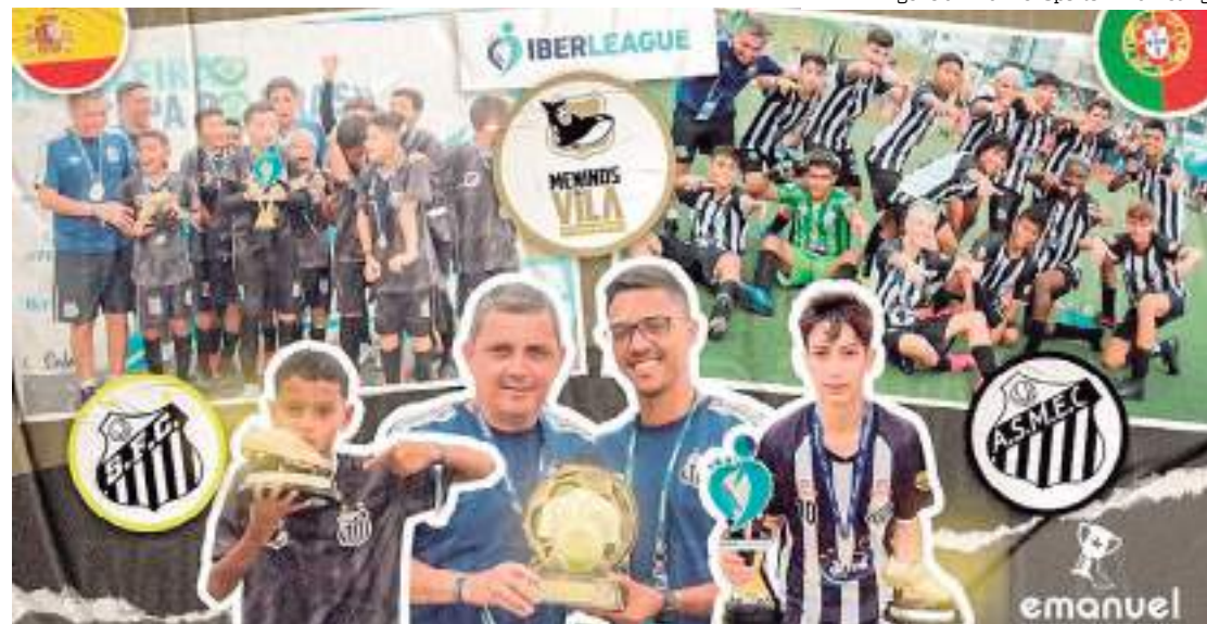
Equipes do Santos FC da Iberleague de Fut 7 da temporada de 2023, em São Paulo

e vamos reunir com eles durante a semana para definir um planejamento para disputar essas duas competições na Europa, porque a Ibercup é uma grande vitrine para os nossos atletas nas duas categorias”, concluiu o treinador do Peixe.