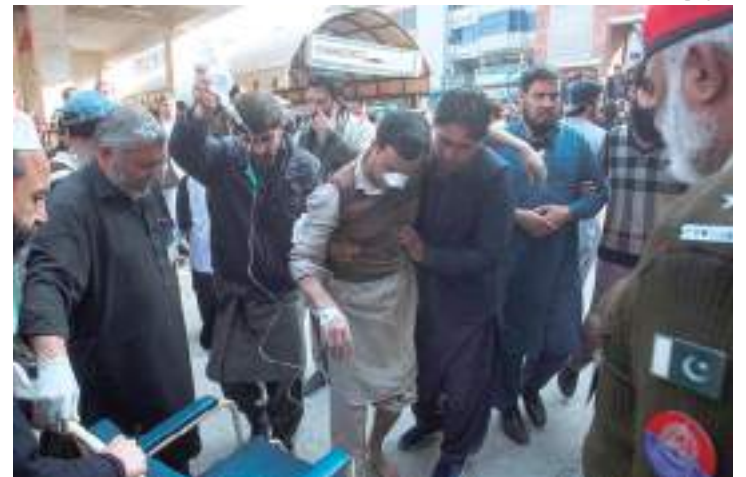
Sobreviventes do atentado são socorridos pela população

No complexo onde ocorreu a explosão encontra-se também um departamento de contraterrorismo, disse o chefe da polícia de Peshawar, Ijaz Khansaid.