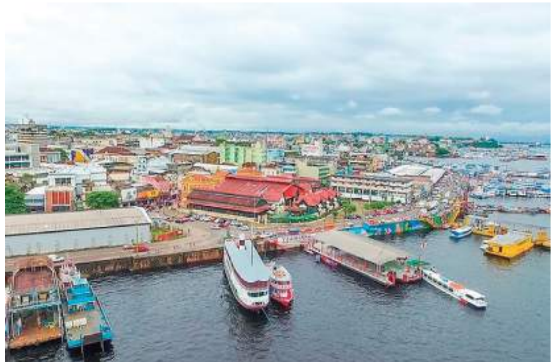
Porto de Manaus é um elemento importante para o comércio da cidade

“A Prefeitura de Manaus fez ações de cuidado e segurança para garantia da vida, da saúde e para vacinação da população, mas não deixou de realizar investimentos que promovessem a economia, o comércio e o setor de serviços, mobilizando secretarias e ações para deixar o ambiente municipal positivo e propício a novos negócios e ampliações. Tudo isso é importante para empresários e empreendedores”, comentou o diretor-presidente do Instituto Municipal de Planejamento Urbano (Implurb),