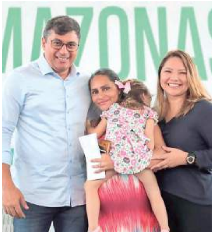
Wilson Lima entrega cartões do Auxílio Estadual Permanente

O governador ressaltou que, assim que o recurso é liberado, todo dia 15 de cada mês, nas primeiras 12h, são utilizados 50% dos valores,