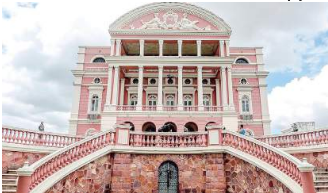
Entrada do Teatro Amazonas no Centro da cidade de Manaus

O Teatro Amazonas integra o conjunto de espaços culturais administrados pelo Governo do Amazonas, por meio da Secretaria de Cultura e Economia Criativa. Para o secretário da pasta, Mar-