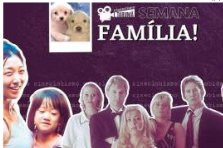
Filmes escolhidos são obras do Japão e da Dinamarca

Todas as suas sessões são gratuitas, e o projeto sempre esteve envolvido com a formação cinematográfica, funcionando ora como um cineclube, ora como sala de