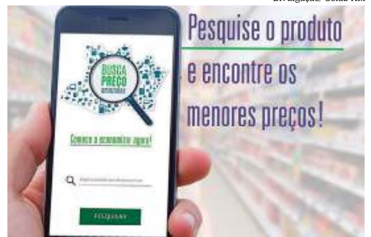
Ferramenta digital auxilia na hora de pesquisar preços

A pesquisa de custo foi realizada direto no site da Secretaria de Fazenda, www.sefaz.am.gov.br , colocando-se individualmente o nome de cada item constante na relação de material escolar de uma rede particular de ensino, para quem está matriculado no 2º ano do ensino médio.