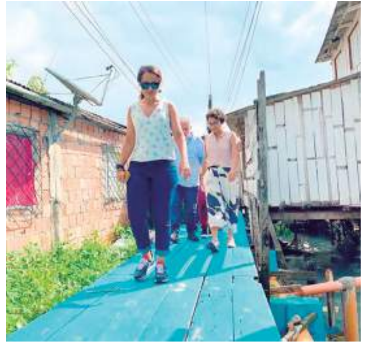
Integrantes da comitiva visitam beco Nonato, na Cachoeirinha