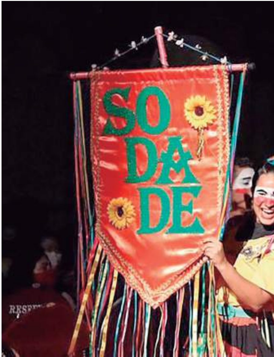
Cia e Produtora Panorando existe desde 2016

Entre os projetos da Cia e Produtora Panorando, destacam-se