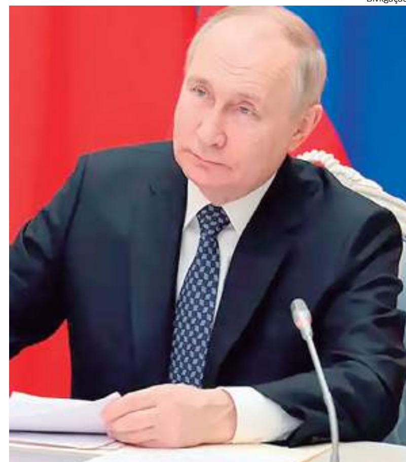
Presidente russo afirmou que farmácias estão coeçoando a ter falta de remédios

"Um recente aumento das infeções respiratórias levou a um aumento da procura de antibióticos como a amoxicilina, especialmente com formulações pediátricas", explicou ainda o regulador europeu.