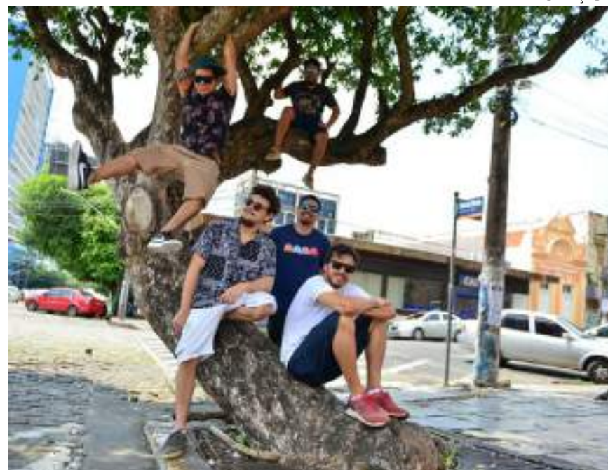
Integrantes da banda Alaidenegão apresentam novas músicas=

Os bilhetes do segundo lote estão à venda por R$ 60 pelo Sympla ( sympyla.com.br ).