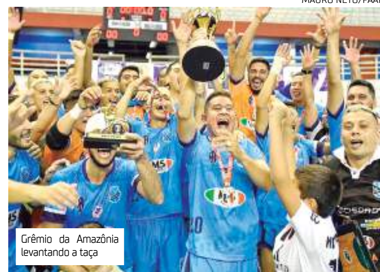
Grêmio da Amazônia levantando a taça

"Esse título representa muita vontade de vencer, mostramos que o Grêmio está na elite do futsal no torneio amazonense. Vamos com o melhor time possível para trazer essa Taça para o Amazonas", comentou.