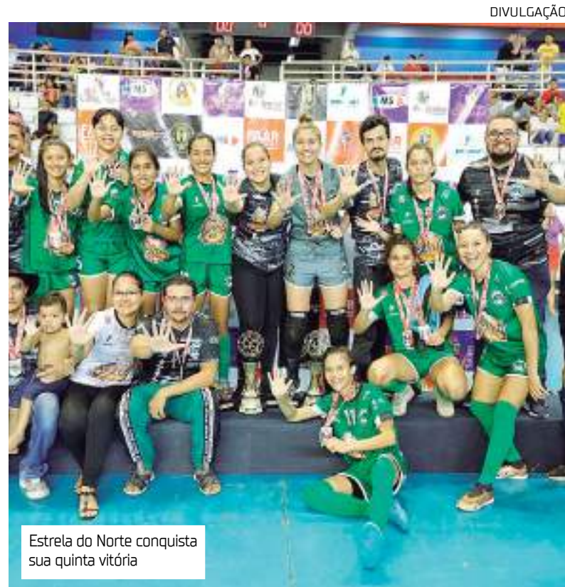
Estrela do Norte conquista sua quinta vitória

O título do Amazonense de 2022 foi o quinto esta-