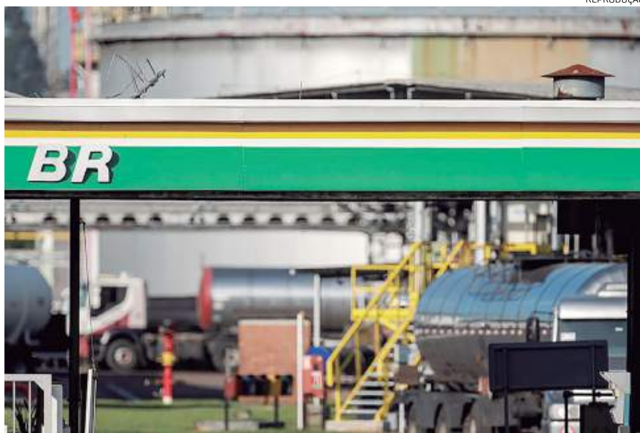
O reajuste foi para reajuste de 7,46% na gasolina

O preço médio de venda terá aumento de R$ 0,23 por litro. A empresa, em nota, justificou que o acréscimo é em decorrência do equilíbrio dos seus preços com o mercado