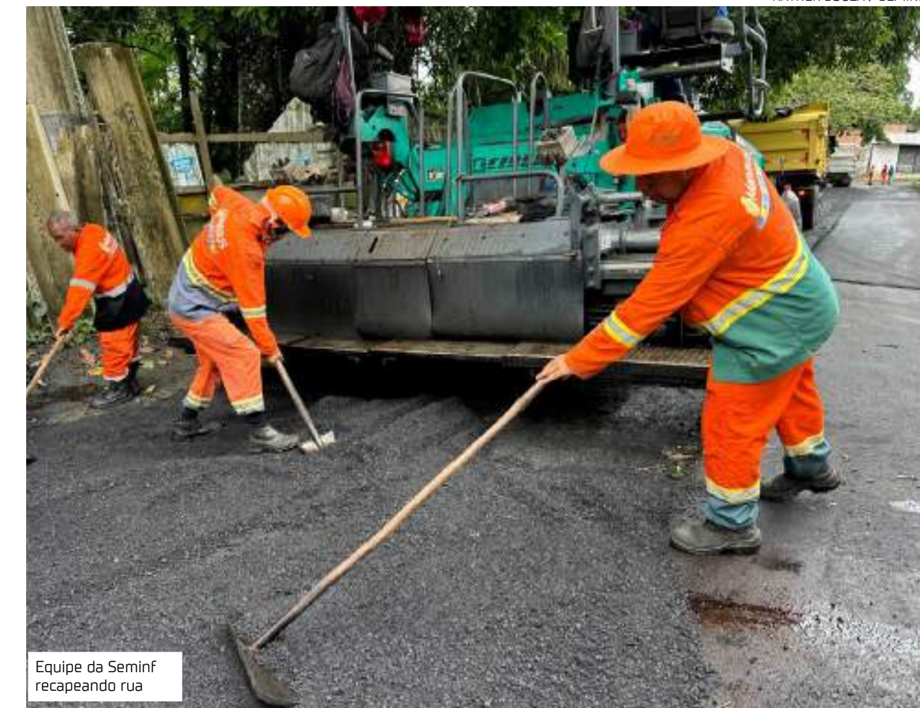
Equipe da Seminf recapeando rua

O programa foi implantado em 2022, em parceria com o Governo do Amazonas. O Asfalta Manaus leva servi-