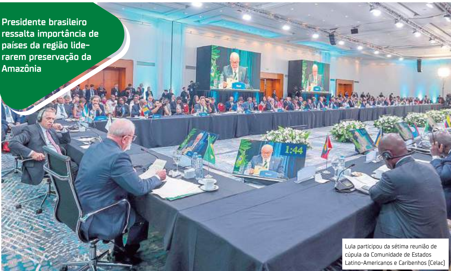
Lula participou da sétima reunião de cúpula da Comunidade de Estados Latino-Americanos e Caribenhos (Celac)

Presidente brasileiro ressalta importância de países da região liderarem preservação da Amazônia