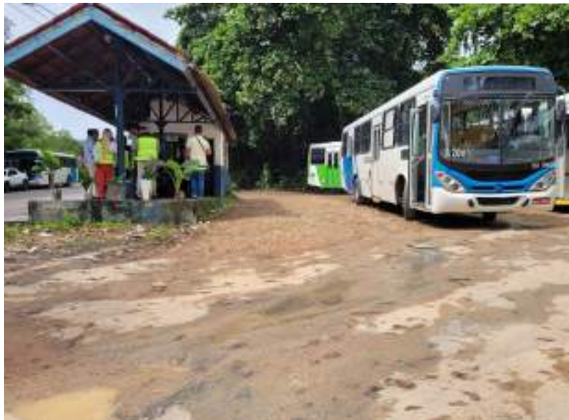
Reforma abrange melhorias na infraestrutura dos terminais