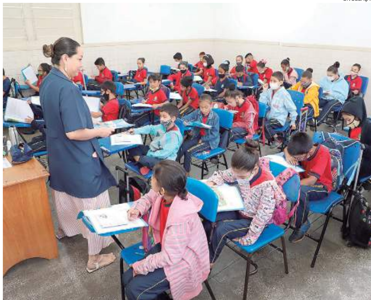
Quase 5 mil novos alunos reservaram vagas para estudar nas escolas da Semed em 2023