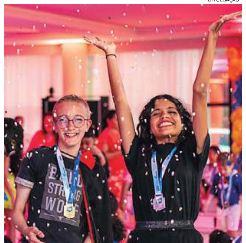
O evento contará com o tradicional desfile de fantasias com premiação

As crianças até 4 anos de idade não precisam pagar entrada. O ingresso antecipado custa R$ 10 + 1 kg de alimento não perecível para trabalhadores do comércio e seus dependentes, e R$ 15 + 1 kg de alimento não perecível para o público em geral. No dia do evento, também haverá venda de ingressos, porém o valor será R$ 20,00 + 1 quilo de alimento não perecível para todos os públicos. Os alimentos arrecadados serão doados para o Mesa Brasil Sesc, que atende 265 instituições sociais no Amazonas.