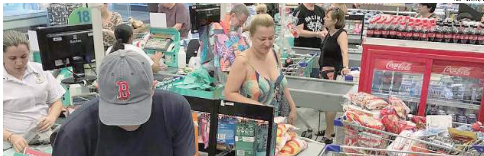
As análises da entidade sinalizam crescimento de 2,5% no consumo nos lares

O Consumo nos Lares Brasileiros, medido pela Associação Brasileira de Supermercados (Abras), encerrou 2022 com alta de 3,89% na comparação com o ano anterior. No último trimestre, o indicador permaneceu empatado com o de 3%, com altas acumuladas em outubro (3,02%), novembro (3,52%), dezembro (3,89%). Em dezembro, houve alta de 15,19% ante novembro. Na comparação com dezembro de 2021, a alta é de 6,23%.