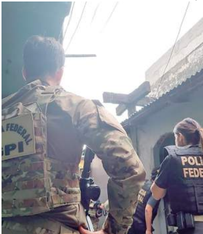
Agentes da PF realizam ações no Amazonas