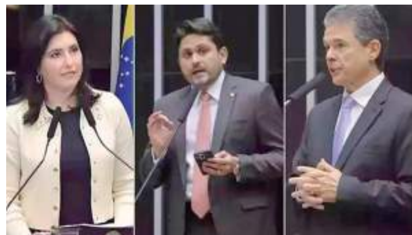
Simone Tebet, Juscelino Filho e André de Paula votaram a favor do impeachment

O ministro do Desenvolvimento Agrário, Paulo Teixeira; o secretário de Comunicação Social, Paulo Pimenta; e a ministra da Ciência, Tecnologia e Inovações, Luciana Santos, votaram contra o afastamento de Dilma.