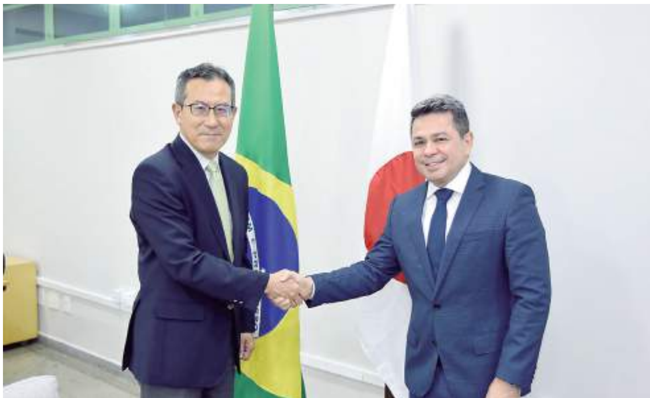
Novas alternativas para facilitar conexão aérea entre o Amazonas e o Japão foram discutidas entre as autoridades

O cônsul-geral do Japão falou também sobre projetos que estão em andamento ou em fase de planejamento, principalmente focados nas áreas de Saúde