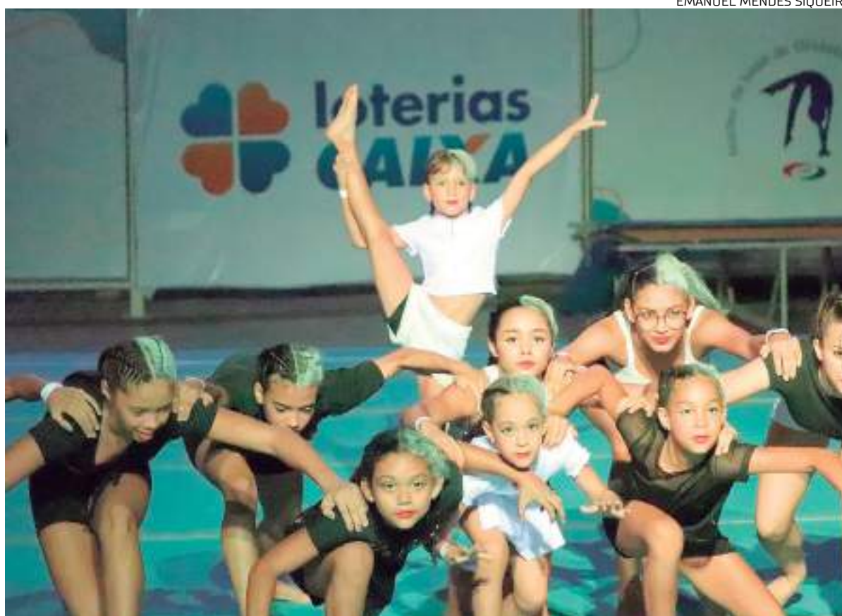
Ginastas se apresentando em Centro de Excelência Loterias Caixa

Além disso, é preciso levar a seguinte documentação: 2 fotos 3x4, cópia da Certidão de Nascimento ou RG, cópia do comprovante de residência, declaração escolar e CPF. As aulas de Ginástica Artística começarão no dia 6 de fevereiro, nos períodos matutino e vespertino. É importante destacar que o Centro de Excelência