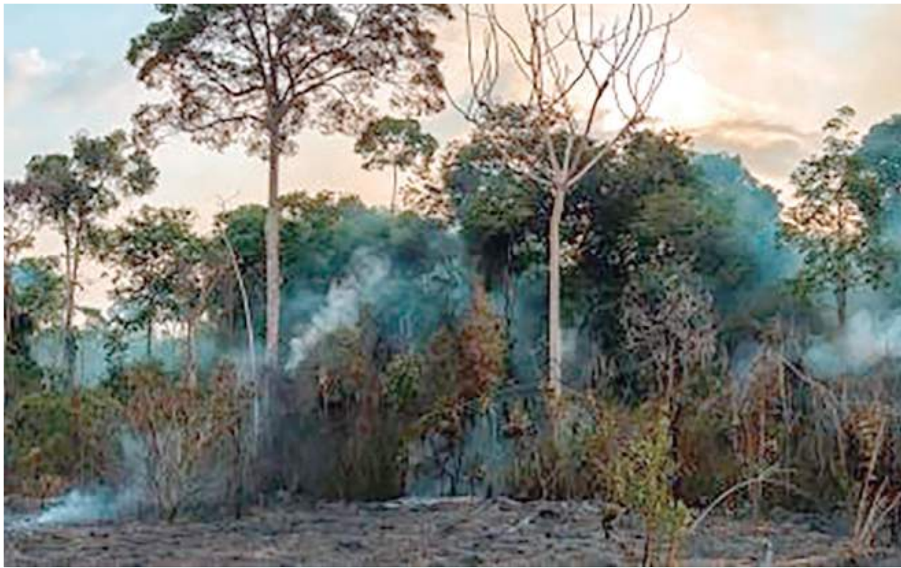
Degradação pode ter grandes impactos socioeconômicos no Brasil

Foram considerados quatro fatores principais de degradação: fogo na floresta, efeito de borda (as mudanças que acontecem em áreas de floresta ao lado das áreas desmatadas), ex-