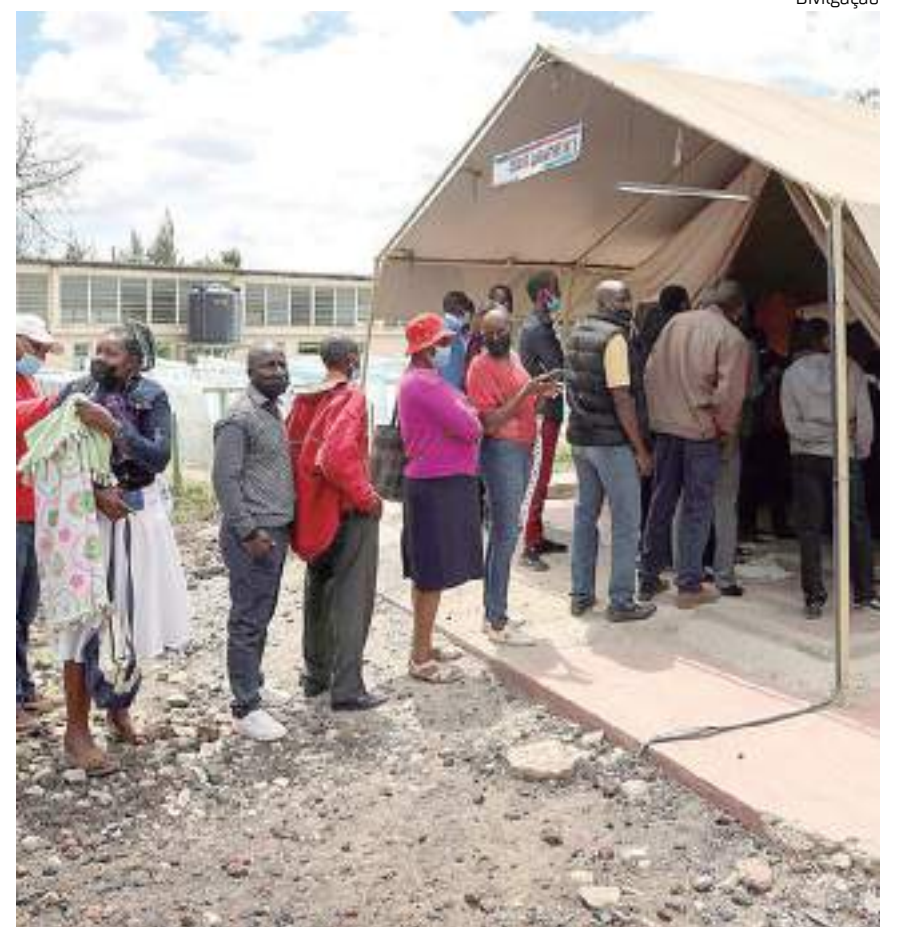
Africanos procuram ajuda médica, após surto de cólera em dez países

A cólera é uma doença que provoca fortes diarreias, que é tratável, mas que pode provocar a morte por desidratação se não for prontamente combatida – sendo causada, em grande parte, pela ingestão de alimentos e água contaminados por falta de redes de saneamento.