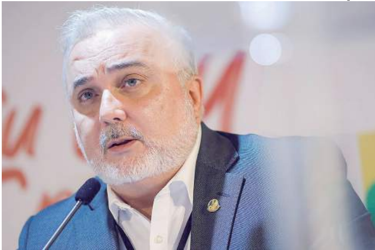
Presidente interino e conselheiro da Petrobras, Jean Paul Prates

Segundo a assessoria de imprensa da Petrobras, os diretores da empresa foram eleitos pelo Conselho de Administração em