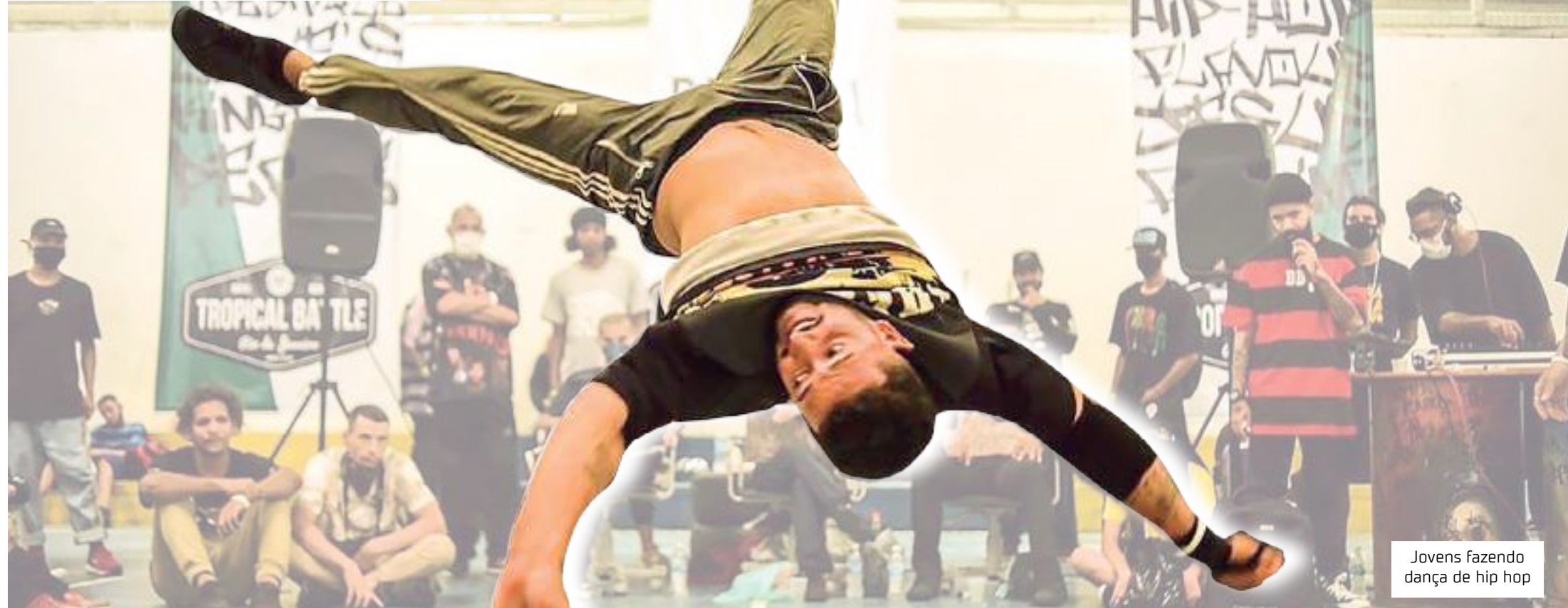
Jovens fazendo dança de hip hop

EMTEMPO | plateia@emtempo.com.br | Pricila de Assis