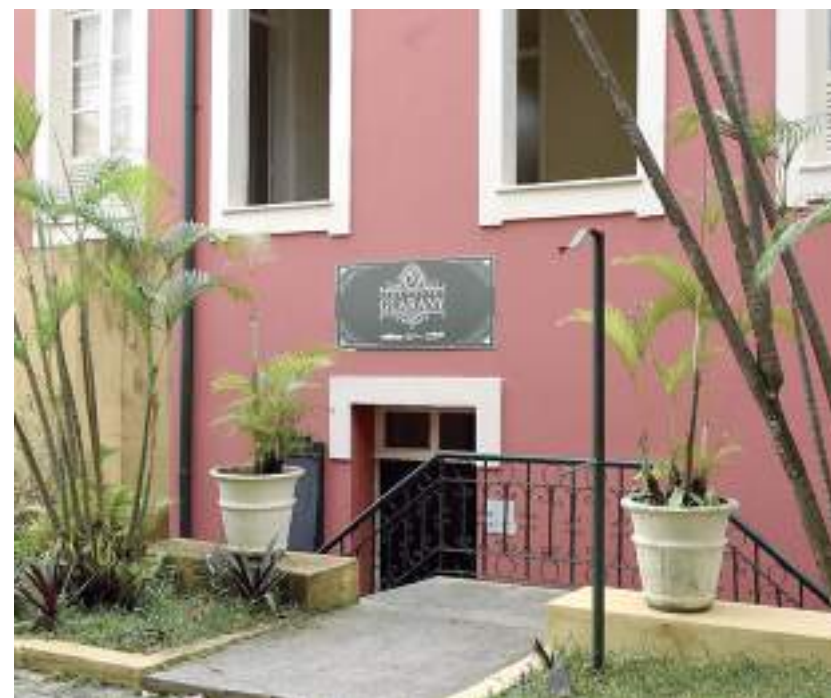
Cineteatro Guarany que divulga produções audiovisuais