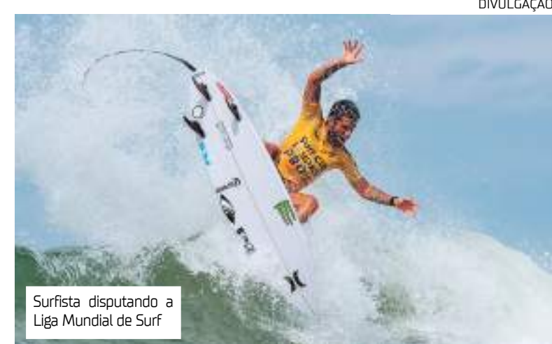
Surfista disputando a Liga Mundial de Surf

O término da temporada 2023 está previsto para o período de 7 a 15 de setembro, com as Finais da WSL na praia de Trestles, na Califórnia (Estados Unidos). A competição final, em formato de mata-mata, reunirá os cinco melhores do ano em cada gênero (feminino e masculino).