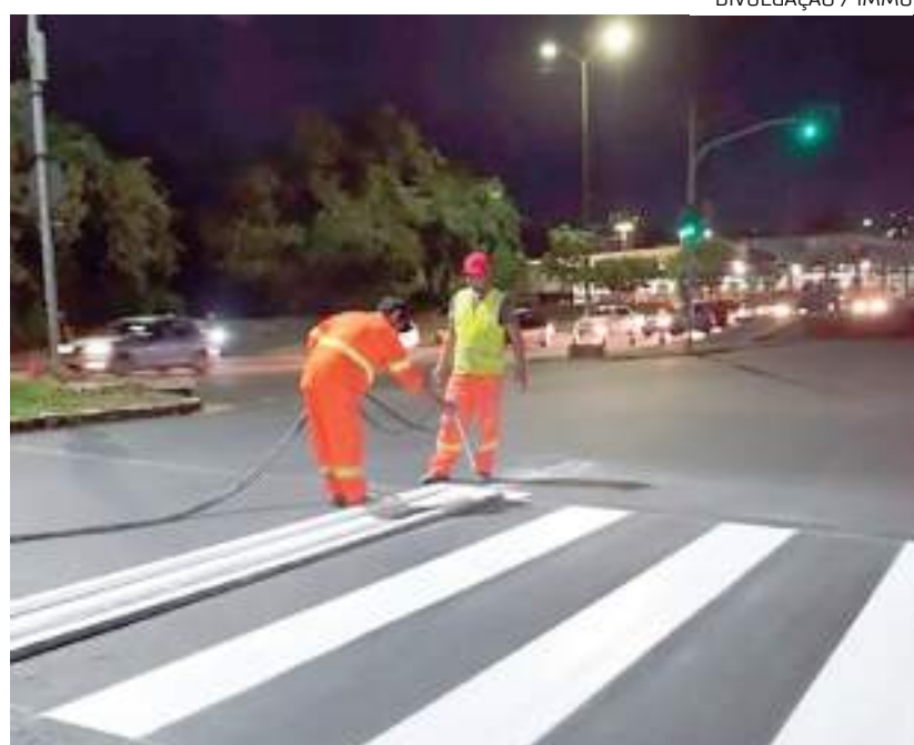
Equipes implantando sinalização horizontal em via pública

Fontes disse ainda que um relatório foi encaminhado à Justiça com mais seis indiciamentos pelos crimes de duplo homicídio qualificado e ocultação dos cadáveres.