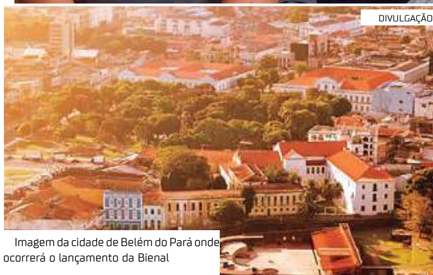
Imagem da cidade de Belém do Pará onde ocorrerá o lançamento da Bienal

vivem aqui e reafirmando a identidade plural, conforme ela explica.