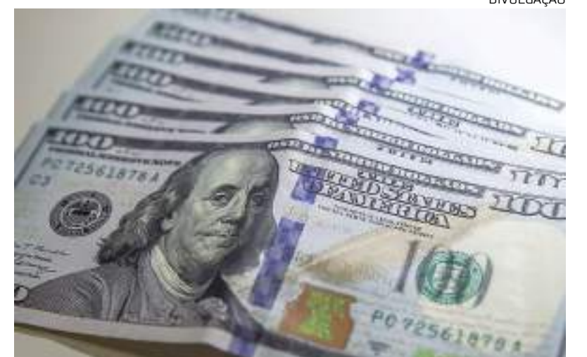
No acumulado de 2023 até aqui, a queda é de 1,55%

No cenário externo, a maior preocupação dos investidores neste início de semana envolve a possibilidade de uma recessão nos Estados Unidos em 2023. O mercado espera por novos pronunciamentos de dirigentes do Federal Reserve (Fed, o Banco Central americano) sobre a trajetória da taxa de juros no país.