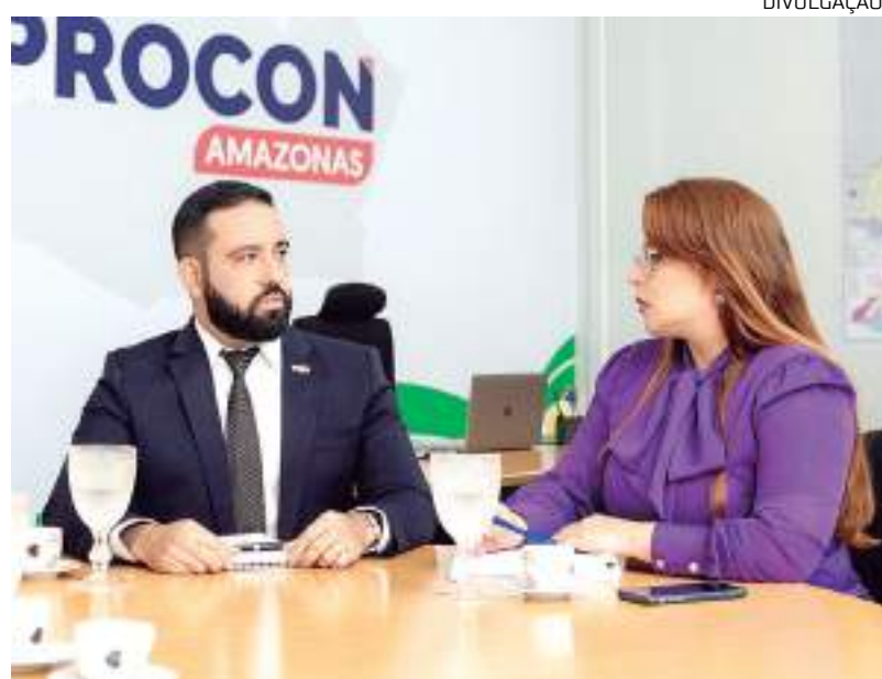
Diretor-presidente afirma que facilidades de investimento podem ser armadilha

“Os golpistas oferecem rendimentos distantes da realidade, captando o máximo possível de recursos no menor espaço de tempo possível, para, no momento certo, fugir