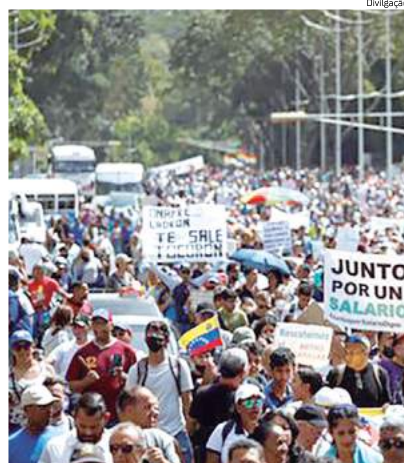
Funcionários públicos da Venezuela protestam por melhores salários