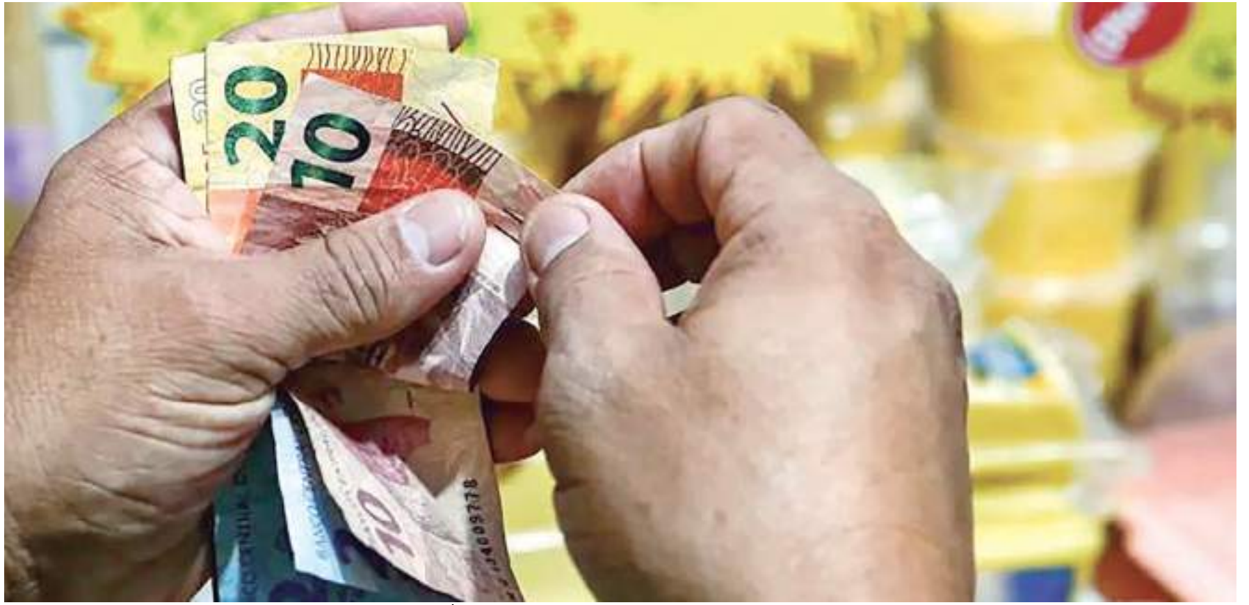
A expectativa para a cotação do dólar está em R$ 5,28 para o final de 2023

Em 2022, o Índice Nacional de Preços ao Consumidor Amplo (IPCA), que mede a inflação oficial, fechou com uma taxa de 5,79% acumulada no ano. A meta estava em 3,5%, com