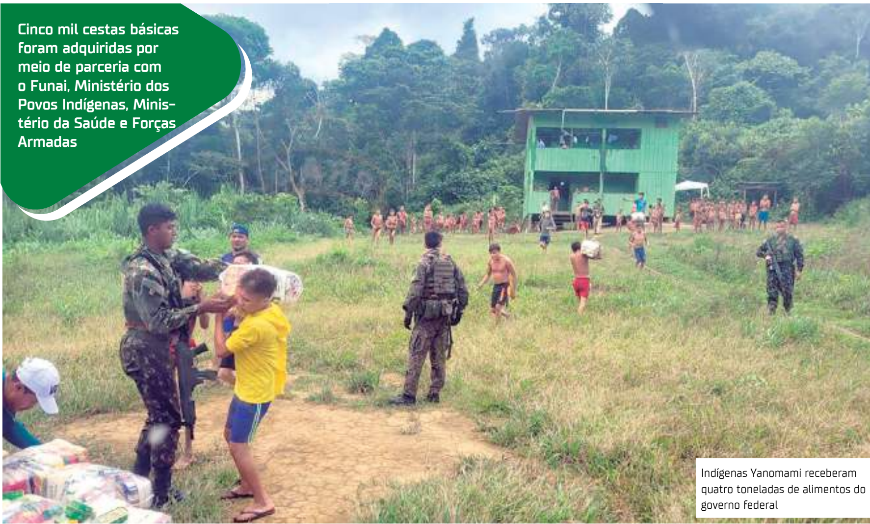
Indígenas Yanomami receberam quatro toneladas de alimentos do governo federal

Cinco mil cestas básicas foram adquiridas por meio de parceria com o Funai, Ministério dos Povos Indígenas, Ministério da Saúde e Forças Armadas