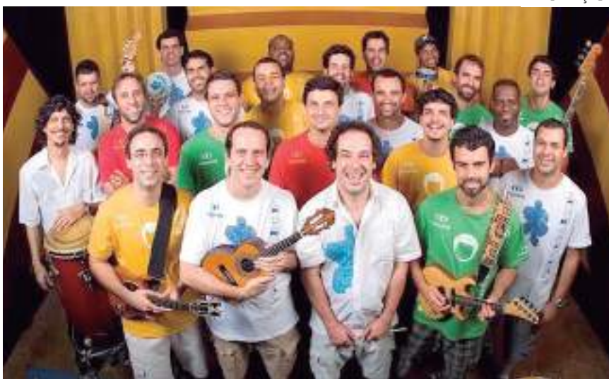
Monobloco é uma das atrações do Bloco da Alegria, que acontece na Zona Oeste

O evento é uma realização da Rádio FM O Dia Manaus e da Associação de Entretenimento do