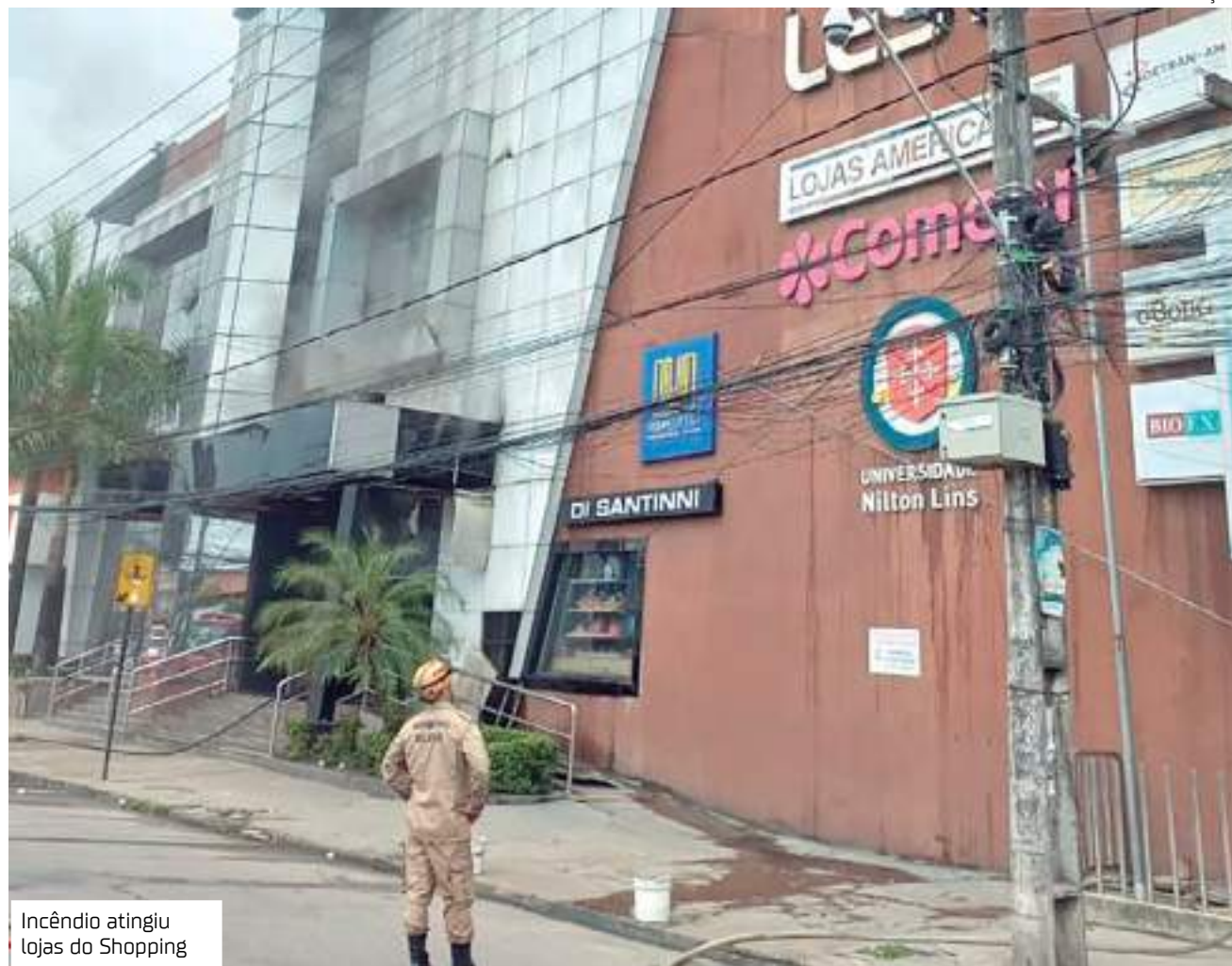
Incêndio atingiu lojas do Shopping

beiros Militar do Amazonas (CBMAM), o fogo começou no depósito de uma loja de sapatos, no primeiro andar, que corresponde ao 2º pavimento do shopping.