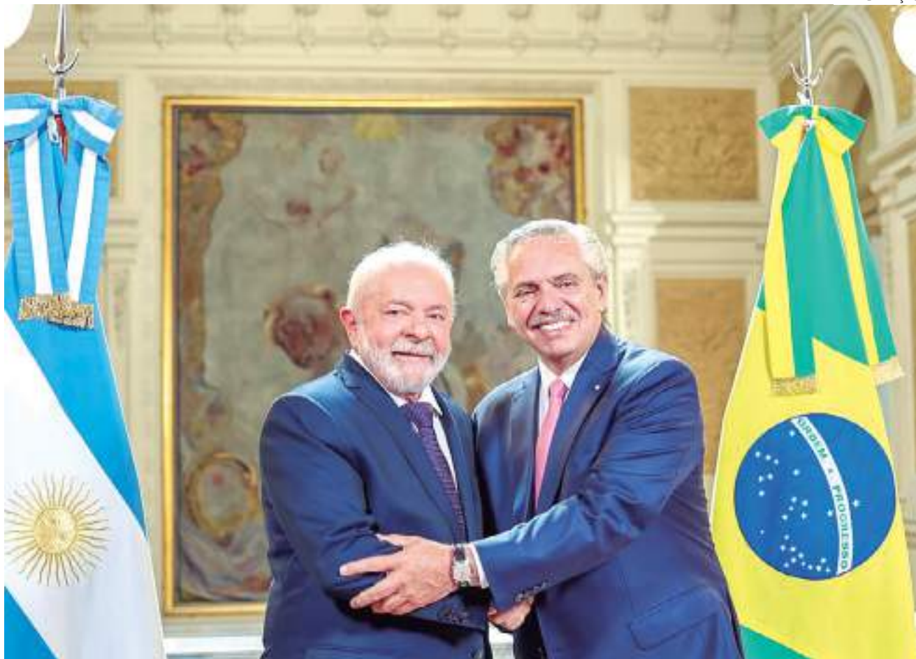
Lula fez visita ao presidente argentino Alberto Fernández nesta segunda-feira (23), para tratar de assuntos comerciais entre os países

Lula se reuniu com o presidente da Argentina, Alberto Fernández, na Casa Rosada, sede do governo