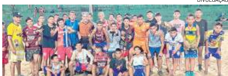
Time de jovens participantes do projeto social "Revelando para o futuro"

"Sou um homem do esporte desde menino. Por conta desse amor pela área esportiva, valorizo muito a disciplina e a dedicação. É através do mundo esportivo que também