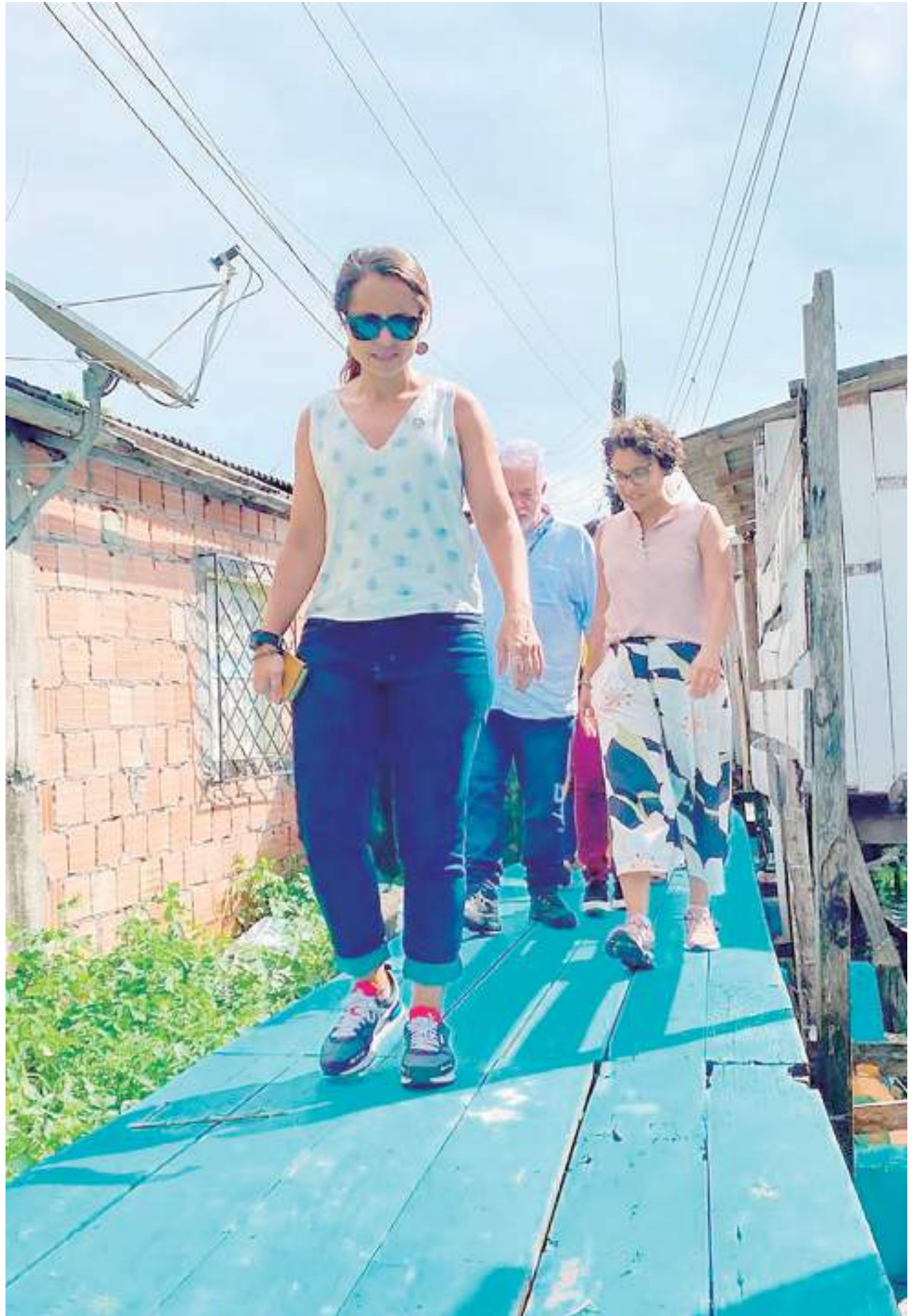
Comitiva visitando beneficiados do serviço de saneamento básico

A Plataforma de Água e Oceanos do Pacto Global da ONU colabora para a construção de uma agenda de governança em água e oceanos, engajando empresas na economia circular, visando a ações para o net positivo da água (ODS 6 – Água Potável e Saneamento) e recuperação de recursos, em todos os materiais e produtos (ODS 14 – Vida na Água).