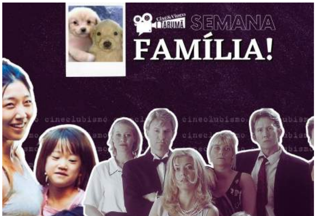
Cartaz dos filmes a serem exibidos na UFAM

O Cine&Vídeo Tarumã é um projeto de extensão da Universidade Federal do Amazonas com mais de 30 anos de atividade. Todas as suas sessões são gratuitas e o projeto sempre esteve envolvido com a formação cinematográfica, funcionando ora como um cine-clube, ora como sala de exibição especial. Vale reforçar também seu valor educacional, por estar dentro de uma universidade federal e pelas propostas de discussão e debates que as demais atividades do projeto estimulam.