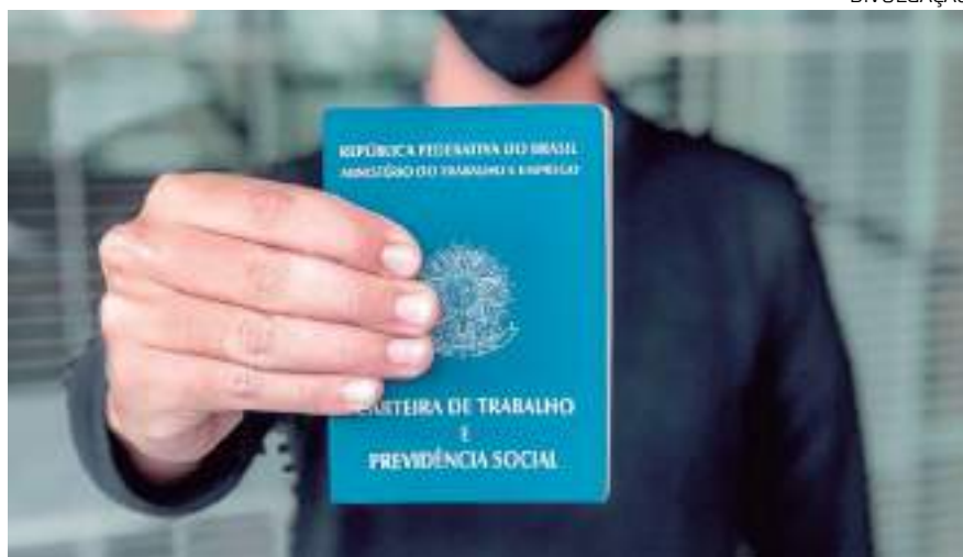
Mão segurando a carteira de trabalho

A maioria dos 71% dos entrevistados estão em busca de salário mais alto e 51% querem mais