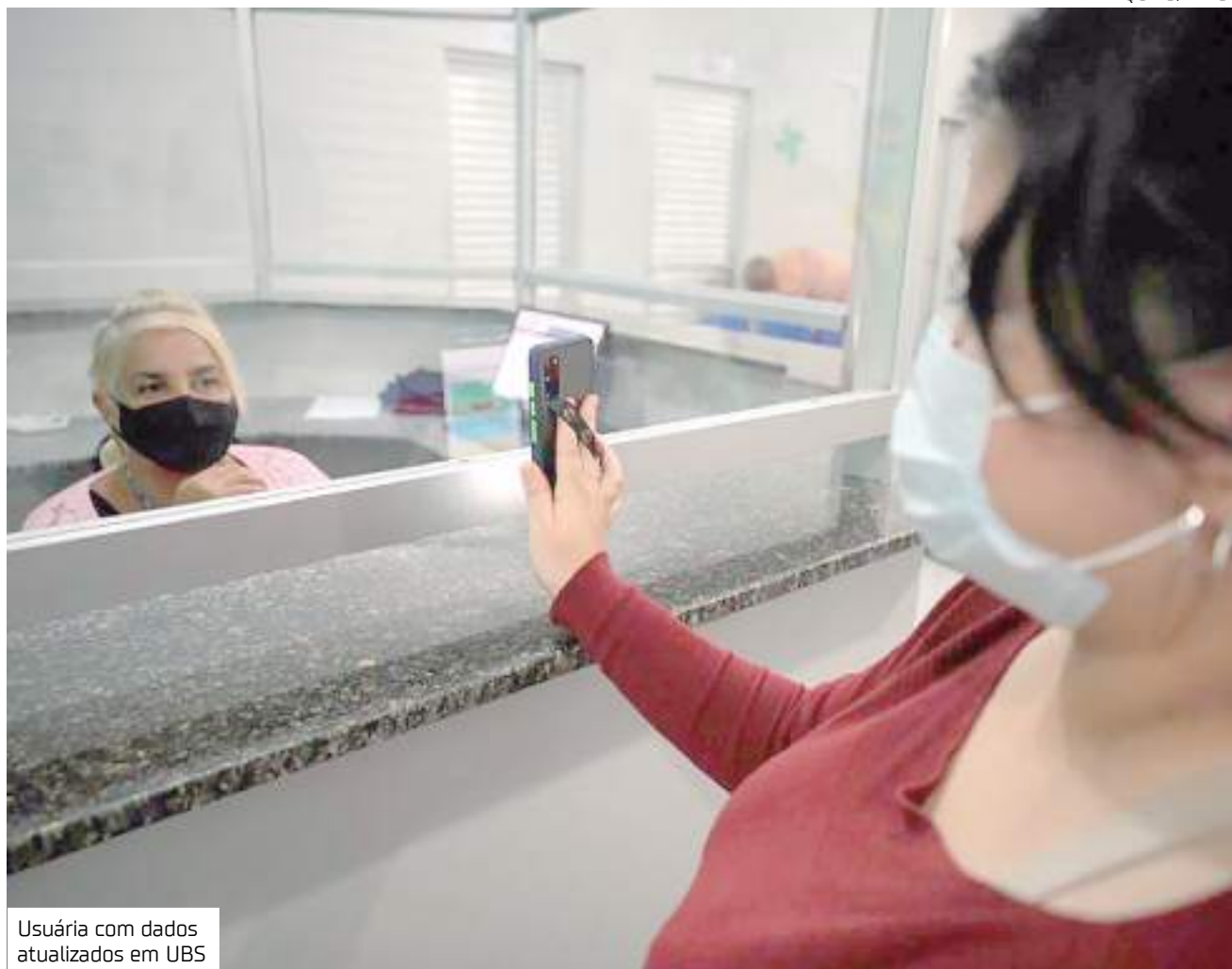
Usuária com dados atualizados em UBS

“O complexo regulador estará no decorrer de todo o mês de janeiro entrando em contato para informar de suas consultas e procedimentos que serão agendados. Mas, no geral, vale destacar a importância de estar com os dados dos usuários da rede de saúde sempre cadastrados e atualizados, para que exista um contato maior e facilitado com a população para