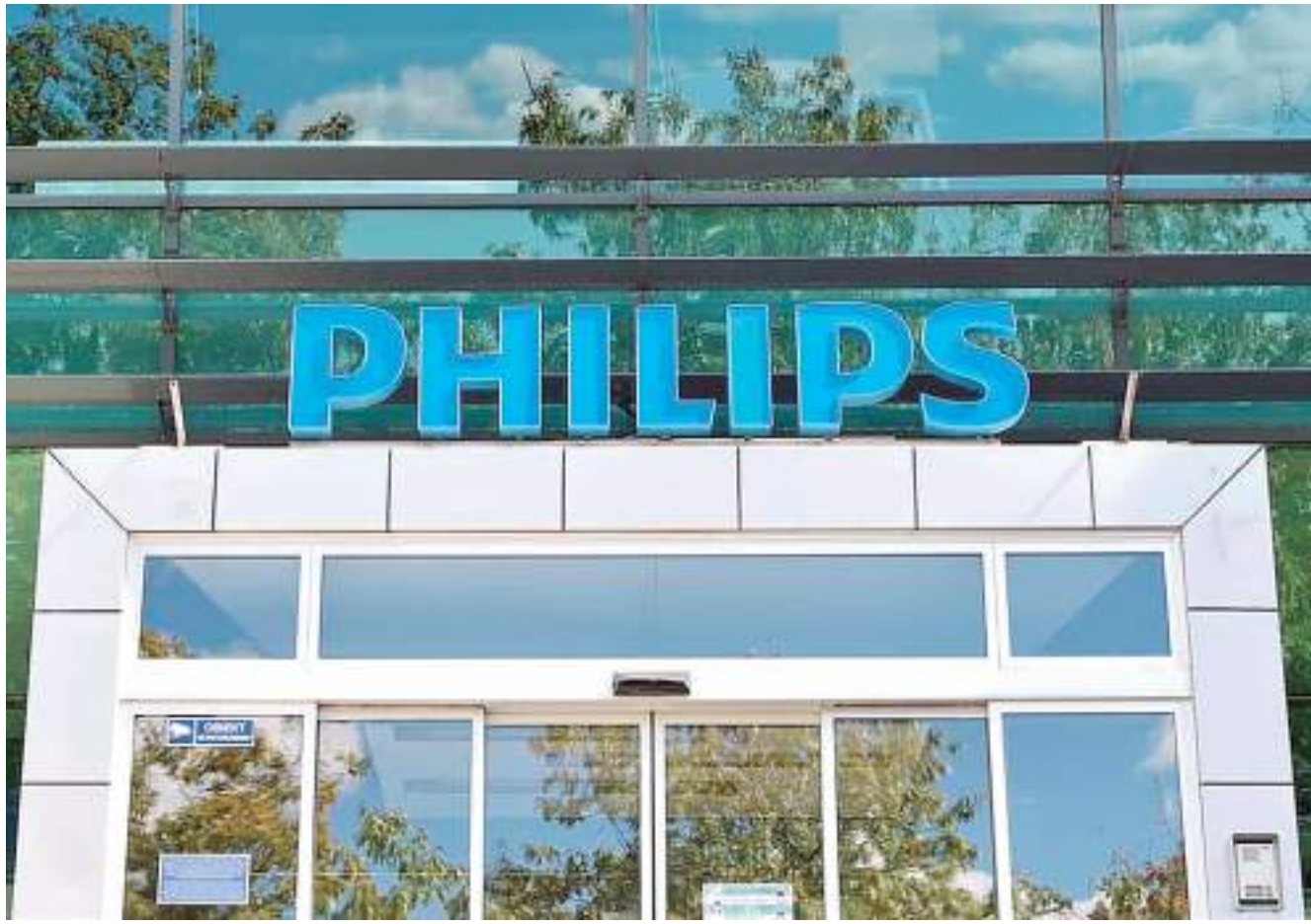
Fachada do prédio da Philips

Outra demissão em massa que poderá acontecer é com a Microsoft, con-