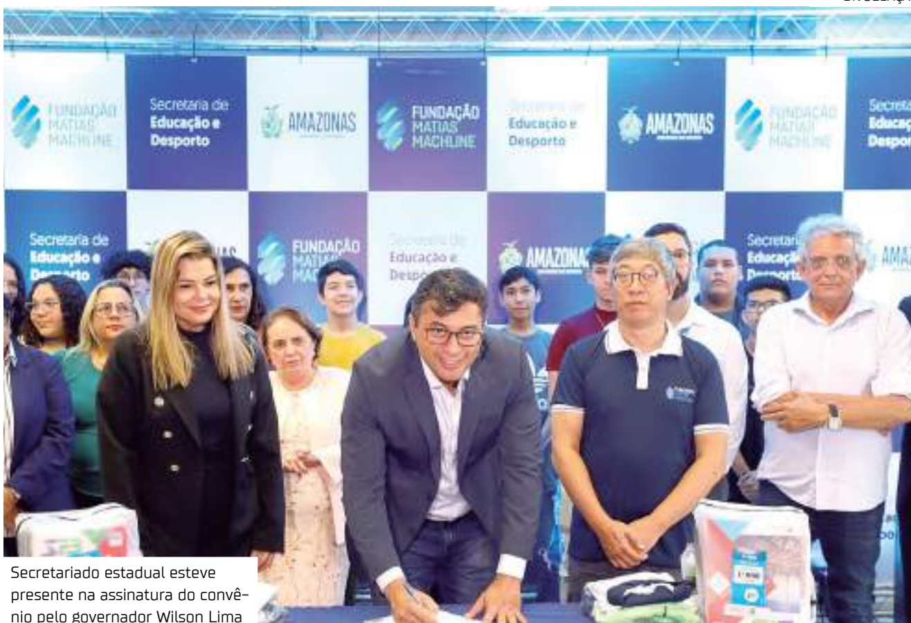
Secretariado estadual esteve presente na assinatura do convênio pelo governador Wilson Lima

"Isso daqui é um avanço que a gente dá ao ensino do Estado do Amazonas, trazendo alunos para cá, para uma instituição como essa, de alto nível e de excelência. Essa é uma parceria importante que a gente está fazendo aqui com essa fundação, que está há 36 anos no Estado do Amazonas, e a gente dispensa comentários sobre os resultados positivos que ela teve. E a gente também oportuniza aos nossos alunos da rede pública de ensino que também tenham acesso a esses laboratórios, aulas teóricas e todo conhecimento que é produzido aqui", declarou Wilson Lima. Referência em educação, com