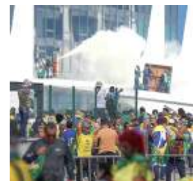
Manifestantes presos depredaram os prédios dos "Três Poderes"

As manifestações incluíram acampamentos em diversos quartéis gerais do país e culminaram na invasão e depredação das sedes dos Três Poderes, em Brasília, no dia 8 de janeiro.