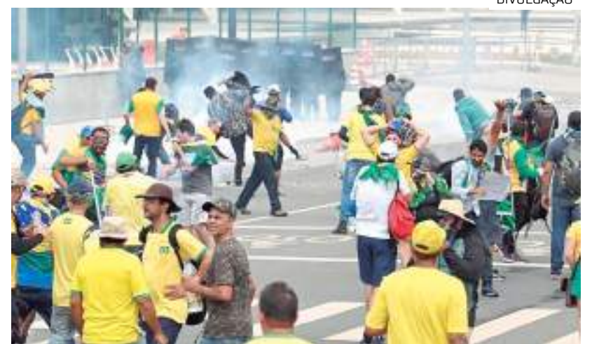
Golpistas depredando patrimônio público

A segunda ação, e agora deferida, aumentou em 40 pessoas o número de extremistas que devem arcar com os custos. De acordo com a AGU, as duas ações cautelares visam a assegurar que os bens dos acusados possam ser usados para ressarcir o patrimônio público