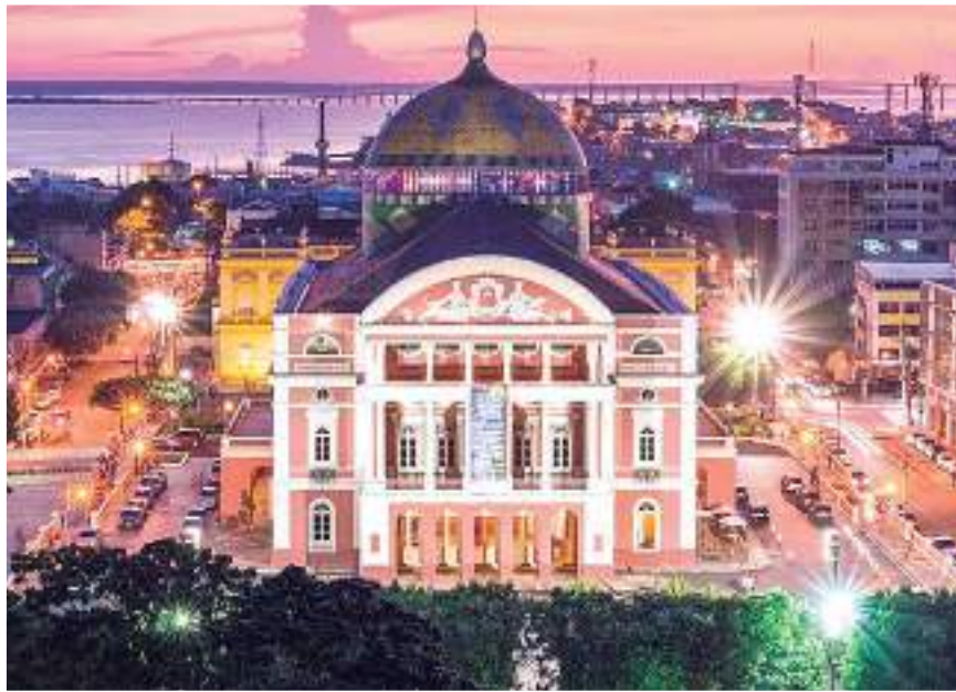
Cúpula da área interna do Teatro Amazonas

A pesquisa, provocada pelo site português, analisou 132 países, entre eles o Brasil, e, a partir de informações, opiniões e conteúdos relacionados ao turismo, o majestoso teatro no coração da