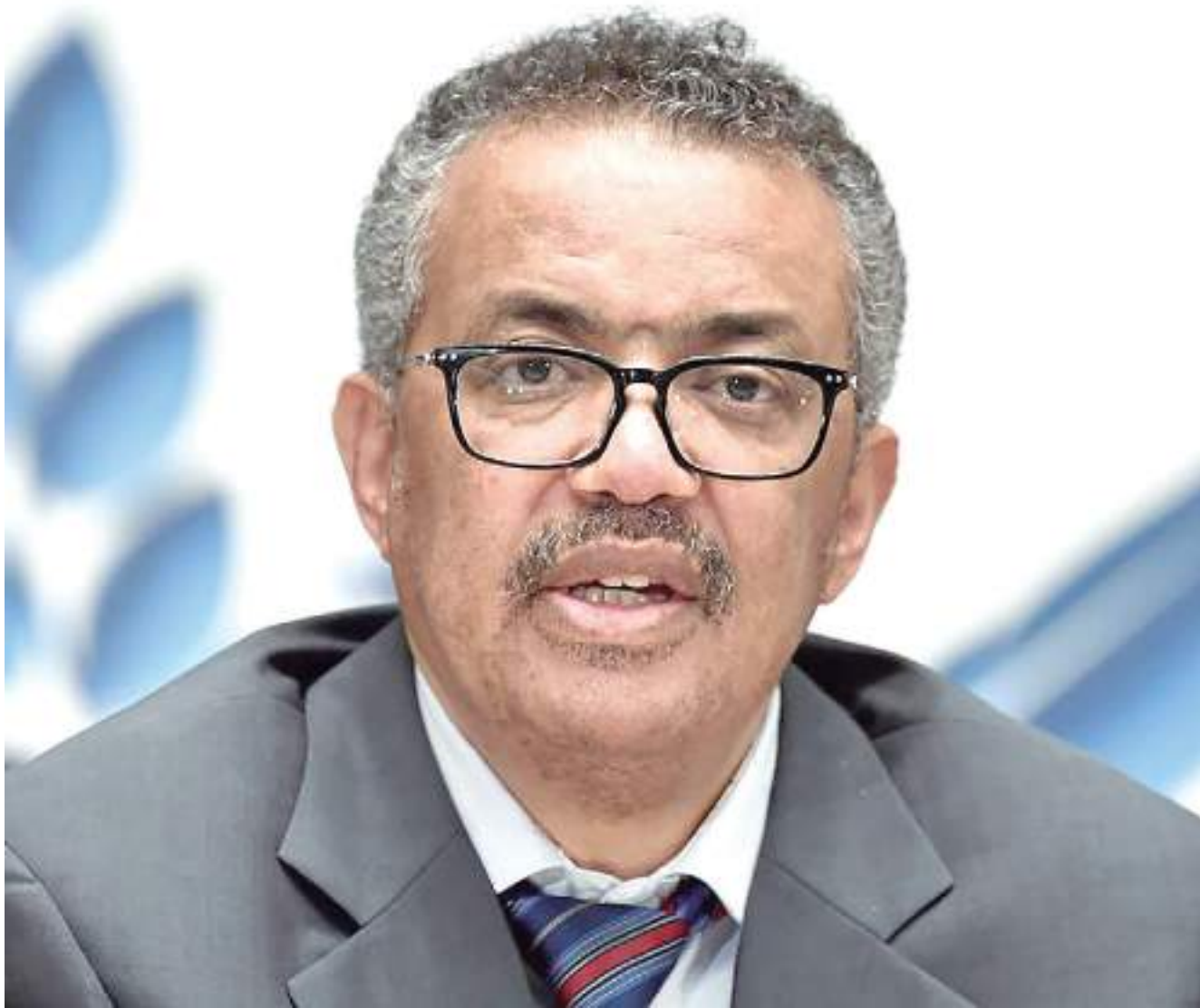
Tedros Ghebreyesus vai seguir a recomendação do comitê de monitoramento da Covid e manter a doença como emergência global

ticos foram e continuam sendo essenciais na prevenção de doenças graves, salvando vidas e aliviando a pressão sobre os sistemas de saúde e os profissionais de saúde."