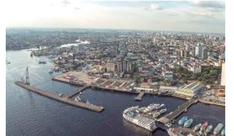
Frente da capital de Manaus, com prédio e porto