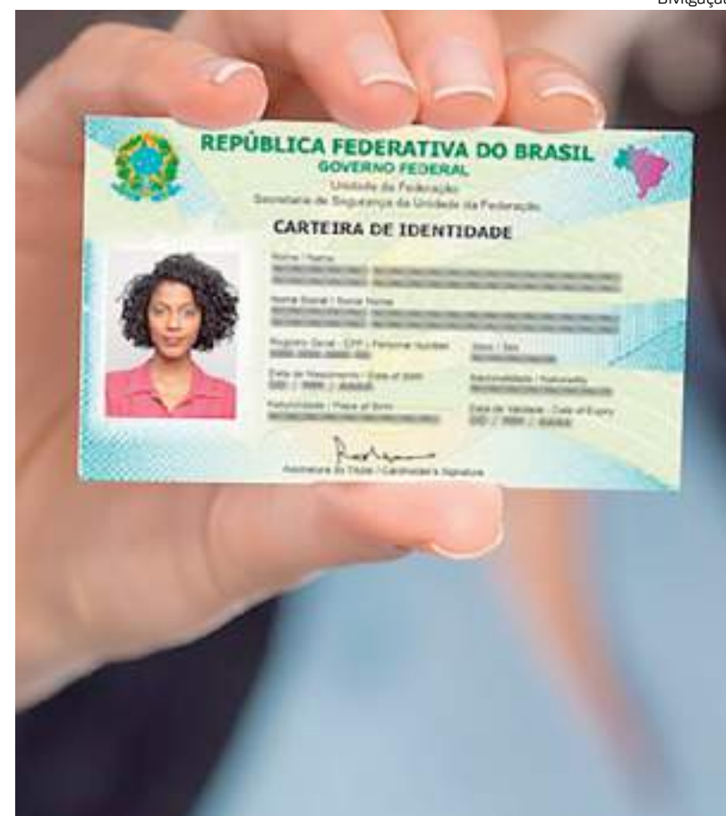
Nova CI começou a ser emitida no Estado do Rio de Janeiro

Em breve, o formato digital do documento estará disponível pelo aplicativo Gov.br.