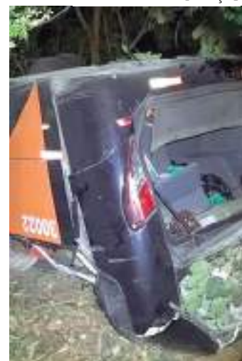
Ônibus capotado em ponte