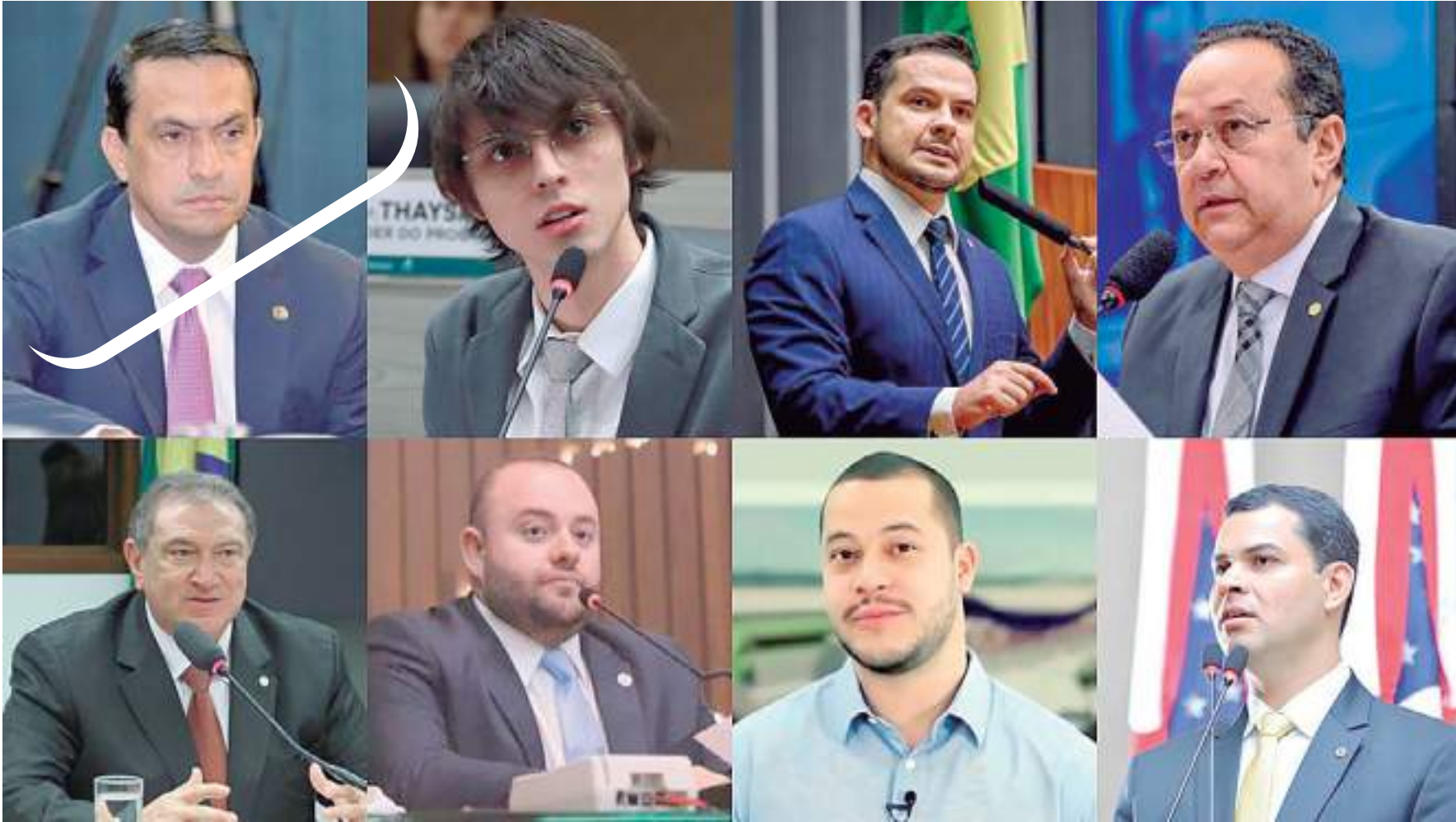
Totalidade de deputados eleitos entende que reeleição de Arthur Lira é o melhor cenário para o Amazonas

A Câmara Federal deve tornar oficial a reeleição de Arthur Lira (PP) nesta quinta-feira (2), com total apoio da bancada do Amazonas