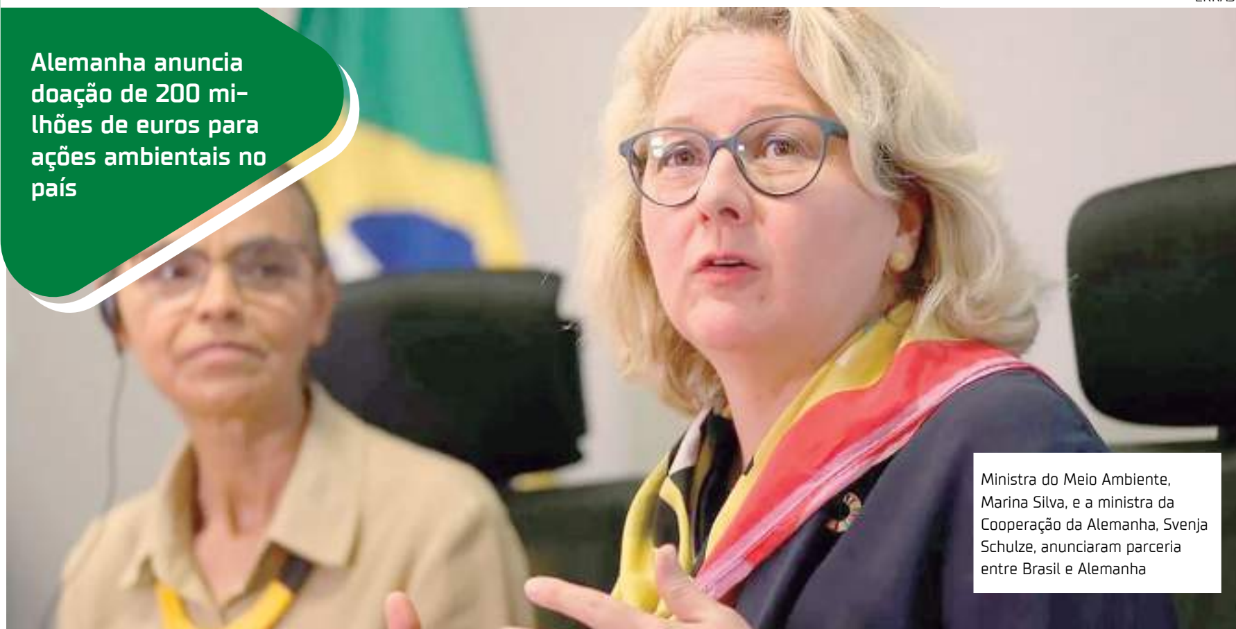
Ministra do Meio Ambiente, Marina Silva, e a ministra da Cooperação da Alemanha, Svenja Schulze, anunciaram parceria entre Brasil e Alemanha

Alemanha anuncia doação de 200 milhões de euros para ações ambientais no país