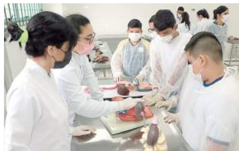
Alunos participando de atividade laboratorial

explicaram muita coisa. Nunca tinha participado de visitas desse tipo. Gostei muito, eu queria ser policial, mas agora estou em dúvida”, contou o jovem.