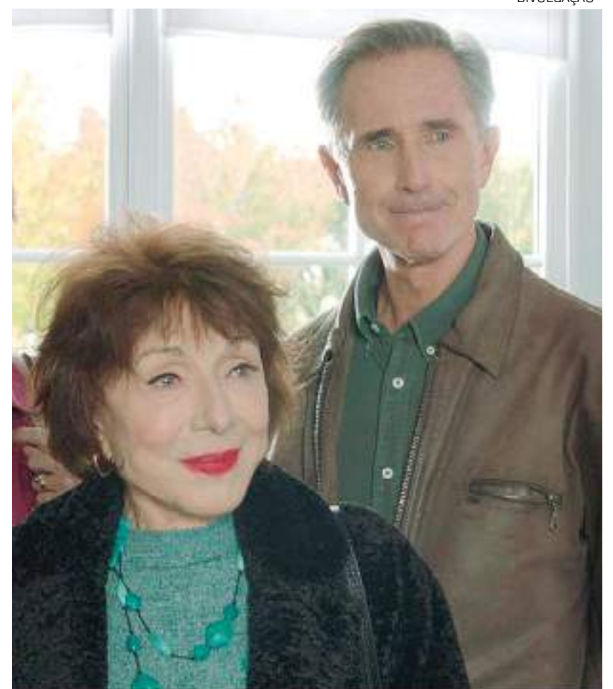
Cena do filme "Os Tradutores"

O evento objetiva proporcionar à comunidade acadêmica e profissionais que atuam no ensino da Língua Brasileira de Sinais - Libras e na tradução, interpretação e mediação de/para/atraves das Libras, o contato com o saber científico, visando a compreender as questões que se apresentam no uso da Libras nos contextos sociais. Esses conhecimentos são instrumentalizados por pesquisadores e profissionais que desenvolvem trabalhos reconhecidos pela comunidade científica nacional e internacional.