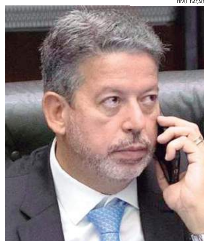
As reuniões acontecem às vésperas da eleição para presidência da Câmara

Ainda que Lira seja o mais cotado para o cargo, as costuras para os outros cargos da mesa diretora também começam a se desenrolar. A briga para a vice-presidência se