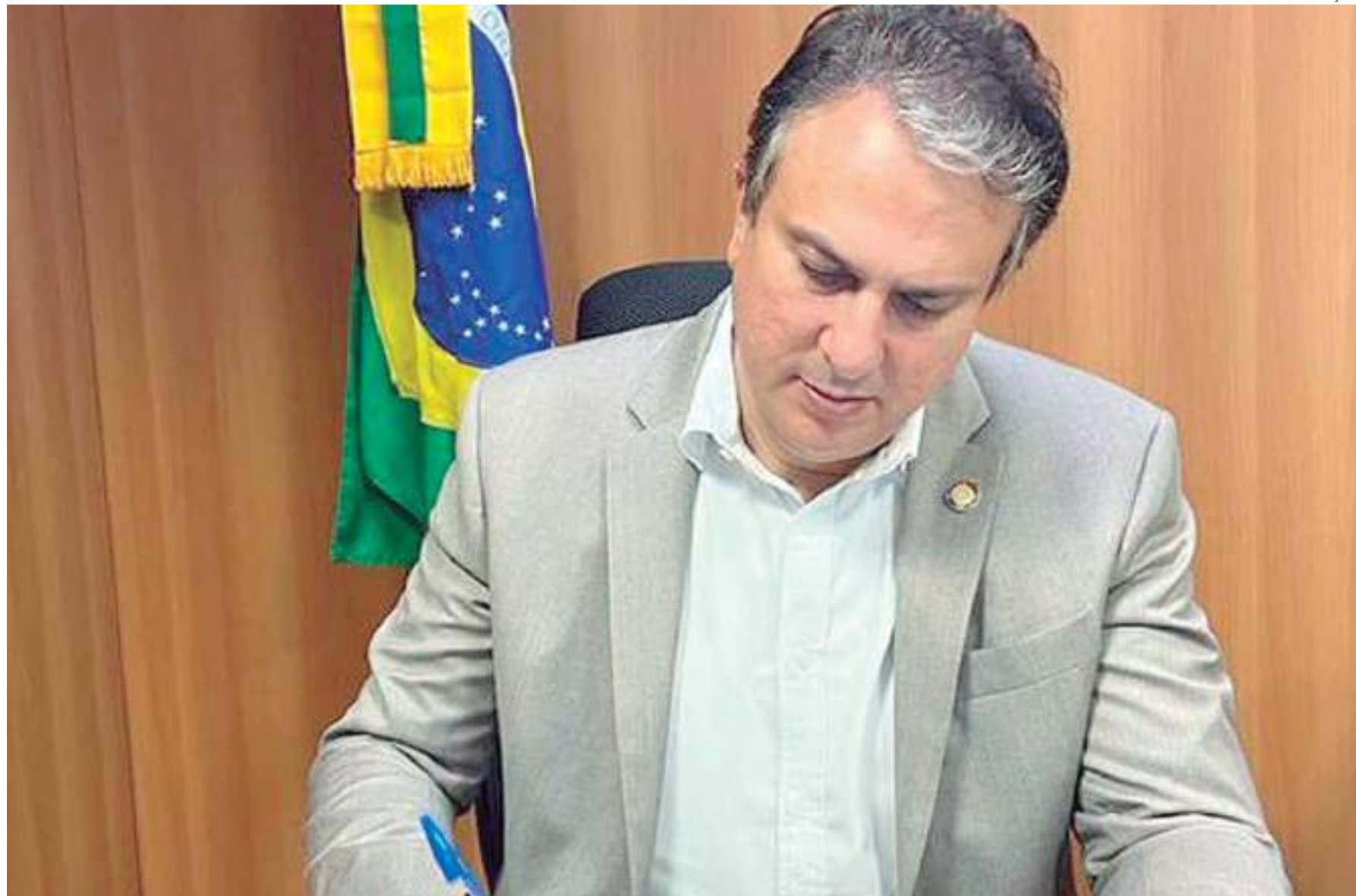
Mulheres empreendedoras recebendo palestras pela SES

A Confederação Nacional dos Municípios (CNM) o reajuste do piso salarial dos professores oficializado pelo MEC e, pelo segundo