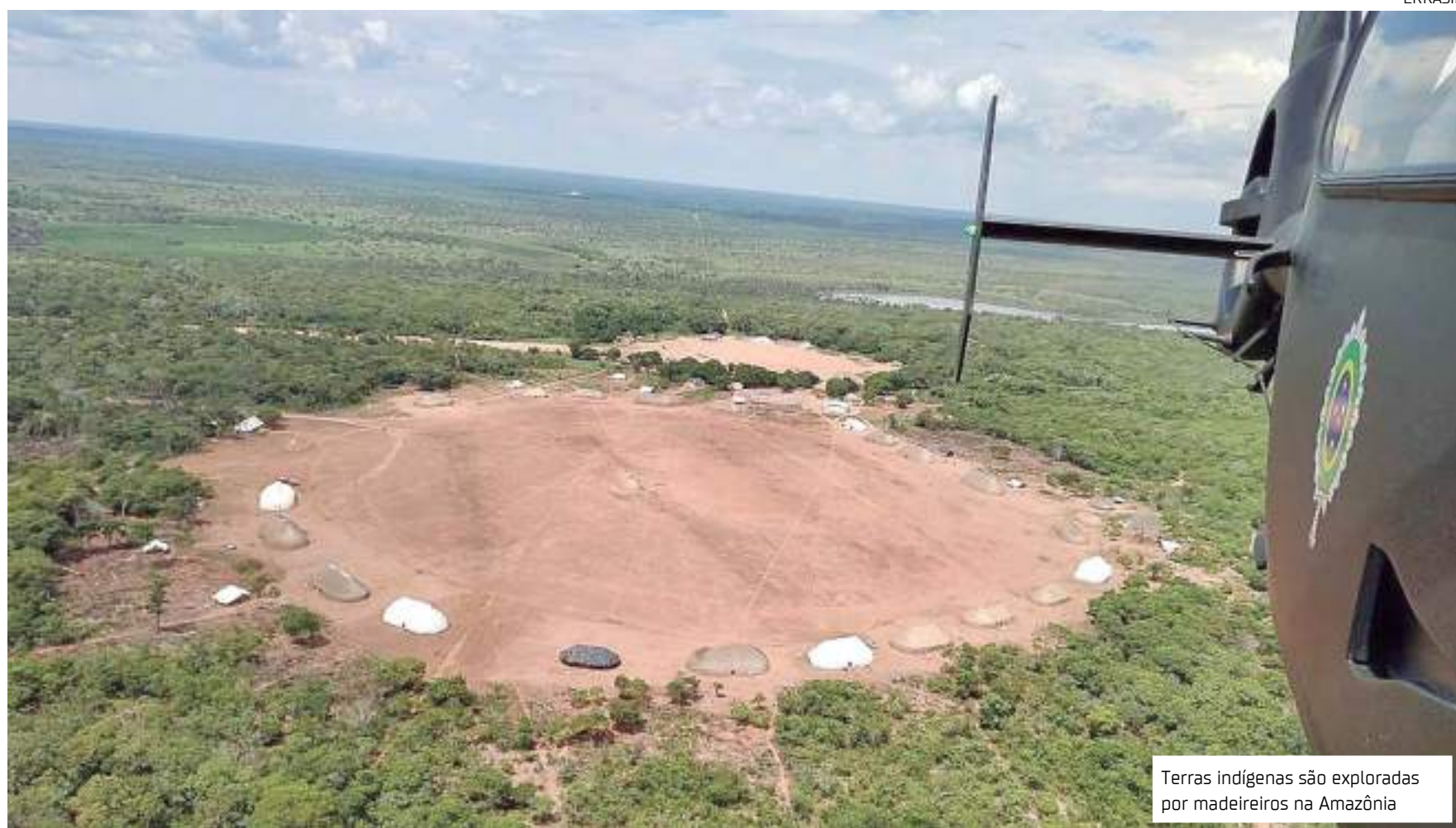
Terras indígenas são exploradas por madeireiros na Amazônia

“As instituições [Funai e Ibama] decidiram pela revogação da norma de dezembro”, tendo em vista que violava artigos constitucionais, ofendia artigos do Estatuto do Índio e afrontava o princípio da consulta e consentimento prévio, livre e informado dos povos indígenas, estabelecido pela Convenção 169 da Organização Internacional do Trabalho”, justificou a Funai, em nota.