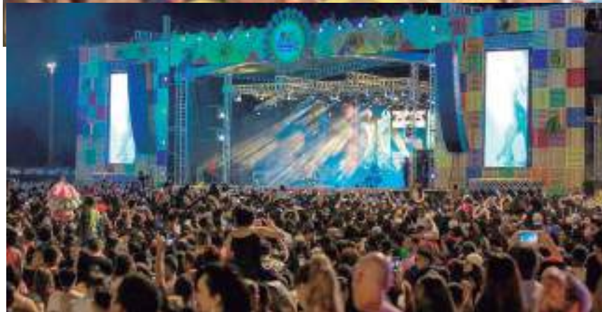
Imagem com os foliões carnavalescos pelas ruas de Manaus

pretende movimentar a indústria criativa da cidade, 30% a mais em relação ao ano passado, que movimentou a classe artística com eventos e projetos culturais como: Arte Pela Cidade; Festival Folclórico; Festival #SouManaus Passo a Paço; Boi Manaus; Manaus Adventure e Réveillon.