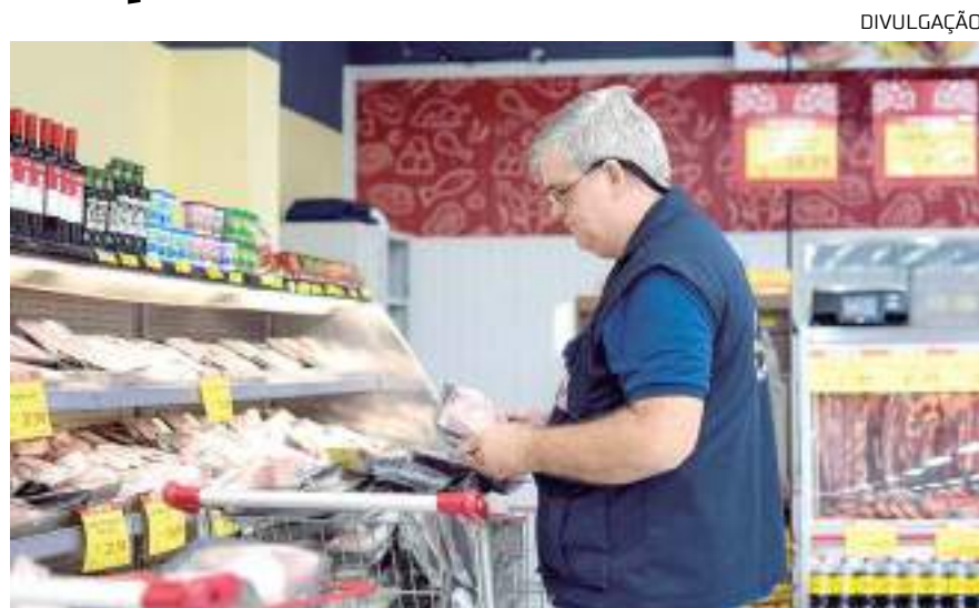
Produtos variados com validade vencida e embalados incorretamente

“É inaceitável que o estabelecimento venda produtos impróprios para o consumo humano, tentando burlar a veracidade da validade, desrespeitando o Código de Defesa do Consumidor”, afirmou Fraxe.