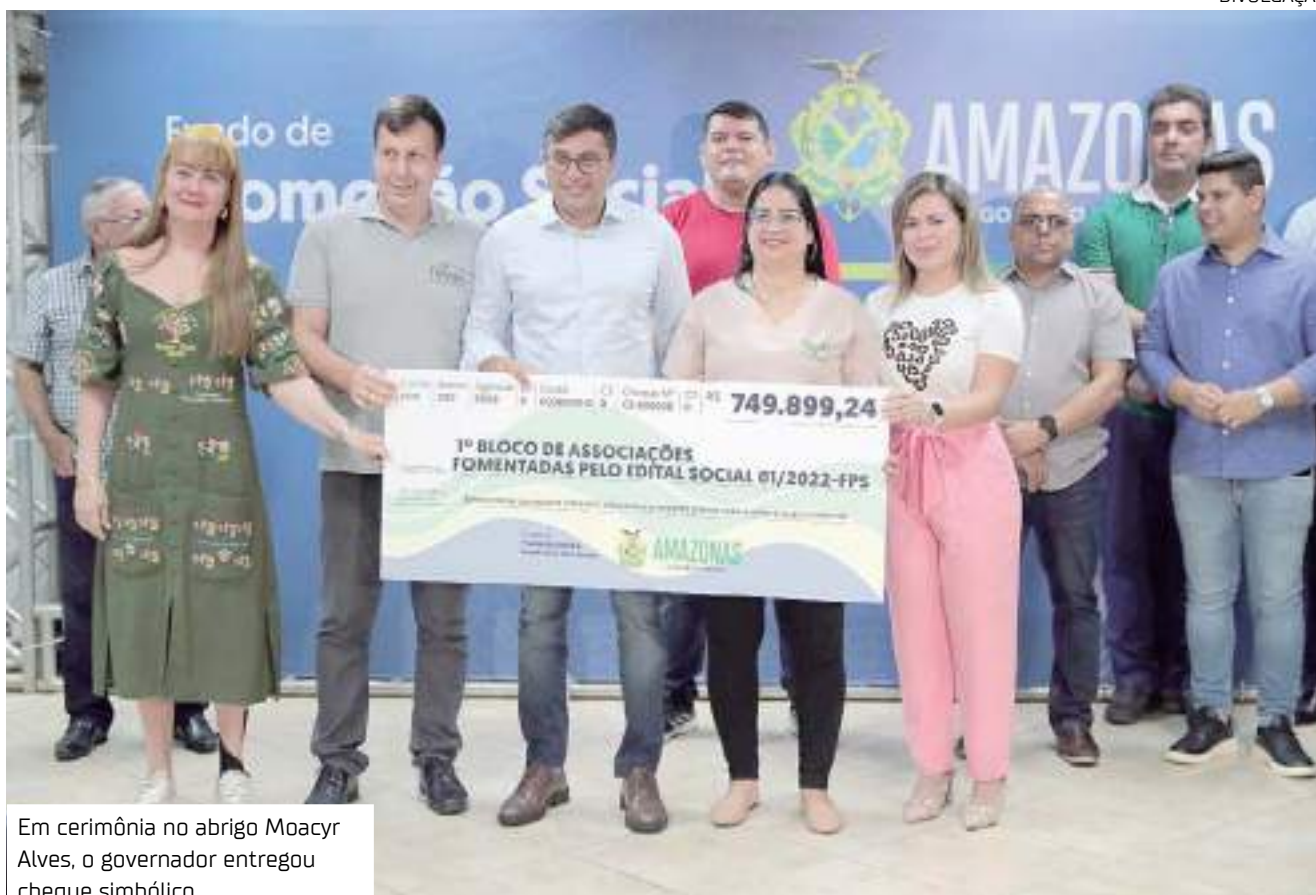
Em cerimônia no abrigo Moacyr Alves, o governador entregou cheque simbólico

“Essas instituições vivem basicamente de doações, vivem basicamente do trabalho de voluntários e não tenho dúvida de que o apoio do Estado é decisivo para que elas continuem atendendo essa clientela e ampliando esse leque de possibilidades para esses assistidos e para as famílias deles”, afirmou Wilson Lima, acrescentando que seu governo tem como uma de suas principais preocupações o social, por meio de programas como Auxílio Estadual