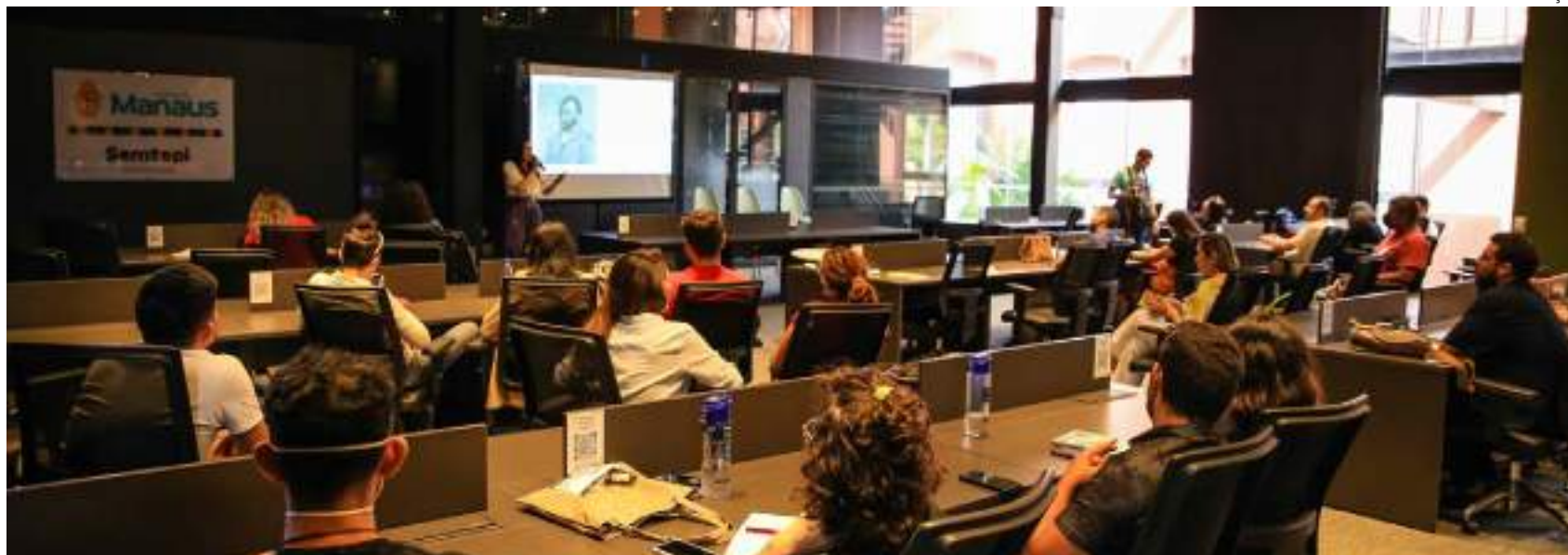
O encontro acontecerá via on-line com investidores

Além disso, vai reunir empresas investidoras, startups, incubadora, aceleradoras, institutos de Ciência e Tecnologia, secretarias de Tecnologia, Ventures Builders, coordenações de Programas Prioritários, associações de startups, fundo de investi-