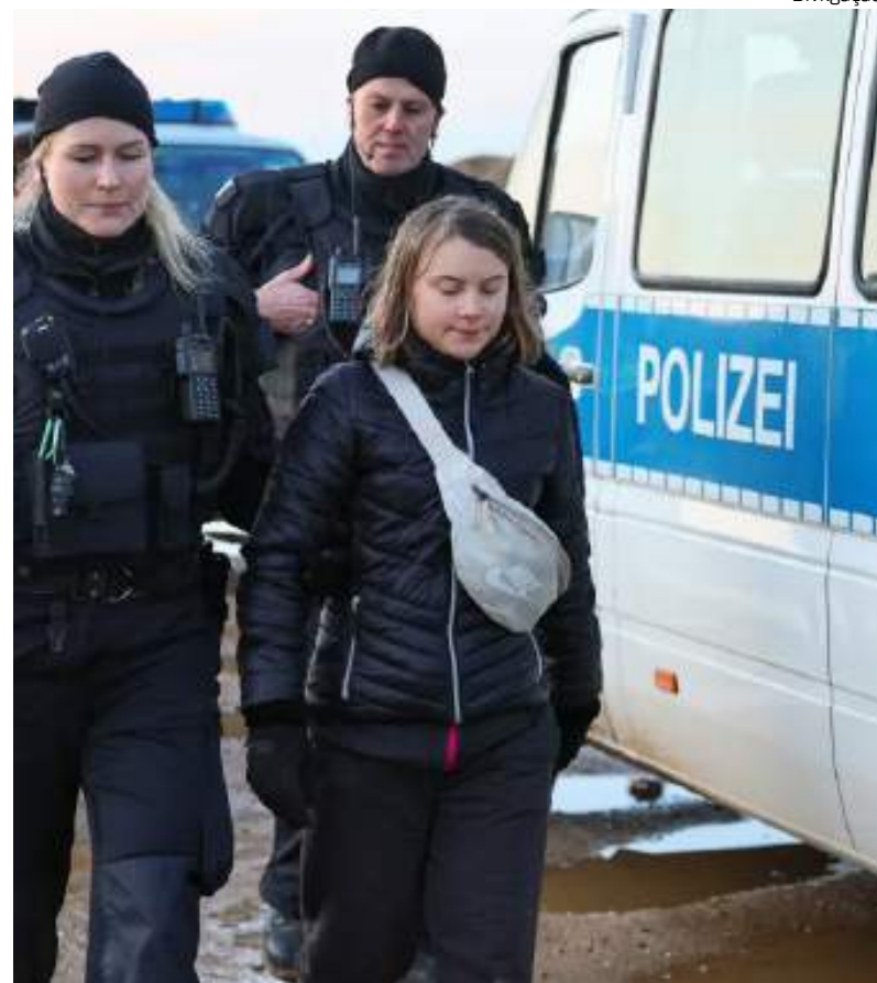
Greta e um grupo de manifestantes foram presos na Alemanha

À agência de notícias Reuters, um porta-voz da polícia afirmou que todos os detidos foram liberados no final do dia. Ainda não se sabe se o ativista que pulou na mina ficou ferido.