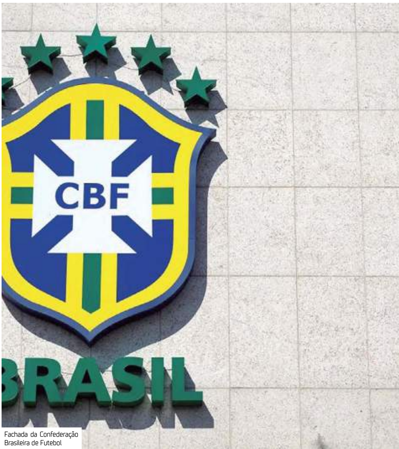
Fachada da Confederação Brasileira de Futebol