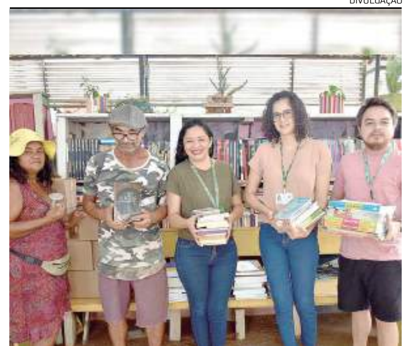
Os livros foram doados durante o trote dos novos alunos da UEA