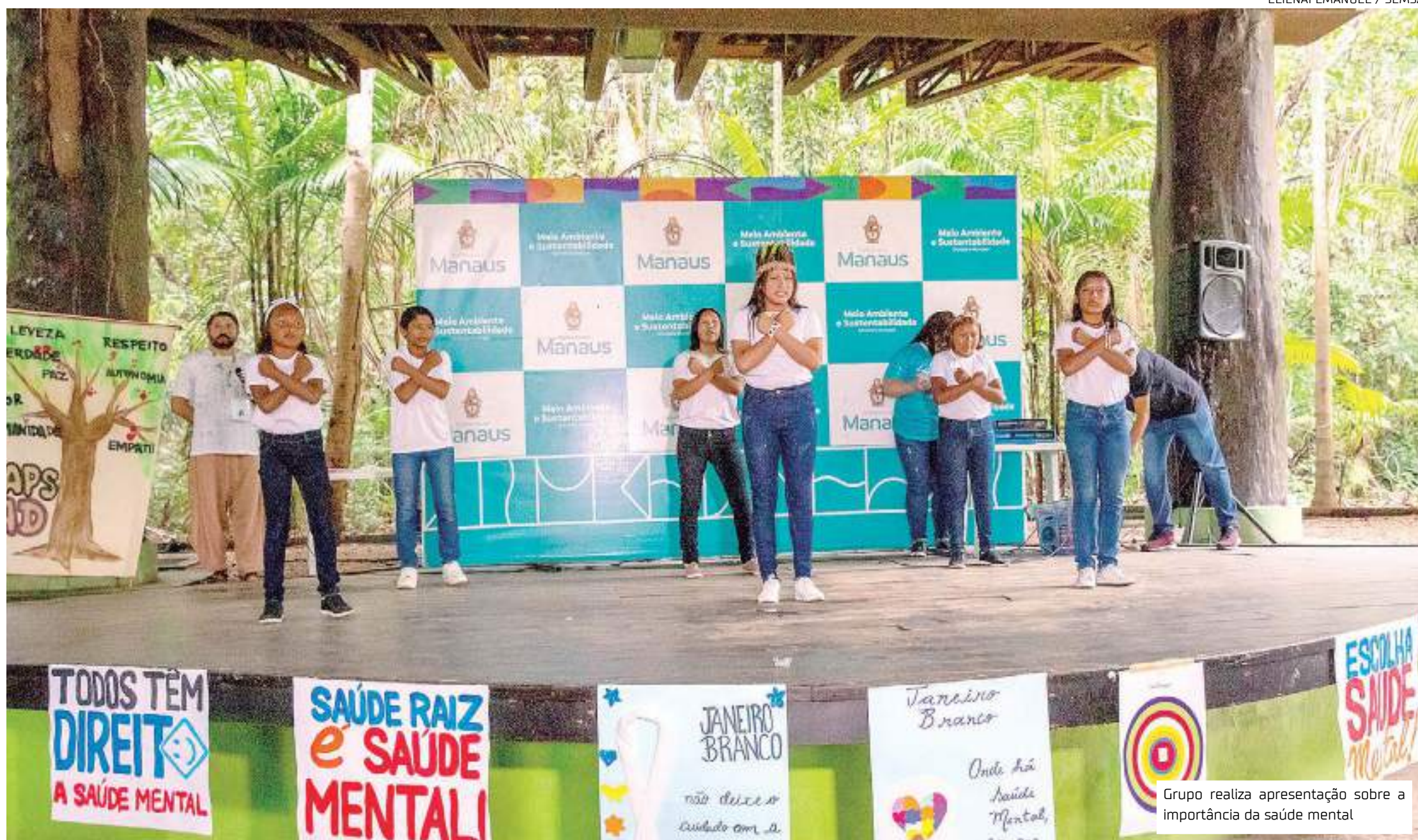
Grupo realiza apresentação sobre a importância da saúde mental

Durante o evento, foram realizadas apresentações e rodas de conversa