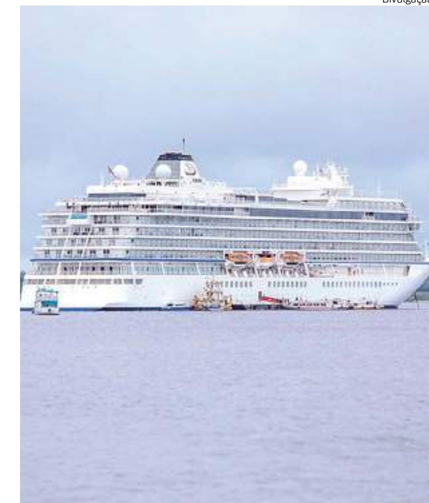
Navio cruzeiro Viking Sea chegou Manaus na terça-feira (17) com mais de 1,3 mil turistas

Com uma programação diversificada, os visitantes conhecem atrativos turísticos, como o Museu da Cidade de Manaus (Muma), Mercado Municipal Adolpho Lisboa, Teatro Amazonas, Palácio Rio Negro, Museu da Amazônia (Musa), Centro de Instrução de Guerra na Selva, Instituto Nacional de Pesquisas da Amazônia (Inpa),