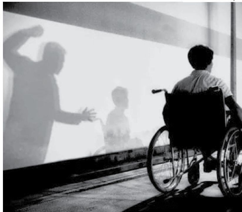
PcD sofre maus-tratos físicos e psicológicos