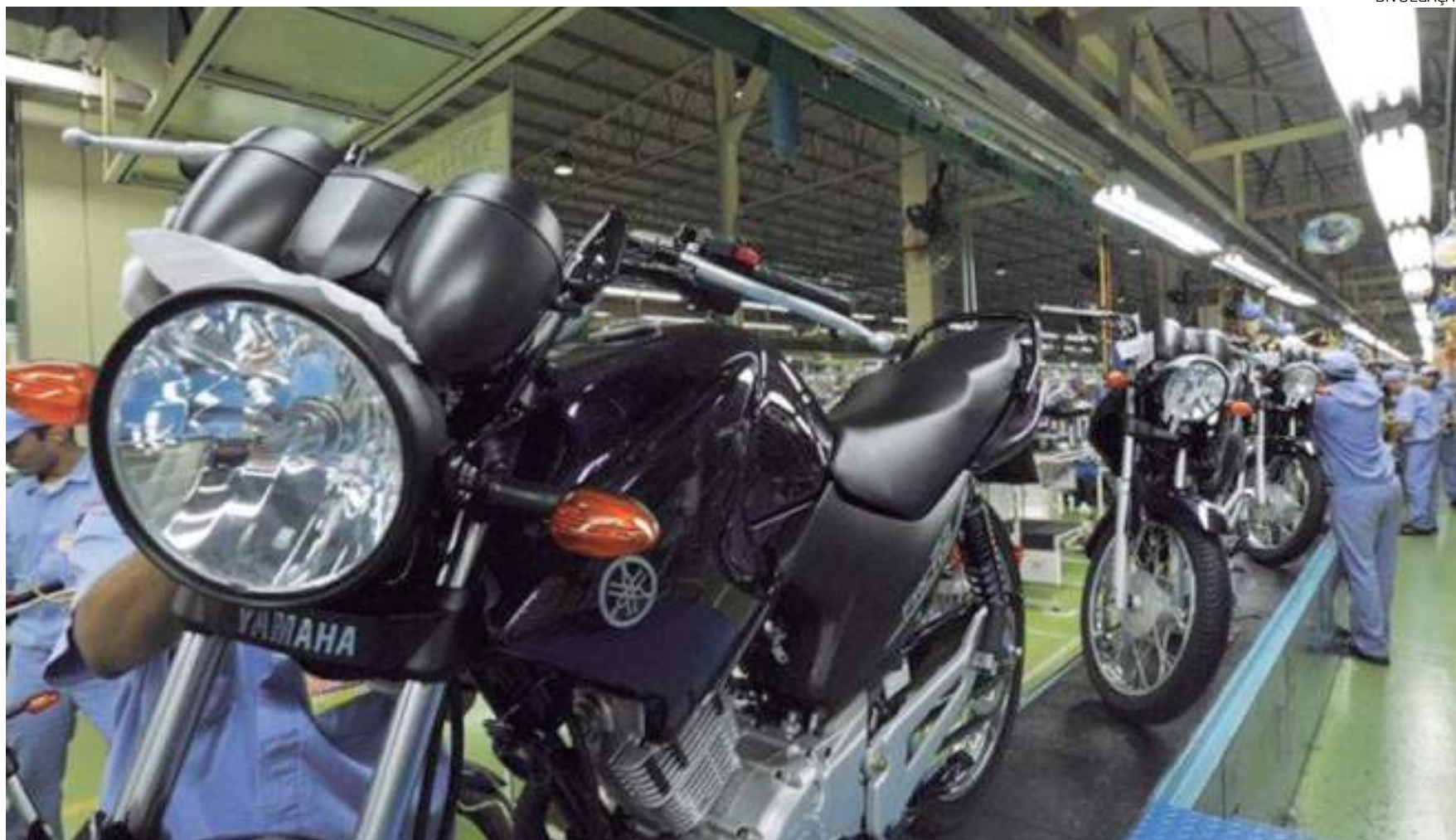
Em dezembro foram fabricadas 85.117 unidades de motocicletas

De acordo com o levantamento mensal, no ano passado foram vendidas 1.361.941 unidades, o que representa alta de 17,7% na comparação com o ano de 2021 (1.156.776 unidades). Em relação ao mesmo mês do ano passado, houve alta de 17,7% (132.204 motocicletas), ante as 112.363 comercializadas, e 7,3% superior às 123.214 unidades emplacadas