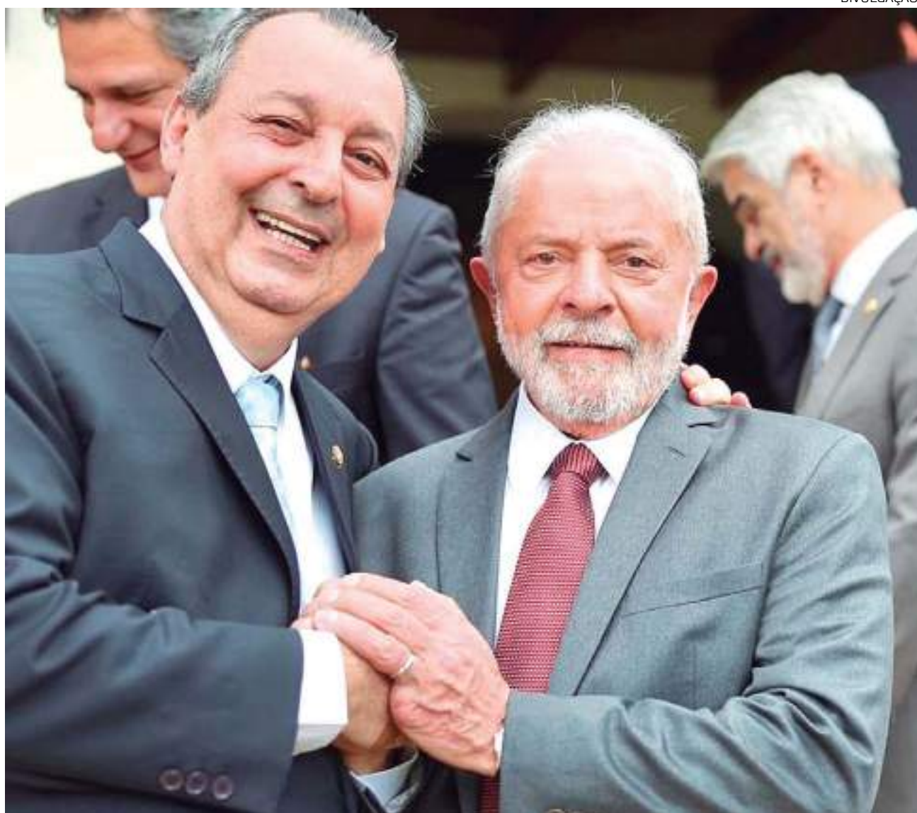
Esta possível visita trará à tona as discussões sobre a Zona Franca e o Polo Industrial de Manaus

"Ele [Lula] afirmou que queria vir aqui [no Amazonas]. A probabilidade dele vir [em março] é muito grande, se não acontecer