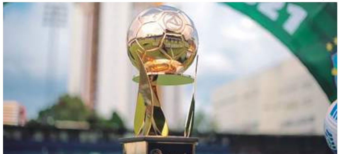
A taça da Copa Verde será entregue para o vencedor do torneio, que encerra no dia 3 de maio de 2023

A Copa Verde de Futebol é uma competição regional brasileira disputada desde 2014 entre equipes da Região Norte e Centro-Oeste, além do Espírito Santo.