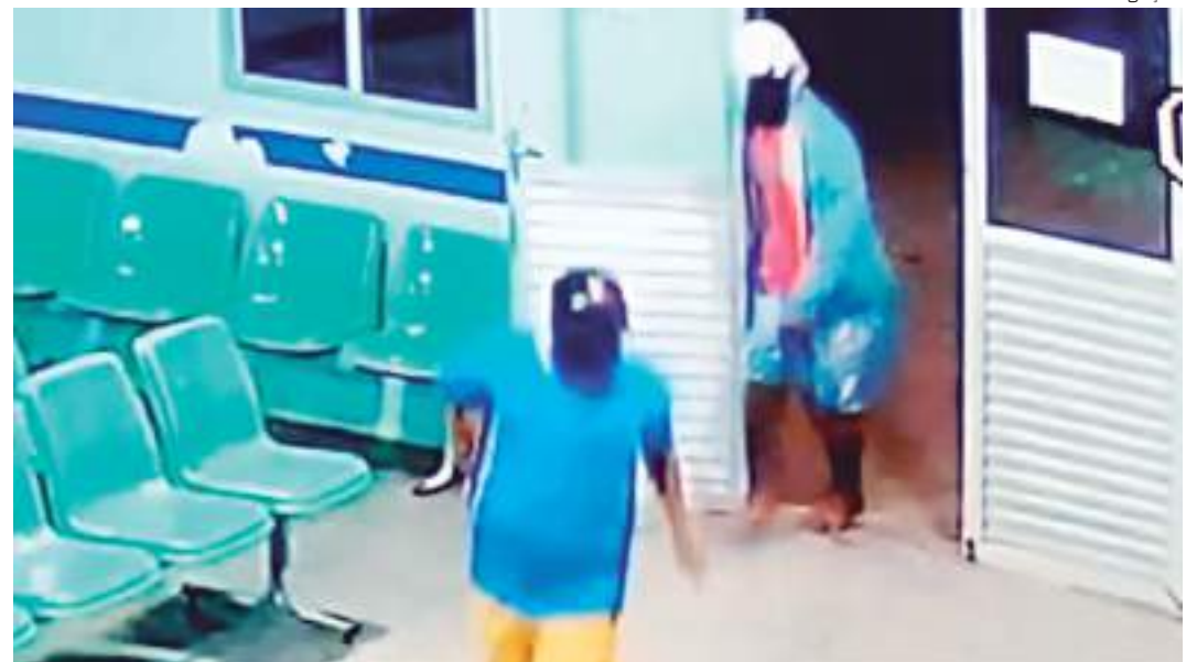
Pistoleiros encapuzados invadiram o Hospital de Carauari e mataram homem a tiros

Em nota, a Secretaria de Estado de Saúde (SES) informou que está prestando todas as informações à Polícia Civil do Amazonas, que investiga a situação ocorrida na unidade hospitalar.