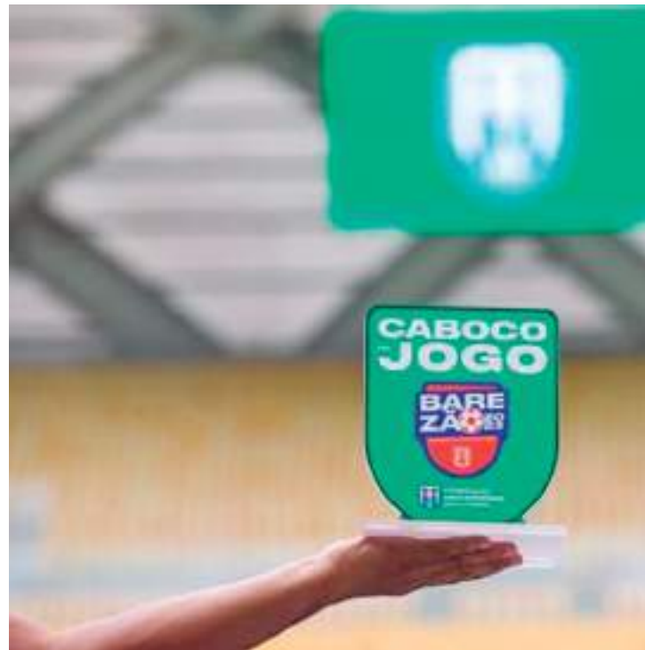
Troféu premia os atletas que se destacam individualmente nos jogos

"O troféu foi bem aceito entre os amantes do futebol amazonense. O sucesso está superando até nossas expectativas. Nossa diretoria avaliou muito bem antes de anunciar, inclusive, o nome e quem faria as escolhas. Por isso, o Caboco do Jogo é também uma realização para to-