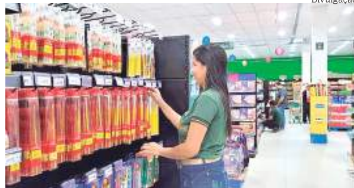
Trabalhadora durante serviço em loja de departamento

A empresa conta com 15 lojas estrategicamente localizadas em todas as zonas de Manaus, além de um centro de distribuição, que funciona 24h, facilitando a logística e o abastecimento das unidades e das entregas para os clientes do interior do Amazonas.