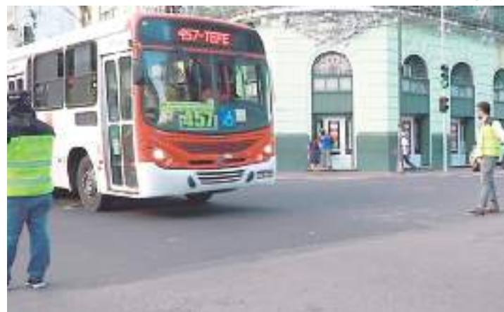
Ônibus da linha 457 durante trajeto pela cidade de Manaus