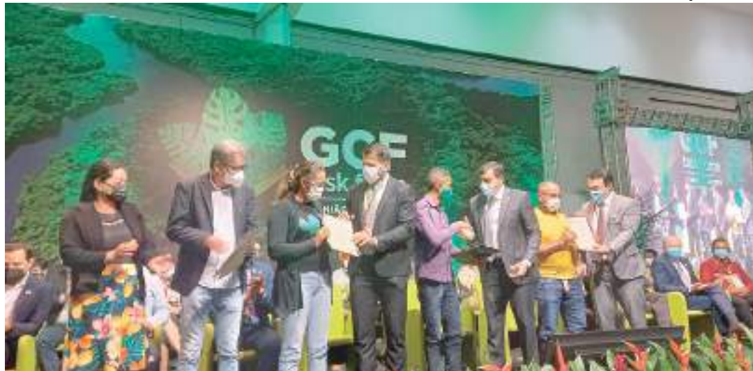
Governador durante o evento no ano passado. Em 2022, o GCF ocorreu no Estado do Amazonas

O Governo do Amazonas participa, desde ontem (7), da 13ª Reunião Anual da Força-Tarefa de Governadores para o Clima e Florestas - GCF Task Force -, que este ano será realizada na cidade de Mérida, no estado de Yucatán, no México. O evento é considerado um dos mais importantes espaços para discussões de iniciativas subnacionais voltadas