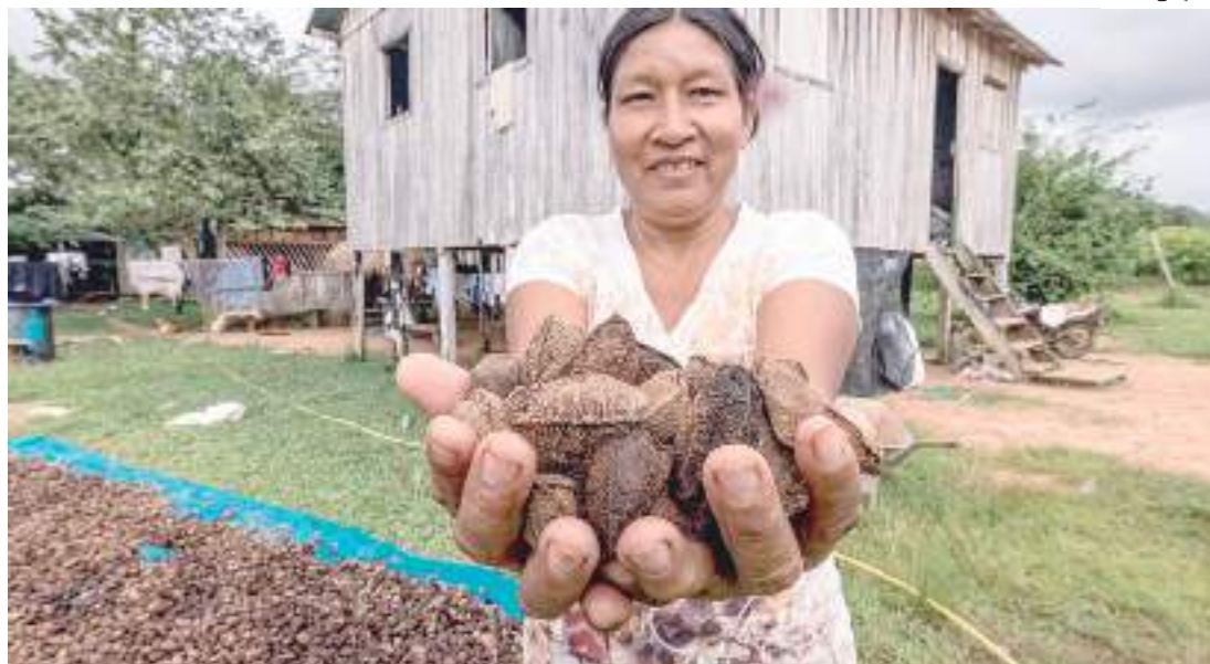
Mulher segura castanhas da Amazônia, uma das principais cadeias do extrativismo na região