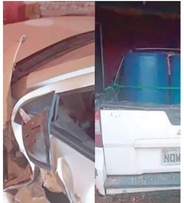
Picape ficou desgovernada e atingiu casa após piloto ser morto

A motivação do crime ainda será apurada pela polícia. O caso será agora investigado pela Delegacia Especializada em Homicídios e Sequestro (DEHS).