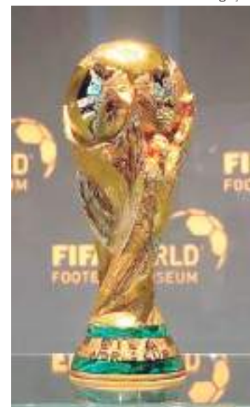
Troféu da Copa do Mundo FIFA

A América do Sul já organizou a Copa do Mundo em cinco ocasiões: Uruguai-1930, Brasil-1950, Chile-1962, Argentina-1978 e Brasil-2014.