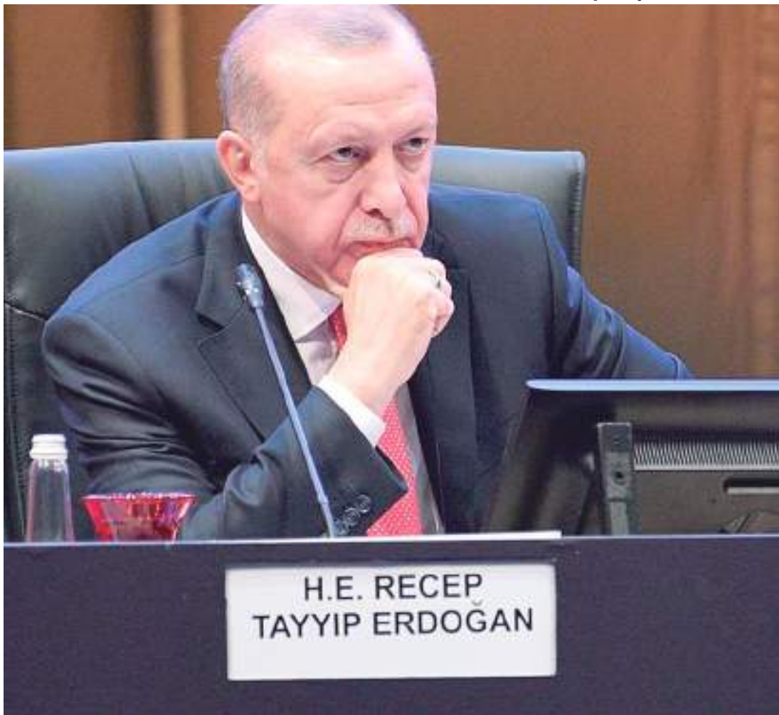
Presidente da Turquia, Tayyip Erdogan, lidera país frente à grande tragédia causada por terremoto

O presidente da Turquia, Tayyip Erdogan, declarou ontem (7) estado de emergência de três meses para as dez províncias do Sul da Turquia atingidas por terremotos devastadores. Ele chamou a região de zona de desastre, em uma medida destinada a reforçar os trabalhos de resgate.