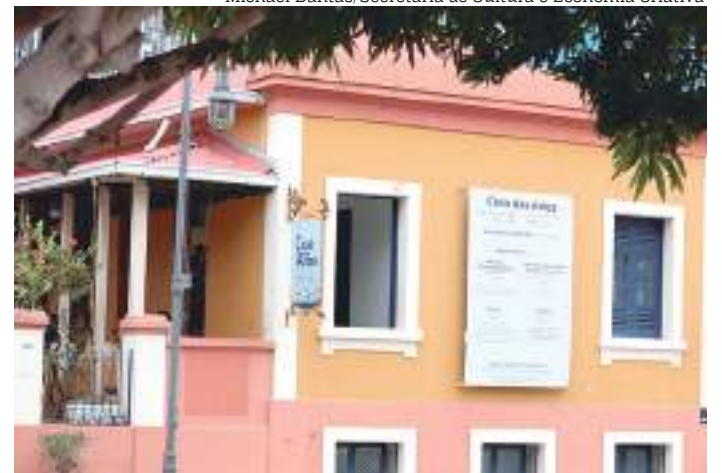
Casa de Artes, localizada no Largo São Sebastião, Centro