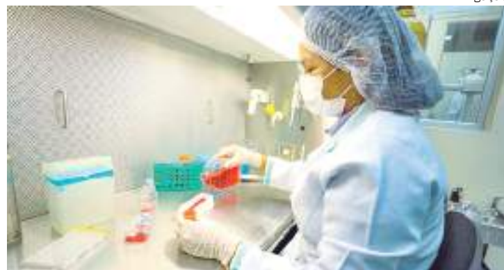
Pesquisadora durante trabalho com plantas amazônicas