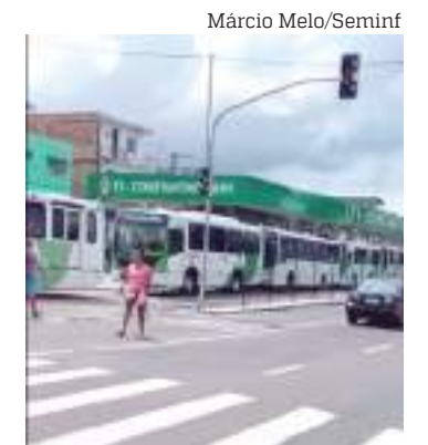
Ônibus formaram filas quilométricas durante a paralisação

O município reforça que mantém subsídio ao sistema, pago mensalmente em duas parcelas. Além de trabalhar para manter o atendimento ao público com qualidade e sem prejuízos ao usuário.