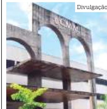
Entidade vai tomar posse em cerimônia na CMM

“Vimos a possibilidade de fazermos nascer uma representação de classe seria muito importante. Então, juntamos mais startups e passamos a conversar e fazer a associação nascer.”