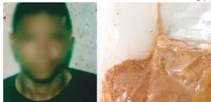
Falso garimpeiro paga garota de programa com barro no Pará

Um homem, de 36 anos, que se passava por garimpeiro, pagou uma garota de programa com um pacote de barro, dizendo ser ouro. Ao perceber o ocorrido, a mulher acionou a polícia e os dois foram parar na delegacia.