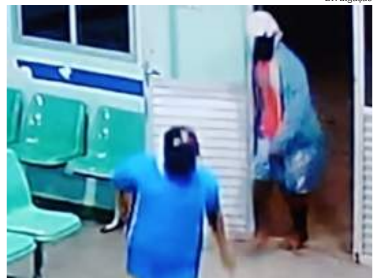
Homem foi preso por possível participação de execução em hospital

O crime gerou pânico entre os funcionários e os pacientes que estavam no local, mas ninguém ficou ferido. Segundo informações, a vítima respondia por homicídio e era envolvida com facções criminosas.