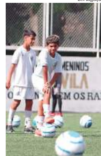
Atletas do Santos Manaus representam a potência do esporte

A franquia do Santos de Manaus é potência tanto nos campeonatos oficiais de futebol quanto nas competições de base do futsal amazonense. Os treinamentos de futebol ocorrem na Arena APCEF Amazonas, na Avenida Efigênio Sales, ao lado do Tribunal de Contas do Estado (TCE). Já a escolinha de futsal funciona no ginásio Casimiro de Abreu - rua Jurunas, na Cidade Nova. As matrículas estão abertas nas duas modalidades.