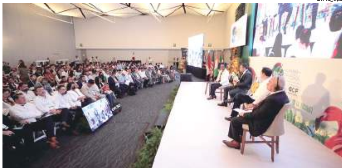
Governador Wilson Lima junto a outras autoridades no México

As escolas foram projetadas para terem um baixo