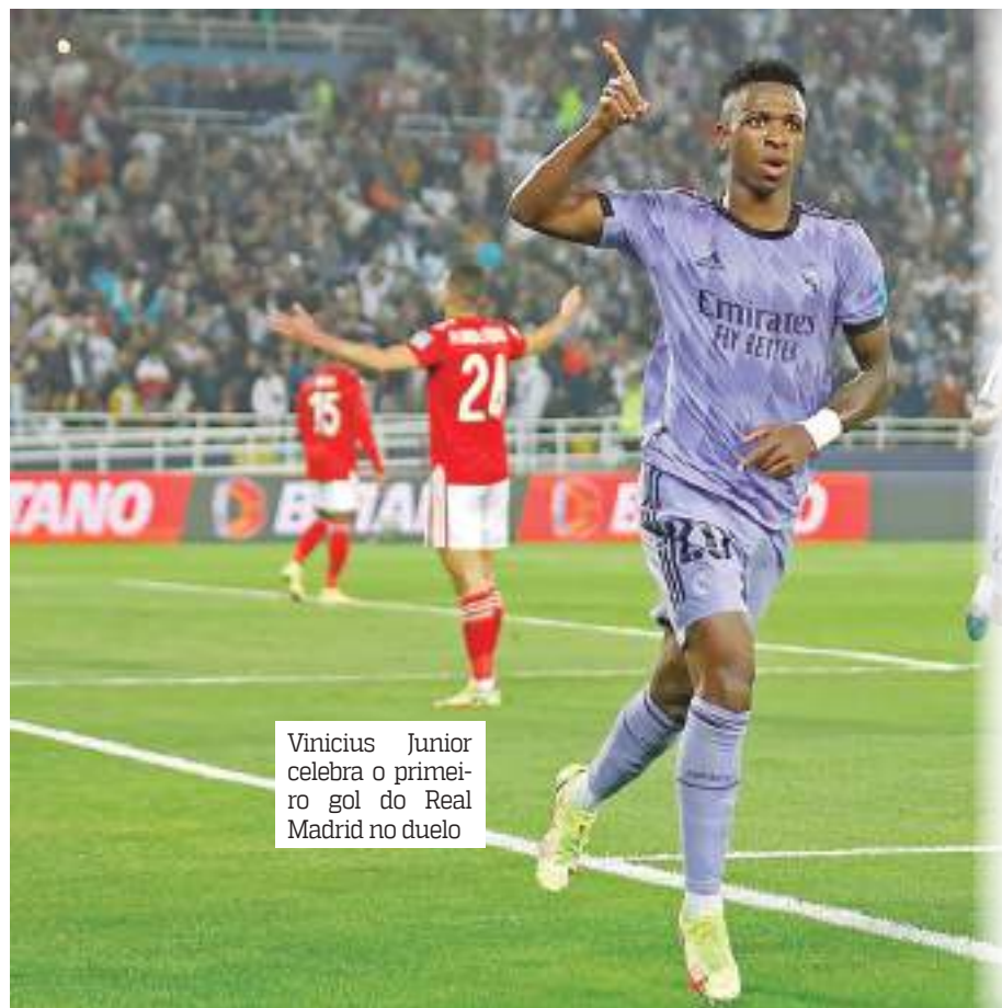
Vinicius Junior celebra o primeiro gol do Real Madrid no duelo

Foi com dificuldade que o Real Madrid superou o Al Ahly, do Egito, e se classificou para a final do Mundial de Clubes. O placar de 4 a 1, definido com dois gols nos acréscimos no estádio Príncipe Moulay Abdellah, em Rabat, não é bom retrato dos problemas encontrados pelos favoritos.