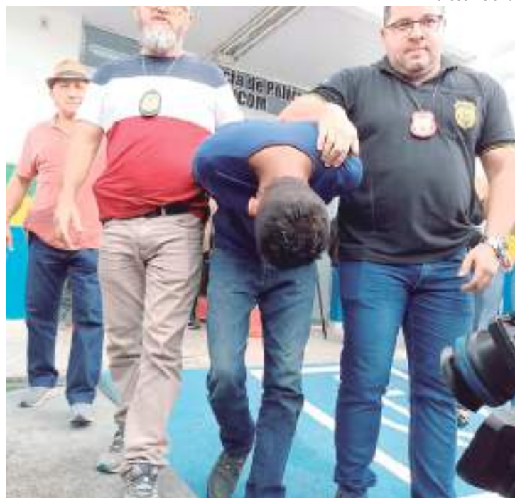
Homem foi detido apontado como suspeito de participar do crime

Ainda na coletiva, o delegado relatou que o indivíduo localizado negou participação no crime. Ao ser confrontado com imagens de segurança, o suspeito mudou a versão e disse que participou emprestando o carro após terem oferecido uma quantia de dinheiro para isso, mas não esteve presente no crime. Porém, foi constatado em vídeos de segu-