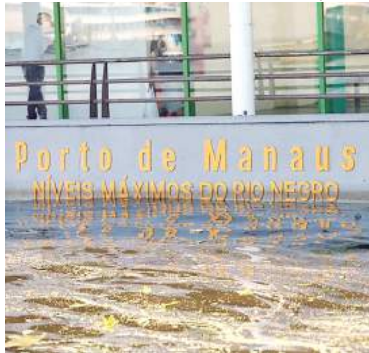
Régua medidora do Rio Negro no Porto de Manaus