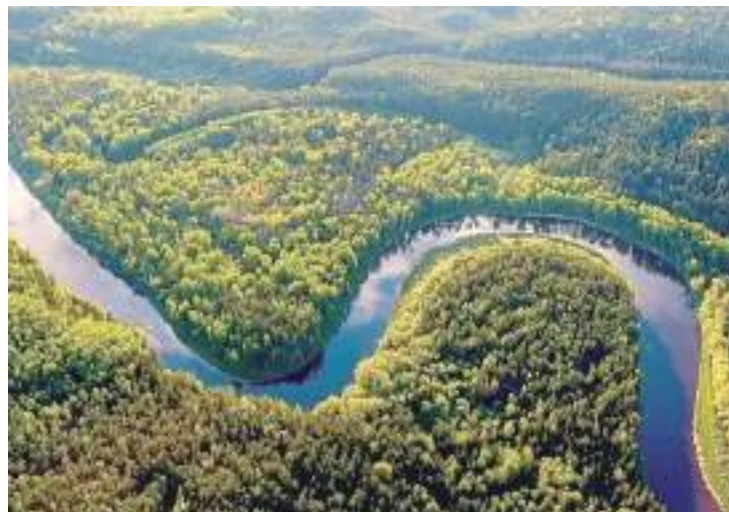
Projeto apoia empreendedorismo sustentável na Amazônia

A inscrição deve ser feita pelo link https://genese.jornadaamazonia.org.br/