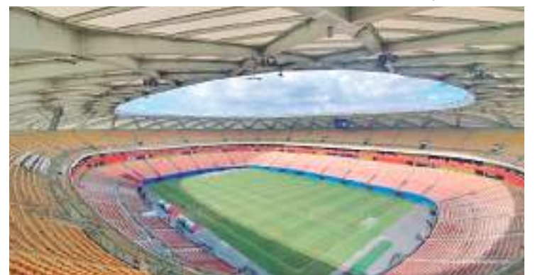
Arena da Amazônia - Vivaldo Lima é um estádio multiuso de Manaus

“Trabalhamos incessantemente para que nossos clubes tivessem a garantia de usar os estádios do próprio estado. Todos os laudos estavam vencidos e a CBF não aceita, legalmente correta. Fizemos uma for-