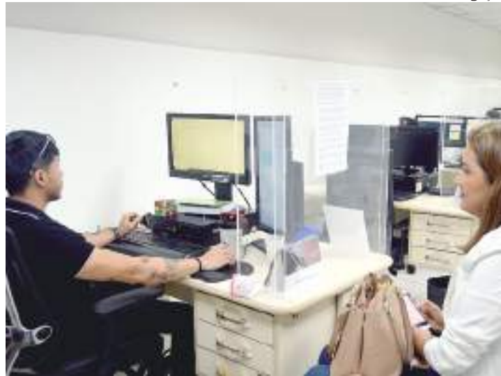
Servidor público do TRT-11 atende trabalhadora

Durante o ano de 2022, foram iniciados 29.352 processos trabalhistas no TRT-11, conforme levantamento realizado pela Coordena-