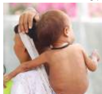
Indígenas da tribo Yanomami em Roraima

“Em vez de promover uma ação articulada em defesa da vida, agiu com descaso e ausência de medidas em proteção aos povos indígenas, impõe-se a abertura do processo disciplinar e, ao fim do processo, a cassação de seu mandato”, diz a representação.