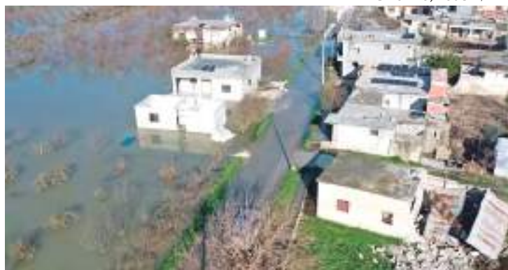
Vilarejo al-Tulul, no noroeste da Síria, após inundação

A maioria dos habitantes do vilarejo al-Tulul, no noroeste da Síria, deixou o local na quinta-feira (9), após o rompimento de uma barragem de terra que inundou a região, consequência do forte terremoto que abalou o país e a vizinha Turquia, observou um correspondente da AFP.