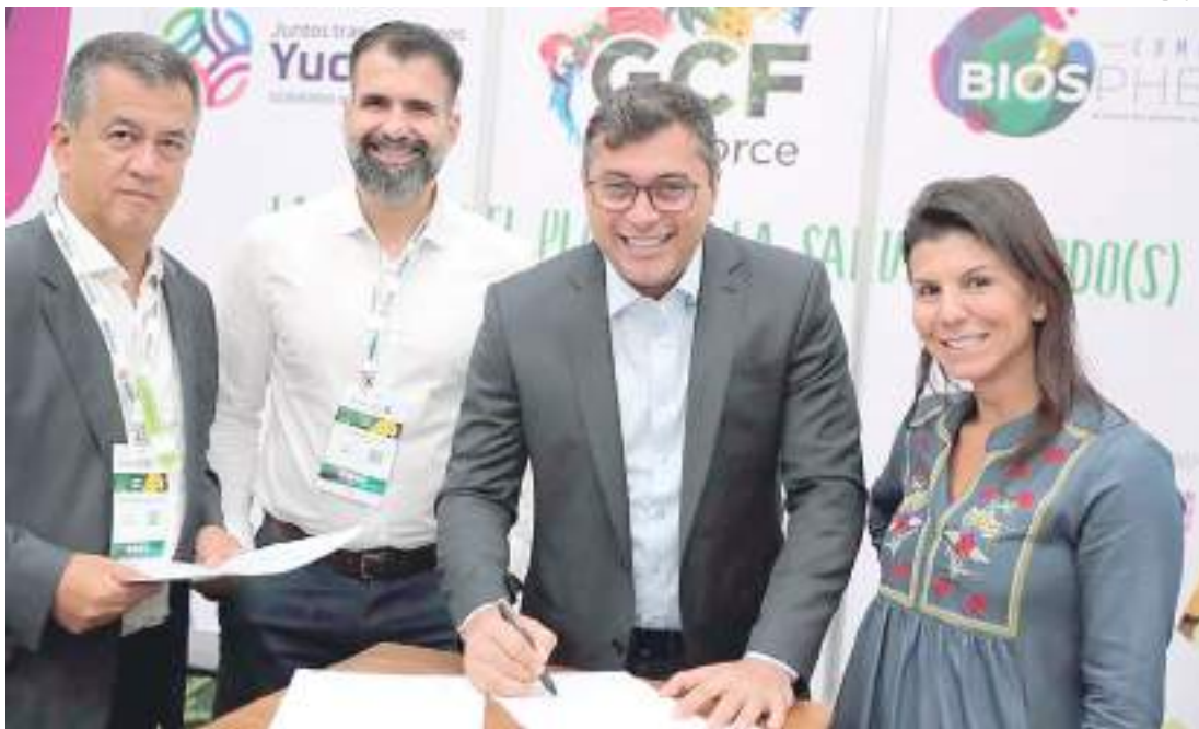
Governador Wilson Lima apresenta propostas para o Amazonas durante evento no México

“A gente tem trabalhado muito com aqueles países que têm interesse em fazer investimentos na Amazônia, tem trabalhado com aqueles países que têm interesse em nos ajudar com essa questão da conservação”, afirmou o governador Wilson Lima, que presidiu até ano passado o GCF Task Force, trazendo para