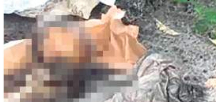
Ossada humana teria sido desenterrada de terreno baldio no Jorge Teixeira

A identificação da ossada humana fará parte da investigação da Delegacia Especializada em Homicídios e Sequestros (DEHS), órgão responsável pelo caso.