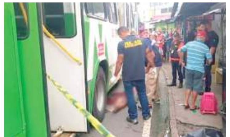
Ônibus da linha 127 atingiu idoso na Avenida Brasil, Zona Oeste

Ressalta, ainda, que todos os procedimentos de busca por primeiros socorros foram feitos pelo motorista, que permaneceu no local até a chegada do SAMU e das autoridades policiais, que estão investigando o caso.