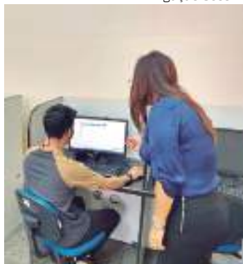
Estudantes realizam Provão Eletrônico da Educação de Jovens e Adultos

As inscrições para o Exame Supletivo Eletrônico da Educação de Jovens e Adultos (EJA), o Provão Eletrônico, exclusivo para candidatos da Educação Especial, estarão abertas a partir da próxima segunda-feira (13). Todo o processo - de cadastro, agendamentos e aplicação do exame - deve ser realizado de forma presencial, das 8h30min às 12h e de 13h às 16h, na Escola Estadual