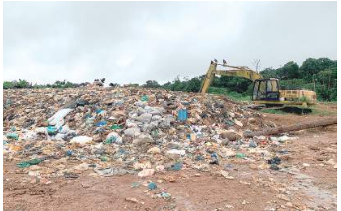
Lixão localizado em Iranduba. Moradores recolhem há um ano assinaturas para fechar o local

Enquanto alguns moradores querem a continuidade