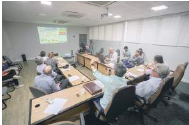
Membros do Comitê de Assuntos Tributários Estratégicos