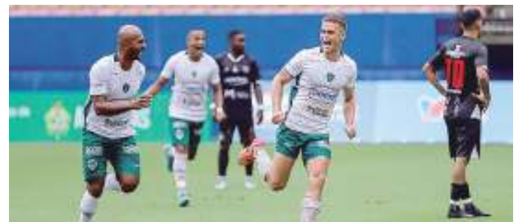
Manaus FC e Rio Negro se enfrentaram na Arena da Amazônia