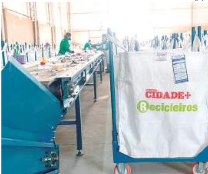
Trabalhadores atuando no Instituto Recicleiros

O programa, único no Brasil, prevê investimentos de até R$ 5 milhões em cada uma das cidades selecionadas, além de fornecer tecnologia, maquinário, inteligência, capacitação e suporte total para que as cidades possam desenvolver e administrar com eficiência a coleta seletiva sustentável, envolvendo os aspectos ambientais, sociais e econômico. Gestores públicos representantes das cidades