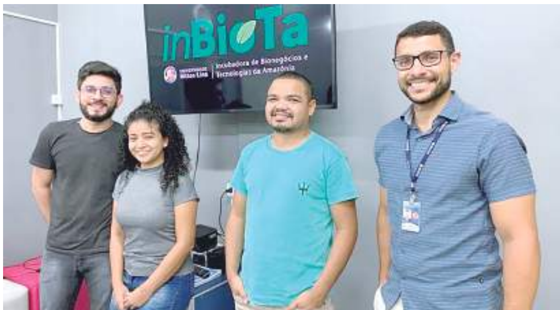
Apresentadores do programa na sede da inBioTa na Universidade Nilton Lins

A inBioTa da Nilton Lins, tem dois anos de existência e possui atualmente oito startups em seu portfólio, que desenvolvem projetos nas áreas de tecnologia, comunicação, sustentabilidade e bioeconomia. Além de pesquisas de produtos amazônicos para a fabricação de bioplásticos, cosmé-