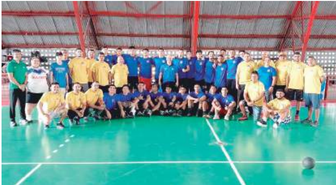
“Acampamento Amazonense de Handebol 2023” reúne 75 pessoas, entre técnicos e atletas