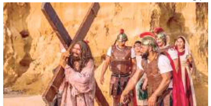
Encenação durante o espetáculo de páscoa RUACH