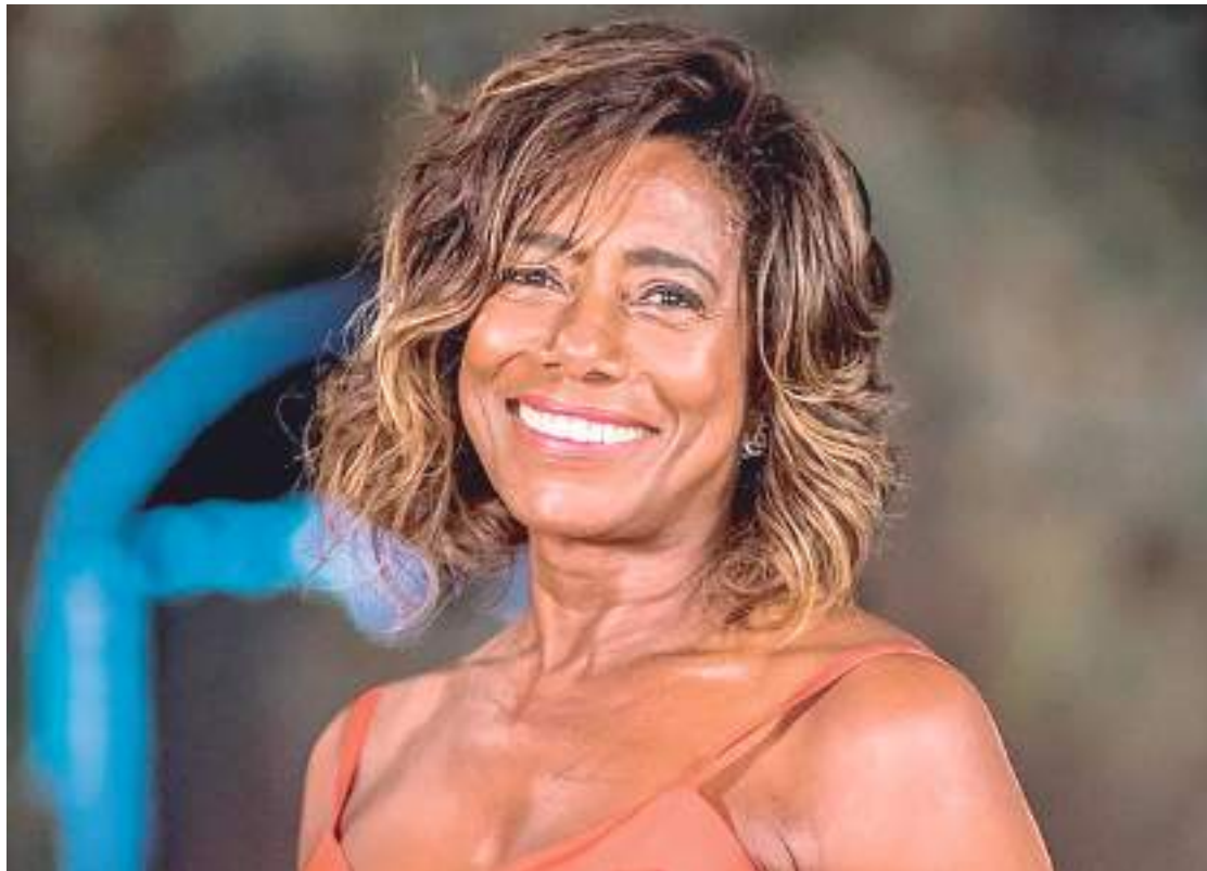
Glória Maria foi pioneira na jornalismo televisivo brasileiro, marcando várias gerações

A jornalista e apresentadora Glória Maria morreu, na manhã de ontem (2), no Rio de Janeiro por complicações de um câncer no cérebro.