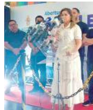
Programa ‘Educa+Manaus’, lançado pela Prefeitura de Manaus