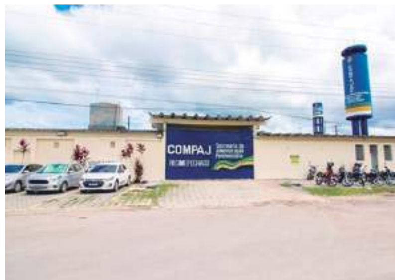
Homem teria cooperado com os detentos no ano da rebelião no Compaj