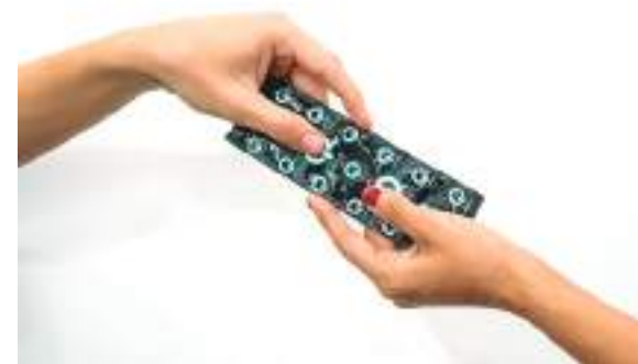
Camisinhas distribuídas pela Secretaria Municipal de Saúde

por profissionais dos Distritos de Saúde (Disas) Norte, Sul, Oeste, Leste e Rural, com atuação em blitze educativas em locais de maior circulação de pessoas, como o Porto da Cesa, Feira do Coroado, Terminais de Integração, na barreira de acesso para as rodovias BR-174 e AM-010 e nos desfiles no Sambódromo nos dias 18 e 19 de fevereiro.