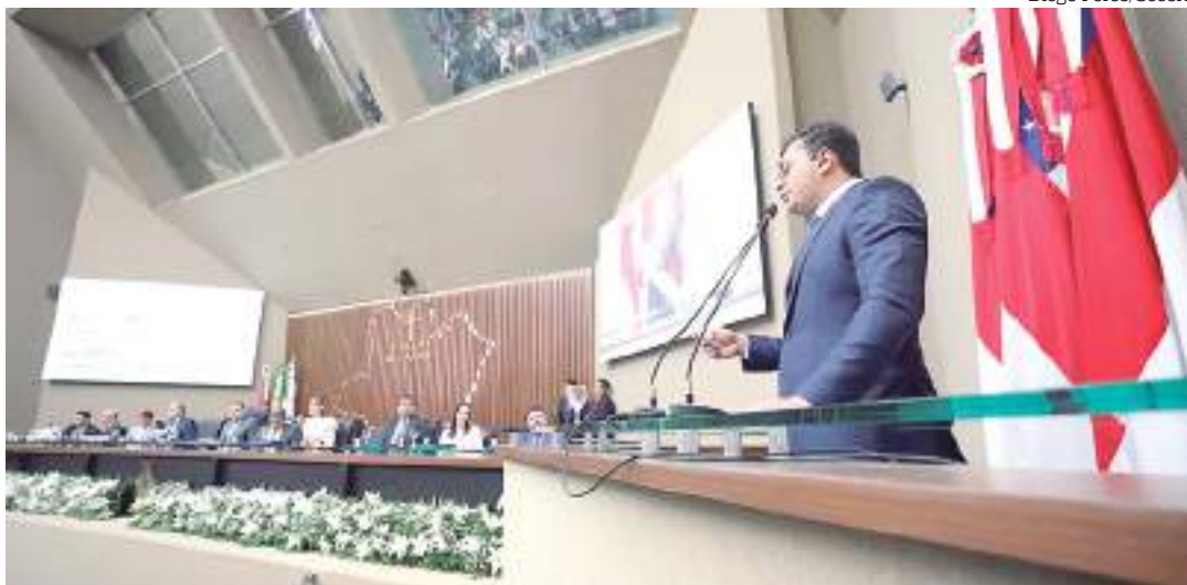
Governador Wilson Lima durante abertura dos trabalhos da 20ª legislatura da Aleam

Ele lembrou que em 2021 foi aprovada a Lei nº 5.420