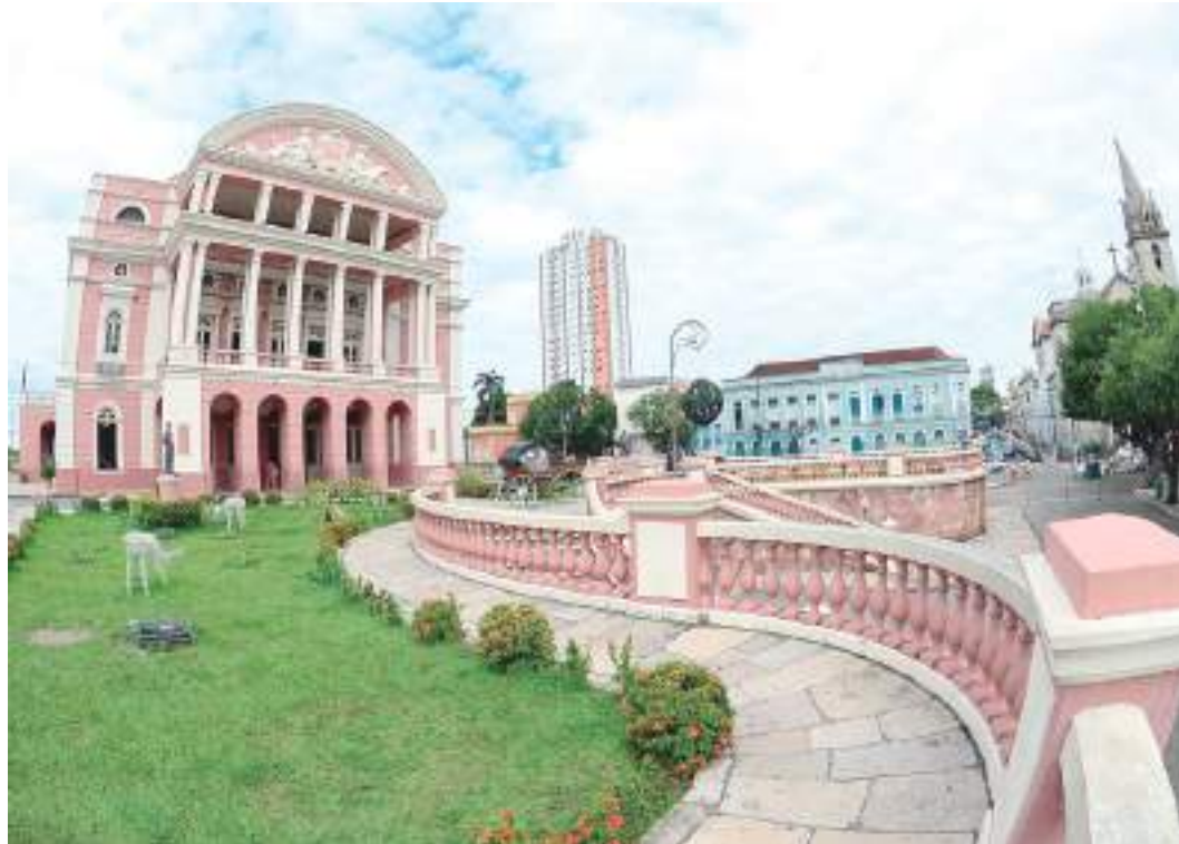
Entrada do Teatro Amazonas, onde ocorre nesta sexta-feira o Sarau Carnavalesco

sábado (04), às 20h, o Teatro Amazonas recebe o “III Concerto Cine In Concert”, do Instituto Musical Vila da Barra. Com duração de 1h30,