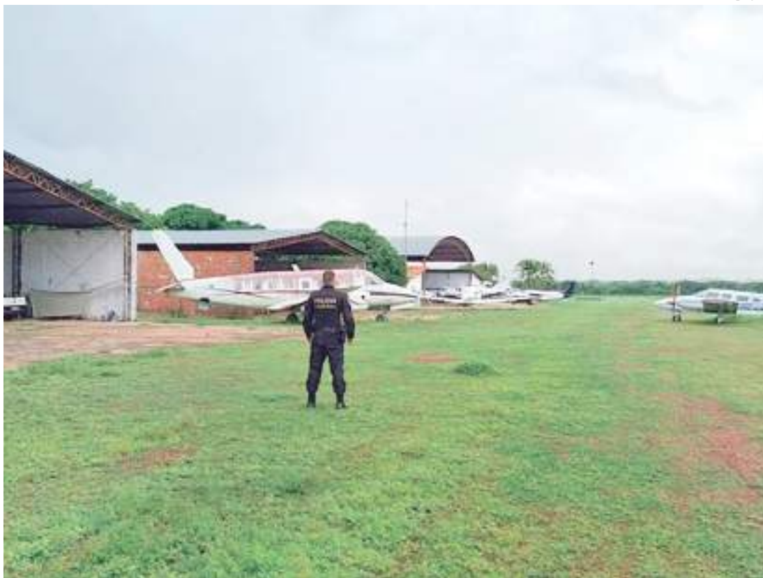
Agente da Polícia Federal durante a Operação Expansão

O trabalho teve início em 2020, e, durante a investigação, constatou-se que os integrantes do grupo criminoso se valiam principalmente