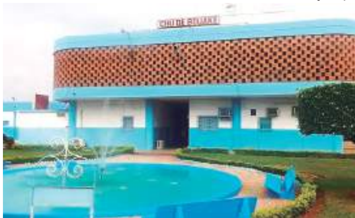
Hospital de Bouaké, na Costa do Marfim, onde 20 pessoas morreram