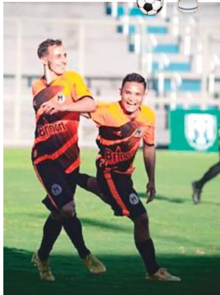
Robô da Amazônia galeou com cinco gols o Iranduba, no Carlos Zamith

No domingo (5), o Operário encara o Manaus, às 15h30, no estádio Gilberto Mestrinho, o Gilbertão, em Manacapuru.