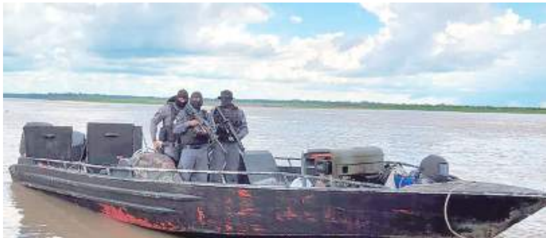
Agentes de segurança pública atuam na Operação Hórus/Fronteira Mais Segura

O Amazonas foi o Estado brasileiro que mais combateu o crime organizado em janeiro deste ano, em ações policiais no âmbito da Operação Hórus/Fronteira Mais Segura, de acordo com informações do Ministério da Justiça e Segurança Pública (MJSP). A descapitalização das organizações criminosas pelas forças de Segurança foi orçada em mais de R$