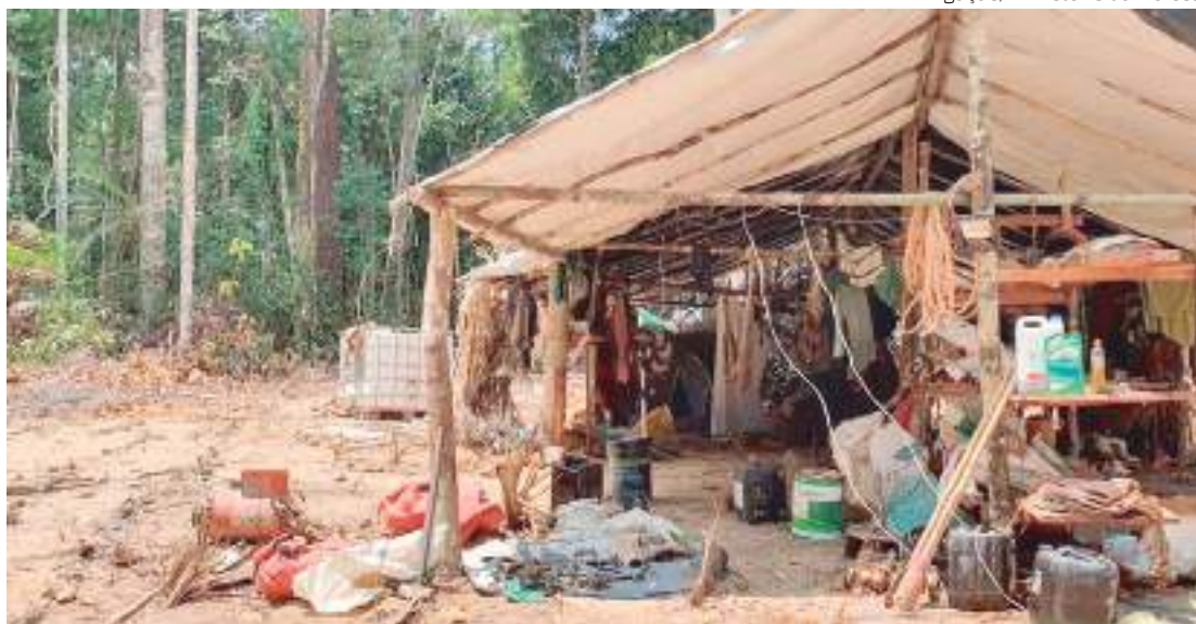
Sede de garimpo em Terra Indígena Yanomami em Roraima

Denúncias mostram que pelo menos 30 meninas e adolescentes Yanomami estariam grávidas vítimas de abusos cometidos por garimpeiros em Roraima, informou o secretário Nacional dos Direitos da Criança e do Adolescente, Ariel de Castro.