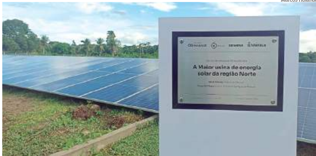
Usina solar de Manaus foi inaugurada no Quilômetro 15 da BR 174

“O município busca a inovação com a procura por energia que tenha menor impacto ambiental, medida que coloca Manaus no cenário nacional”, comenta.