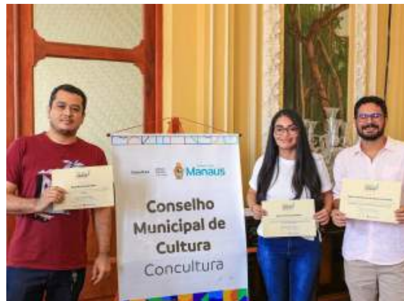
Representantes do Conselho Municipal de Cultura

A nova Lei 2.960, de 5/10/22, alterou a anterior, unificando as categorias que eram divididas entre regionais e nacionais, ficando agora em dez: prêmio Álvaro Maia (romance ou novela), prêmio Arthur Engrácio (contos), prêmio Péricles Moraes (crônicas), prêmio Violeta Branca Menescal (poesia), prêmio Samuel Benchimol (ensaio), prêmio Aúreo Nonato (memória e jornalismo literário), prêmio Alfredo Fernandes (literatura infanto-juvenil), prêmio Álvaro Braga (livro de teatro), prêmio Mário Ypiranga Monteiro (ensaio de tradições populares) e o prêmio Djalma Batista (temática amazônica).