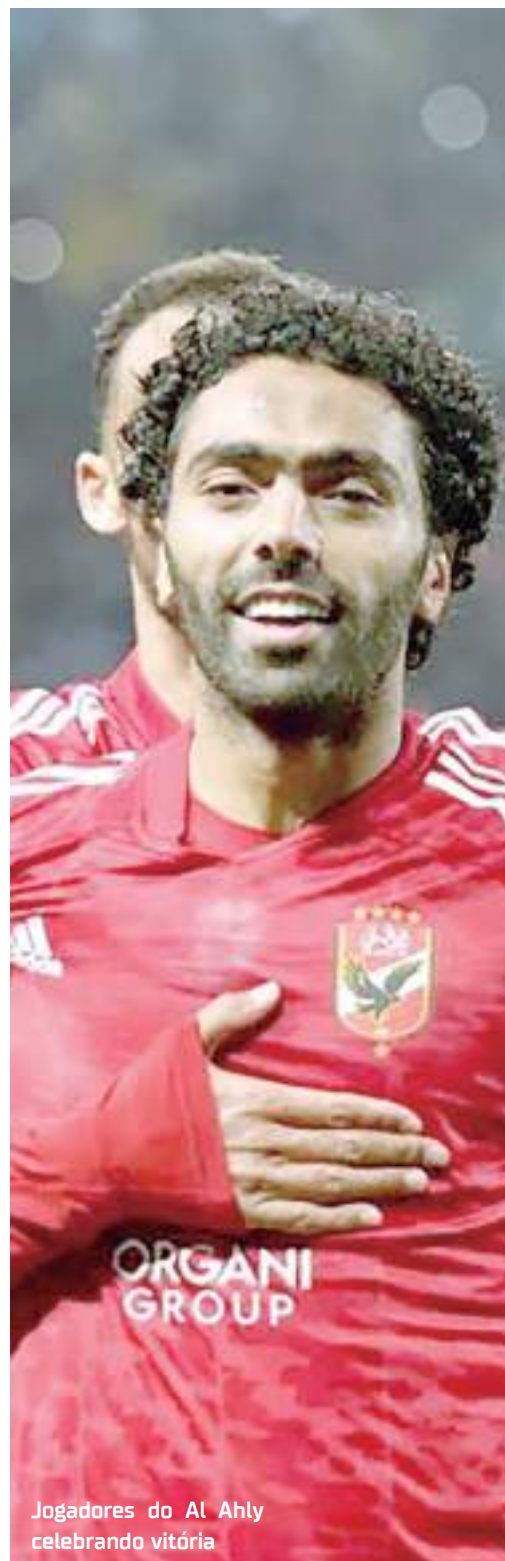
Jogadores do Al Ahly celebrando vitória