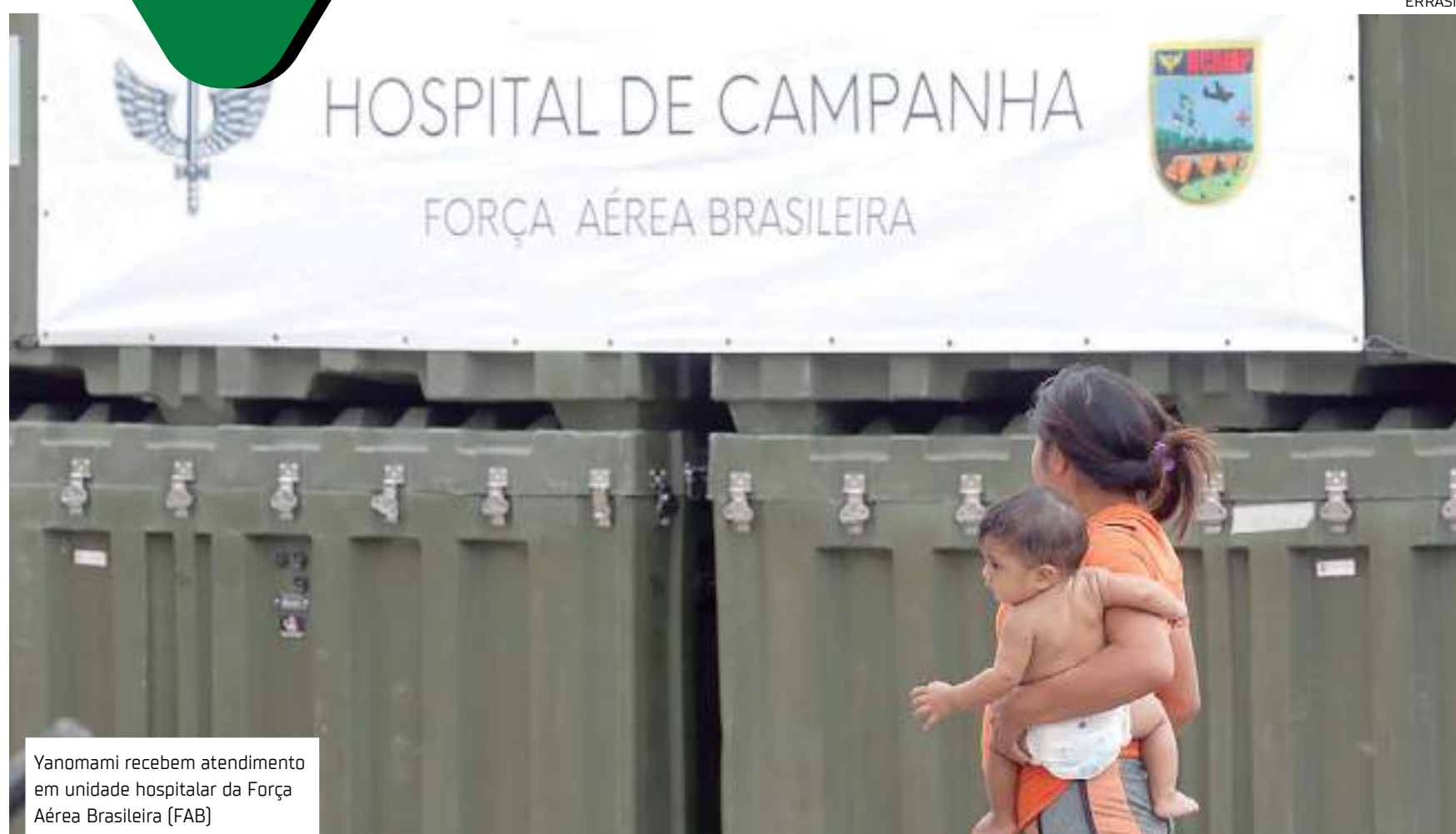
Yanomami recebem atendimento em unidade hospitalar da Força Aérea Brasileira (FAB)