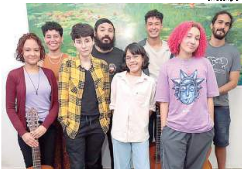
Alunos aprovados no vestibular para Escola de Artes da UEA

Informações sobre cursos e matrículas para o Liceu de Artes e Ofício estão disponíveis no Instagram @liceudoam e @culturadoam.