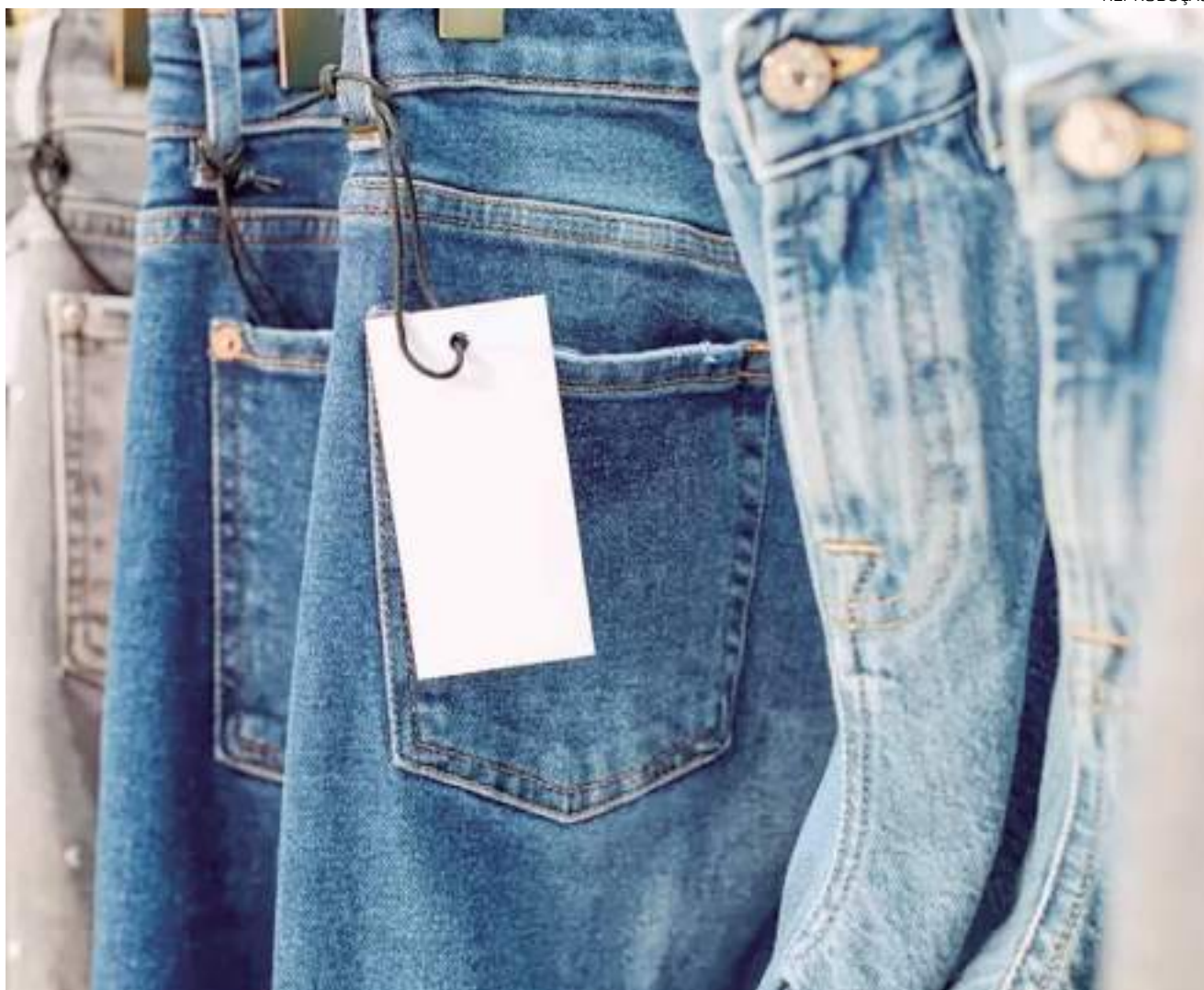
Calça jeans em pendurados em arara de loja

Com esse cenário, o uso de estratégias para atrair o consumidor faz parte da rotina dos profissionais do setor. Se antes as previsões de coolhunters sobre comportamento de mercado e consumo consideravam