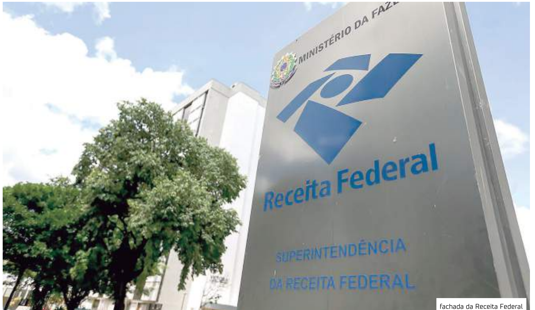
fachada da Receita Federal

As dívidas do contribuinte – consideradas créditos do ponto de vista do governo – serão classificadas com base na facilidade de serem recuperadas pela União, sendo créditos tipo A (com alta perspectiva de recuperação), créditos tipo B (com média pers-