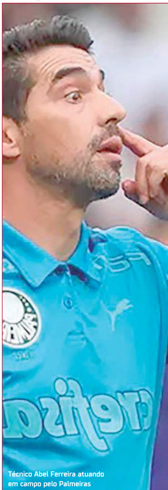
Técnico Abel Ferreira atuando em campo pelo Palmeiras