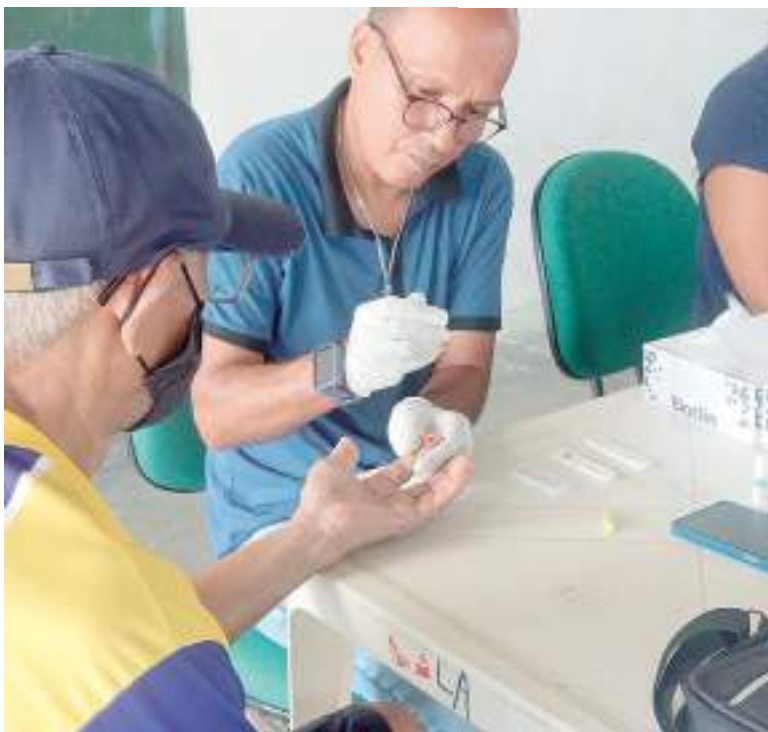
Agente de saúde realizando exame de dextro em idoso