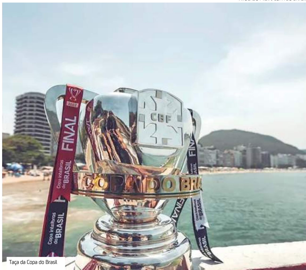
Taça da Copa do Brasil

A distribuição dos prêmios acontece de acordo com a divisão em que o time atua. Para receber um valor próximo ao R$ 91,8 milhões, o clube precisa ser da Série A e iniciar o torneio desde a primeira fase. Entre os doze