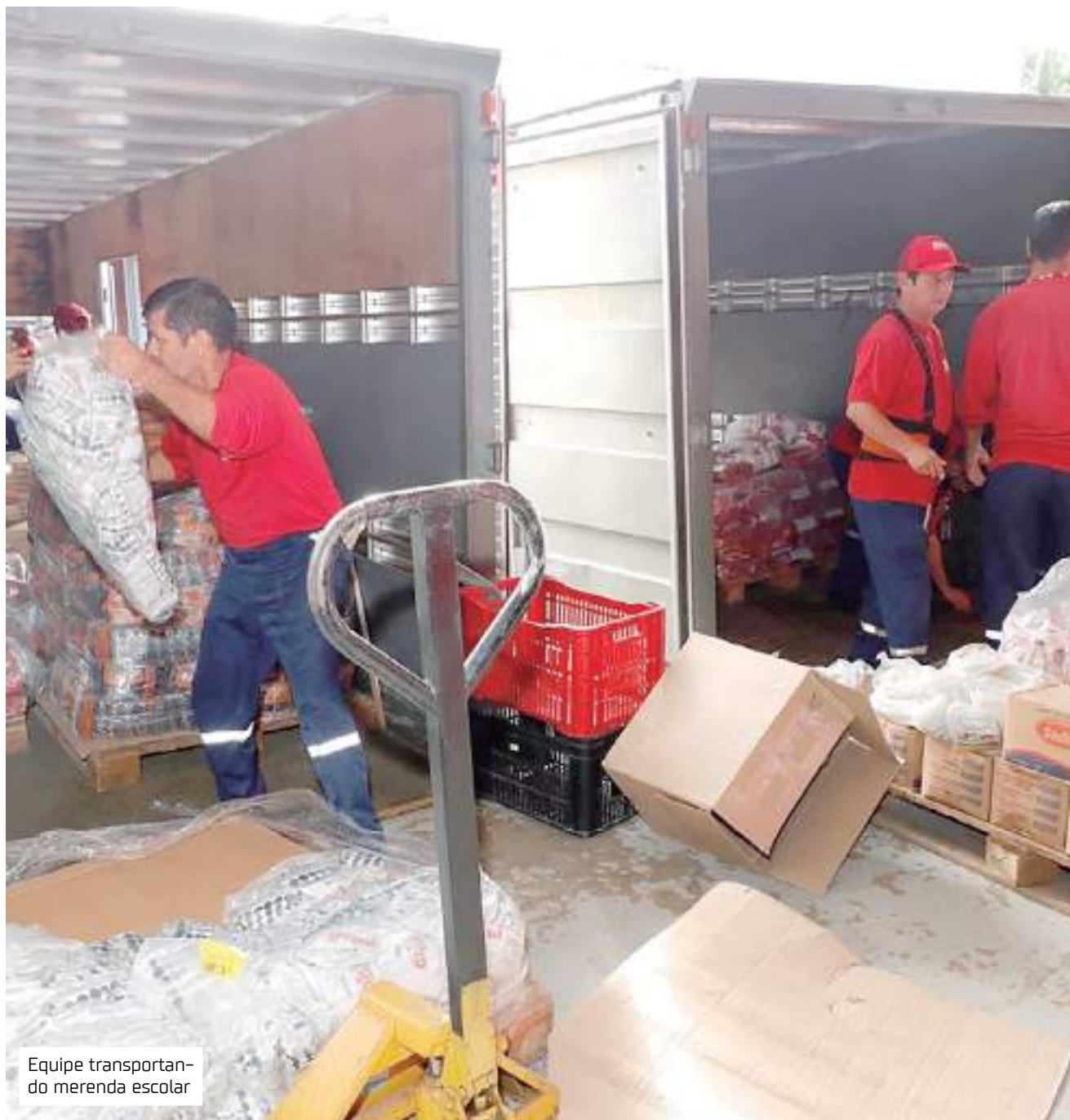
Equipe transportando merenda escolar

Conforme a responsável logística, outras remessas com materiais serão enviadas ao longo do ano para atender à necessidade dos municípios e proporcionar ensino de qualidade aos estudantes da rede estadual.