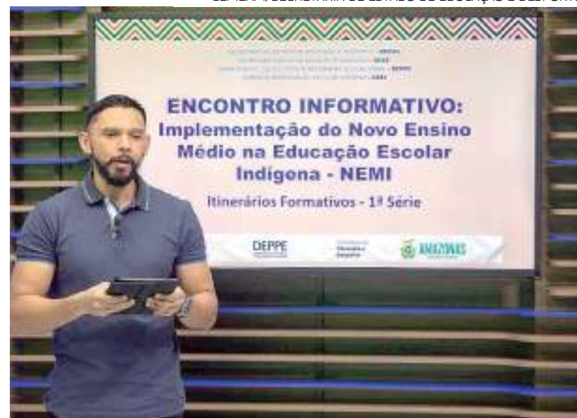
Educador apresentando slide sobre o NEMI

CEMEAM/SECRETARIA DE ESTADO DE EDUCAÇÃO E DESPORTO