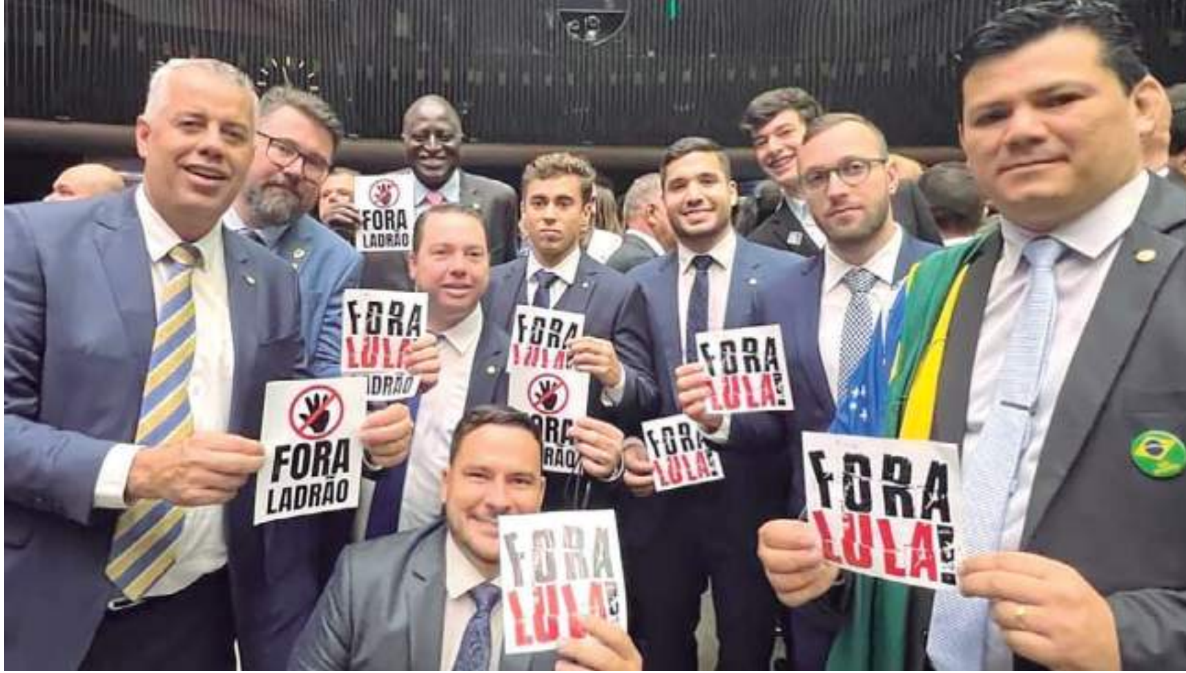
Deputado amazonense Capitão Alberto Neto (PL) também participou do protesto segurando adesivo com a frase "Fora Ladrão"

Parlamentares do PL, partido de Bolsonaro, colaram cartazes nas costas e usaram fitas pretas na boca em protesto contra o presidente Lula