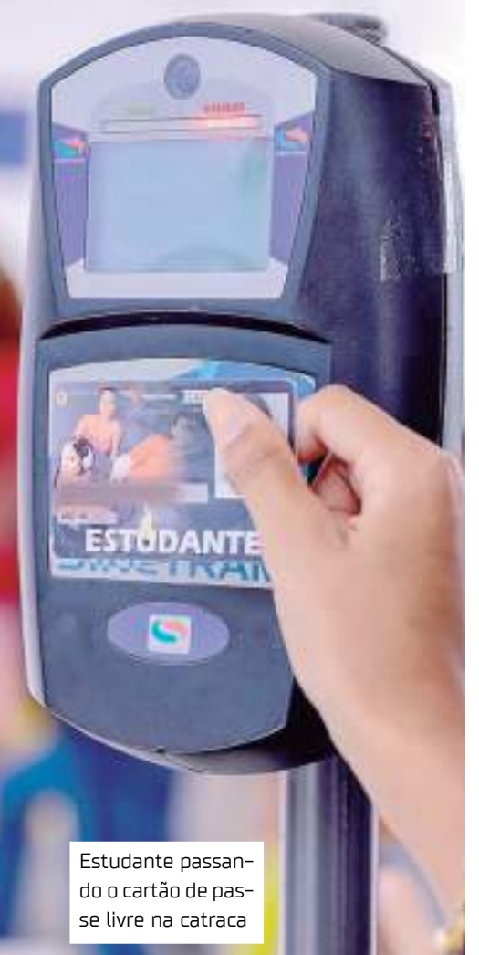
Estudante passando o cartão de passe livre na catraca

Alunos podem verificar se estão aptos para utilizar cartão