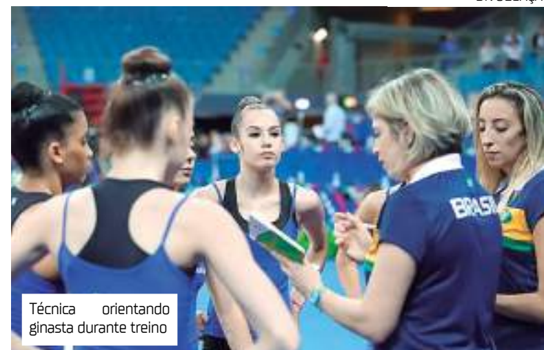
Técnica orientando ginasta durante treino