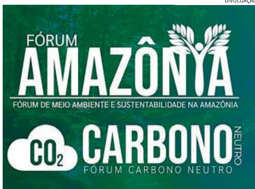
Cartaz com nome dos debates

A inscrição para os fóruns de Meio Ambiente e Sustentabilidade na Amazônia e Carbono Neutro está disponível no site oficial do evento através do link https://www.forumamazoniasustentavel.com.br/site/