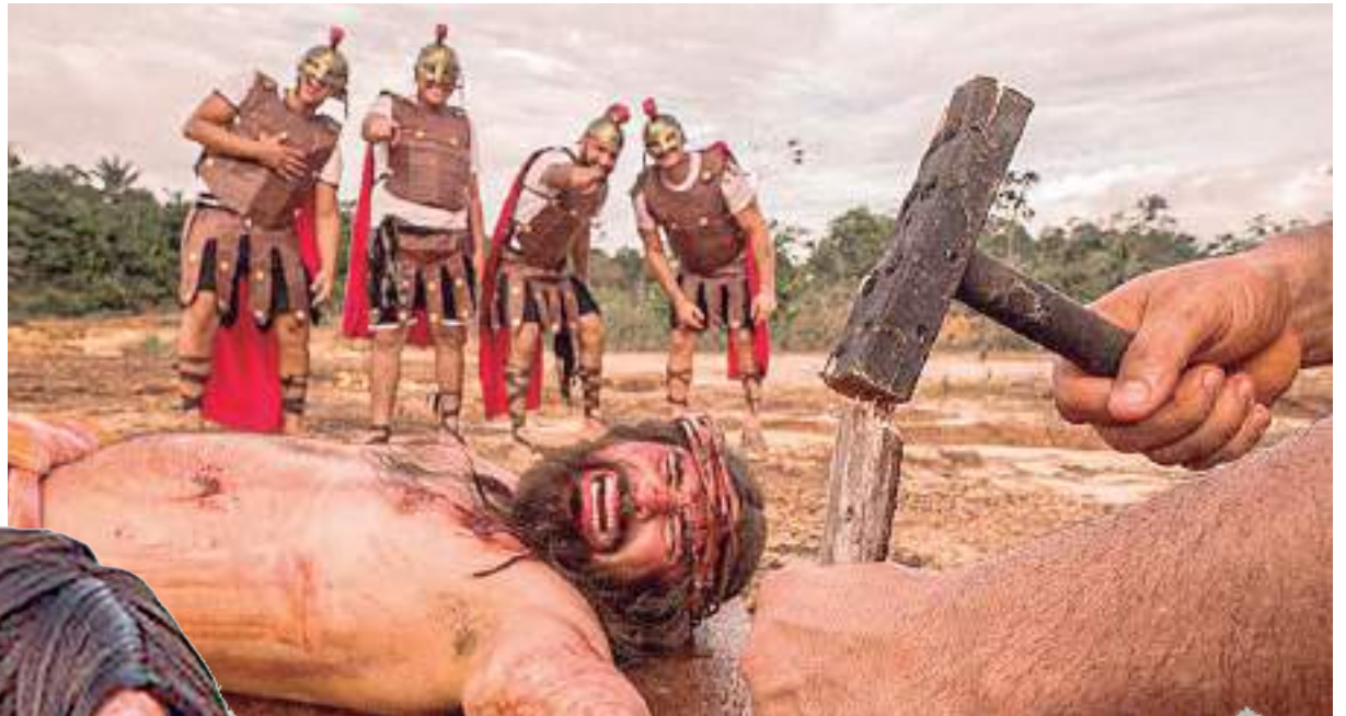
Personagens bíblicos em peça teatral