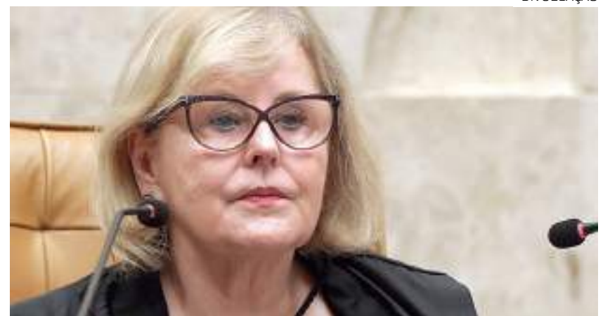
Presidente da Corte durante discurso na reabertura do Supremo Tribunal Federal

Há inquéritos no Supremo para apurar os atos golpistas de 8 de