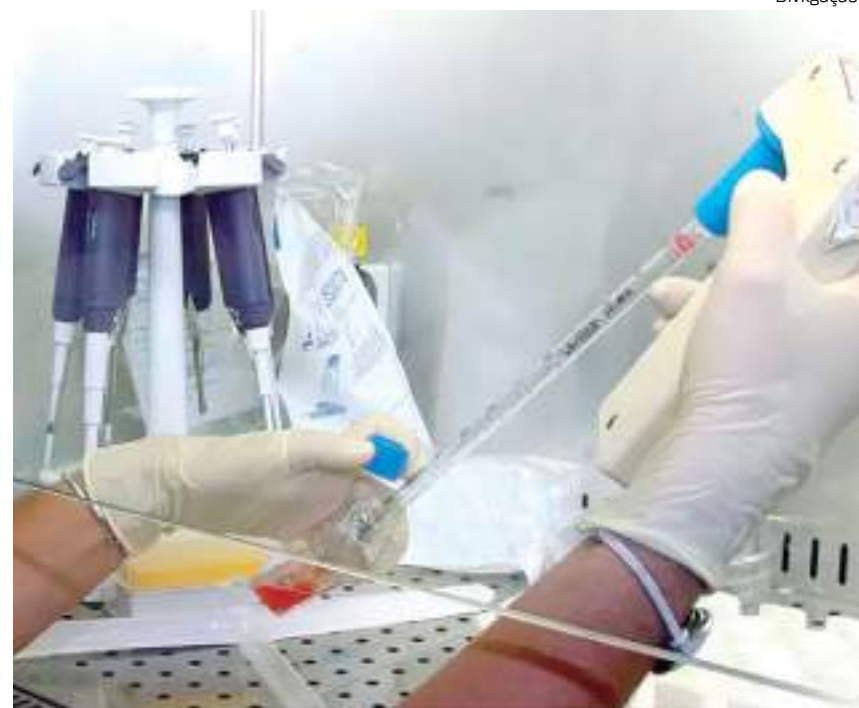
Pesquisadores italianos começaram a fazer testes com vacina contra o câncer

“Mas os tumores não podem fazer nada contra respostas imunitárias já existentes”, explicou, fazendo a ressalva de que ainda há um “longo caminho a trilhar” para que essa nova abordagem se torne realidade. “Mas tentaremos percorrer as etapas rapidamente”, disse. (ANSA).