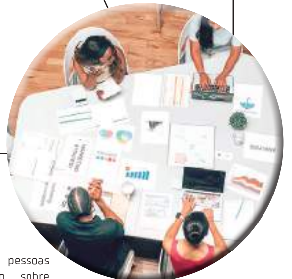
Reunião de pessoas conversando sobre estratégia