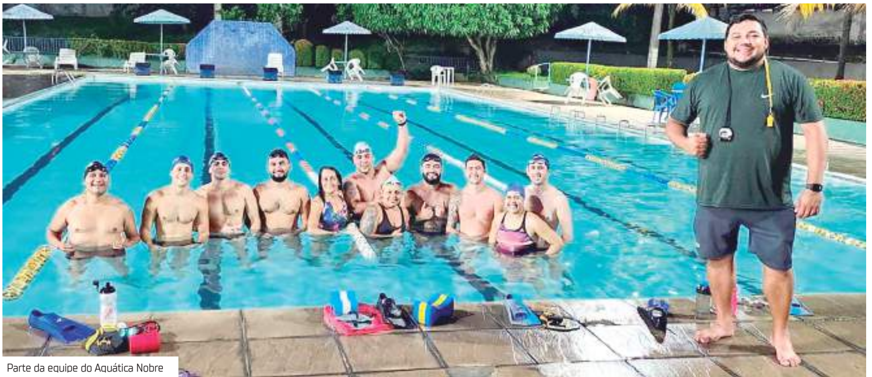
Parte da equipe do Aquática Nobre

"Além do incentivo à prática do esporte, estamos trabalhando a consolidação do município com mais