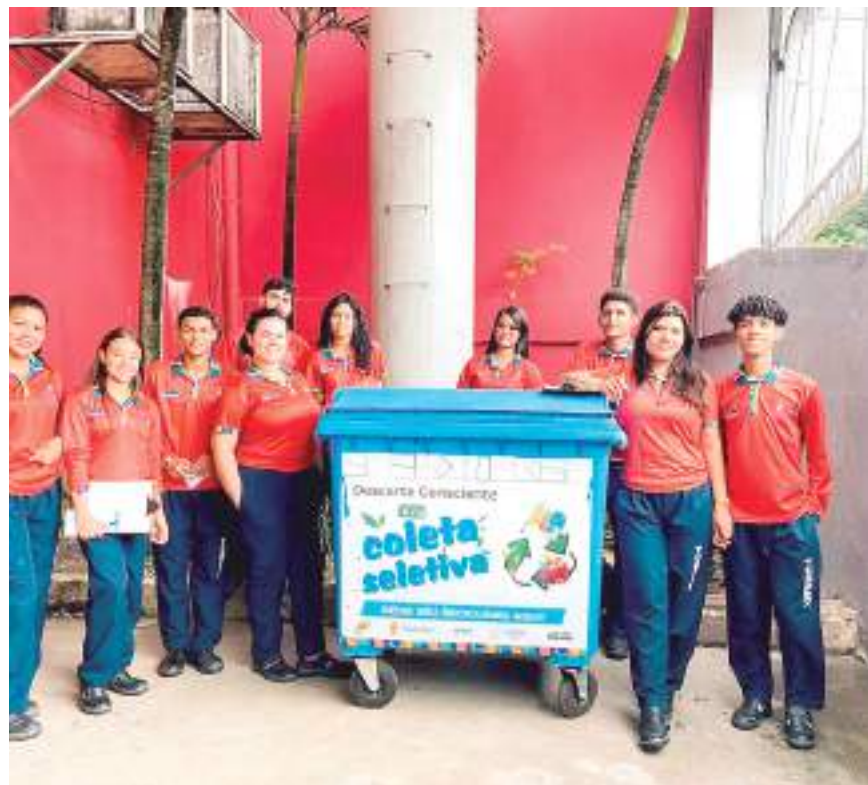
Agentes educadores do Coleta Seletiva

O ideal para armazenar o resíduo separado é em recipientes fechados, para evitar moscas e odores. Lâmpadas fluorescentes também podem ser recicladas e entregues nos PEVs.