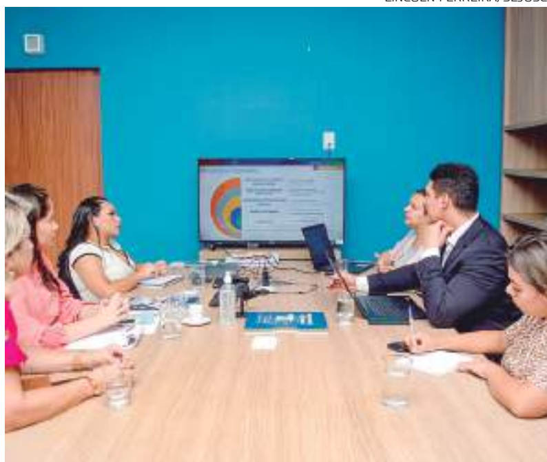
Reunião de alinhamento

A parceria visa à geração de autonomia econômica para mulheres. Além disso, uma das metas é a realização de 26 ações itinerantes e atendimentos à mulher do campo e da floresta, promoção de cursos