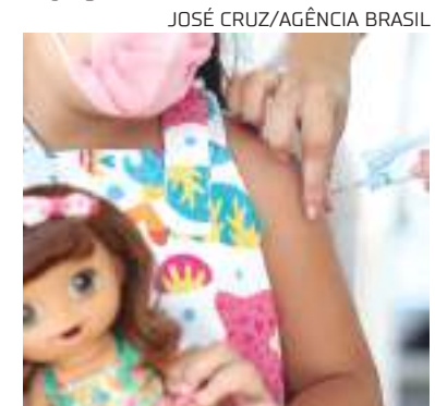
Criança vacinada pela coronavac durante campanha no Brasil

Em janeiro de 2022, a CoronaVac foi aprovada pela Anvisa para a população menor de 18 anos, de 6 a 17 anos; e, em julho, o imunizante foi liberado para crianças com idade entre 3 e 5 anos.