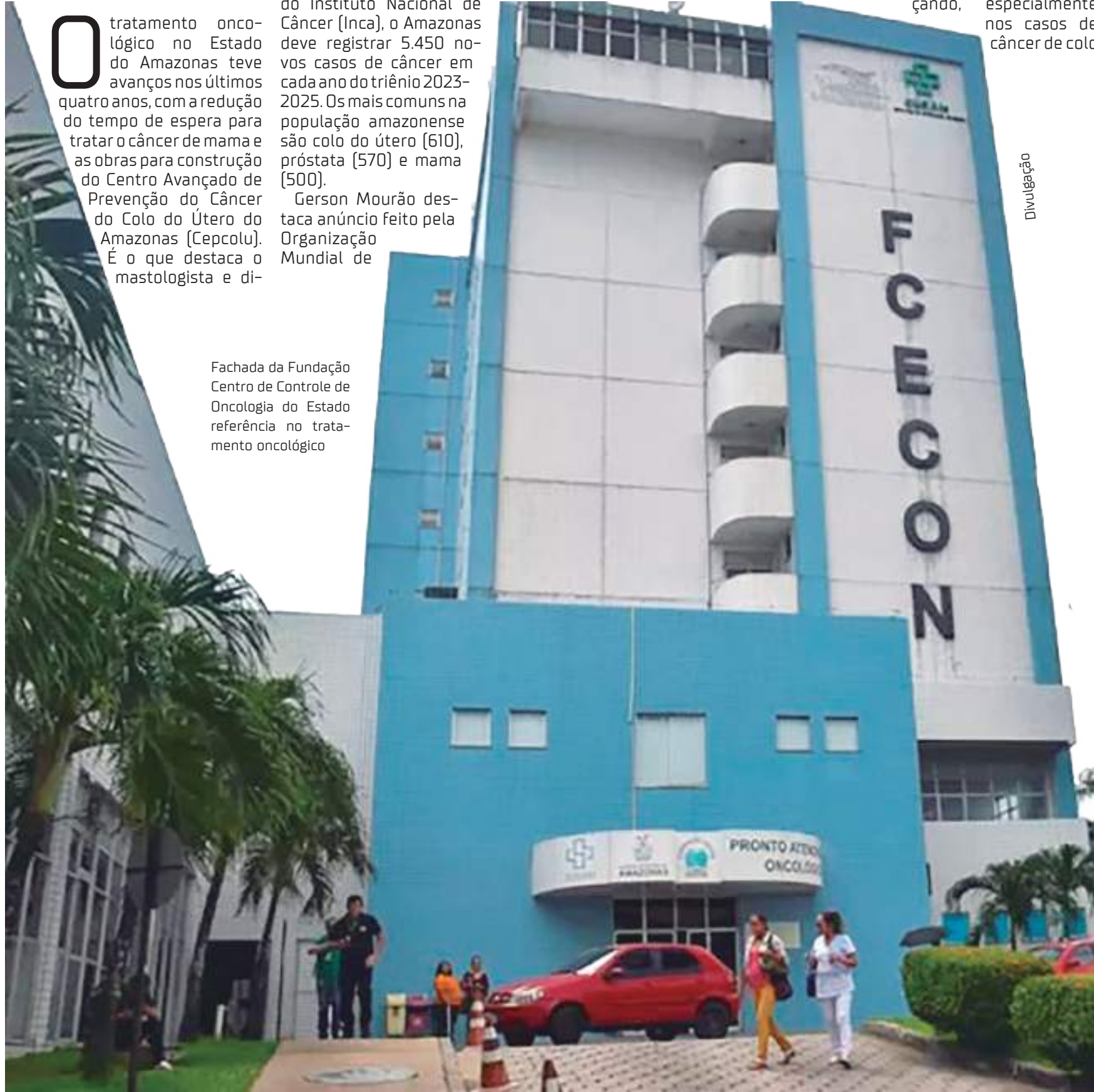
Fachada da Fundação Centro de Controle de Oncologia do Estado referência no tratamento oncológico

Outras ações são fazer exames preventivos, como o Papanicolaou para mulheres, e o toque retal para homens. As vacinas contra o HPV para meninos e meninas de 9 a 14 anos, e a vacina contra a hepatite B também são importantes.