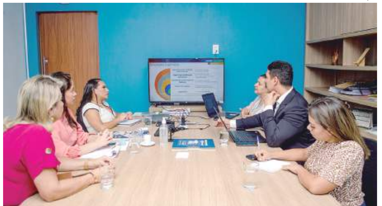
A reunião contou com a participação das subcoordenadorias setoriais Social e Institucional e Jurídica da UGPE

A Unidade Gestora de Projetos Especiais (UGPE) e a Secretaria de Estado de Justiça, Direitos Humanos e Cidadania (Sejusc) reuniram-se, na última semana, para tratar sobre o convênio que será firmado entre as duas instituições voltado à promoção das políticas públicas de gênero e diversidade. O projeto, com recursos previstos no Programa Social e Ambiental de Manaus e Interior (Prosamin+), que é desenvolvido pela UGPE, envolverá 13 municípios da Região Metropolitana de Manaus.