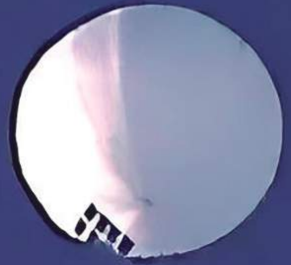
Balão chinês encontrado sobrevoando o Estado de Montana nos Estados Unidos