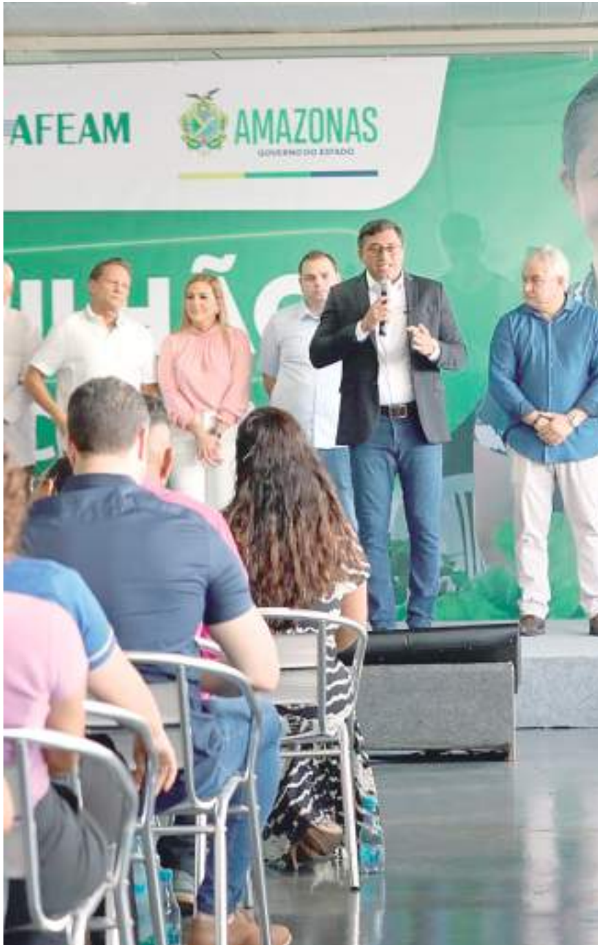
Governador Wilson Lima lançou o programa +Crédito Amazonas 2023

"A startup já é uma realidade no Brasil, em especial aqui no Estado do Amazonas, muitos jovens empreendedores estavam esperando a oportunidade de ampliar ou de começar algum negócio, alguma startup, e não tinha como acessar o crédito. Hoje isso é possível, da mesma forma que estamos antena-