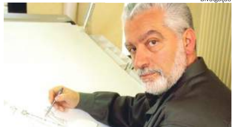
Famoso estilista Paco Rabanne durante trabalho

Foi o primeiro a criar moda com materiais que, até então, nunca ha-