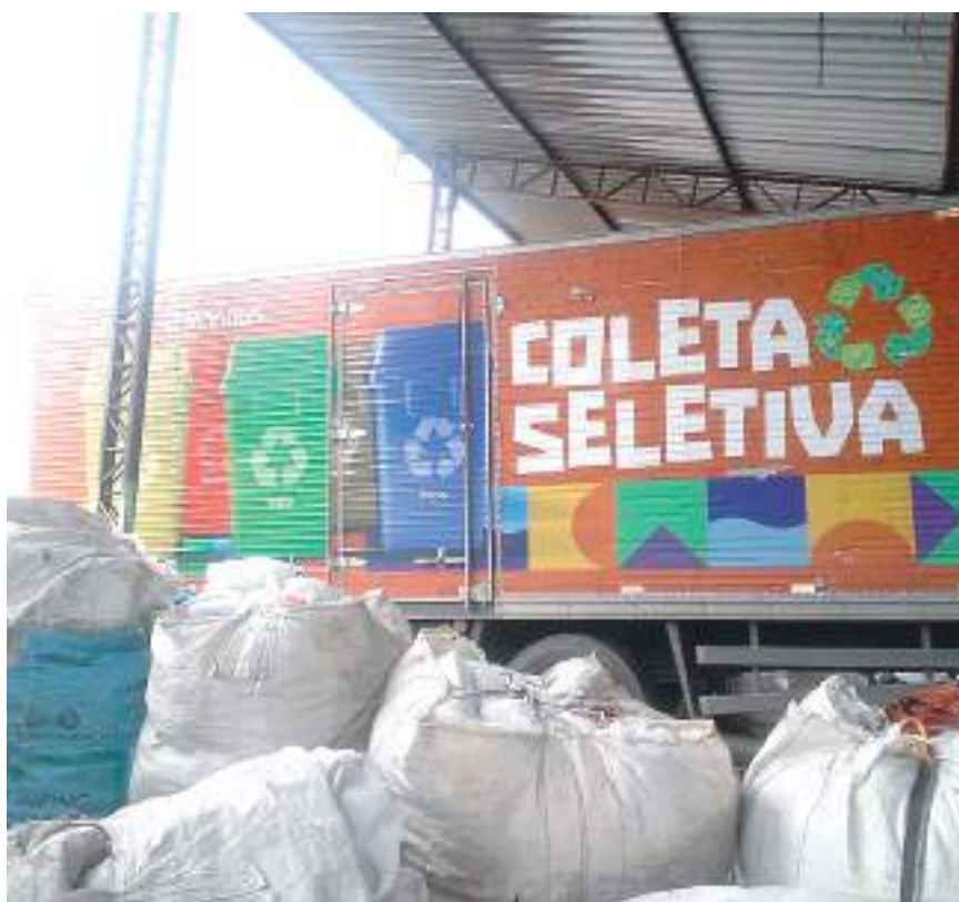
Caminhão de Coleta Seletiva em galpão

Os locais de entrega dispostos pelo órgão são conhecidos como Postos de Entrega Voluntária (PEVs). Segundo a Política Nacional de Resíduos Sólidos (PNRS), instituída pela Lei 12.305, a administração de resíduos deve ser compartilhada entre todas as partes envol-