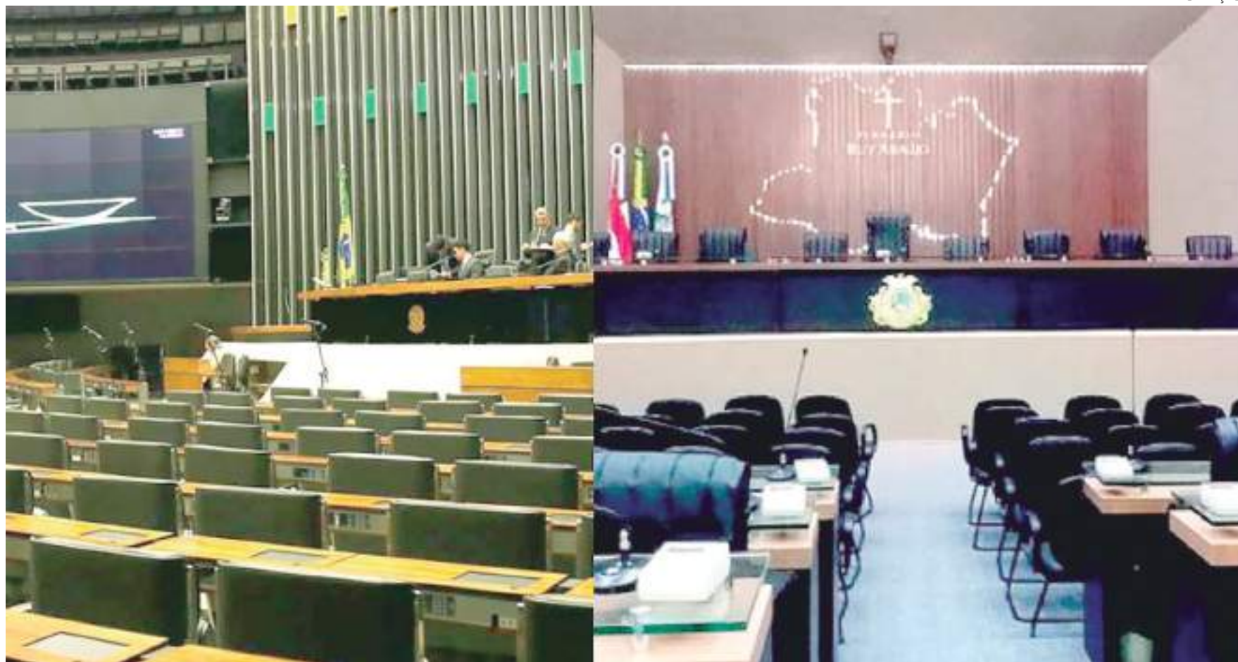
Casas legislativas iniciaram trabalhos nesta semana e possuem características antagônicas em relação a base governista

O Estado do Amazonas escolheu oito deputados federais para atuarem na Casa Legislativa, dos quais, quatro são estreantes e metade segue para mais quatro anos de mandato. Os novos deputados escolhi-