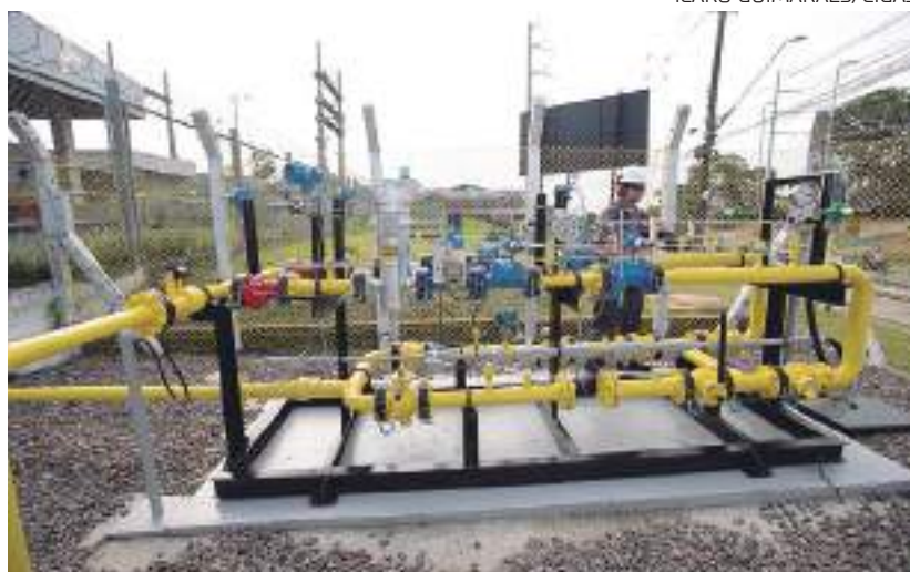
Estrutura para passagem de gás natural

Com a projeção de crescimento em torno de 30% no número de unidades consumidoras, com isso a Cigás, espera ultrapassar a marca de 16 mil usuários, alcançando um