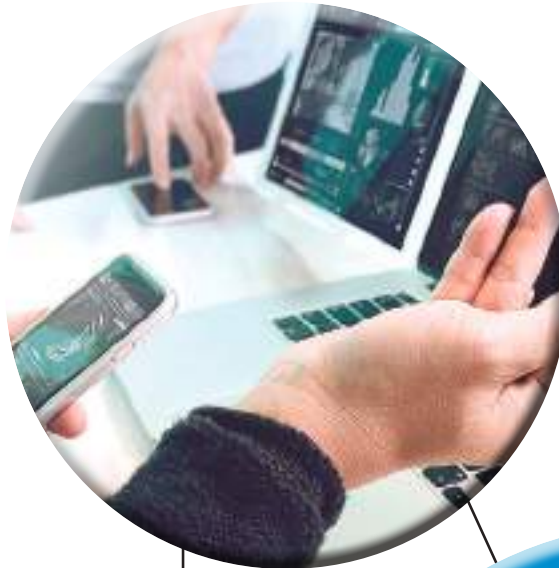
Câmeras, notebook, telefones e internet

Kopler menciona que as tecnologias inteligentes como smart homes, smart cities, smart devices, dentre outros, fazem parte das vidas dos consumidores. Por isso, as empresas devem acompanhar estas atualizações