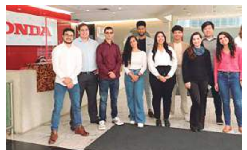
Jovens trainees da Moto Honda

As inscrições para o Programa de Trainee da Honda vão até a próxima segunda-feira (06) e, maiores informações podem ser obtidas pelo www.honda.com.br .