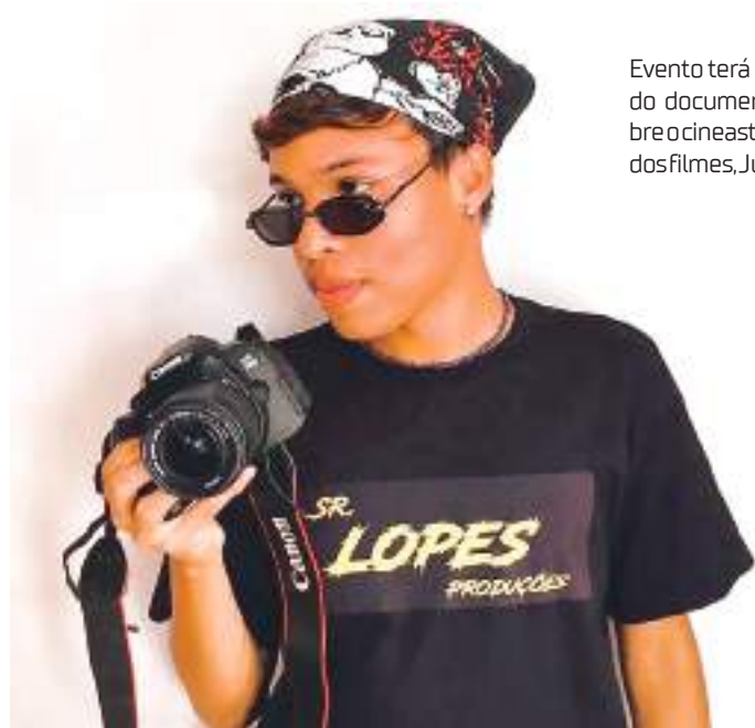
Evento terá a exibição do documentário sobre o cineasta e diretor dos filmes, Juan Lopes

O Cineteatro Guarany, localizado na avenida Sete de Setembro, Centro, terá programação gratuita da Mostra de Cineastas Amazonenses, que ocorre aos sábados (4, 11 e 18 de fevereiro). O evento exibirá curtas-metragens de terror e documentários, com classificação etária a partir de 12 anos.