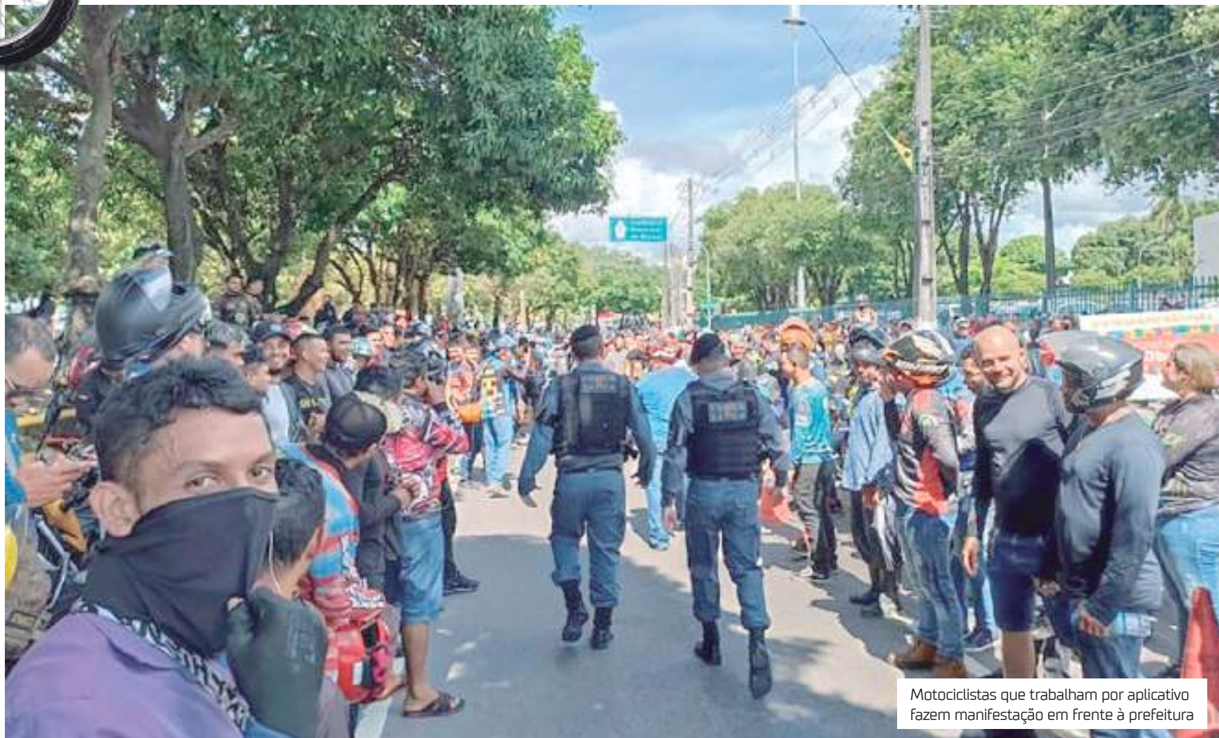
Motociclistas que trabalham por aplicativo fazem manifestação em frente à prefeitura

"Nossa equipe estava realizando uma fiscalização de rotina no Centro da cidade e fizemos a apreensão de cinco motocicletas, sendo duas sem documentação e as outras três de motoristas de aplicativo. O fiscal realizou conforme a legislação. Segundo a legislação federal, foi estabelecido que, entre as condições para entrar em aplicativo, o motorista precisa ter carteira na categoria B ou superior, ou seja, ele precisa ser um condutor de automóvel e não de motocicleta. Não houve por parte da prefeitura ou de outros órgãos que essa fis-