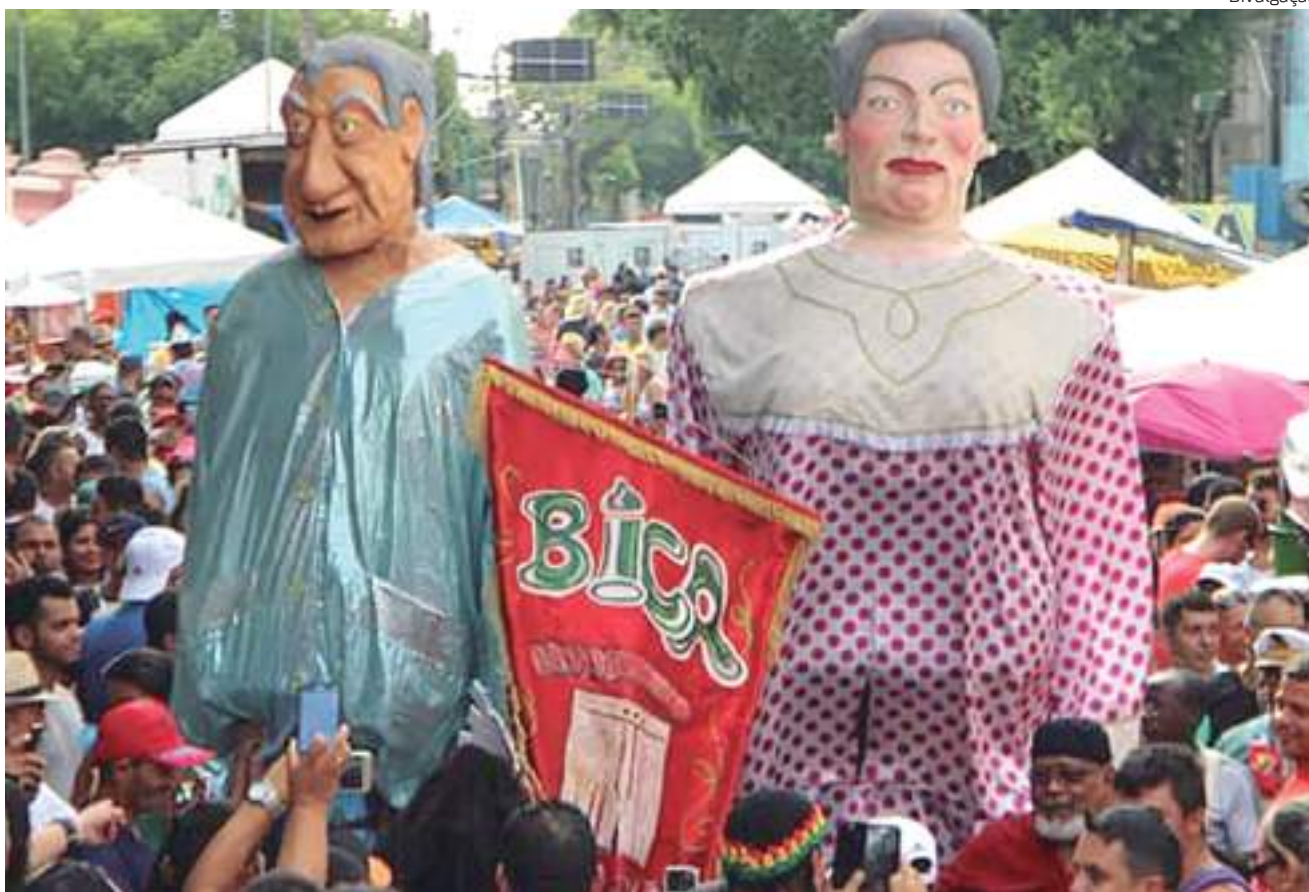
A Banda da Bica reúne vários foliões no Centro de Manaus

Outra opção é a Banda da Boulevard, que ocorrerá no Domingo Magro, dia 12 de fevereiro, a partir