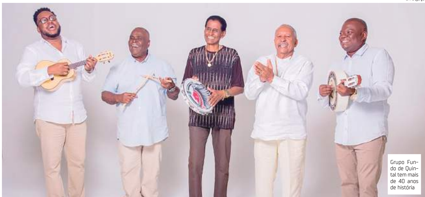
Grupo Fundo de Quintal tem mais de 40 anos de história

“Não tenho dúvida de que esse será o melhor Carnachoeira de todos os tempos, porque os mais diversos