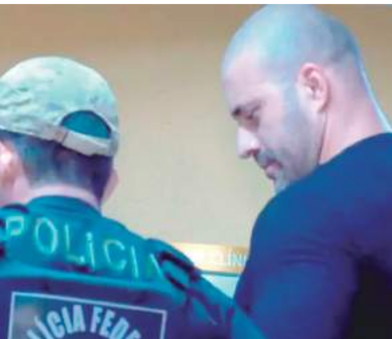
O ex-parlamentar foi detido por agentes da Polícia Federal em sua casa

O passaporte do ex-parlamentar também foi apreendido e cancelado, e a justiça determinou, ainda, a suspensão dos seus registros de armamento e portes de arma de fogo.