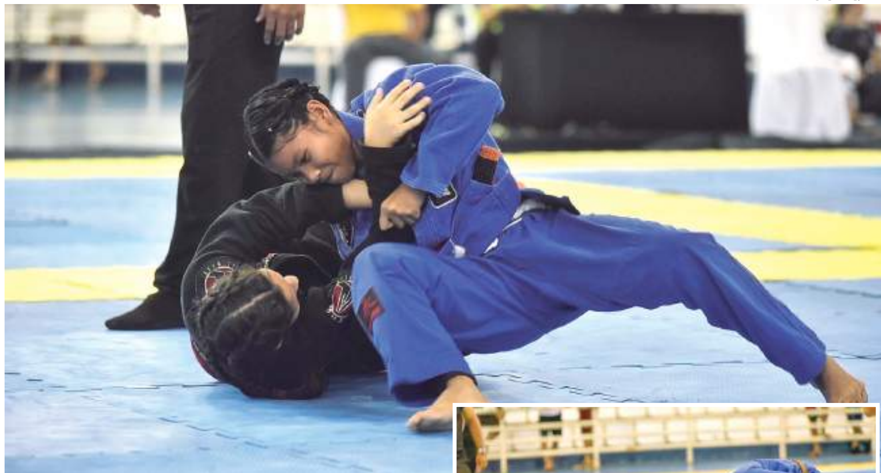
Atletas de jiu-jitsu competindo

“Teremos atletas de Manaus, Manacapuru, Rio Preto da Eva, Coarí, e é de suma importância a integração entre esses atletas, porque entendemos o quanto o jiu-jitsu é um esporte de inclusão social. Durante todo o evento estaremos avaliando to-