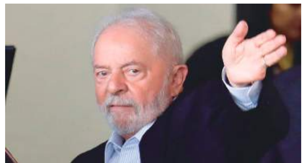
Presidente condicionou possível candidatura a seu estado de saúde em 2026

Na extrema direita, alguns pré-candidatos despontam e podem fazer sombra a Bolsonaro. Como a ex-primeira-dama Michelle Bolsonaro, que o PL ventila como uma opção caso o ex-presidente seja de alguma forma impedido de tentar a volta ao Planalto. Outro que é considerado um nome em potencial para a disputa pela Presidência é o governador de São Paulo, Tarcísio Gomes de Freitas – que paulatinamente se afasta do bolsonarismo e tenta se firmar como um nome da direita compromissada com a democracia.