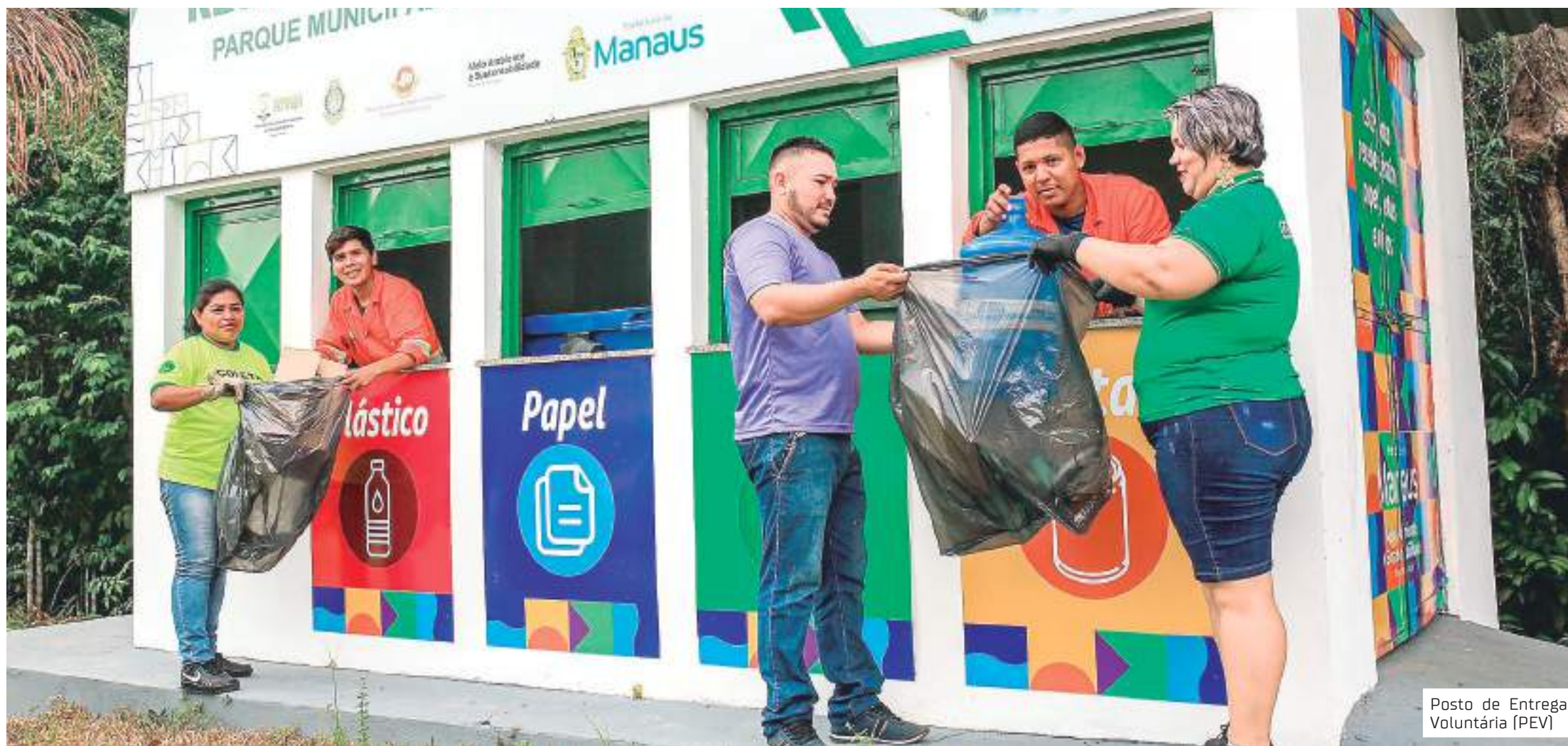
Posto de Entrega Voluntária (PEV)

Projeto pretende reduzir resíduos que vão parar no Aterro Sanitário