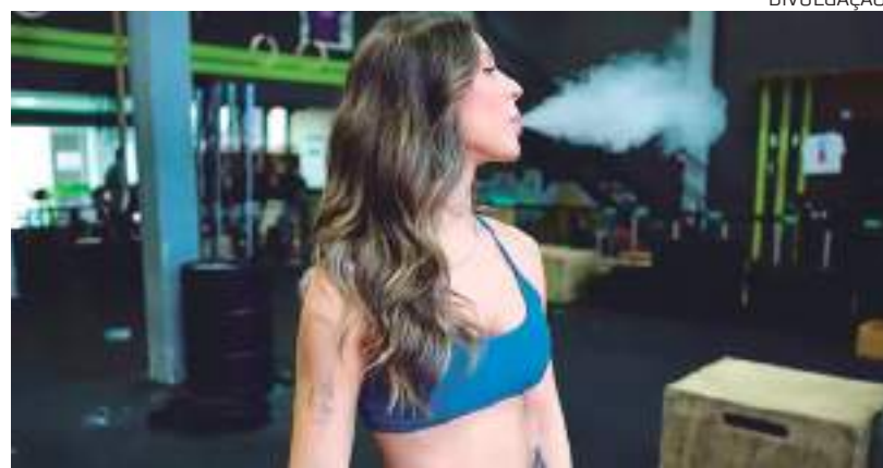
Mulher consome suposto cigarro eletrônico vitamínico

O cigarro eletrônico divulgado é chamado “power”, que ofereceria a “energia necessária para realizar as mais variadas tarefas”, além de garantir alta performance e dias mais