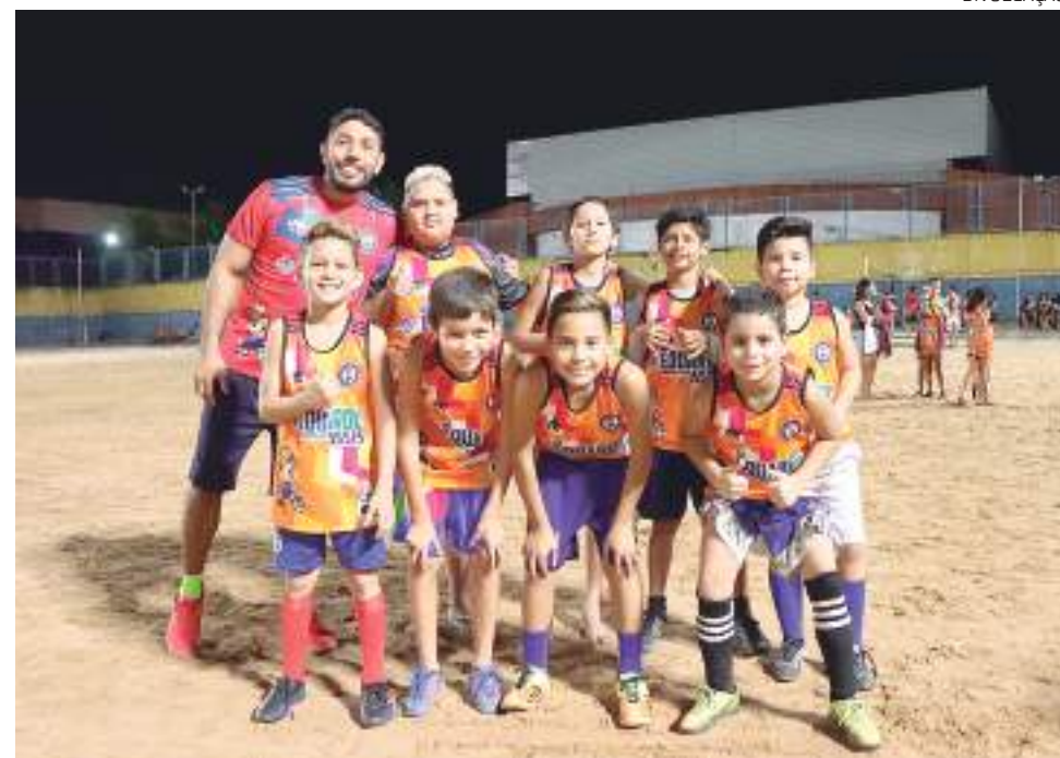
Time formado no projeto 'Revelando para o futuro'