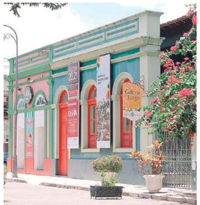
Prédios no largo São Sebastião, um dos principais pontos turísticos da cidade

Os técnicos estão dialogando e trocando experiências. A expertise do Iphan será repassada ao Implurb e vice-versa. O Implurb e Iphan desenvolvem ações em conjunto desde o início da gestão do prefeito David Almeida. A área de tombamento do centro histórico de Manaus é protegida nacionalmente desde 2012.