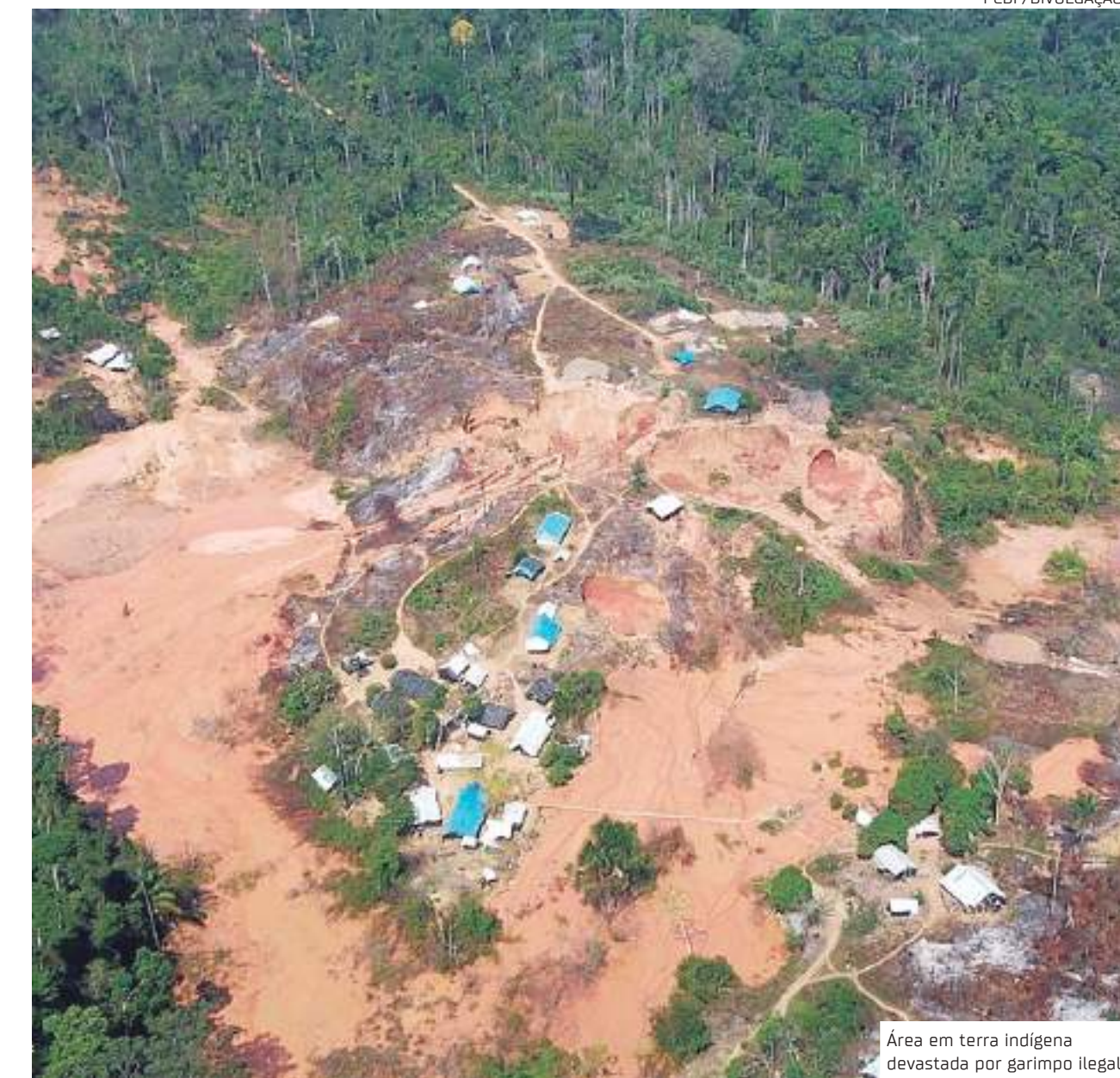
Área em terra indígena devastada por garimpo ilegal

A pesquisa destaca ainda que, em terras indígenas da Amazônia Legal, os garimpeiros buscam