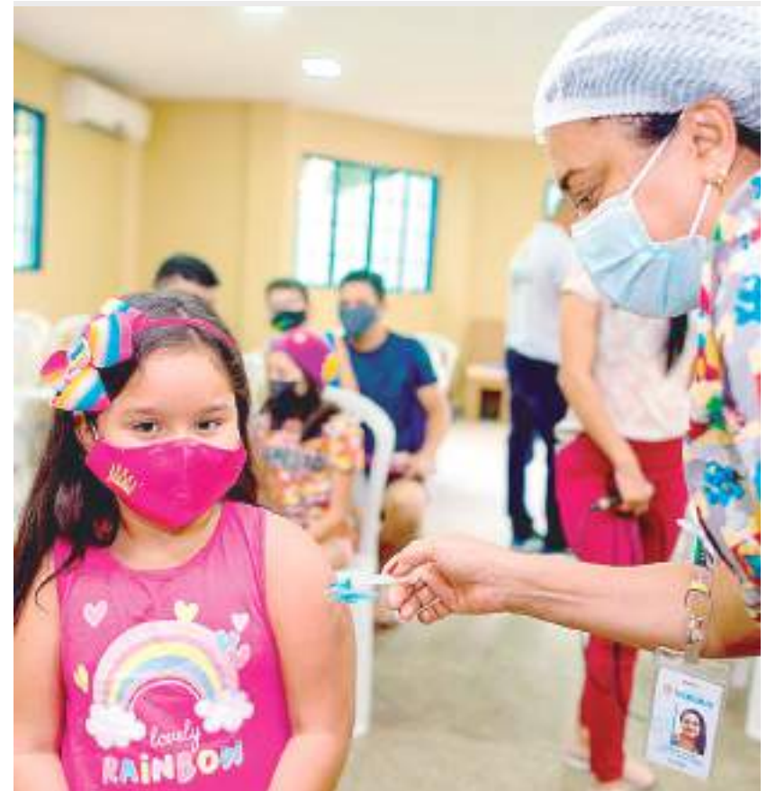
Prefeitura de Manaus volta a ofertar a Pfizer para crianças de 5 a 11 anos neste sábado (4)

No caso dos bebês de 6 meses a menores de 3 anos (2 anos, 11 meses e 29 dias), a vacinação é concentrada em quatro unidades de saúde.