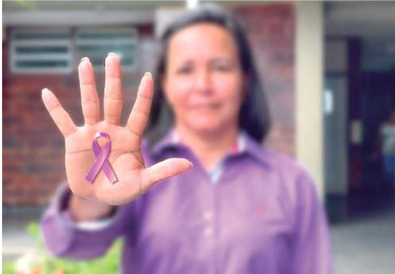
Mulher mostra símbolo da campanha 'Fevereiro Roxo' na mão

"Na fibromialgia os sinais, geralmente em mulheres acima de 25 anos, são dores musculares intensas, dor de cabeça, insônia e sono, ou seja, a pessoa dorme por muitas horas, mas não consegue descansar. As pessoas têm dor com situações comuns do dia. Já os sintomas do lúpus são bem diversificados, queda de cabelo, o cabelo fica bem fininho, manchas avermelhadas no rosto, artrite, dor articular, alteração renal, a urina fica espumosa, fadiga, pode dar febre baixa, perda de peso, íngua, pode ter íngua cervical, axilar",