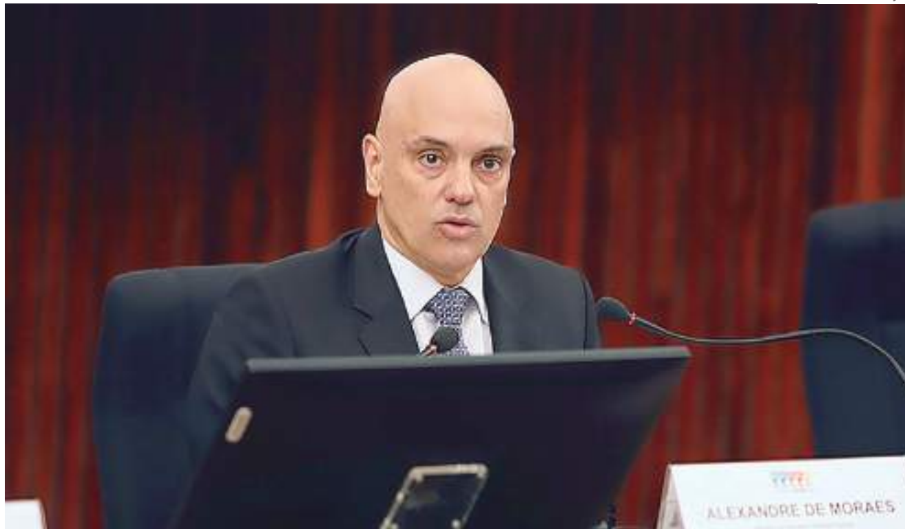
Moraes e Do Val discordam de versão sobre encontro que tratou da denúncia de tentativa de golpe

"A ideia genial que tiveram foi colocar uma escuta no senador para que o senador, que não tem nenhuma intimidade comigo – conversei