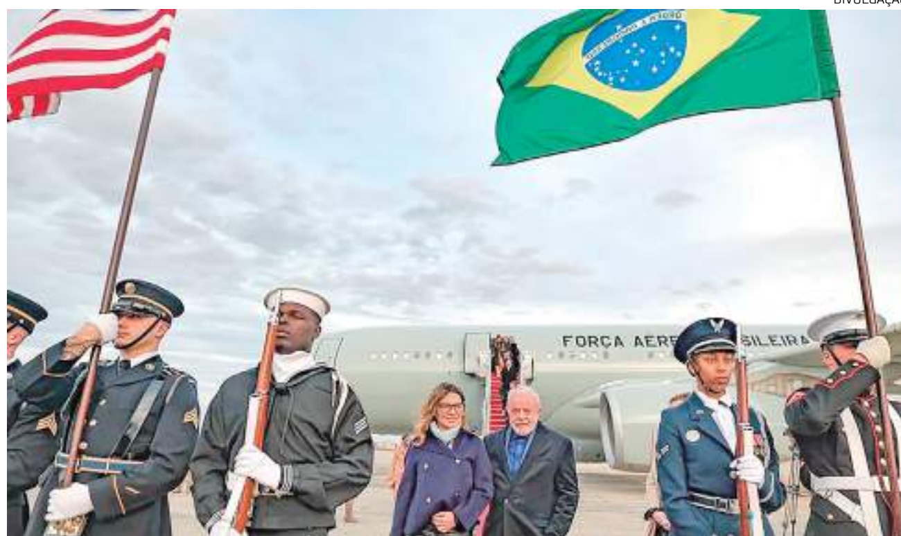
Lula chegou aos Estados Unidos na companhia da primeira dama, Janja

O presidente brasileiro será acompanhado dos ministros Mauro