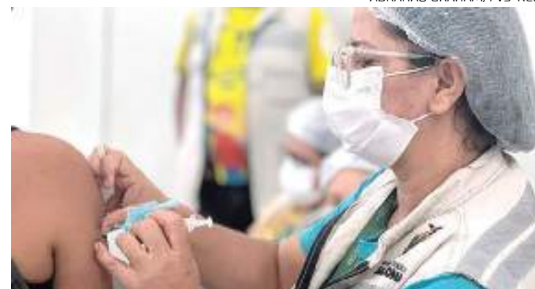
Jovem sendo vacinada por agente de saúde