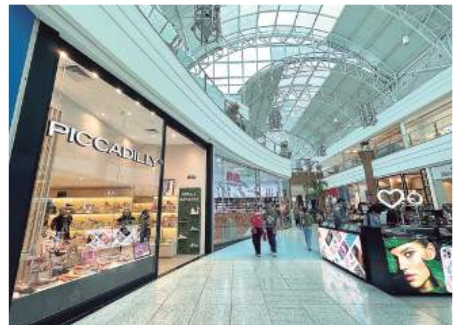
Pitaya no campo rural do Amazonas

A receita do varejo ampliado cresceu 12,6% no acumulado de 12 meses, 8,7% na comparação com dezembro de 2021 e 0,4% na passagem de novembro para dezembro.