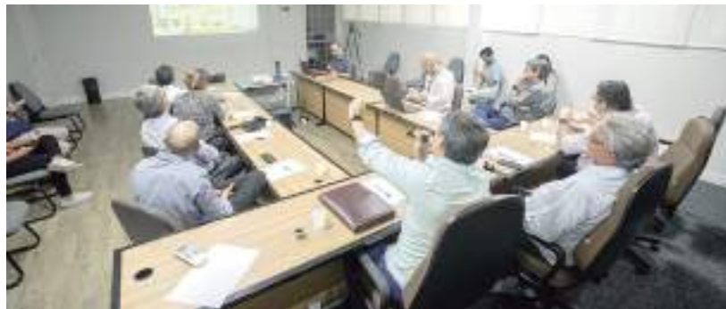
Equipes técnicas do Governo do Amazonas reunidas

O Cate é um grupo técnico criado em 2019 por determinação do governador Wilson Lima, para subsidiar o chefe do Executivo e os