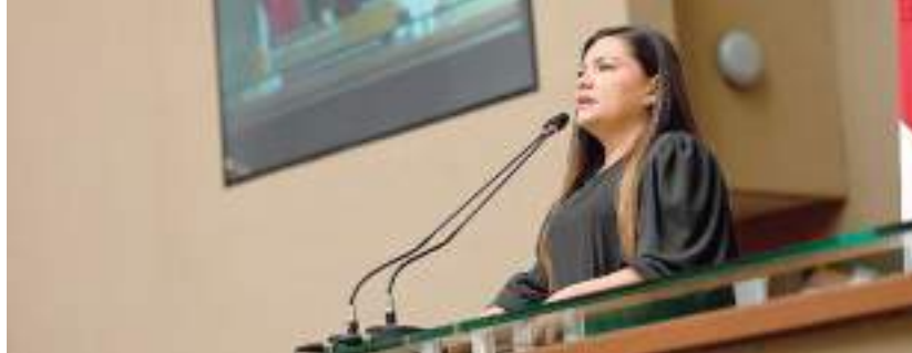
A pauta inclusiva é uma das principais defendidas pela deputada na Aleam

A justificativa do PL defende que é de competência da Aleam dispor sobre programas e planos estaduais, conforme a Constituição Estadual no Art. 27, VIII – planos e programas estaduais, regionais e setoriais de desenvolvimento. Em um primeiro momento, destaca-se a competência comum à proteção