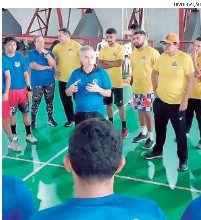
Reunião técnica de Handebol