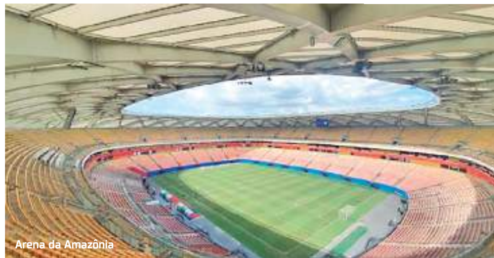
Arena da Amazônia