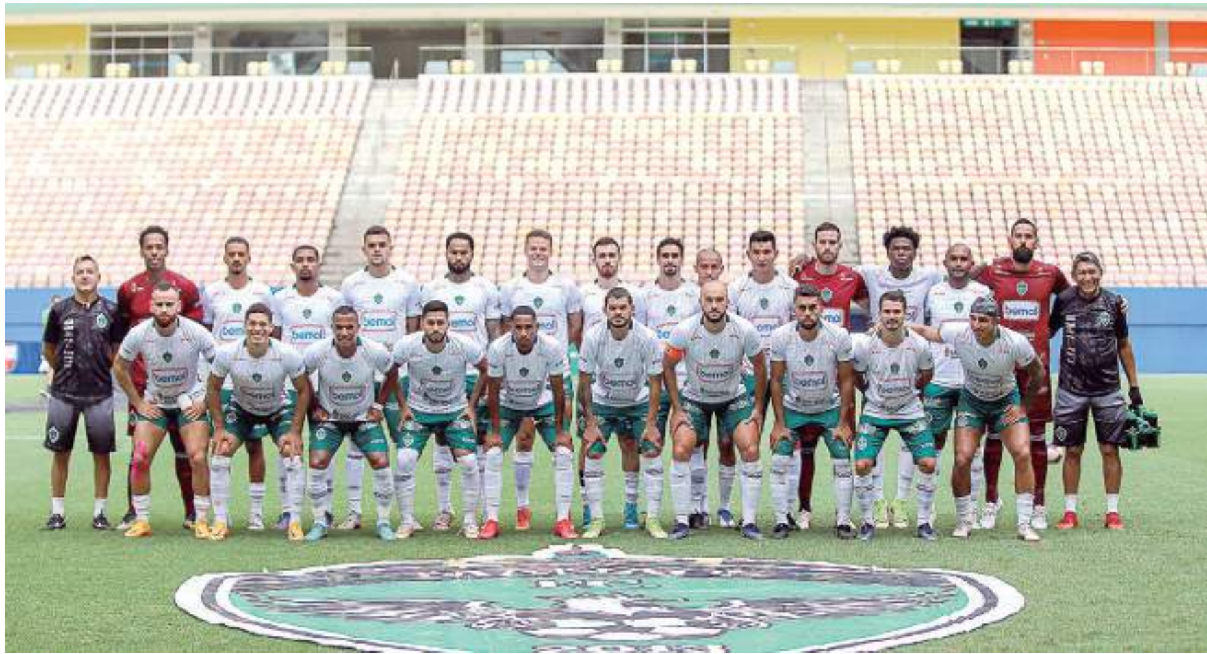
Time do Manaus FC antes de jogo pelo Campeonato Amazonense de Futebol

"Primeiro tempo difícil, a chuva atrapalhou. No segundo tempo fizemos o gol, colocamos a bola no chão e no gol que nos daria a vitória a árbitra (assistente) foi infeliz. Ela disse que houve participação do camisa 19, mas não tinha nenhum 19 no time naquele momento. Eu