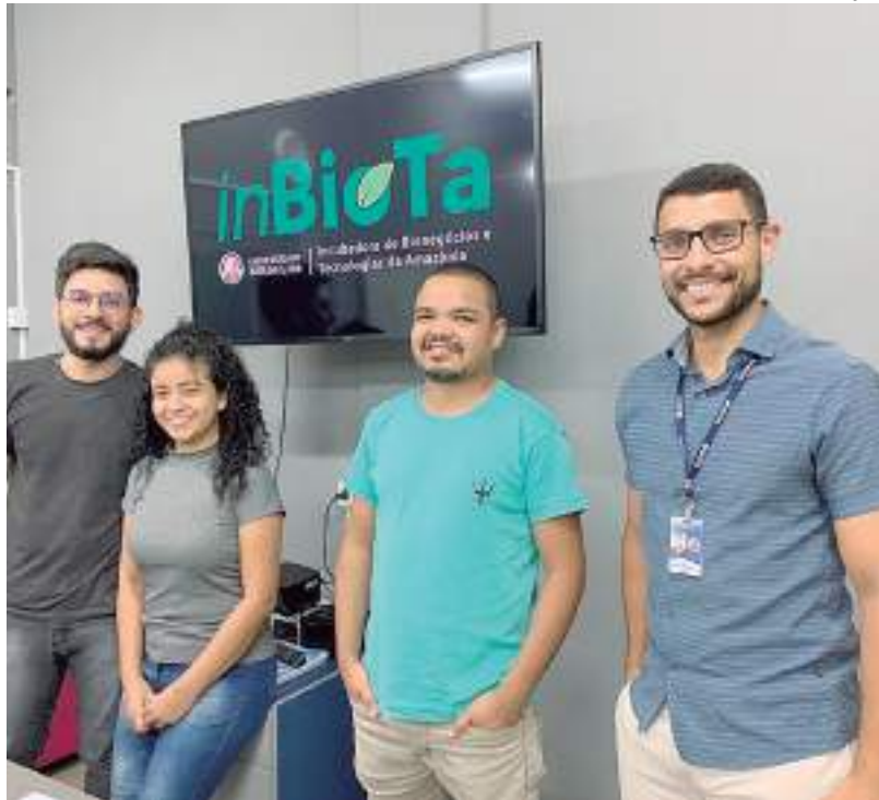
Organizadores do podcast inBioTa

tência e possui, atualmente, oito startups em seu portfólio, que desenvolvem projetos nas áreas de tecnologia, comunicação, sustentabilidade e bioeconomia. Além de pesquisas de produtos amazônicos para a fabricação de bioplásticos, cosméticos e alimentos.