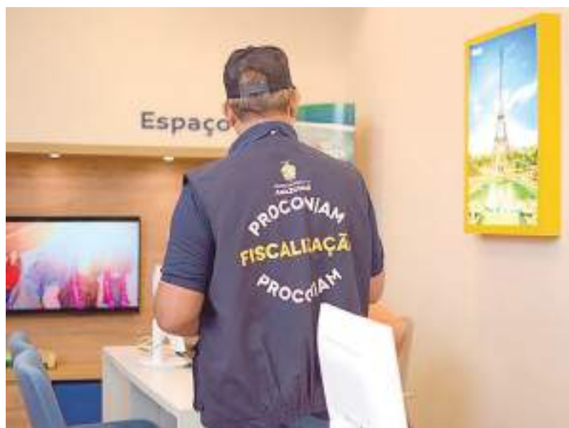
Agente fiscal do Procon AM inspecionando agência de viagem