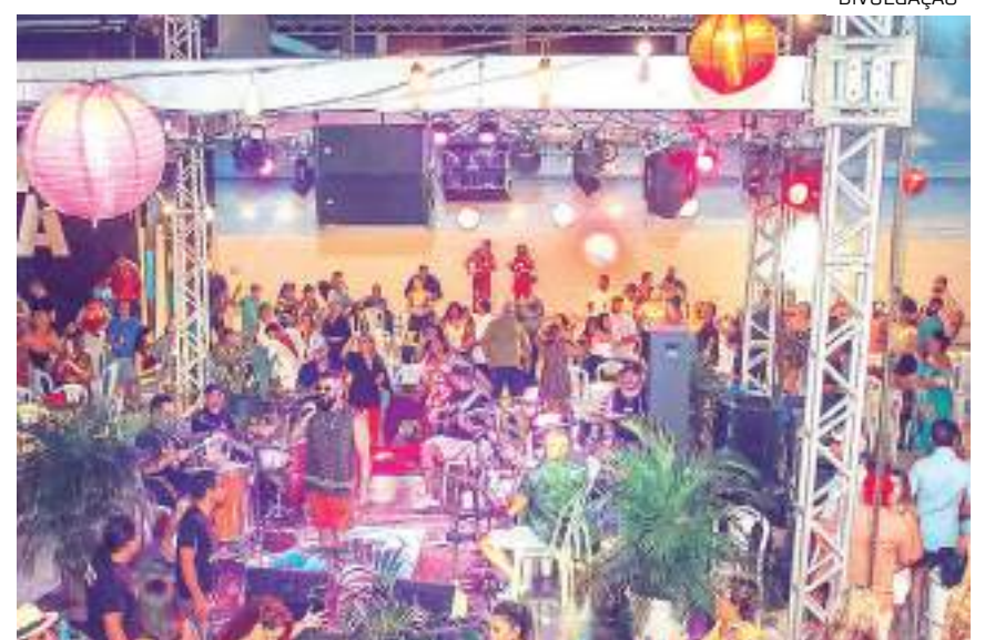
Evento no espaço Nossa Praia

Para maior conforto dos foliões, o evento é dividido em dois setores: Área vip - Mais Folia - pelo valor de R$100 -, e pista - Nossa Praia por R$60. Maiores informações, podem ser obtidas pelo fone (92) 98241-5741 ou pelo instagram nos perfis @showmixentretimento ou @terreirodogalo_