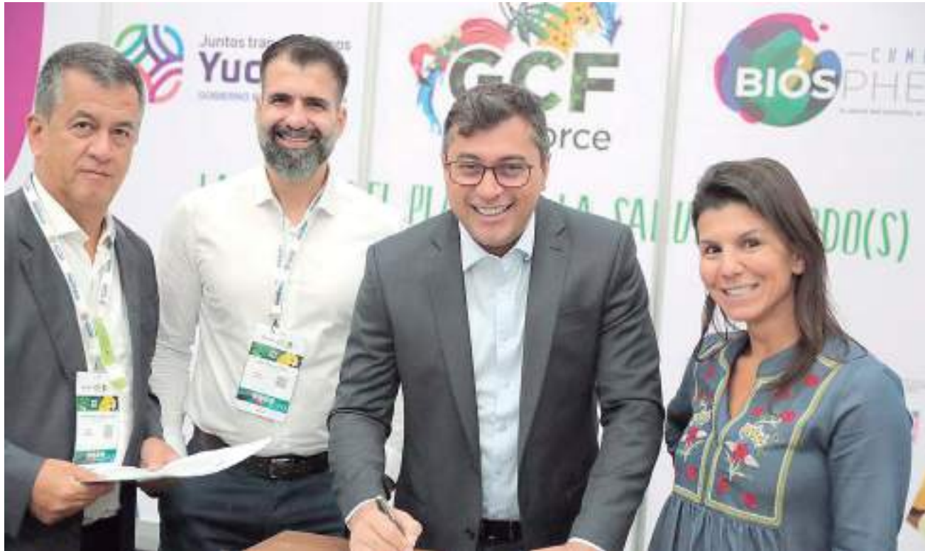
No evento, governador também reafirmou compromisso com bioeconomia

No documento, assinado também pelos demais membros da Força-Tarefa, os Estados se comprometem a encorajar investimentos e a criação de empregos associados ao desenvolvimento da bioeconomia, bem como a explorar mecanismos de financiamento para aumentar o diálogo nacional