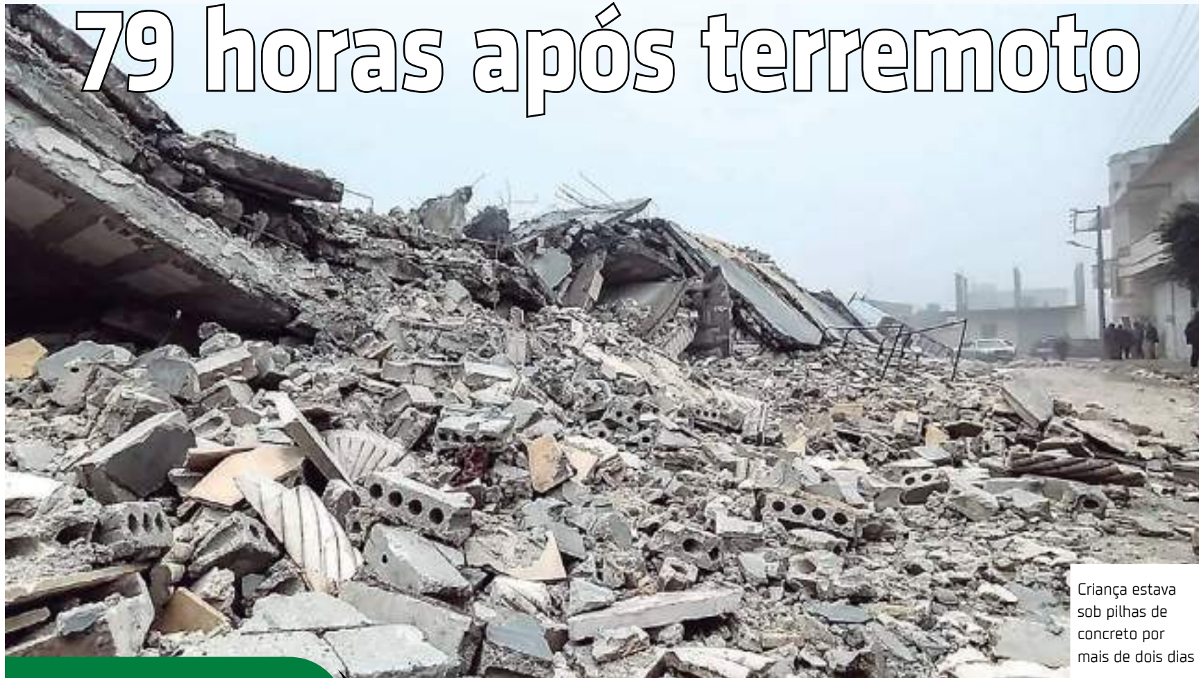
Criança estava sob pilhas de concreto por mais de dois dias

Menino de apenas 2 anos foi resgatado de destroços de prédio desabado