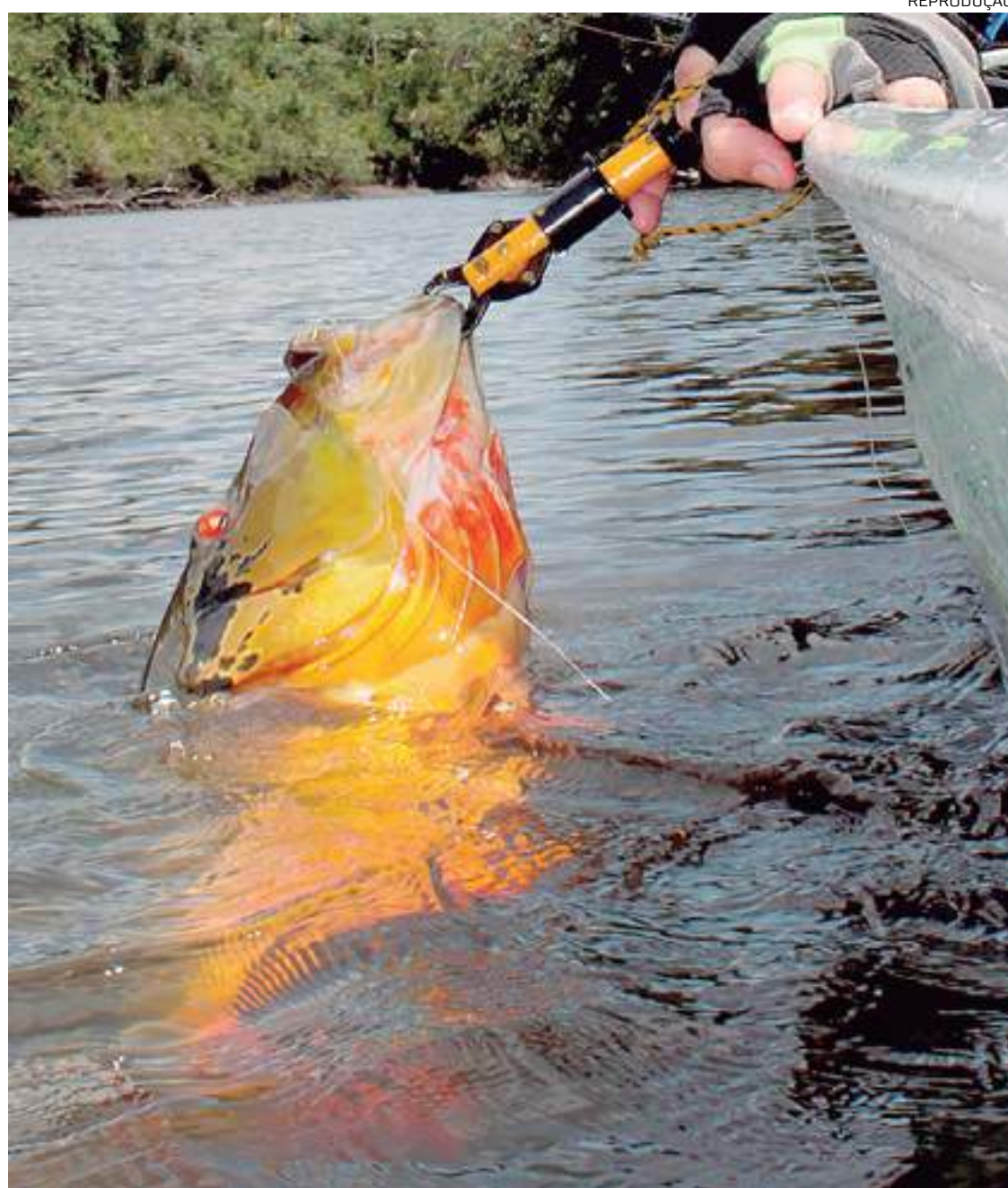
Tucunaré, um dos peixes mais cobiçados por pescadores esportivos no Amazonas

Empresas cadastradas no Cadastur contam com um importante certificado que serve para aproximar as empresas e turistas, encurtando a distância e aumentando a confiança de pessoas que estão longe dos destinos turísticos, mas interessados em viver experiências de qualidade.