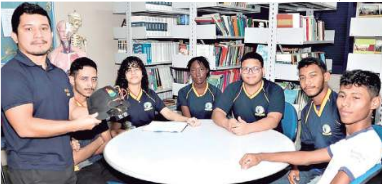
Professor e alunos responsáveis pela criação de boné