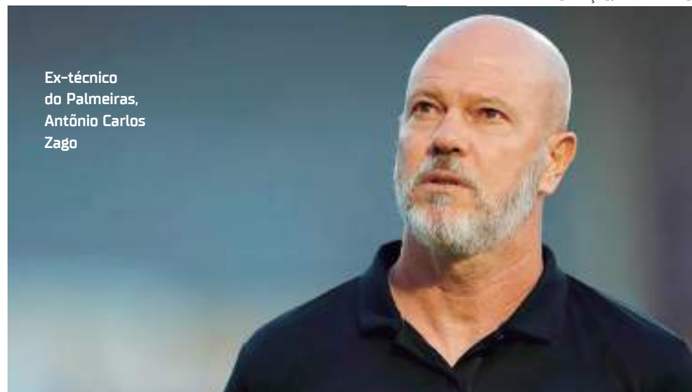
Ex-técnico do Palmeiras, Antônio Carlos Zago