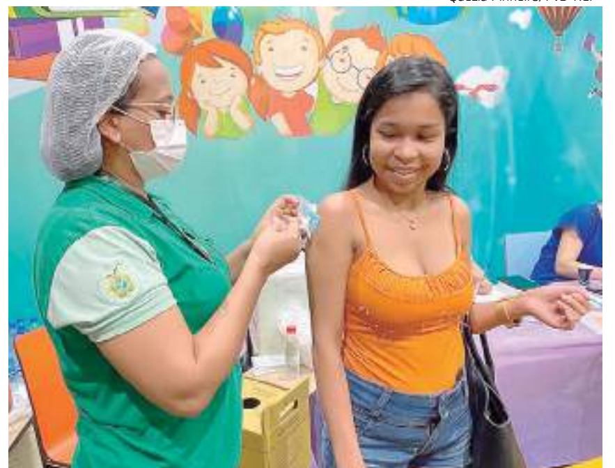
Jovem sendo vacinada em campanha de vacina contra a covid-19

Ao longo das quatro edições, a campanha "Vacine Já!" vacinou 5.124 pessoas - 2.276 na primeira edição, nos dias 13 e 14 de janeiro, em seis supermercados do Grupo DB em Manaus; 1.686 doses, em 20 e 21 de janeiro, no Shopping Manaus Via Norte e Sumaúma Park Shopping; e 1.162 doses, de 27 a 29 de janeiro, no Sumaúma Park Shopping.