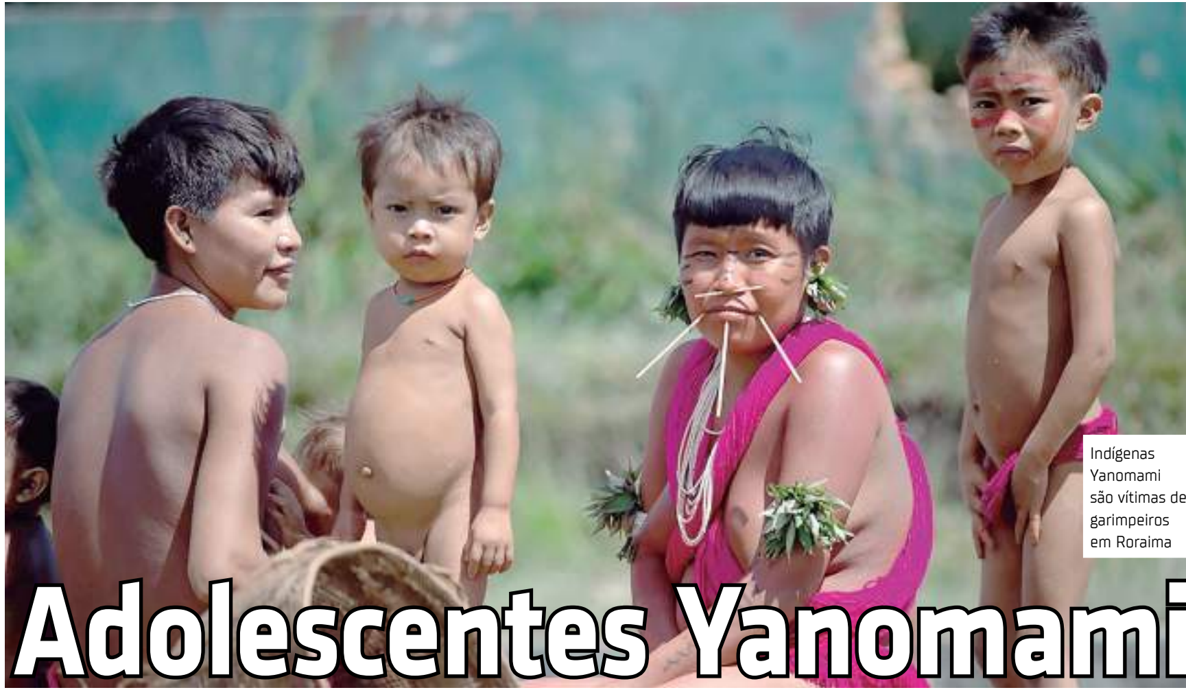
Indígenas Yanomami são vítimas de garimpeiros em Roraima