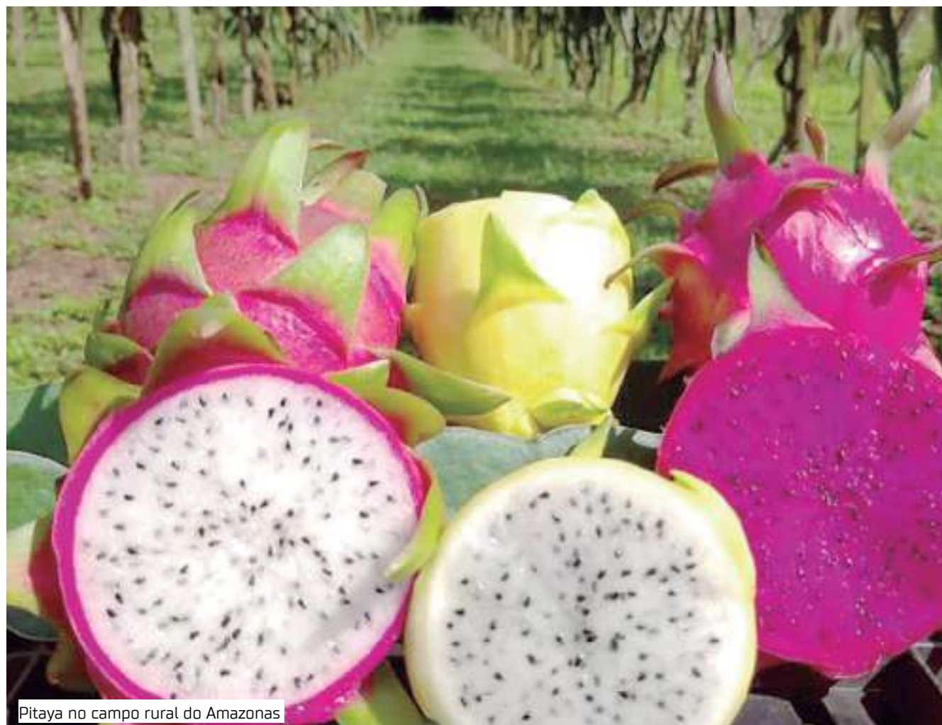
Pitaya no campo rural do Amazonas

O objetivo do PAF é garantir a segurança alimentar da parcela da população em vulnerabilidade social e promover o desenvolvimento da economia local com a aquisição de gêneros alimentícios (hortifruti e pescado).