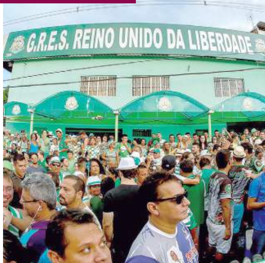
Fachada da sede do Grupo Especial Reino Unido da Liberdade

Outra dica é a Catedral The Rock Camping, que também fica localizada na comunidade São João do Urubuí, distante 14 quilômetros de Presidente Figueiredo. Entre as cachoeiras Cabeça da Perema e Princesinha, o empreendimento possui área de camping, redário, estacionamento próprio, cozinha compartilhada, churrasqueira e uma fogueira oferecendo uma experiência de relaxamento para o visitante.