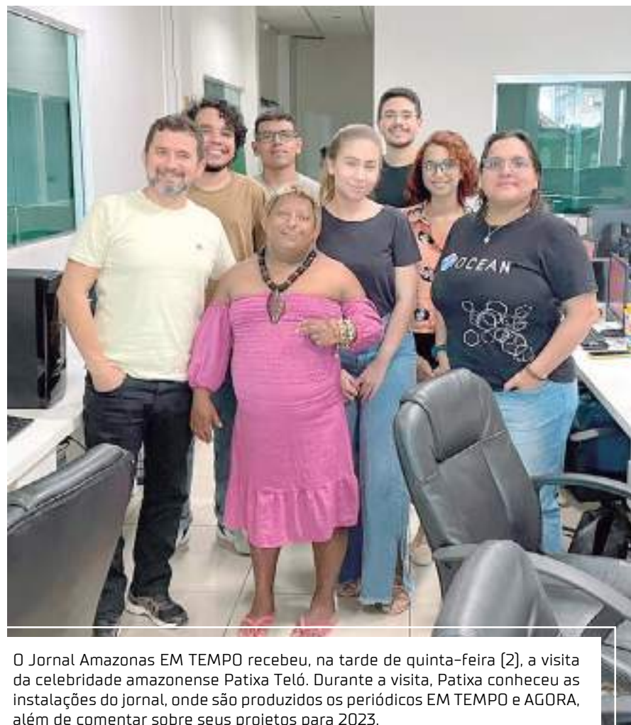
O Jornal Amazonas EM TEMPO recebeu, na tarde de quinta-feira (2), a visita da celebridade amazonense Patixa Teló. Durante a visita, Patixa conheceu as instalações do jornal, onde são produzidos os periódicos EM TEMPO e AGORA, além de comentar sobre seus projetos para 2023.

A Bica Privatizou o Carnaval. Apesar de o governo e prefeitura patrocinarem palco, iluminação, bandas e grupos musicais, a praça São Sebastião é fechada, e a direção do BAR DO ARMANDO vende os espaço para ambulantes. Pode isso?!