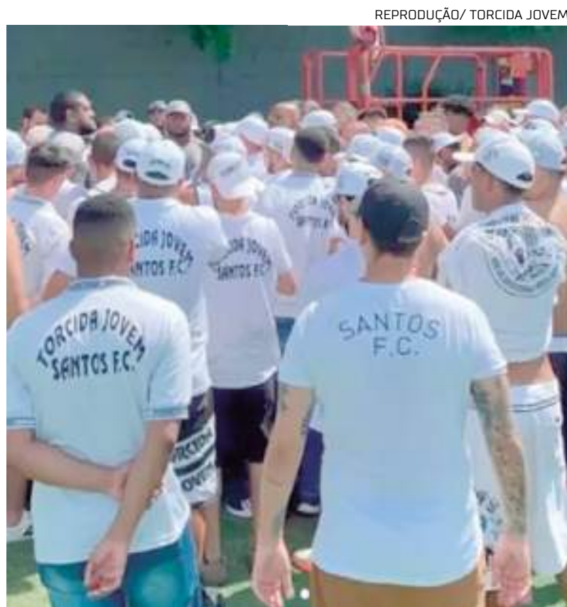
Torcida Jovem reunida no gramado do CT Pelé