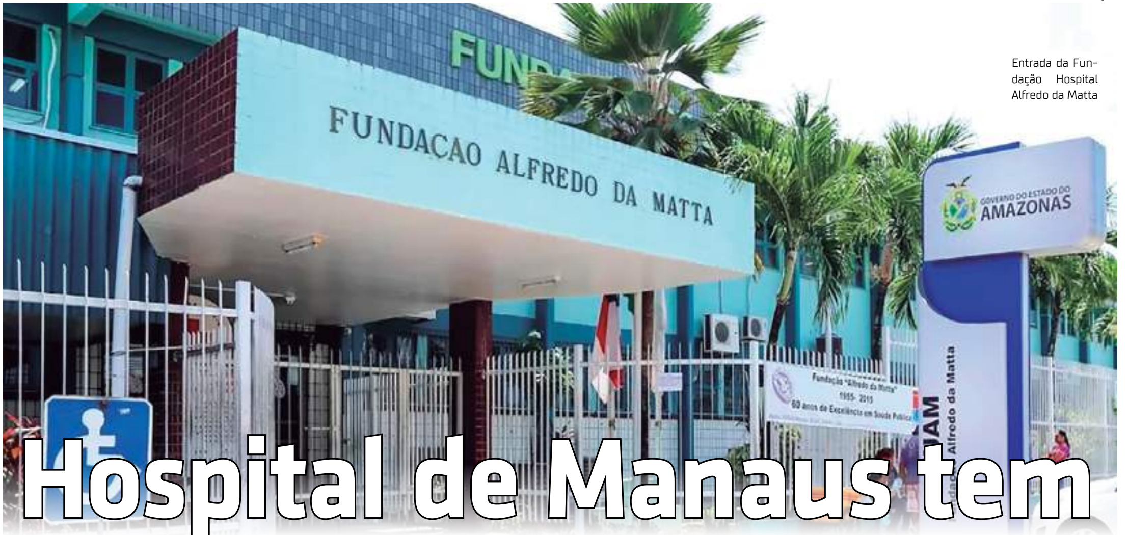
Entrada da Fundação Hospital Alfredo da Matta