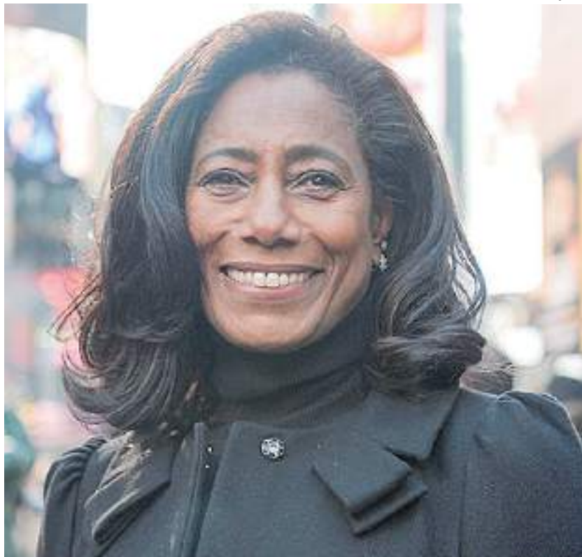
Jornalista e apresentadora da TV Globo, Glória Maria

Fez entrevistas com diversos chefes de Estado - inclusive contava que o ditador militar João Figueiredo a tinha como desafeto