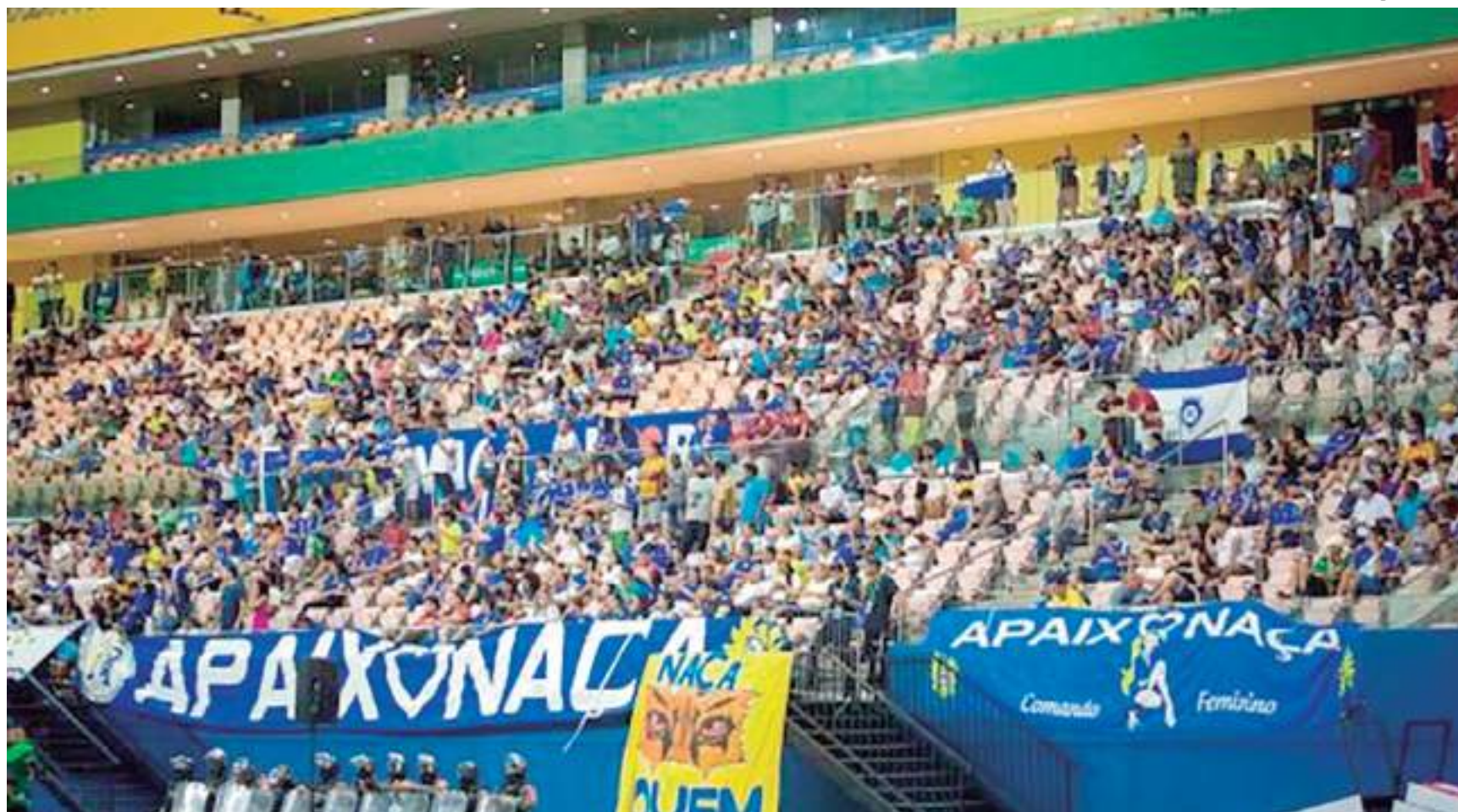
Torcedores acompanhando o Barezão

Durante os oito jogos realizados nas duas rodadas do Barezão em 2023, o público total foi de 5.682, uma média de 710,25 por jogo e renda de R$ 78.085,00, com média de R$ 9.760,62 por partida. Um percentual de crescimento de público de 312,19% e aumento de renda de 503,35%.