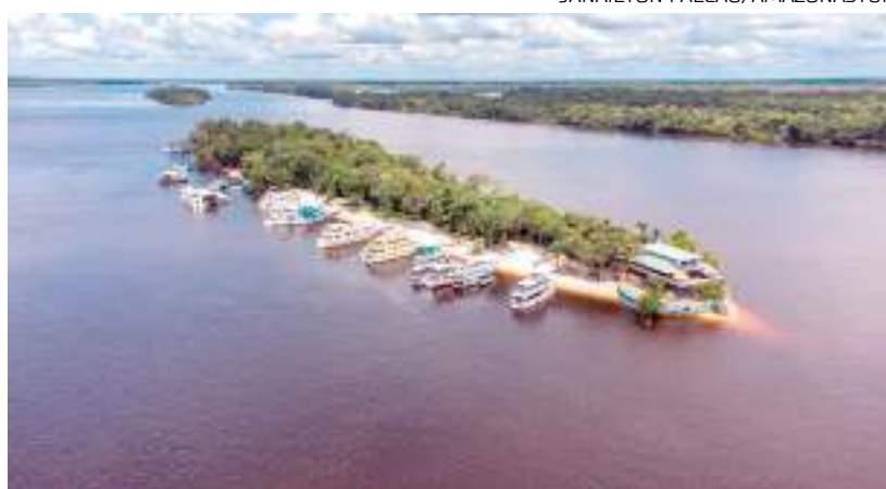
Ilha amazônica com barcos ancorados

"O segmento náutico no nosso Estado é um importante setor da nossa economia que move desde grandes empresas de cruzeiros internacionais, até os barqueiros do interior. Nossa intenção de realizar a Barco Show no Amazonas é dar visibilidade ao nosso turismo náutico, que é tão singular", disse.