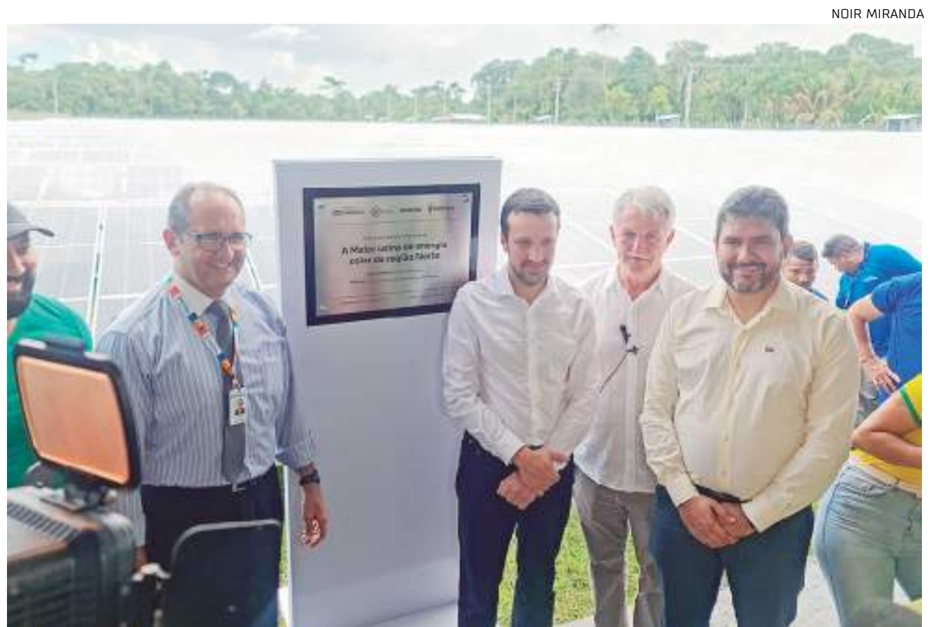
Placa de inauguração da maior usina solar da Região Norte

A usina produzirá 2,5 megawatts de volume energético, colaborando para uma cidade mais sustentável. O sistema capta a energia solar através das placas fotovoltaicas e passa por um inversor solar, que joga a energia na rede da distribuidora Amazonas Energia. Pela legislação, a Água de Manaus é beneficiada com a compensação da energia solar gerada.