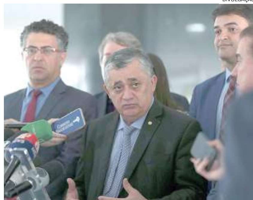
Deputado conversou com jornalistas após reunião com o presidente Lula

Nesta quinta-feira, Lula recebeu Guimarães e mais 13 dos 15 vice-líderes do governo na Câmara, escolhidos entre os partidos da base aliada. De acordo com o deputado, o encontro foi de aproximação e diálogo com o presidente, "que será permanente". "É isso que faz fluir e os vice-líderes exercerem protagonismo nas matérias importantes para o governo e o país", disse Guimarães.