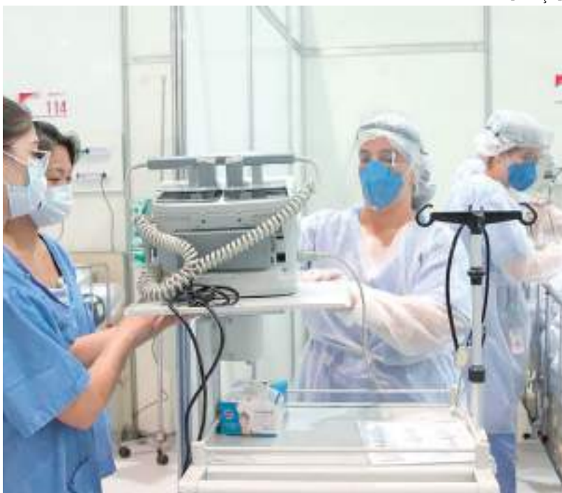
Profissionais de enfermagem atuando em sala de Unidade de Terapia Intensiva

O pagamento do piso em todo o Brasil ainda está sendo discutido