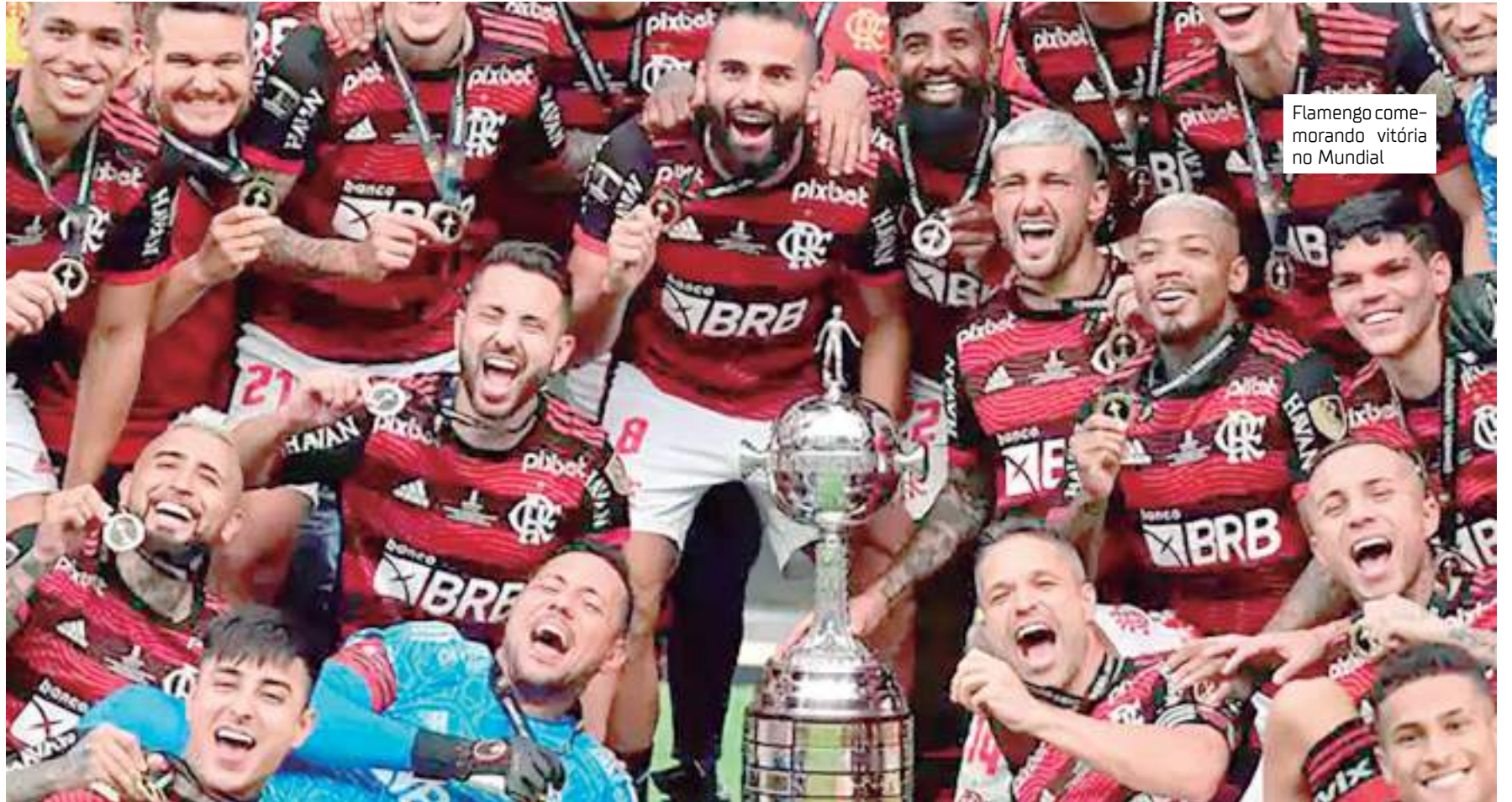
Flamengo comemorando vitória no Mundial

Torcedores do Flamengo acompanharam a saída do ônibus do Flamengo do Ninho do Urubu. Em clima de festa, rubro-negros provocaram o Real Madrid a todo o momento, cantando em alto e bom tom "Real Madrid, pode esperar! O Gabigol vai te pegar!".