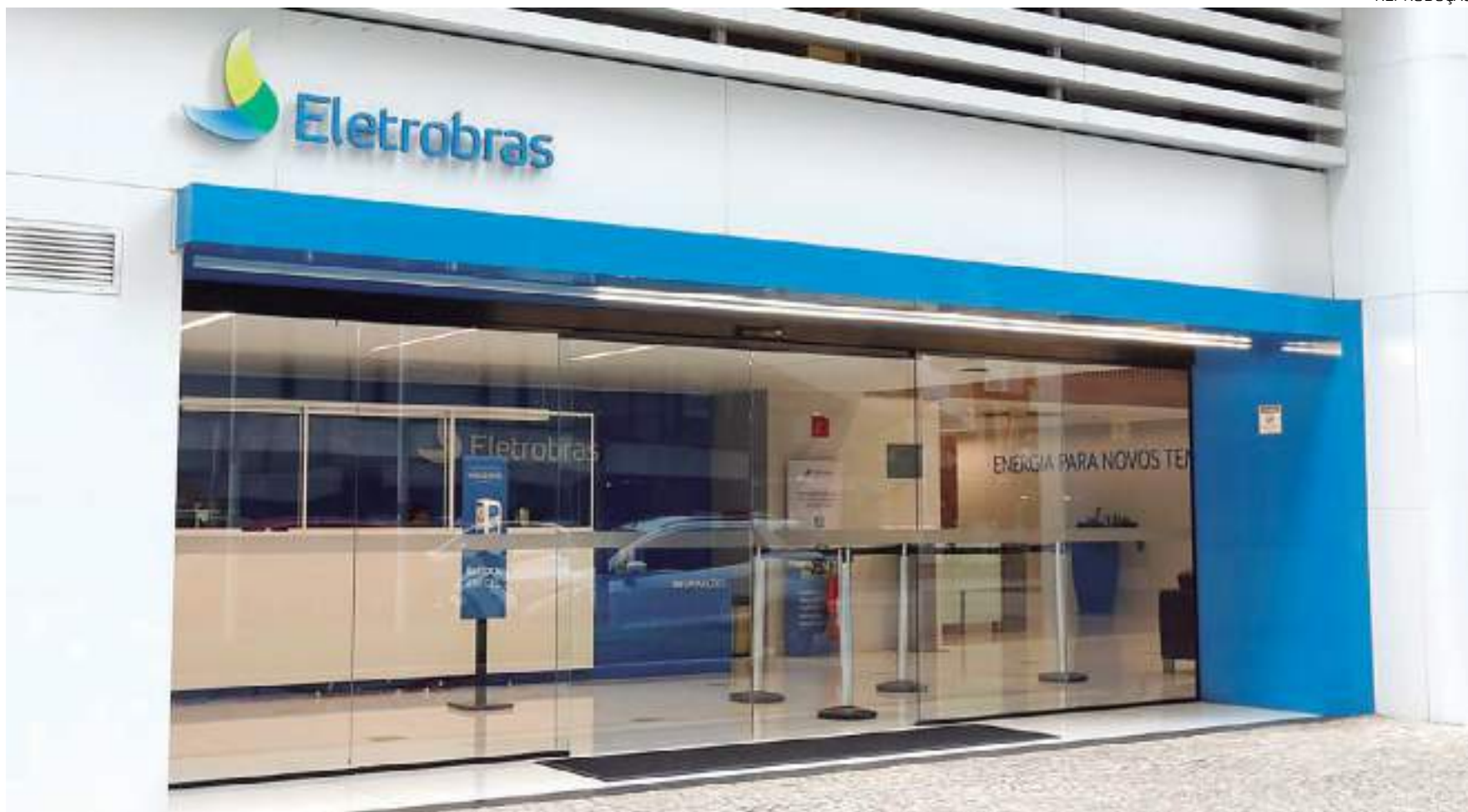
Fachada do prédio da sede da Eletrobras