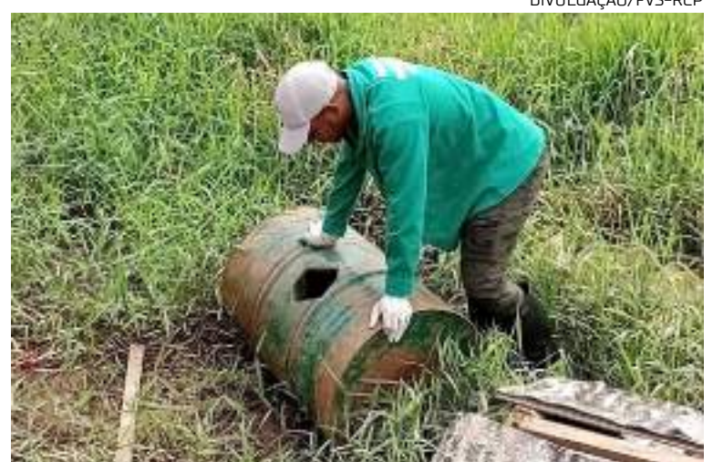
Agente verificando barril em busca de foco da dengue