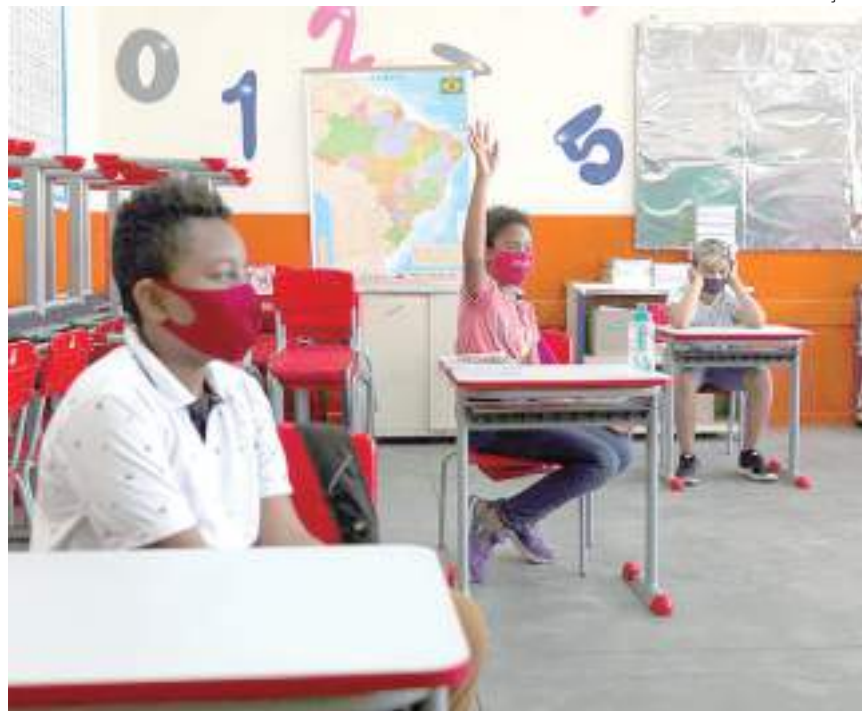
Escolas já podem inscrever alunos para a Olimpíada de Matemática

No regulamento, os representantes das escolas vão encontrar informações sobre condições, prazos, datas e regras previstas para participação na olimpíada. O regulamento pode ser encontrado no site do IMPA.