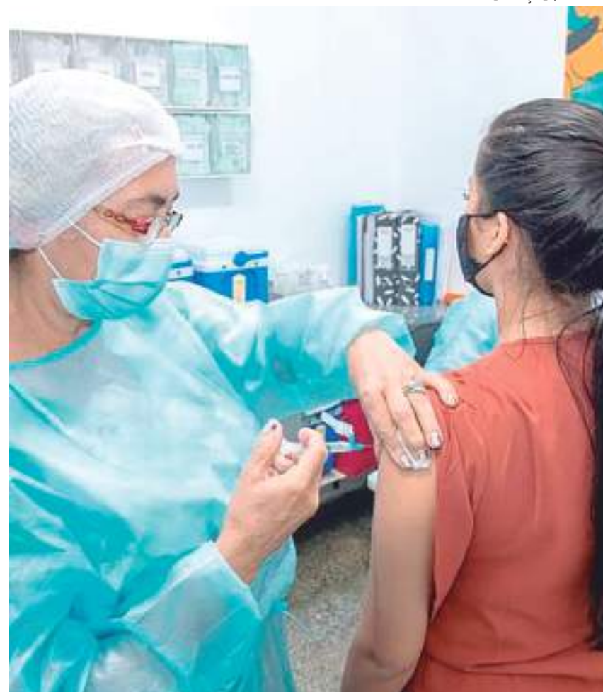
Enfermeira aplicando vacina contra a Covid-19 em jovem