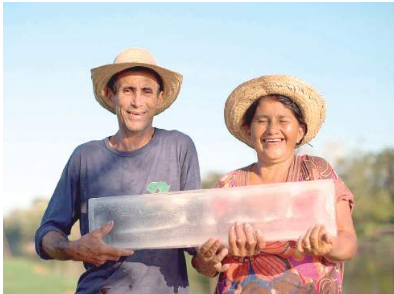
Homem e mulher seguram bloco de gelo e sorriem

Buscando mudar essa realidade, desde agosto de 2015, o Instituto Mamirauá vem tes-