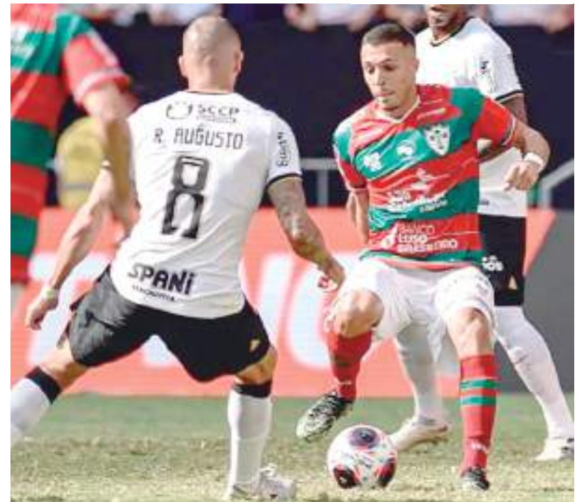
Jogadores do Corinthians e Portuguesa em jogo