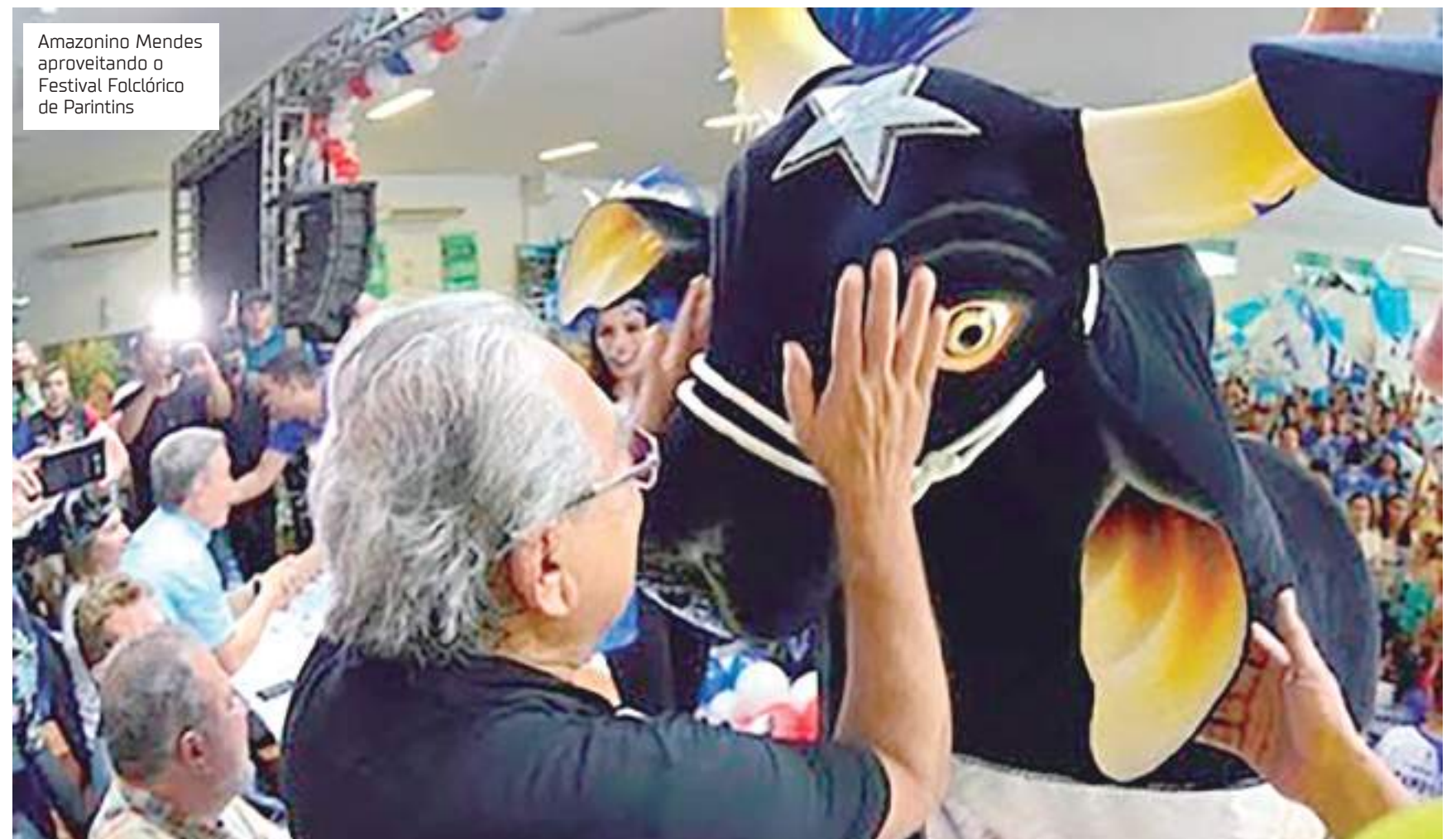
Amazonino Mendes aproveitando o Festival Folclórico de Parintins