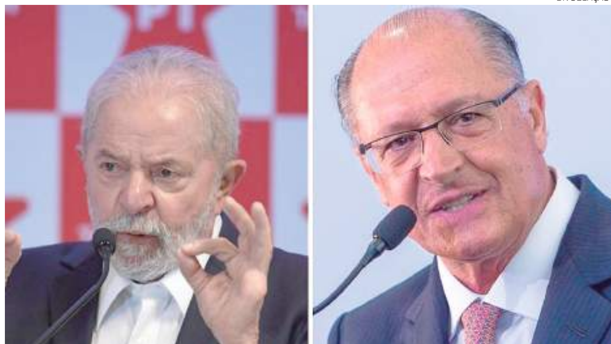
O presidente Lula e o vice-presidente Alckmin enfatizaram o talento político de Amazonino Mendes

Em suas redes sociais, o vice-presidente da República, Geraldo Alckmin (PSB), também lamentou a