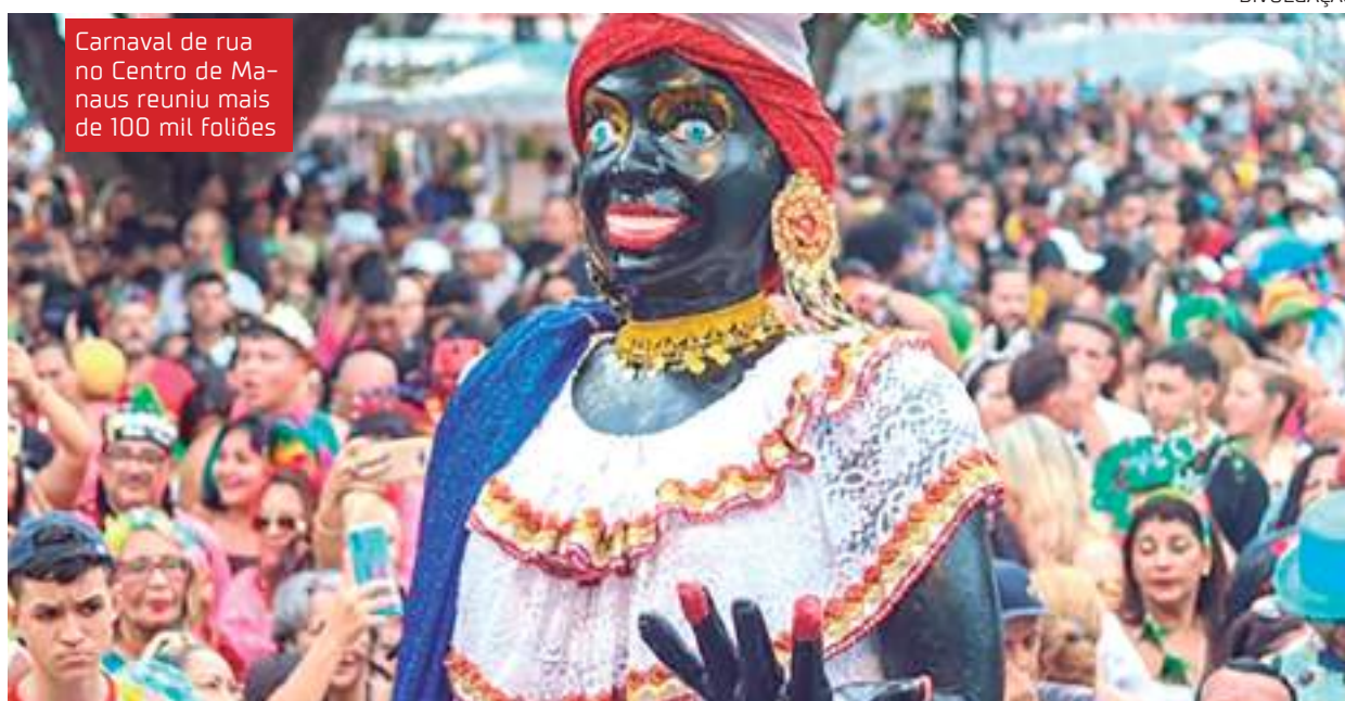
Carnaval de rua no Centro de Manaus reuniu mais de 100 mil foliões

"Estou muito feliz, porque estou de volta à minha querida cidade, que sabe fazer bonito quando se trata de carnaval de rua! Eu já brinco de Bica há mais de dez anos! Tradição é tra-