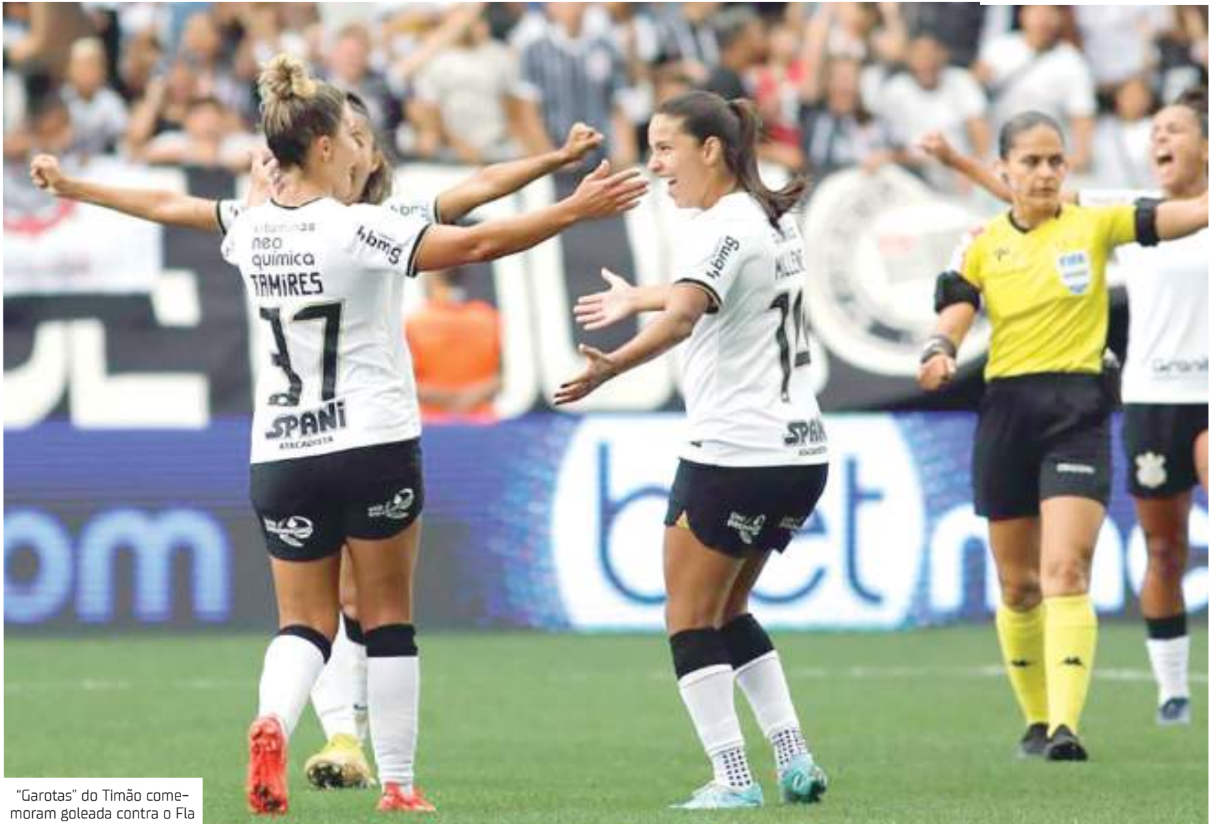
"Garotas" do Timão comemoram goleada contra o Fla