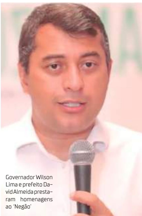
Governador Wilson Lima e prefeito David Almeida prestaram homenagens ao 'Negão'

As figuras máximas do Executivo estadual e do municipal decretaram luto oficial pela morte do ex-governador Amazonino Mendes, ocorrida neste domingo (12).