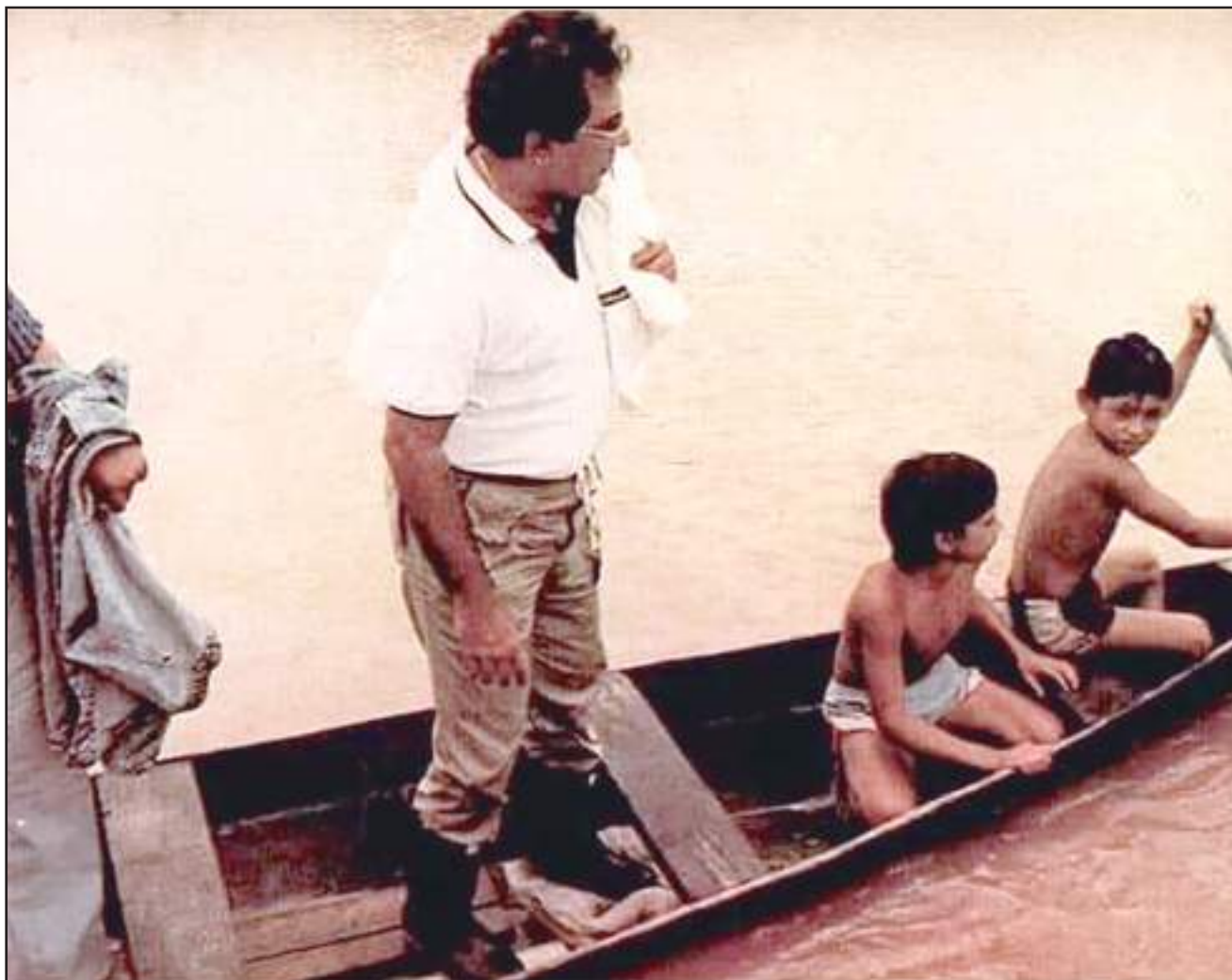
Amazonino Mendes era natural de Eirunepé e seus mandatos como governador contribuíram para o avanço do interior

ditadura, com o discurso mais à esquerda. Depois passa por vários partidos, sempre sendo um protagonista, quase que o dono do partido, como é muito comum nas lideranças políticas daqui do país", explicou.