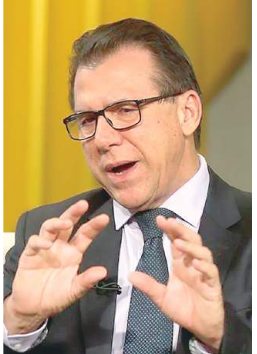
O ministro do Trabalho e Emprego, Luiz Marinho, entrevistado do Brasil em Pauta