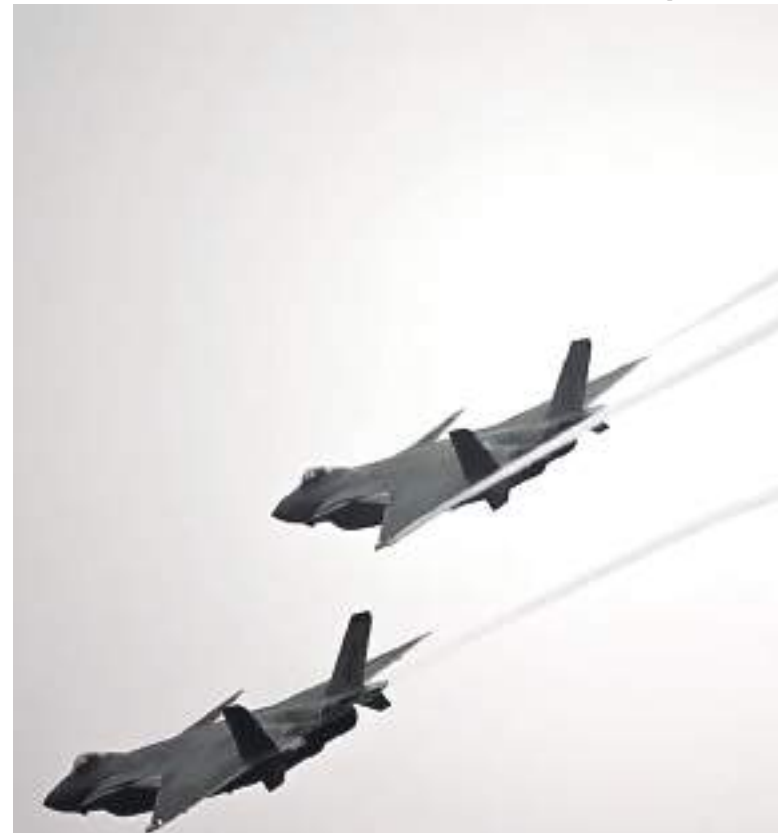
Caças chineses responsáveis por perseguir objeto voador não identificado

Um caça americano derrubou o objeto sobre o Atlântico no dia 4. O dispositivo chegou a atravessar grande parte dos EUA, incluindo áreas onde o país armazena mísseis nucleares em silos subterrâneos e bases de bombardeiros estratégicos.