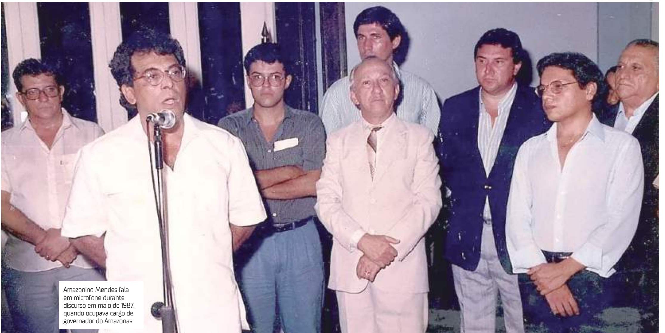
Amazonino Mendes fala em microfone durante discurso em maio de 1987, quando ocupava cargo de governador do Amazonas