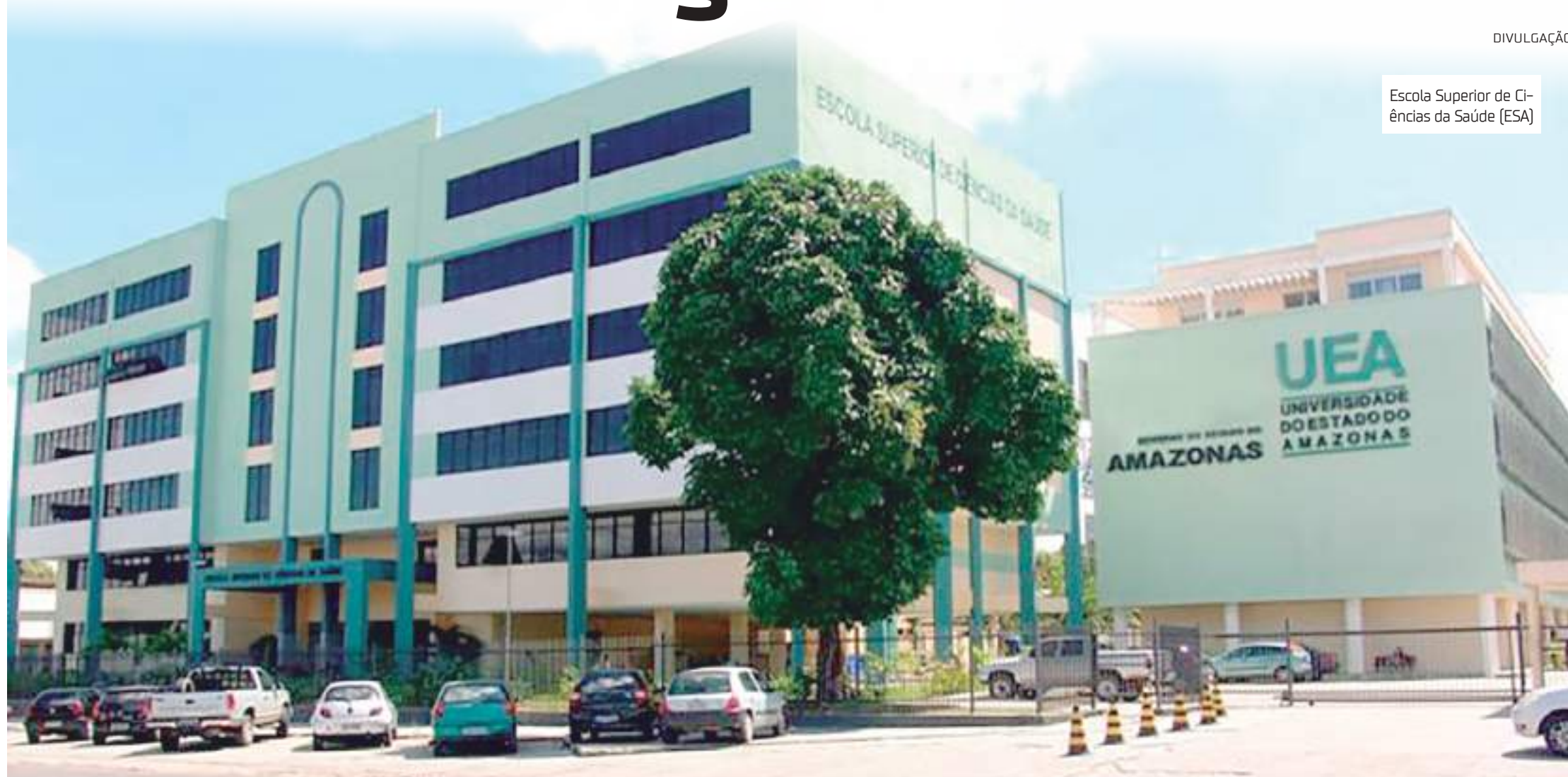
Escola Superior de Ciências da Saúde (ESA)

Em nota oficial, a UEA lamentou a morte de Amazonino e agradeceu a contribuição feita pelo político