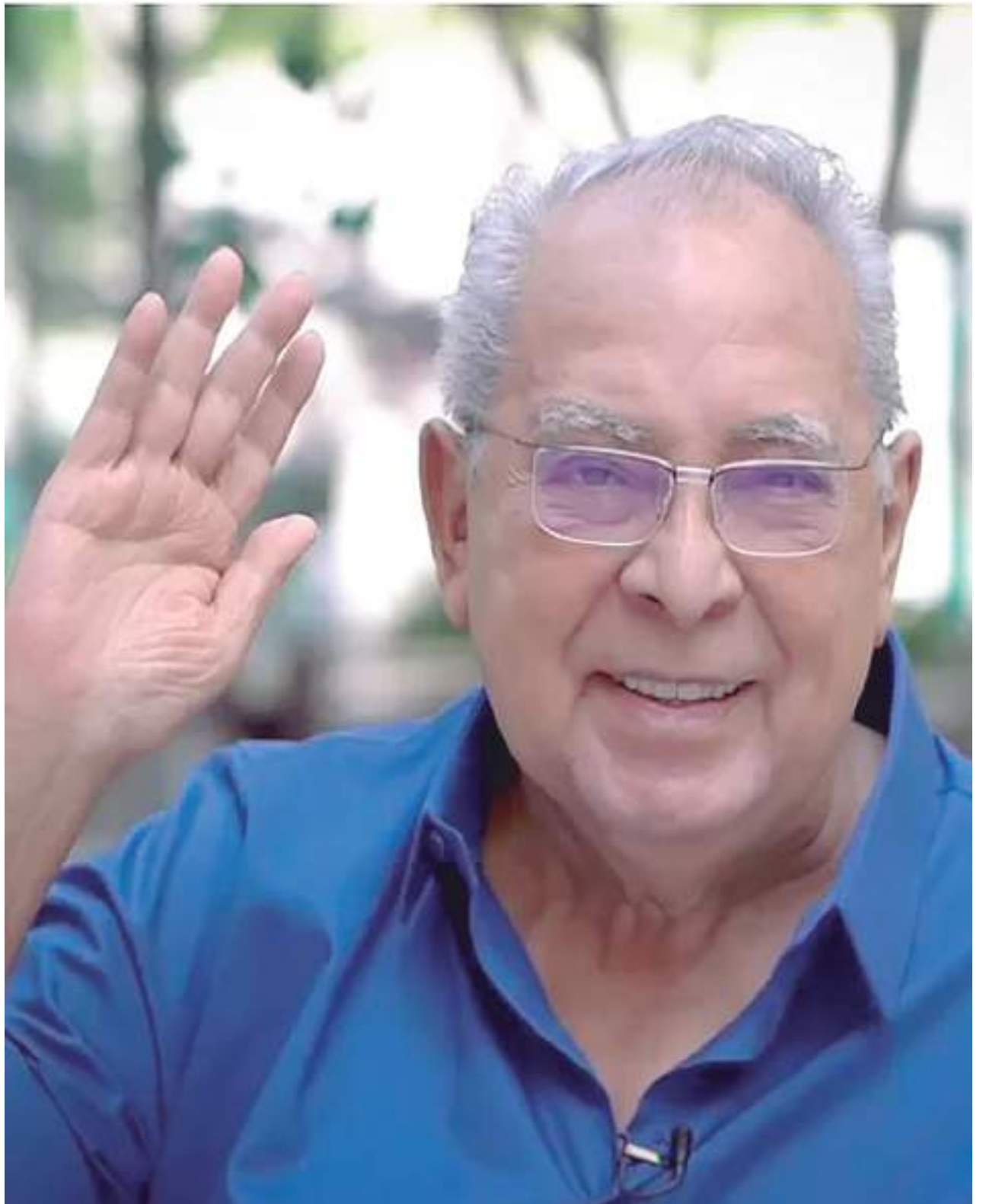
Amazonino Mendes havia sido diagnosticado com quadro de diverticulite e broncopneumonia

O ex-governador do Amazonas também foi diagnosticado com broncopneumonia. A doença acontece quando há a inflamação do pulmão por bactérias, fungos ou vírus.