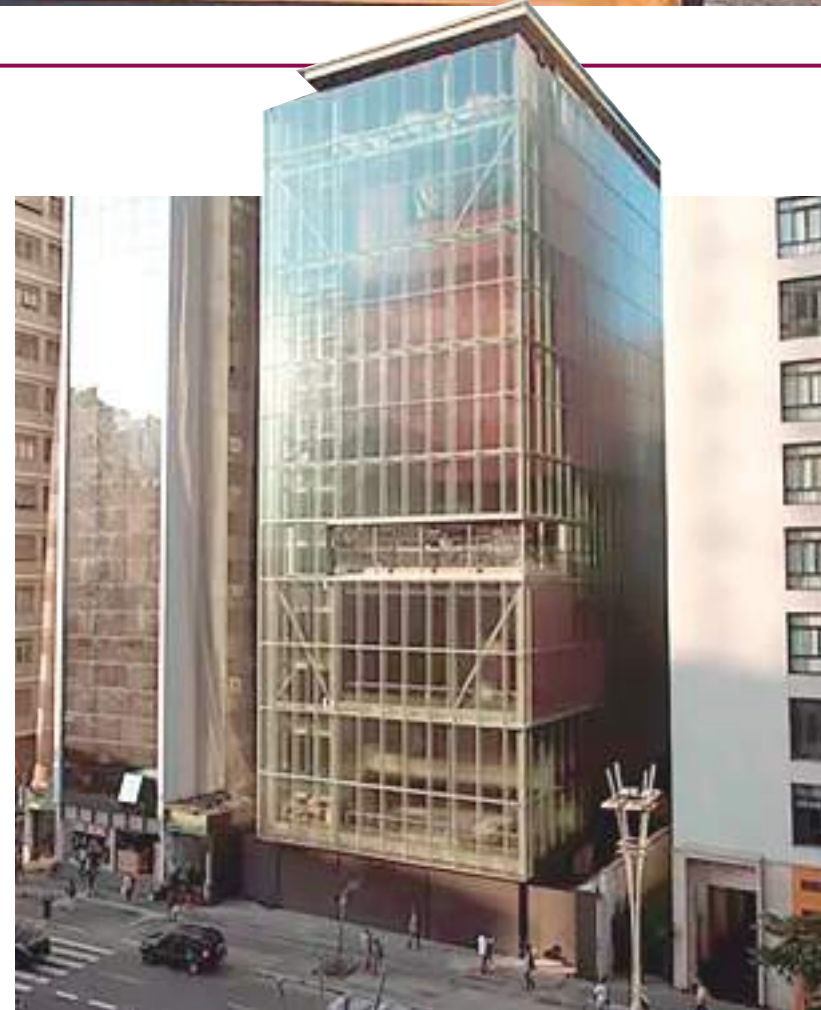
Sede do Instituto Moreira Salles, onde ocorre a exposição

Além da biblioteca, o local conta também com curtas-metragens projetados em uma tela e um mural composto por ilustrações e palavras em kuikuro (língua do grupo indígena que habita as aldeias Ipatse, Akuhugi e Lahatuá, no sul do Parque Indígena do Xingu - MT). Há mediadores disponíveis para conversar com o público e incentivar a fruição, leitura e interação, entre eles três indígenas – dois deles falantes de sua língua originária.