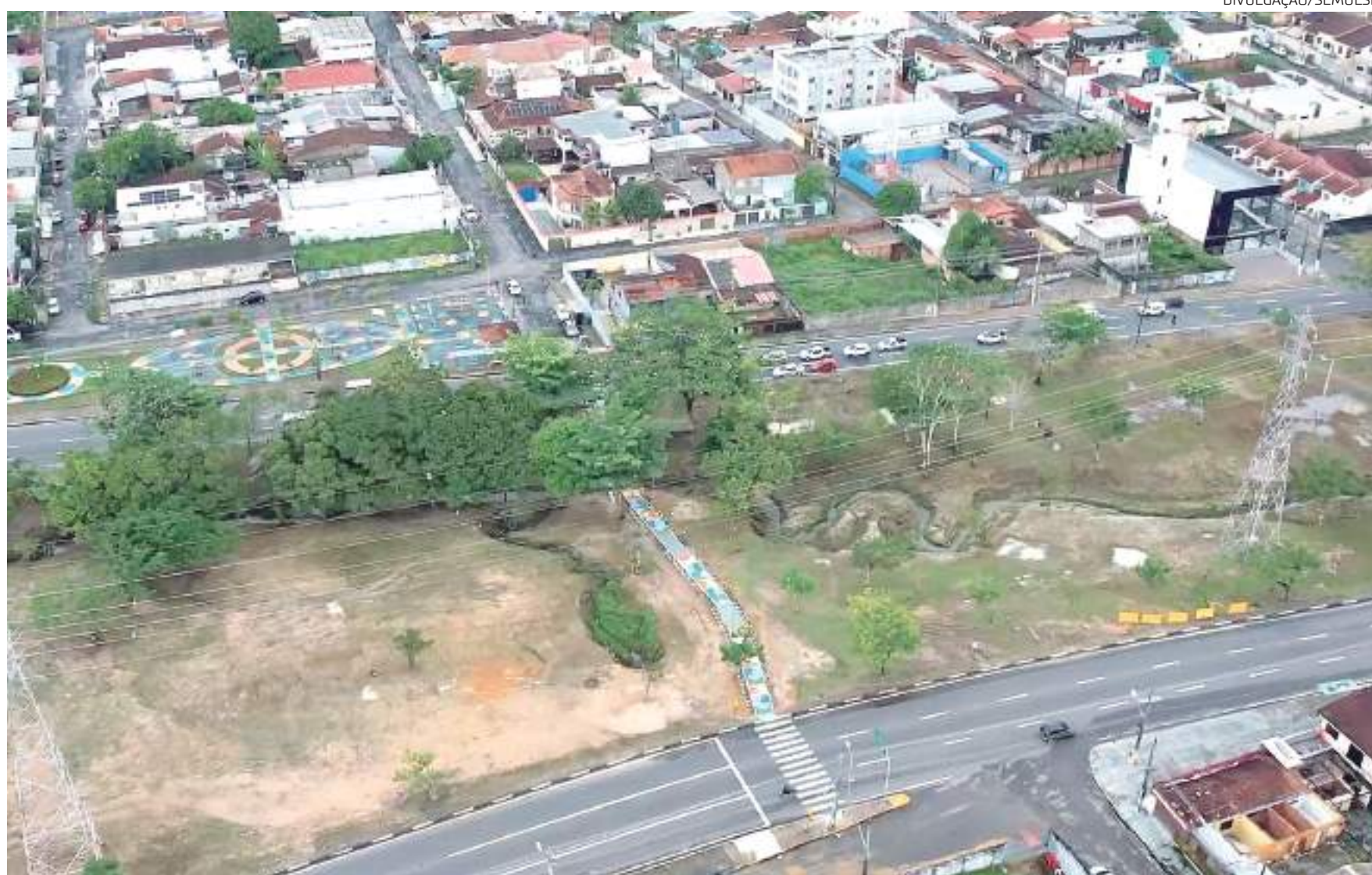
Ponte na Avenida das Torres, inaugurada ontem (12) pela Prefeitura de Manaus