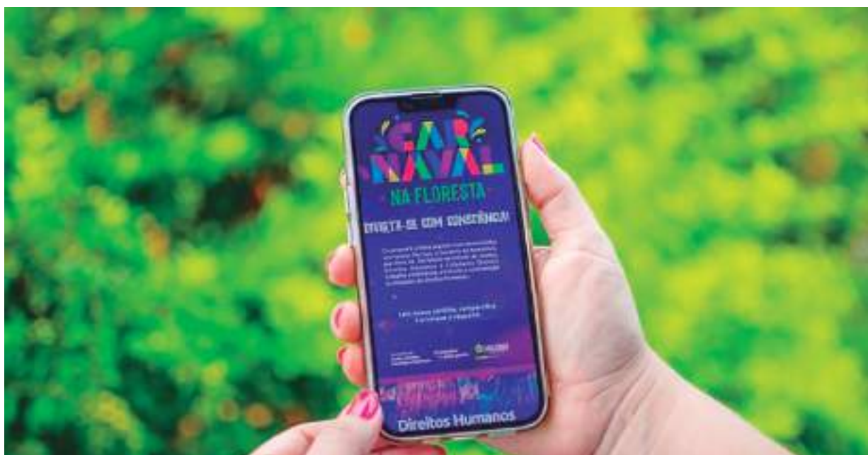
Cartilha digital sendo mostrada em celular