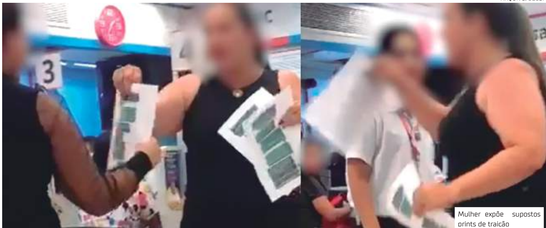
Mulher expõe supostos prints de traição

Nesse emaranhado de opiniões e avaliações sobre o outro nas redes sociais, o especialista pontuou que certos comportamentos da sociedade