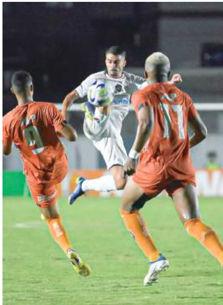
Gavião do Norte perdeu por 1 a 0 para o Camboriú-SC

Com 12 pontos na tabela, o Gavião do Norte chega nesta última rodada podendo terminar a primeira fase na segunda colocação, em caso de vitória. O Nacional, por sua vez, tem 10 pontos e está em quinto colocado, uma posição abaixo do Manaus.