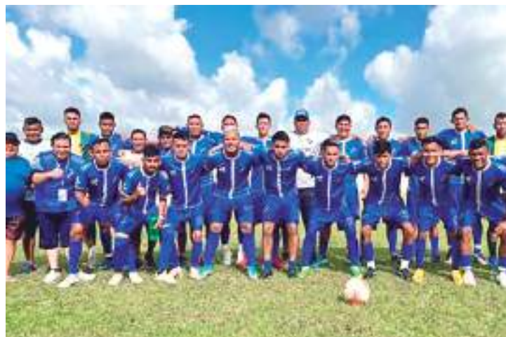
1º de Janeiro sagrou-se campeão e levantou a taça de 2023