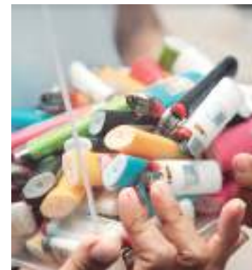
Projeto Chama Circular recicla isqueiros

As pessoas que desejarem ter um ponto de coleta no seu estabelecimento, independente do segmento em que atuam, podem se cadastrar no site https://chamacircular.com.br/ .