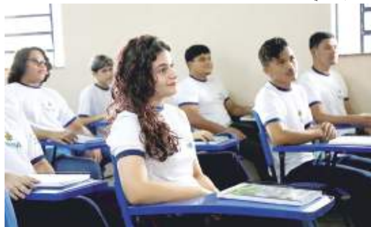
Alunos da rede estadual de ensino do Amazonas

“Essa prova tem questões diferentes do que o aluno está habituado a resolver na sala de aula. A maior parte dos problemas envolve o uso do raciocínio lógico. Por isso, é importante que professores e alunos se preparem para a realização, e resolver os exercícios das edições anteriores é sempre interessante”, aponta o docente.