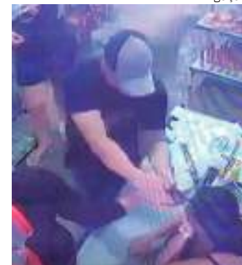
Homem tentar atirar cinco vezes contra esposa, mas a arma falha