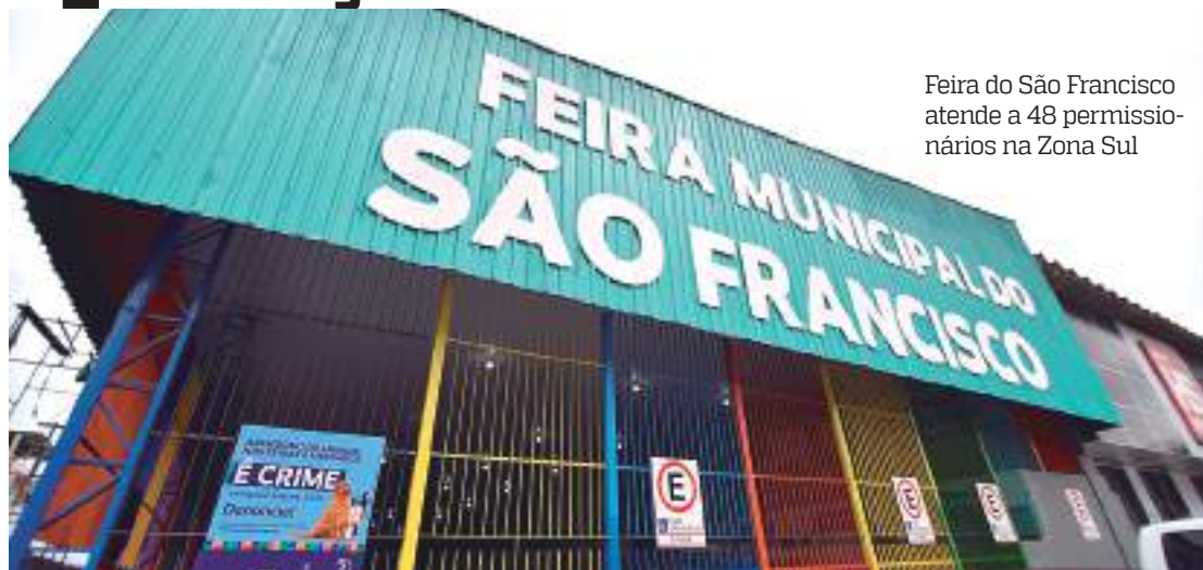
Feira do São Francisco atende a 48 permissionários na Zona Sul