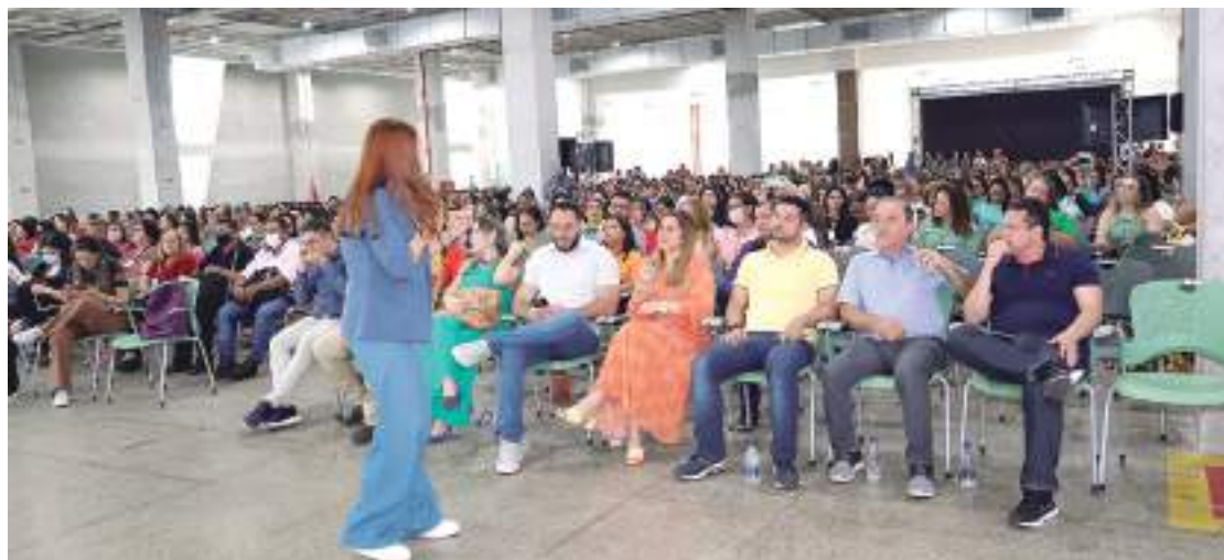
Palestrante discursa para educadores em evento da Semed

O último dia de palestras do “Seminário de Educação Inclusiva: Direito à Diversidade” ocorreu ontem (2), no Centro de Convenções do Amazonas Vasco Vasques, bairro Flores. O evento foi organizado pela Secretaria Municipal de Educação (Semed) com o objetivo de elevar ainda mais os índices da educação básica do município. Mais de 1.500 educadores que atuam na educação