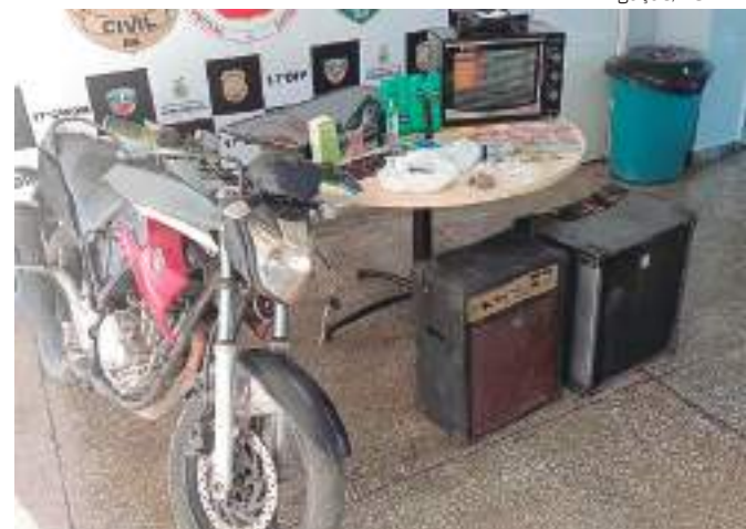
Foram apreendidos entorpecentes, balanças, dinheiro e diversos objetos penhorados

Ambos foram autuados em flagrante por tráfico de drogas e associação para o tráfico. Eles serão encaminhados à audiência de custódia e ficarão à disposição da Justiça.