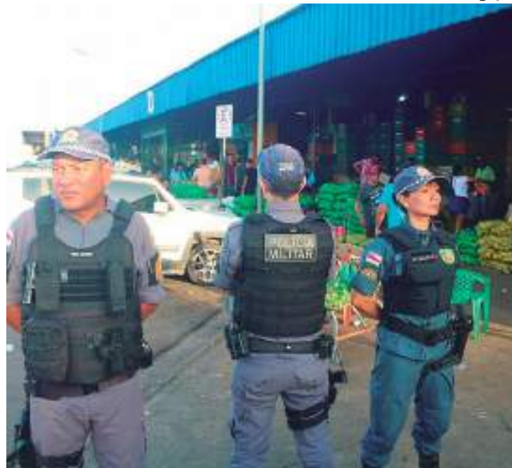
SSP-AM desencadeou grandes operações em Manaus e no interior

"Parabenizar nossa corporação e os nossos agentes da PMAM. O trabalho integrado com toda segurança Pública, que tem sido fundamental nesses índices de redução que têm sido alcançados. Conseguimos atingir essa meta de redução de 36% na capital, que segue a redução