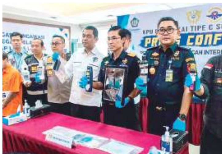
Policiais com frascos de shampoo onde encontraram cocaína

Um brasileiro de 26 anos foi preso na Indonésia com cocaína líquida e pode ser submetido à pena de morte.