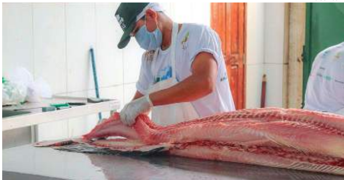
Trabalhador trata peixe na Feira do Pirarucu