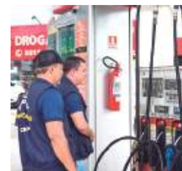
Equipe chegou a registrar o litro de gasolina vendido a R$ 6,49