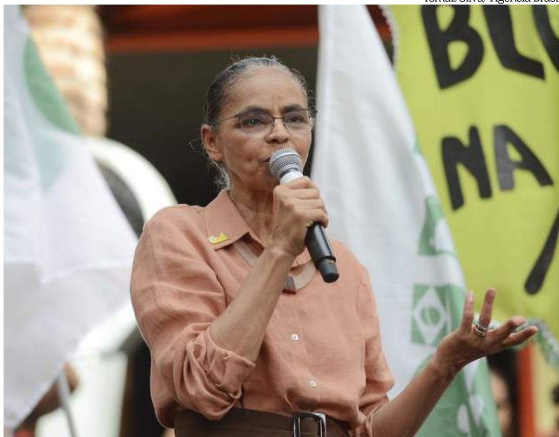
Ministra do Meio Ambiente e Mudança do Clima, Marina Silva

Centro Amazonense e Norte Amazonense o estado de emergência ambiental inicia em maio e