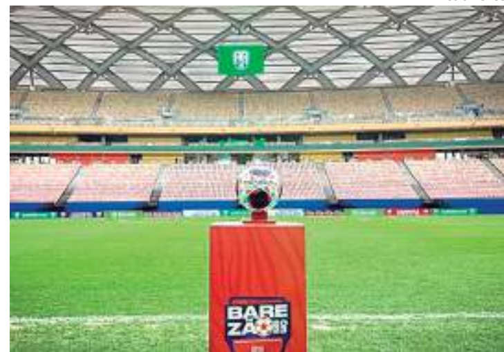
Preliminares do profissional serão com duelos do Sub-13

O Campeonato Amazonense Sub-13 2022 estava paralisado, devido às pendências no TJD. Após serem resolvidas, a nova diretoria da FAF, em reunião de Conselho Técnico, e os representantes dos clubes, decidiram pôr os jogos como preliminares do