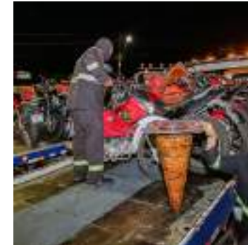
Operação fez a remoção de 141 motocicletas irregulares

Detran-AM, para o acionamento emergencial, a população deve ligar para o 190, o serviço oficial de chamadas da PMAM. Denúncias podem ser feitas pelo 181, o disk-denúncia da Secretaria de Segurança Pública (SSP-AM) e pelo e-mail da Ouvidoria da instituição (ouvidoria@detran.am.gov.br) ou pelo número (92) 3643-0022.