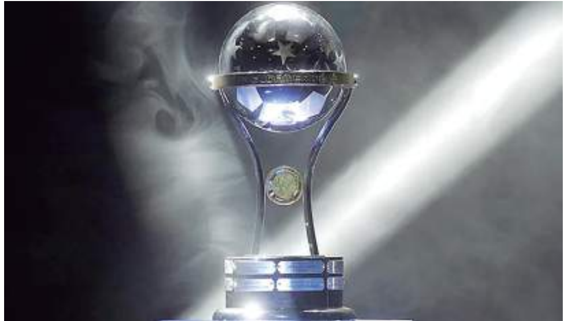
O troféu da Taça Sul-Americana. Torneio está de volta

A fase classificatória da Sul-Americana conta com 12 times garantidos, sendo seis brasileiros e seis