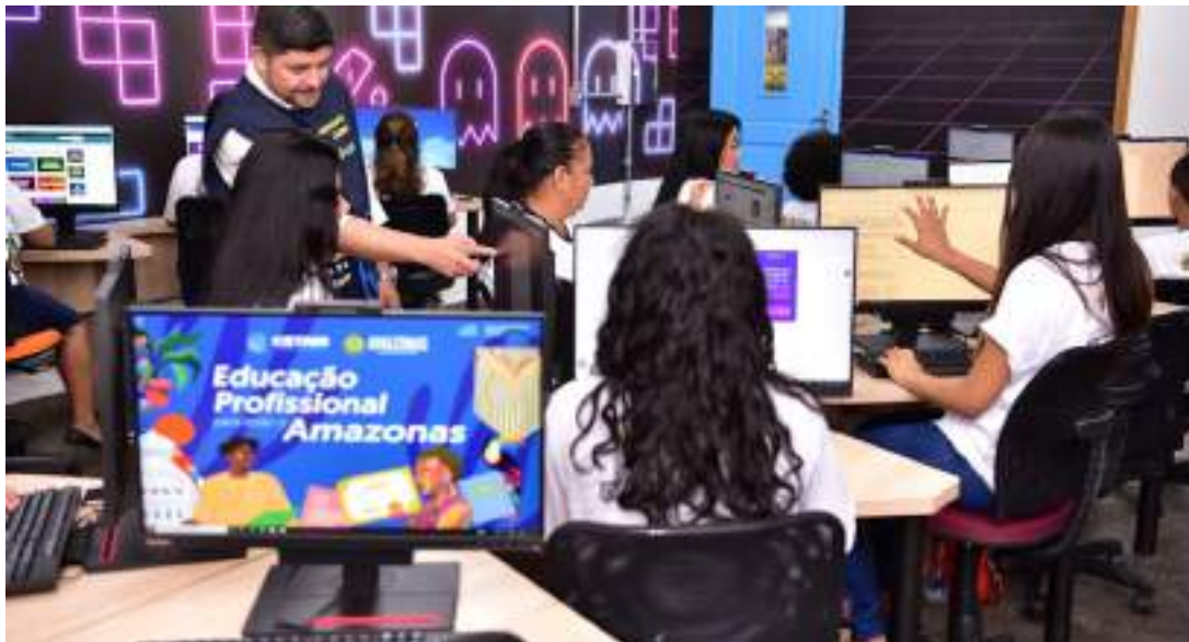
Cinco escolas da capital e sete núcleos descentralizados ofertam cursos técnicos

“Acredito muito na educação porque eu sou resultado da educação. A educação transformou minha vida e hoje eu trabalho para dar para os meus filhos, para dar aos jovens do estado do Amazonas as possibilidades que eu não tive quando era jovem”, afirmou o governador Wilson Lima.