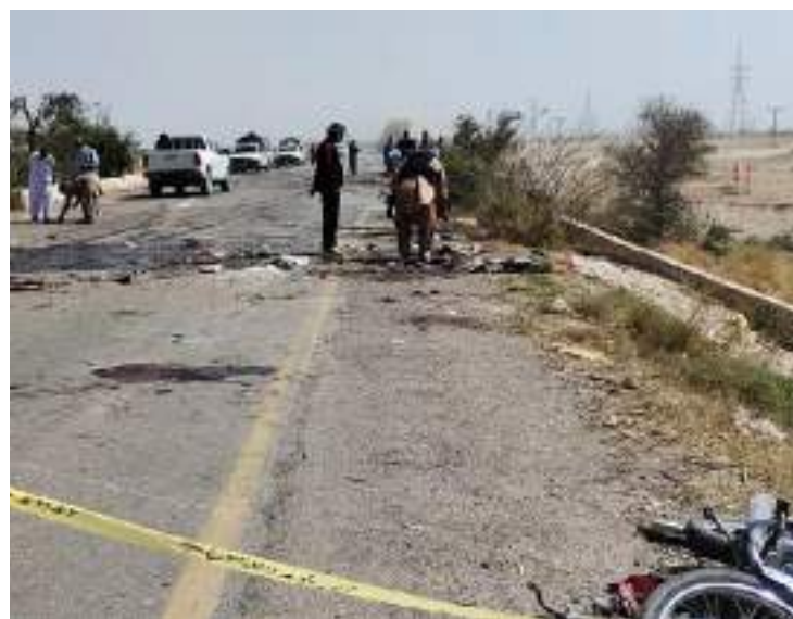
Destroços do atentado na cidade de Dhadar no sudoeste do Paquistão

Nove policiais morreram e 16 ficaram feridos em um atentado suicida, ontem (6), contra o caminhão em que viajavam por uma província do sudoeste do Paquistão, informaram as autoridades locais.