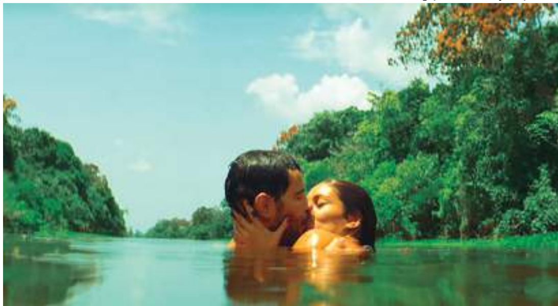
Atores Daniel de Oliveira e Sophie Charlotte protagonizam filme "O Rio do Desejo".

"Será muito comovente ver 'O Rio do Desejo' no Teatro Amazonas. Toda a equipe está ansiosa para assistir a obra no nosso maior símbolo arquitetônico", afirma o escritor amazonense Milton Hatoum sobre a exibição gratuita do filme, nesta terça-feira (07), às 20h. A obra é uma adaptação do livro de contos do escritor e é estrelada pelos atores Daniel de Oliveira e Sophie