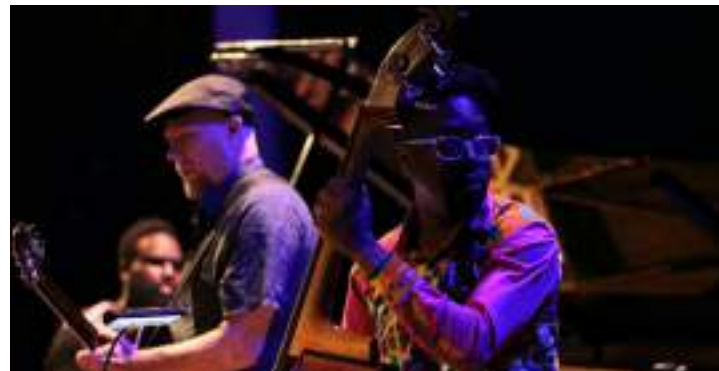
Músicos da Amazonas Band durante apresentação no Teatro Amazonas