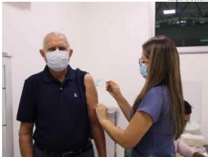
Idoso recebe vacina contra Covid-19

A Fundação Universidade Aberta da Terceira Idade (FUnATI), em parceria com a Prefeitura de Manaus, iniciou, nessa segunda-feira (07), a semana de imunização na Policlínica Gerontológica da FUnATI Darlinda Esteves Ribeiro. As doses estão sendo aplicadas durante toda essa semana, de segunda a sexta-feira (10), das 8h30 ao meio-dia, na policlínica localizada na avenida Brasil, bairro Santo Antônio, zona oeste da capital.