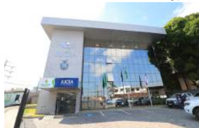
Sede da Jucea, no bairro Nossa Sra. das Graças