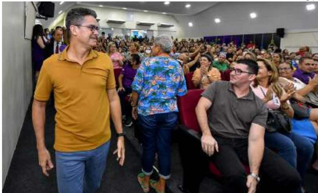
Prefeito de Manaus realizou o lançamento oficial do Programa Orçamento na Escola (Proesc) 2023

O aumento no investimento financeiro para as unidades de ensino será de 50%, saindo de R$ 10,2 mi-