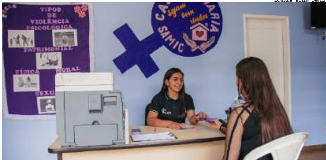
Mulher é atendida por serviço da Sejusc no interior do Amazonas

“Fui atendida na delegacia e orientada a vir aqui no Samic. A partir daqui, eu fui atendida pela assistente social, que me orientou, fui bem acolhida e ela conversou bastante comigo. Agora eu me encontro em uma situação bem melhor do que quando cheguei aqui. Hoje,