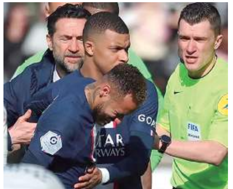
Neymar sofreu lesão recentemente e está fora da temporada